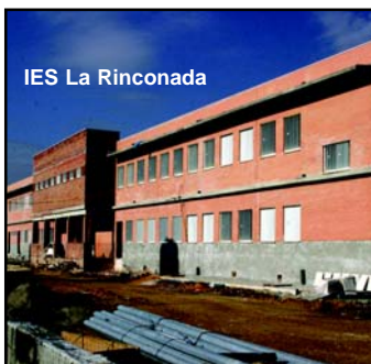
IES La Rinconada

El capítulo de bienestar social contempla iniciativas como la puesta en marcha de la residencia para mayores o la finalización de las obras de la piscina cubierta, mientras que en la agenda del medio ambiente destacan la apuesta