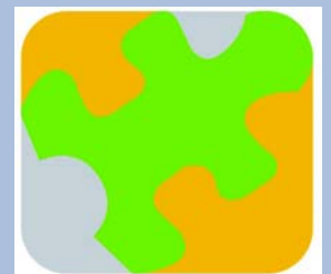
Cada pieza del puzzle cuenta. Tu opinión es importante.

A partir de ahora, se inicia la fase de recogida