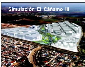
Simulación El Cañaño III