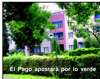
El Pago apostará por lo verde

Por último, la promoción del municipio como ciudad moderna, activa y emprendedora será otra de las piezas