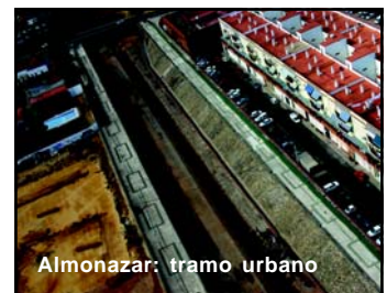
Almonazar: tramo urbano

Mención especial merecen los aproximadamente 7,6 millones de euros que Ayuntamiento y Junta consignan para la adquisición de suelo en el Pago del Medio así como los 2 millones de euros que el Consistorio transfiere a la Confederación Hidrográfica para la primera fase de trabajos en el arroyo Almonazar. En 2005, la transformación del cauce