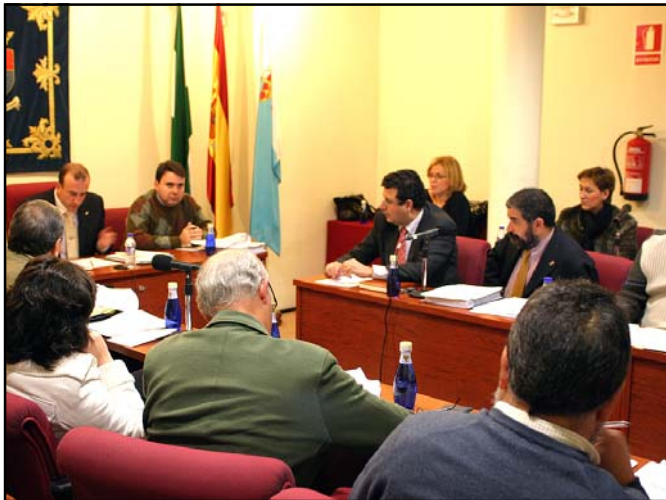
Imagen del pleno de aprobación de presupuestos.

En este sentido, el alcalde mantuvo la tónica de «sumar