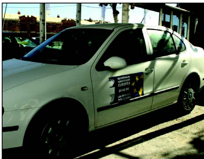
La publicidad institucional de los taxis recuerda la importancia que tiene participar en el próximo referéndum de Constitución Europea.

En La Rinconada, la campaña llega en forma de publicidad institucional en taxis, en Radio Rinconada y en este pe-