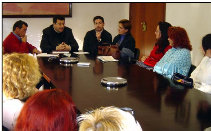
En la imagen, el primer teniente de alcalde y los delegados de Medio Ambiente, Derechos Sociales e Igualdad con las primeras beneficiarias del Plan de Choque municipal.

Desde las Concejalías de Igualdad y Derechos Sociales se ha puesto el acento en la «importancia social» de esta iniciativa anual. La medida está incluida en el Plan de Igualdad de Oportunidades,