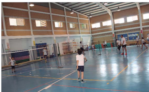
Las Escuelas Deportivas, el programa más longevo del Patronato.

En total se ofrecen más de 2.500 plazas repartidas en cerca de 40 modalidades -1.406 plazas ofertadas para niños/as, 1.032 para adultos y 150 para mayores-, muchas de ellas divididas en diferentes grupos en función de las edades, el nivel físico