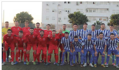
Ambas plantillas posaron juntas antes del comienzo del encuentro.