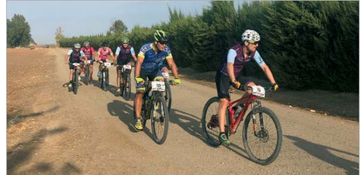
Los participantes cubrieron 10 kms neutralizados y 52 más competitivos. Los participantes demostraron la capacidad organizativa y la capacidad de trabajar junto al tejido asociativo, en este caso los clubes ciclistas, para poner al municipio en la cabeza de Andalucía". En este sentido, subrayó que "siempre estaremos al lado de nuestros clubes y sumaremos para que este tipo de eventos sean un éxito".