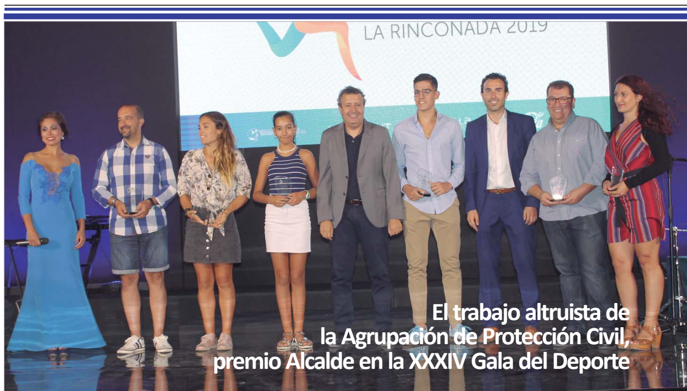
El trabajo altruista de la Agrupación de Protección Civil, premio Alcalde en la XXXIV Gala del Deporte