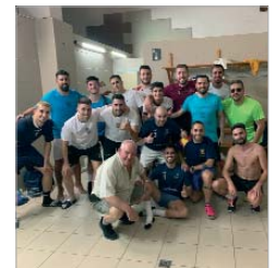
El vestuario del San José F.S.

El balón ha empezado a rodar en los entrenamientos del Tres Calles y el San José FS. En Tercera Nacional y en Tercera Andaluza, los equipos locales ya preparan el asalto a sus respectivos objetivos. Los rinconeros buscarán la permanencia y no pasar las 'fatiguitas' del año pasado, a la vez que foguear a su cantera en categoría Senior, en la misma categoría en la que participará, el otro equipo del municipio, el San José FS, aunque éste tendrá un objetivo mucho más ambicioso, buscando retornar a la categoría que perdió el año pasado. A ver que les depara el año.