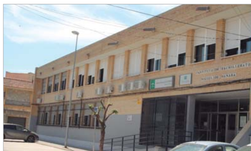
El IES Miguel de Mañara ha renovado su climatización.

El Ayuntamiento de la Rinconada ha llevado a cabo las actuaciones necesarias para la climatización de los cuatro IES de la localidad, para lo que ha destinado un total de 160.000 euros de fondos propios, que se dividen en 120.000 que implicaba la climatización en sí y 40.000 más que suponía la adecuación eléctrica de