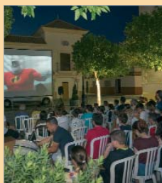
Cine en Plaza de España.