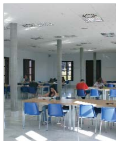
Sala Biblioteca Santa Cruz

Sumando las asistencias, en estos nuevos horarios hasta la medianoche de lunes a viernes y los fines de semana, han acudido más de 1700 estudiantes que han aprovechado la ampliación de los mismos que sumados al resto de las franjas horarias con el horario habitual de las Salas de Estudio, supera las