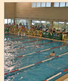
Imagen de la piscina cubierta.

El agua es también un excelente medio en el que llevar a cabo las terapias que se prestan desde el gabinete de medicina deportiva. En torno a 500 plazas disponibles distribuidas en las siguientes posibilidades: natación terapéutica para niños y niñas, hidroterapia infantil, matronatación y terapia post-parto. También se incluye en este medio centenar de plazas natación adap-