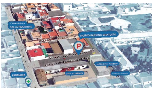
Imagen virtual de la zona una vez finalizadas las obras.