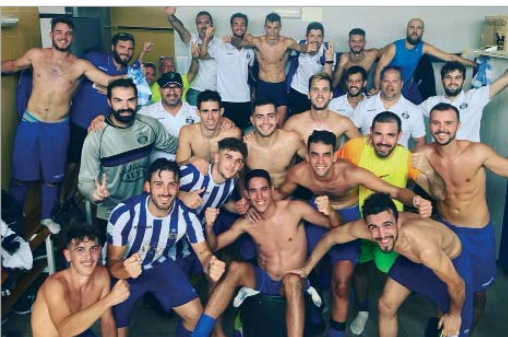
El vestuario del Rinconada celebra el triunfo ante el Pílas, el primero del año.