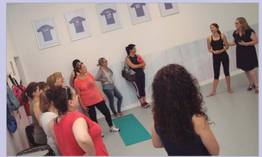
Una de las actividades de que ha constado el aula de verano.

Además, desde el área también se lanzaron dos propuestas al aire libre que reunió a una veintena de mujeres