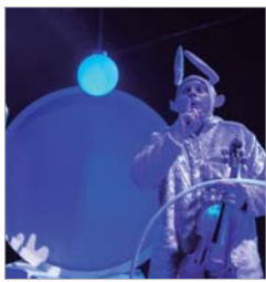
NEÓN. Truca Circus

El Centro Cultural de La Villa se convierte en los próximos meses en el epicentro de las artes escénicas, de la cultura en el municipio y en torno