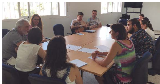
El voluntariado del área de Juventud es uno de sus principales activos.

Pero más allá de esta labor mediadora de asignación de personas a programas de voluntariado, este servicio