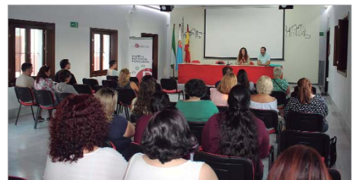
Nueva edición de 'La Rinconada, Punto de Encuentro Empresarial'.