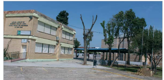
El CEIP Nuestra Señora de Patrocinio (PÚA) será remodelado.