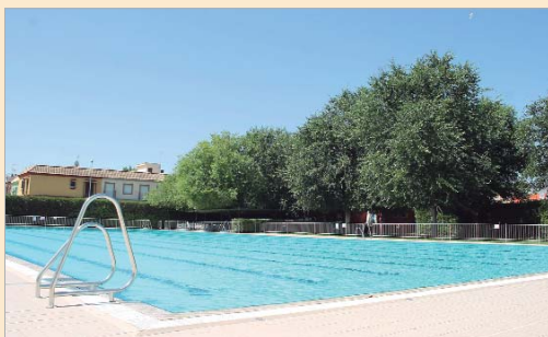
Imagen de la piscina de verano del 'Castañita'.

Los datos ofrecidos por el Patronato recogen el número de bañistas después de los cambios establecidos con precio único de 2,5 euros para los días laborables