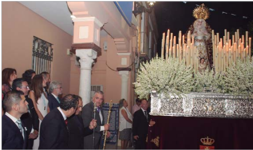
Saludo institucional al paso de la procesión por el Ayuntamiento.