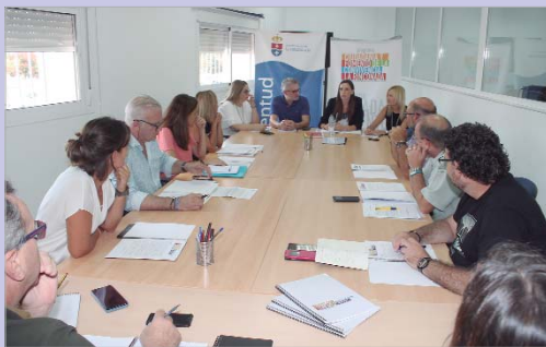
El Ayuntamiento presentó el programa a los directores de los centros.

relaciones sanas. Las líneas tres y cuatro están orientadas al alumnado de Educación Secundaria: Prevención de Conductas de Riesgo, con talleres sobre redes sociales, prevención de conductas de adicción, gestión de conductas de riesgo, información sobre el consumo de cachimba y un encuentro con jóvenes del Centro Penitenciario de Huelva; e Igualdad, línea dentro de la que están los talleres de interculturalidad y racismo, LGTBIQ+ y promoción de la igualdad de género. Tras cerrar el primer trimestre del pasado curso 2018/2019 con 402 horas de formación en 19 acciones repartidas, alcanzando a más de 7.000 jóvenes, El Programa de Ciudadanía y Fomento de la Convivencia presenta su programación un curso más a los centros educativos de La Rinconada. Los centros educativos tienen hasta el 27 de septiembre para entregar la ficha de participación en el Área de Juventud y así acogerse a este programa, indicando las líneas en las que estén interesados impartir en sus aulas.