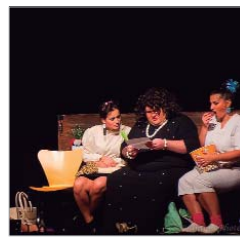
Un momento de la obra.

En un marco incomparable, junto a la ribera del Jerte, New Boom Culture abrió el concurso el pasado viernes día 2 de agosto con su obra 'A todo cerdo le llega su San Martín'. Las otras compañías seleccionadas al