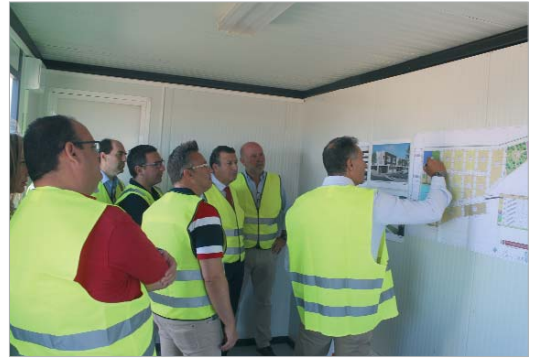
El alcalde observa el plano de la futura urbanización de Las Ventillas.

En la actualidad, una parte del arroyo Las Pavas ya está soterrado y se han llevado a cabo urbaniza-