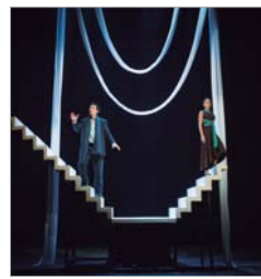
ASÍ QUE PASEN CINCO AÑOS. Atalaya

musical. El día 11, Kulunka Teatro representa 'Solitudes', que ostenta los premios Max 2018 al Mejor Espectáculo de Teatro y a la Mejor Composición Musical. Se trata del segundo montaje de la compañía, tras el exitoso 'André y Dorine'. Una historia emotiva que habla de la soledad y las soledades, de la amargura de no ser comprendido, y de la amargura de comprender cuando ya es tarde.