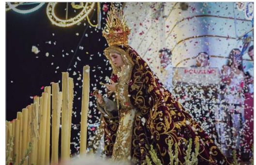
Petalada a la Virgen de los Dolores, Patrona de La Rinconada.