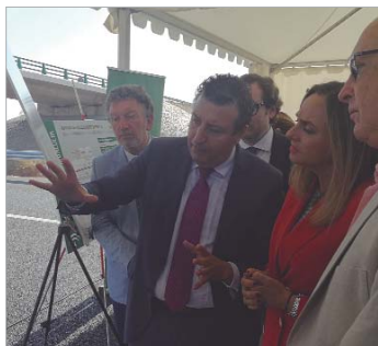
El alcalde enseña las obras en el plano.