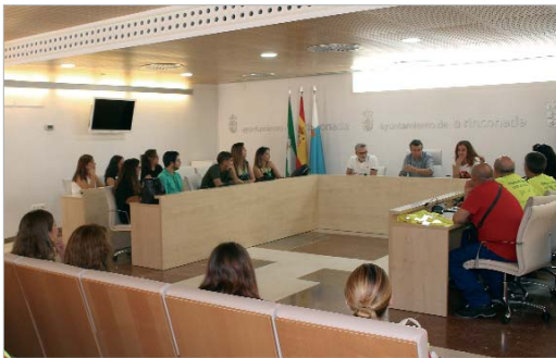
El alcalde, Javier Fernández, recibe a los beneficiarios del programa Emple@.

El Consistorio pone en marcha numerosos programas para la creación de puestos de trabajo e impulsa la inserción laboral con acciones formativas en ocupaciones con alta demanda