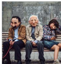
SOLITUDES. Kulunka Teatro