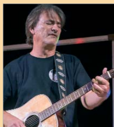
'Lobo y los Raiders'.

De esta manera, la programación de la Hacienda Encantada con diez propuestas culturales y una exposición fotográfica durante dos semanas de julio, movilizó a un nutrido público que se saldó con una media de 150 espec-