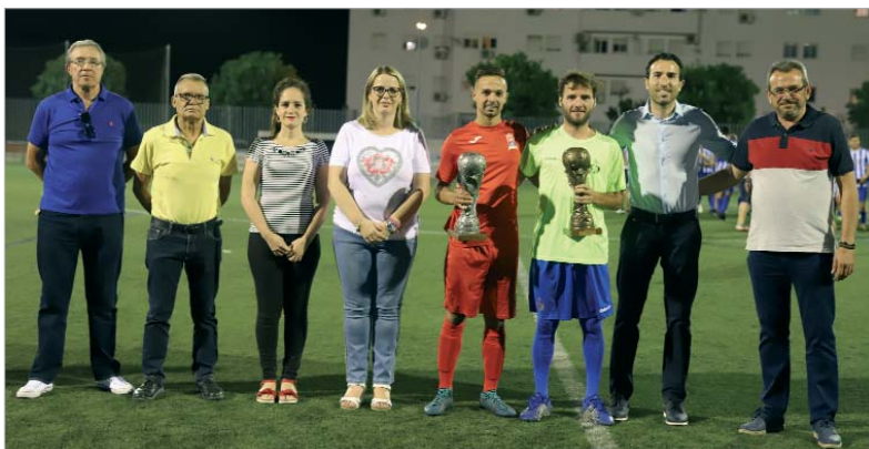
Foto de familia con los capitanes de ambos equipos tras la entrega de trofeos junto a los ediles municipales.