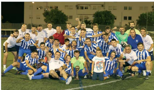
La plantilla del Rinconada celebra la consecución del XII Trofeo.

Rinconada y San José se veían las caras en el tradicional trofeo veraniego de la radio, que sumaba su duodécima edición y que, aun celebrándose un par de semanas antes de lo habitual, dejó un intenso colorido en las gradas del Nuevo Leonardo Ramos, con personas de ambos núcleos animando a sus equipos.