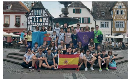
Los integrantes de la Escuela de Música, en Alemania.

Ya en el mes de junio, las chicas y los chicos de la Escuela de Hambach visitaron el municipio de La Rinconada, para participar junto a su escuela hermana, en la