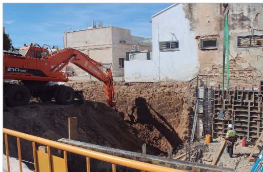
El Centro Cívico Los Silos ha comenzado sus obras de ejecución.

se ubicará el vestíbulo, ascensor adaptado, aseos y salón de actos y sala polivalente, que pueden usarse por separado o de forma conjunta y que tendrán una capacidad total de 90 plazas. En el sótano habrá una sala multifuncional que podrá usarse para exposiciones de arte en diferentes modalidades, trabajos vecinales, proyecciones, taller de manualidades, entre otras cosas. Por último, en la primera planta se localizan tres aulas y un almacén y una escalera secundaria que supone una salida de emergencia del edificio. En el castillete se colocará una estructura auxiliar que favorezca el anidamiento de cigüeñas. Una vez finalizado la superficie será cercana a los 1.000 metros cuadrados. Este edificio cumplirá la normativa en cuanto a sostenibilidad ambiental y social, así como eficiencia energética.