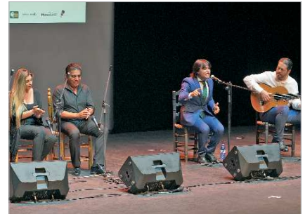
El certamen, plenamente consolidado, trabaja ya en su 37ª edición.