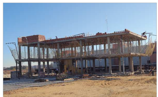
El Parque de Bomberos completa la 'Ciudad de la Seguridad'.