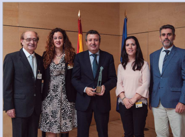
La delegación de La Rinconada, con su galardón.