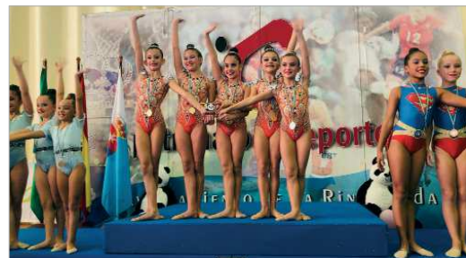
El equipo Benjamín de Copa, primer clasificado en su categoría.

La última novedad fue la presentación de la nueva mascota del Club Oso Panda que, haciendo honor a su nombre, se trata de un Oso Panda Gigante que hizo las delicias de los presentes y fue de los más buscados a la hora de fotografiarse con él. Ahora, el club tiene previsto organizar un concurso entre toda su nutrida cantera para buscarle un nombre, así que la diversión, la educación y el deporte, siguen asegurados.