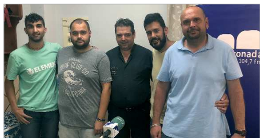
El equipo de deportes de la Tertulia Deportiva, en 'Casa Funes'.

La 'Tertulia Deportiva' de Radio Rinconada ha vuelto a las ondas con nueva ubicación. Esta temporada, el programa se emitirá desde 'Casa Funes', un clásico de La Rinconada en el núcleo de San José que pondrá mesa y mantel al debate de los diferentes clubes deporti-