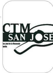
San José Tenis de Mesa