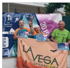
Los integrantes del Club La Vega.

De la mar a la montaña, así podría definirse la Ultra Travesía de Resistencia de Ubrique. La