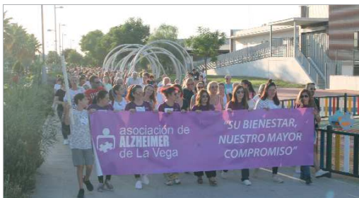
Numerosos colectivos se volcaron con la concienciación respecto a la enfermedad.

Santiago hasta el apeadero de El Cañamo, desde donde subió por Avenida de Portugal hasta la Avenida Jardín de Las Delicias hasta alcanzar la calle alcalde Pepe Iglesias y, desde Cultura, acceder al parque de Los Pintores, donde finalizó el recorrido con la lectura de un manifiesto, una suelta de globos y el sorteo de una bicideta.