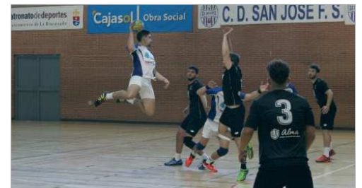
El Balonmano San José mostró su mejor cara en Lebrija.

El Balonmano San José se ha estrenado con victoria ante el Viso y comienza así su nueva andadura para ascender y recuperar la categoría perdida el año pasado, o lo que es lo mismo, volver a Nacional. Este año, con la disolución del Balonmano La Vega, el San José tiene una cartera de jugadores más amplia, por lo que podría decirse que existen los