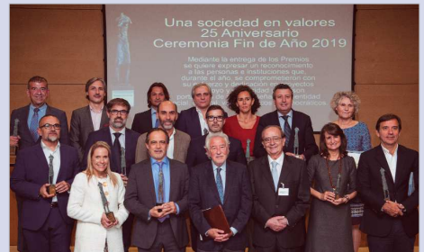
Foto de familia con las administraciones y empresas premiadas.