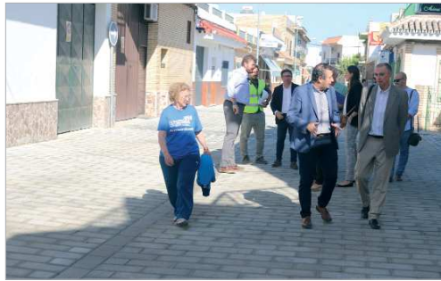
La comitiva comprueba in situ la peatonalización de Virgen de Gracia.