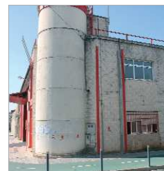
Lugar del nuevo Centro Deportivo.

Cerrando el acto y siendo propio del espíritu universitario, la Coral Virgen de las Nieves entonó el himno de la Universidad de Sevilla, Gaudeamus Igitur.