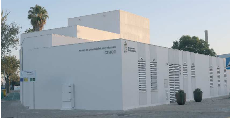
Vista exterior del nuevo Centro de Artes Escénicas y Visuales de La Rinconada.

Este nuevo edificio cuenta con una superficie de 330 metros cuadrados y en él se han invertido en torno a 400.000 euros provenientes del PER y de aportación municipal con fondos propios. Acoge un espacio escénico de más de 100 metros cuadrados y 9 de altura para la exhibición de trabajos y propuestas artísticas