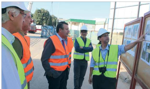
El primer edil conoce el desarrollo de las obras a través de sus responsables.

Las obras consolidarán una estructura que es singular y única en Andalucía, según los expertos.