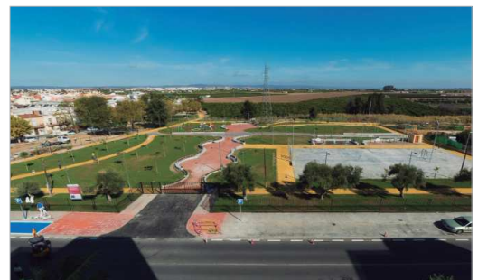
Vista aérea del parque Lomas del Charco que muestra su imagen acabada.