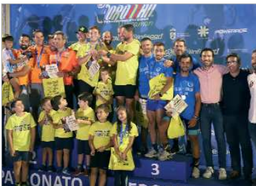
Podium por equipos, con triunfo del 'Ánimo Team'.