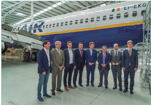
Presentación del nuevo centro de mantenimiento de Ryanair.