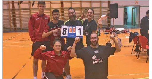
Los jugadores del Rinconada celebran el triunfo en Arjonilla.