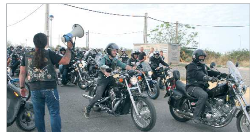
Más de 300 participantes celebraron en ruta los 25 años de la Peña Motera.