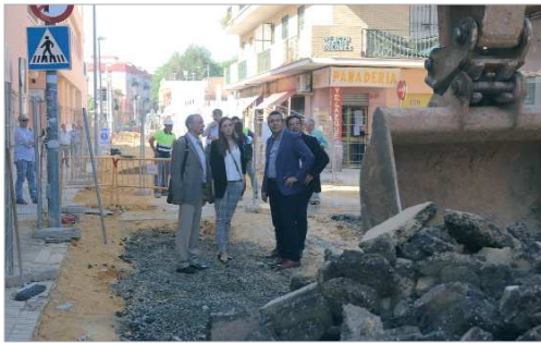
Javier Fernández visitó las obras junto al consejero delegado de Emasesa.

Fernández ha comentado durante la visita que "La Rinconada está en continua evolución, avanzando siempre para ser más moderna y accesible, atendiendo tanto a la movilidad, la estética y la calidad de vida de los vecinos y vecinas". En este momento, continuó, "se está trabajando en el entorno de Manuel de Rodas y una vez concluidas las obras cambiará la fisionomía del entorno, con la plataforma única y la peatonalización de Virgen de Gracia que, dentro de un plan integral diseñado para la zona, supondrá también un impulso para el comercio y un desahogo para los conductores, que encontrarán una nueva bolsa de aparcamiento más amplia y directamente conectada con la vía en cuestión".