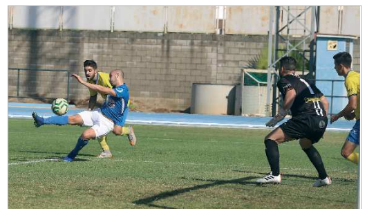
Lobo remata el balón de su primer gol ante el Ciudad Jardín.

esa imagen se traslada al campo. Goleada al Cabecense, uno de los aspirantes derrotada en Espiel, dando la cara, embotellando a su rival y con una actuación arbitral que dejó bastante que desear y que, en estos casos, también es un factor que hay