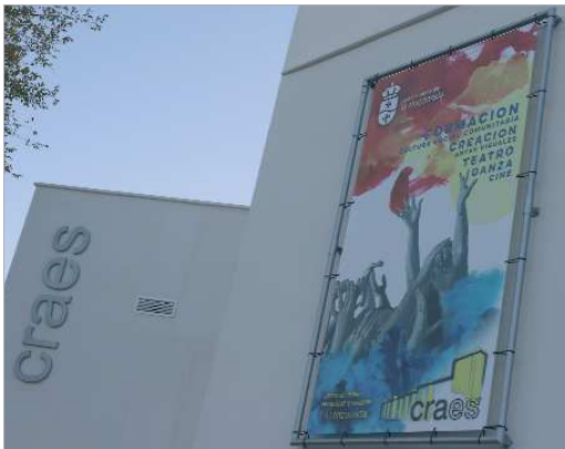
Un cartel conmemorativo preside la fachada lateral del nuevo edificio.