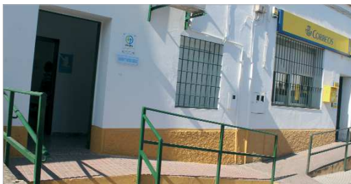
El nuevo Punto de Atención Ciudadana de Emasesa en La Rinconada.

al respecto que "este nuevo servicio mejora la comodidad de los vecinos y vecinas del núcleo de La Rinconada, que no tendrán que desplazarse cuando necesiten realizar cualquier tipo de gestión".