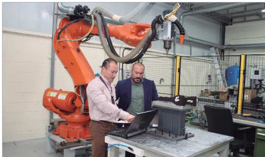
Desde su sede en El Cáñamo, TRC tiene presencia en mercados internacionales.

La empresa local especialista en materiales compuestos es todo un caso de éxito empresarial que a lo largo de su nacimiento desde 1998 en el vivero de empresas de La Rinconada, ha logrado ocupar puestos destacados en empresas de su sector dentro y fuera de España