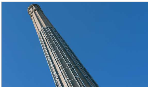
La Torre del Cñamo forma parte del skyline de la localidad.