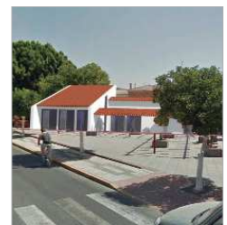
Así será la Casa del Flamenco.