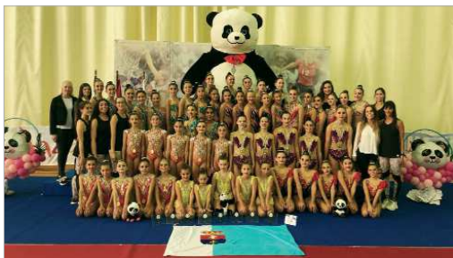
Foto de familia con todas las integrantes del Oso Panda Rinconada.

La XXI edición trajo a 400 gimnastas al Agustín Andrade, repartidos en 27 clubes de toda la Comunidad Autónoma, con un total de 70 conjuntos y siete individuales