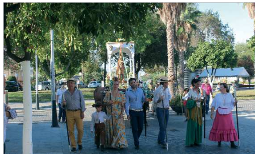
La procesión de los romeros hacia 'El Toril' dejó bellas estampas.

Finalizada la misa, la imagen de San Isidro era trasladada a la carreta exornada con coloridas flores para recorrer algunas calles. Cabe destacar que este año y gracias al esfuerzo de la anterior Junta de Gobierno, San Isidro estrena carreta propia engalanada con los enseres que la hermandad del Cristo del Perdón cede en un día tan especial. La primera parada