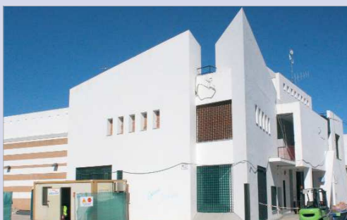
Vista exterior de la fachada del Centro Cultural Antonio Gala.

La Rinconada está muy por encima de la media de la provincia en lo que a espacios verdes se refiere. Estas zonas de esparcimiento, daros indicadores de calidad de vida y compromiso medioambiental.