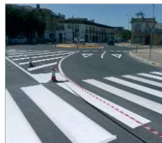
Repintado y rotonda en fondo.

se desarrolla en estos momentos en La Rinconada en Pintura Industrial, a través de uno de los módulos que lo componen, la señalética viaria, por lo que han procedido al repintado de los distintos pasos de peatones que se sitúan desde Casa del Peón hasta Vereda de Chapatales.