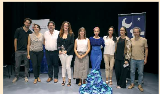
Foto de familia con el profesorado del quinto Proyecto Flamenco del Laffón.