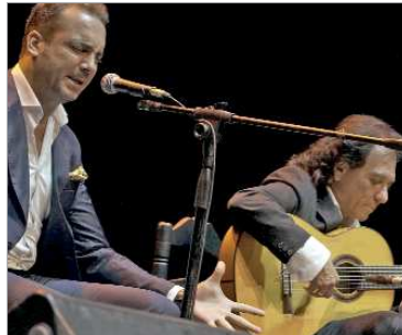
Un cartel de auténtico lujo acompañó esta edición.