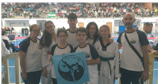
Los integrantes del club Ditaie en Lepe durante la Copa Federación.

El Club Ditaie de Taekwondo comenzó la temporada con la disputa en Lepe (Huelva) de la Copa