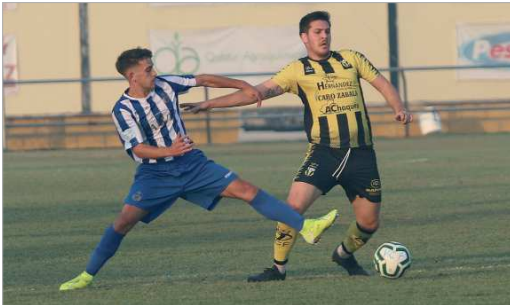
El Rinconada remontó al Villafranco, pero terminó perdiendo por 3-2.