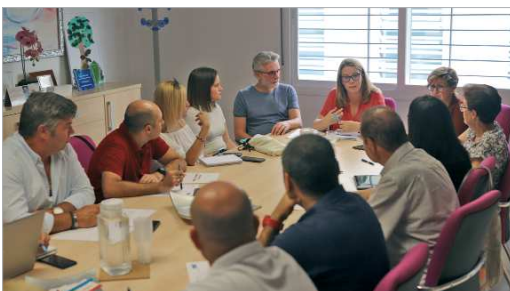
Los responsables de los departamentos municipales durante la reunión.