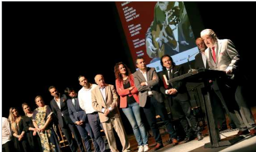
Homenaje a Rafael Riqueni en el 36 Festival Flamenco 'El Búcaro'.

Noche de soleares, seguidillas, bulerías, malagueñas, tangos, granainas y fandangos que vuelven a marcar un hito importante en la vida de un festival que ya trabaja en la 37ª edición