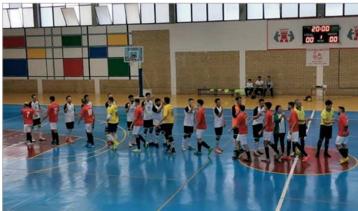
En su segundo partido, el San José FS ganó en Osuna 6-7.