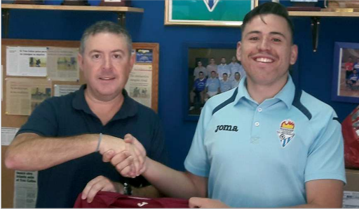
El Tres Calles espera cuajar una buena temporada en Tercera Nacional.