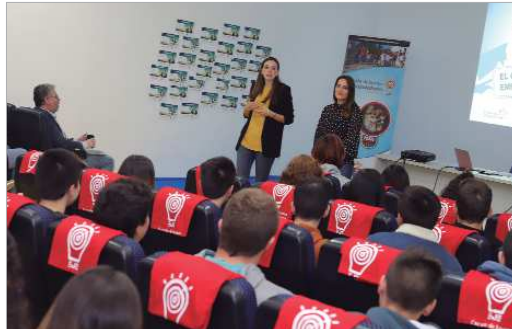
La delegada de Juventud dio la bienvenida a los participantes en la Escuela.