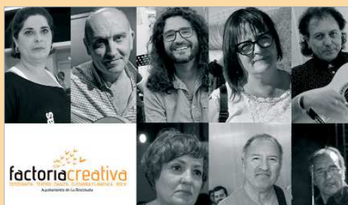
Factoría Creativa, el programa cultural más longevo de La Rinconada.