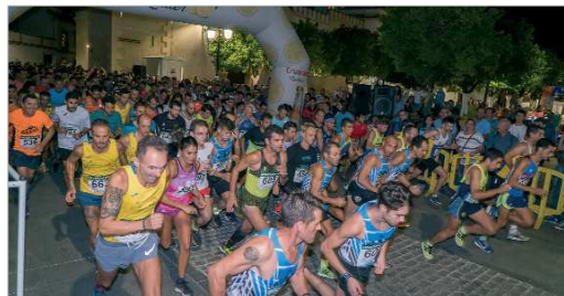
500 participantes tomaron la salida en la XII Carrera Nocturna.