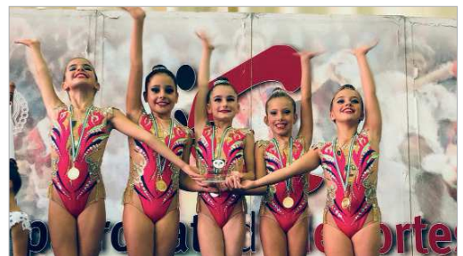
El conjunto Alevín de Base se llevó el primer puesto en su categoría.