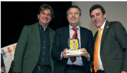
Uno de los premios a la 'Excelencia Social' de La Rinconada.