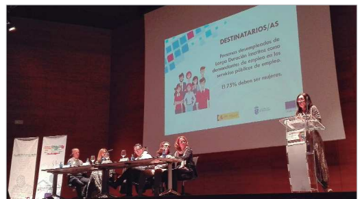
La Rinconada participó en la Red Metropolitana de Empleo e Inclusión Social.