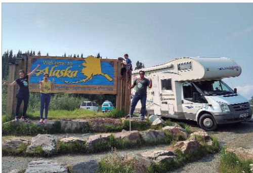
La familia viajera de La Rinconada llegó hasta la frontera de Alaska.