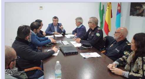
Imagen de la reunión para coordinar la seguridad durante la Navidad.

Todos ellos han coincidido en recalcar que "los días festivos implican una mayor demanda de los servicios públicos y, por ello, hemos realizado un plan especial para coordinar la seguridad durante las actividades previstas en Navidad, a la vez que recordar la normativa municipal vigente en cuanto a la celebración de fiestas".