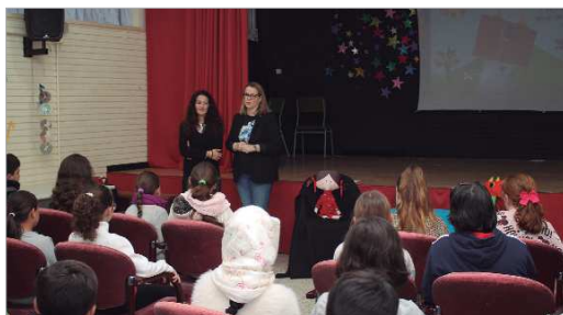
La coeducación es uno de los principales actuaciones para la igualdad.

El escenario del Centro Cultural de la Villa, igualmente acogía la representación de la obra "Play Off" de La Joven Compañía en la que siete actrices reflexionan sobre los obstáculos que las mujeres se encuentran en su camino hacia la Igualdad con el ámbito deportivo como punto de partida.