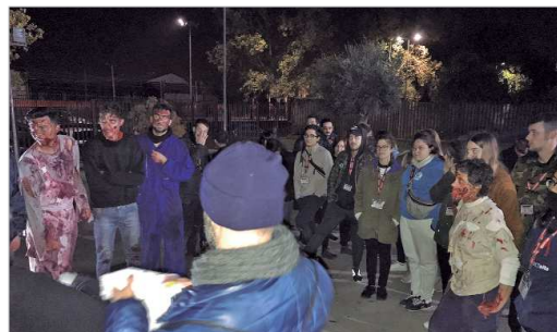
Muchos jóvenes tomaron parte en el Escape Zombi de La Rinconada.

Durante toda la noche, diferentes escenarios de la localidad iban recibiendo a los participantes: el Centro Joven La Estación; el parque Dehesa Boyal; parque Miguel de Mañara; comerciales de La Paz o el tramo 2 del Almonazar eran alguno de esos pun-