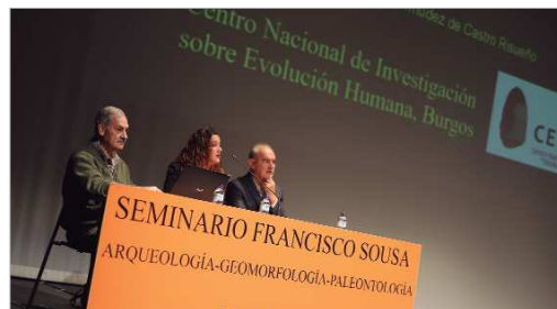
Presentación de la vigésima edición del Seminario 'Francisco Sousa'.