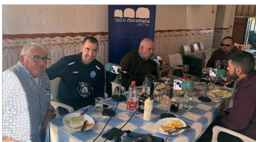
Los integrantes del Club Deportivo San José Fútbol Sala, en Casa Funes.

La temporada sigue su curso y nuevos invitados desembarcan cada miércoles en las ondas del 104.7 para, desde Casa Funes, analizar la actualidad deportiva en múltiples aspectos y desde distintas perspectivas.