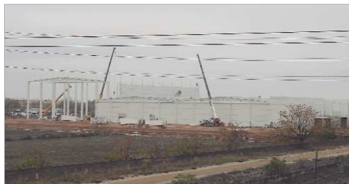
Herba construye el Centro Agroalimentario del Arroz en La Rinconada.