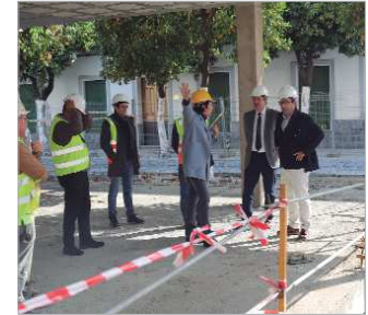
Imagen de las obras que darán lugar al nuevo Centro Cívico 'Los Silos'.

'Los Silos' se ubica en la calle Manuel de Rodas, una zona en la que se está llevando a cabo, paralelamente a la construcción del nuevo centro cívico, una