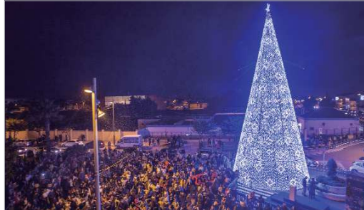
En esta edición, habrá dos árboles gigantes adornarán el municipio.

Durante el evento, se celebrará también dos grandes nevadas y se podrá disfrutar de actividades