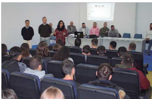
Encuentro con reclusos en el Centro Joven 'La Estación'.