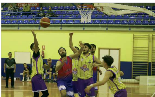
Imagen del último duelo en casa ante el Paradas que finalizó con victoria.

El Club Baloncesto La Vega perdía en su último envite, jugado en Utrera, por 55-45, lo que hace que los rinconeros, que debían ganar para intentar ser primeros de grupo en Segunda Provincial, finalicen la primera fase en segundo lugar. Ahora, en la segunda fase, se medirá a los segundos clasificados de los seis grupos restantes de la categoría. Esto es, Puebla, Ciudad de Dos Hermanas, Unión de Gilena, Lora, Tartessos Lebrija y Gelves Verde.