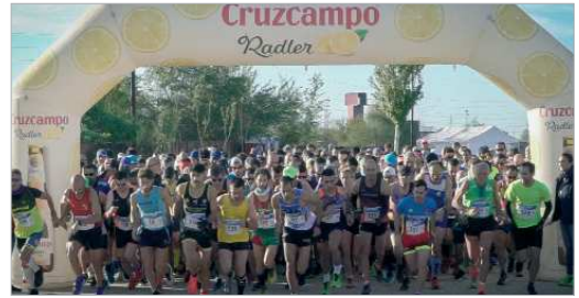
Más de 350 participantes tomaron la salida en la II Media Maratón.