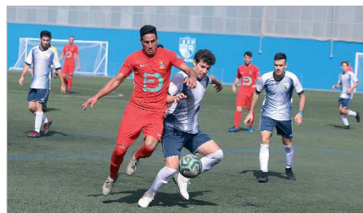
Imagen del Alcalá-San José, último partido de Maldonado en el banquillo.

De momento, el preparador va a hacer un análisis de los efectivos de los que dispone y, después, abordará con la directiva la necesidad de acudir al mercado, si así lo estima oportuno.