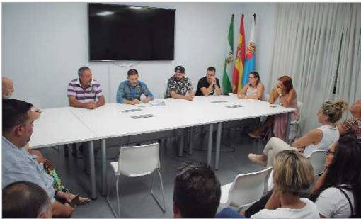
Una de las reuniones mantenidas por la 'Mesa del Carnaval'.

Se incrementan todos los premios económicos en 250 euros, salvo la 'Mejor Copla a La Rinconada', que sube en 300 euros como respaldo al apoyo identitario del certamen. El Dios o la Diosa elegida no tendrá que presentar el Concurso de Agrupaciones