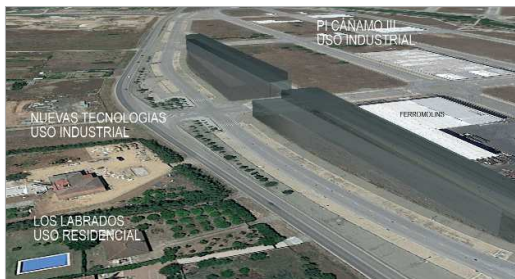
Imagen virtual proyectada de cómo serían los lofts.

Por otro lado, esta misma modificación 23 del PGOU, también regula los apartamentos turísticos y en el Ayuntamiento se va a iniciar una experiencia piloto para establecer este tipo de residencias en zonas determinadas de ambos núcleos de población, concretamente, en el centro histórico de Rinconada y en las zonas aledañas de la estación más antigua de San José. La regulación de los bajos de los bloques de pisos y espacios superiores a los 150 metros en viviendas unifamiliares permitiría hasta la fecha el uso terciario para fines comerciales y empresariales, pero ahora se añade el epígrafe de poder acondicionarlos como apartamentos turísticos. En palabras del responsable municipal del ramo, "hemos mantenido reuniones con promotores que nos dicen que existe demanda de un turismo mixto de naturaleza y ciudad que podría contribuir a dinamizar la economía, porque La Rinconada, con sus comunicaciones, está estratégicamente situada, por lo que hemos puesto en marcha esta nueva regulación para profundizar en el tema". Además, continúa Díez, "en La Rinconada se trata de zonas no accesibles en coche y con poca afluencia de tráfico en San José, lo que ayuda a potenciar la sostenibilidad y el uso de medios de transporte menos contaminantes".