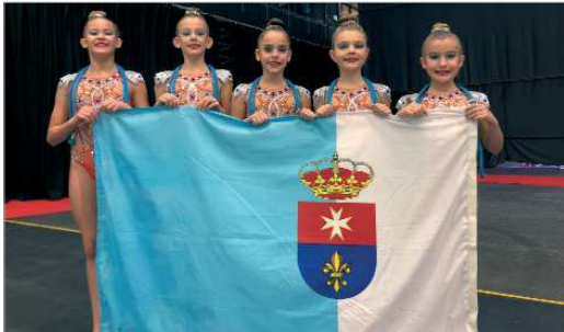
El Conjunto Alevín Base cuajó una gran actuación en Pamplona.

El Club Oso Panda Rinconada compite a gran nivel en el Campeonato de España de Conjuntos de Base y Copa Base Individual celebrado en Pamplona