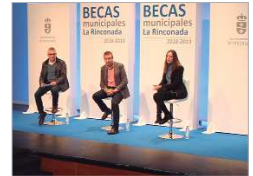
Entrega de Becas.

Las becas educativas crecerán de media por encima del 5 %, tanto las socioeducativas (Infantil, Bachillerato, Universidad y de comedor) como las formativas (prácticas no laborales y colaboración público-privada). Se contemplan nuevas movilizaciones Erasmus. Proyectos estrella en