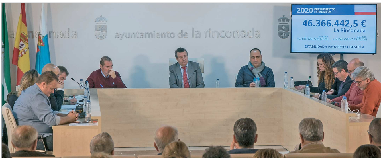
El Salón de Plenos del Ayuntamiento de La Rinconada acogió la sesión extraordinaria para debatir los presupuestos para el año 2020, que respaldaron 19 de los 21 ediles de la corporación.

Los Presupuestos de La Rinconada para 2020 alcanzan el techo de inversión en el Ayuntamiento y lo hacen sin tener que acudir a créditos con entidades bancarias, manteniendo la deuda 0 y los plazos de pago a trabajadores y proveedores por debajo de treinta días, lo que es un ejemplo de la salud económica del municipio