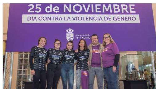
Un grupo de jugadoras de La Estación se sumaron a los actos del 25N.

dición de la provincia, y uno de los más laureados de España, en el Anexo al Felipe del Valle. En los capitalinos, la predominancia de jugadores era evidente, pero eso no amilanó a las zebras rinconeras que les plantaron cara, demostrando que pueden competir en igualdad de condiciones. Y aunque al final fueron derrotadas en el verde, consiguieron una victoria que sobrepasa el ámbito deportivo