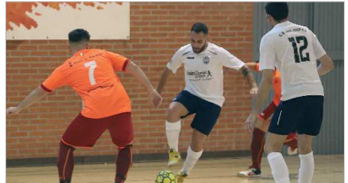
Imagen del partido entre el San José FS y el Alcalá de Guadaíra.

El San José FS atraviesa un bache de resultados, habiendo perdido sus tres últimos compromisos, lo