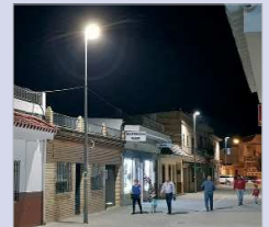
Plan de iluminación LED.

La Rinconada va a llevar a cabo de forma inminente, la adecuación y sustitución de toda la instalación de alumbrado público municipal