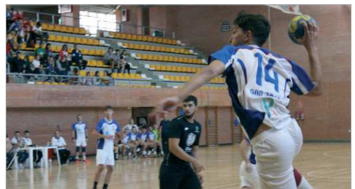
El BM San José ha cambiado de inquilino en el banquillo.

que le ha hecho caer de la zona de ascenso a Segunda Andaluza. Ante el Rubio, derrota por 1-3.