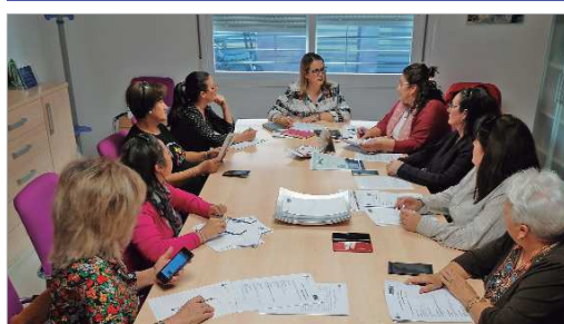
Reunión en el Centro de Información a la Mujer de las asociaciones.