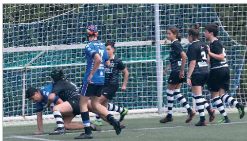
El equipo Sub 16 de La Estación Rugby Club, ante el Ciencias.

Las Zebras disputan un partido de cantera frente al Ciencias con veinte chicas de un total de veinticinco fichas, algo inédito en el panorama nacional, ante un rival netamente masculino