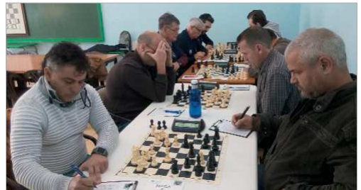
El Club Ajedrez San José C puede ascender como campeón.

contundente al Mercantil por 0-6. El objetivo del club es retornar a la Tercera Nacional.