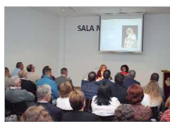
Presentación de la restauración.

Los problemas en conjunto consistían fundamentalmente en numerosas pérdidas policromas y la falta puntual de adhesión en los bordes de algunas lagunas, además de la alteración estética