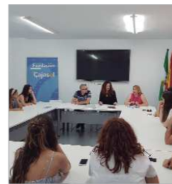
Reunión con beneficiarios.