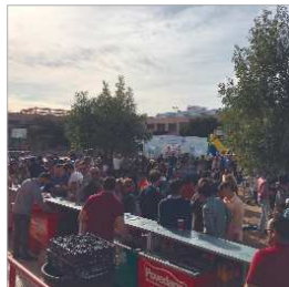
Imagen del festival.

De manera paralela, se sucedían diferentes actuaciones de artistas se unían a este original y llamativo festival benéfico.