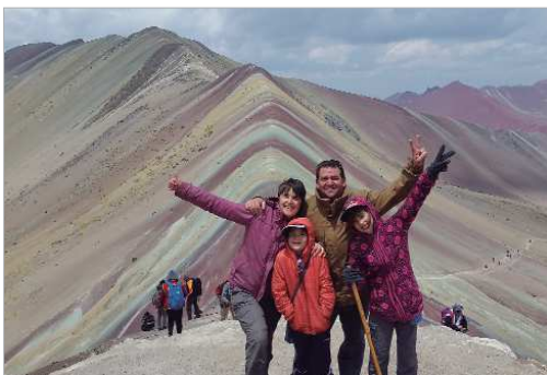
La montaña de los siete colores, también conocida como Vinicunca.