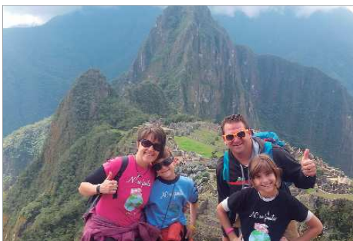
En este viaje de aventuras, también pasaron por Machu Picchu.