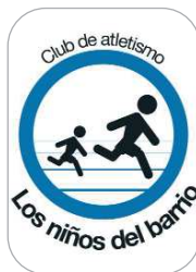
Los Niños del Barrio Atletismo - Ultrafondo

La joven taekwondista local dio toda una lección de coraje y una alegría a los, cada vez más, aficionados a este deporte en La Rinconada, al colgarse la medalla de oro en la Supercopa de Andalucía tras una final durísima disputada en Antequera.