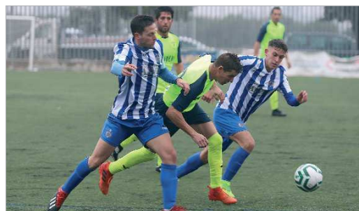
El lateral zurdo Colela vuelve al Rinconada y ya debutó contra el Ventipito.

mañana cambiara la dinámica y todo lo que se veía gris antes, ahora era color de rosa. Y esa sensación se refrendó una semana más tarde, al abrigo del Nuevo Ramos Yerga, ante un equipo temible como el Morón, al que los rinconeros derro-