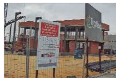
El nuevo Parque de Bomberos.

nuevos planes de choque y refuerzo de la limpieza. Se dota Ordenación del Territorio presupuestariamente con nuevos servicios, entre los que sobresale la Oficina de Asesoramiento a Núcleos Diseminados, con funciones de tutelaje y orientación. Asimismo, Seguridad Ciudadana gestionará 3 millones de euros (3,3 %) mientras que Bomberos se fortalece un 21 % en