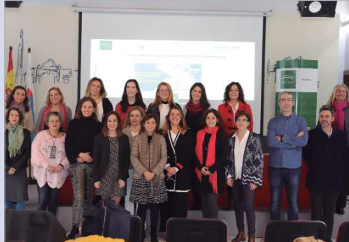
Foto de familia de las participantes en la jornada.

En este Foro se ha fomentado la generación de redes de colaboración y sinergias interempresariales, como factores claves para el desarrollo de la empresa y supondrá el broche final a las Jornadas de Fomento de Redes de Contacto entre Empresarias que se han celebrado en Mairena del Aljarafe, Morón de la Frontera, San Juan de