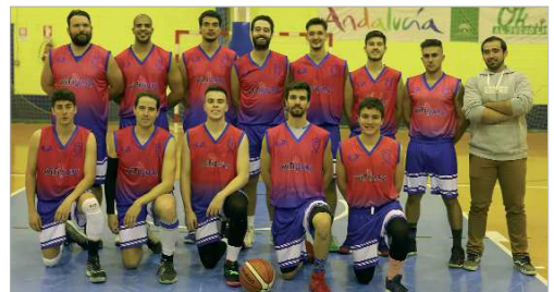
Formación del Wifiguay La Vega de Baloncesto, antes de un partido.

podría recuperar el liderato del grupo -tiene un partido menos que Lepe y Lebrija-.