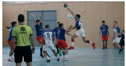
Imagen de la última victoria del BM San José en el Viso del Alcor.

Cañada Rosal (8-1). No obstante, el equipo trabaja bien y espera revertir pronto esta racha negativa.