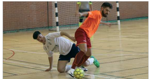
Imagen del duelo entre el San José FS y el Alcalá de Guadaíra.

empate ante el San Juan del Puerto, han permitido al equipo acercarse a la zona noble.