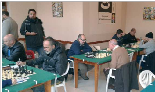
El IFAE San José no pudo superar el Play Off de ascenso a División de Honor.

El Club Ajedrez IFAE San José no ha podido superar al Algeciras, que le ha derrotado por 1,5 a 3,5. Los campobritalareños, que ya habían vencido 3-2 en la ida, serán los que estén en División de Honor andaluza el próximo año, mientras que los rinconeros tendrán que buscar el año que viene una nueva oportunidad.