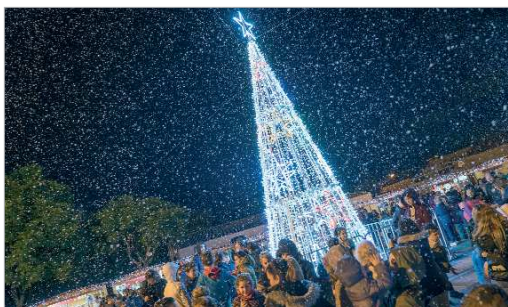
Una gran nevada dio la bienvenida y despidió el Mercadillo de Rinconada.

Durante los días de celebración, tendrán lugar distintas actividades organizadas desde el propio Ayuntamiento de La Rinconada o bien por parte de los propios comerciantes presentes en ambas citas. En La Rinconada, los asisten-