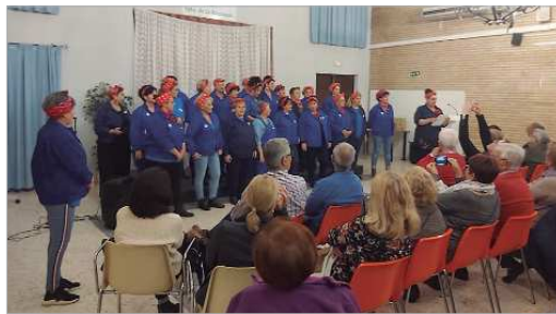
Actuación del coro feminista 'A Voces'.

Una quincena de actos ha integrado la programación de este año coordinadas desde el área de Igualdad con la colaboración de diferentes colectivos y entidades locales vinculadas al mundo de la cultura, el deporte, la educación y la juventud