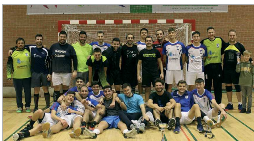
El BM San José disputó un amistoso en el X Trofeo Manolín Romero.

El BM San José celebra cinco partidos de distintas categorías, cuatro de ellos oficiales, en una gran fiesta local de este deporte, que sirvió para conmemorar el X Aniversario del homenaje