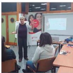
IV edición de la Gira 'Mujeres'.

Un año más, el municipio ha sido escenario de dos sesiones de este evento que incide en la formación en habilidades destinadas al emprendimiento