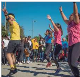
Exhibición de baile.