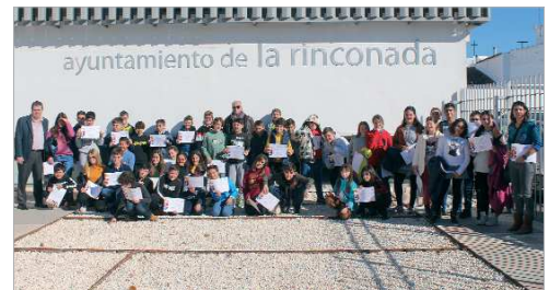
Visita de los centros Blanca de los Ríos, Júpiter y PUA al Consistorio.