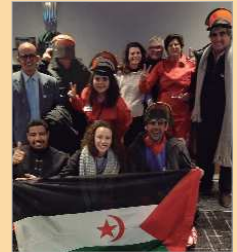
Los participantes en Oslo.

Con su presencia en esta cumbre internacional donde se han dado cita en torno a 700 delegados procedentes de los 164 países que integran la conferencia, ha querido dar visibilidad junto a otros once integrantes de su grupo, a la amenaza con la que vive el pueblo saharauí. En los conocidos como territorios liberados y a todo lo largo del muro de 2.750 kilómetros que separa esta región de la región del Sahara ocupado, se estima que existen entre siete y diez millones de minas antipersonas instaladas allí por Marruecos si bien, el reino alauí niega este hecho. Se trataría de la franja de territorio con mayor número de minas antipersonas del mundo que provoca numerosos casos de mutilaciones y muertes sobre todo entre la población infan-