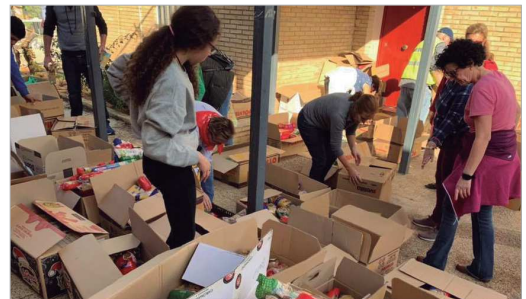
Distribución de los distintos alimentos recogidos en la Caravana Solidaria.

poder poner comida en su mesa. Durante toda una mañana, acompañados por los acordes de la banda municipal, los voluntarios de estas entidades recorrieron las calles solicitando la colaboración de la ciudadanía. Y, una vez más, La Rinconada demostró ser un municipio solidario, pues, tras el recuento, se contabilizaron hasta 2.700 kilos de alimentos que fueron donados en su totalidad a las Cáritas San José y Santa María, que son las encargadas del reparto entre las familias necesitadas de la localidad.