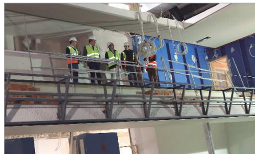
Las obras han supuesto una ampliación del aforo del recinto.

Por su parte, Romero Campos se refirió a la evaluación y actuación continua de las infraestructuras y dotaciones municipales: "Era el momento de darle un impulso modernizador y mejorar las prestaciones del Antonio Gala, de la