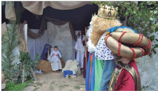
Una de las estampas que dejó la celebración del Belén Viviente.

Alrededor de 60 personas, desde los más pequeños a los mayores, han participado en esta representación del nacimiento de Jesús, así como, animales tales como gallinas, conejos e incluso un burro.