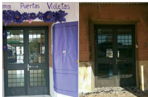
Antes y después del acto vandálico en la Puerta Violeta del Antonio de Ulloa.