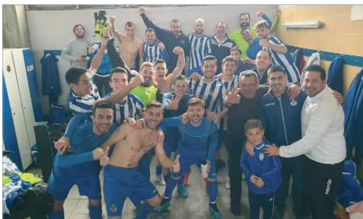
La familia de la Unión Deportiva Rinconada, tras golpear a La Barrera.

El Rinconada se eleva a la undécima posición en la tabla, su mejor registro de la campaña, se hace fuerte en el Ramos Yerga y logra el oxígeno necesario para liberarse de la presión