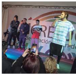
Actuación de rap.