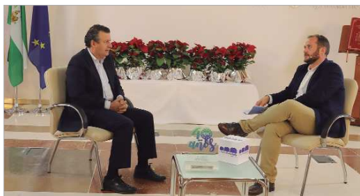
El alcalde, Javier Fernández, analizó la actualidad del municipio.

La emisora local un año más prepara un programa especial para la mañana del 24 de diciembre donde todas las voces de la radio compartirán unos minutos con la audiencia y en el que se entrevistará al alcalde de La Rinconada