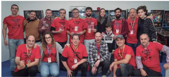
Participantes en la fiesta Retrogame, que albergó la Red CraJoven.

Durante todo un fin de semana, se ha celebrado por parte del área de Juventud del Ayuntamiento de La Rinconada el XII festival Red CreaJoven de La Rinconada atrayendo a jóvenes con el deseo de mostrar y dar a conocer sus diferentes formas de entender y manifestar su creatividad. De esta manera, en el funcionamiento de los diferentes stands de Artbigú donde se daban cita diecinueve firmas se implicaron unas cuarenta y tres personas. En la feria Retrogame estuvieron colaborando más de diez personas implicadas. Entre jóvenes raperos y participantes en las batallas de gallos que ganaron Selu (Sanlúcar la Mayor) e Hizoxx (Málaga) se alcanzaba una cifra cercana a cincuenta participantes y exhibiendo su talento como Dj's y en