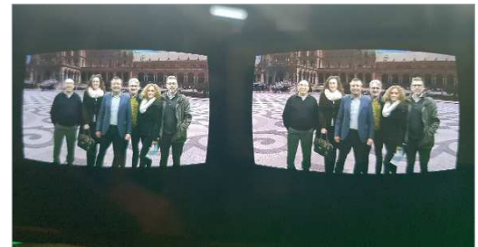
Así sería la visión con las gafas de Realidad Virtual Compartida.