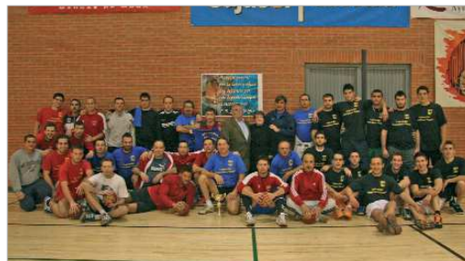
La familia del balonmano local posa en la I edición del Trofeo.