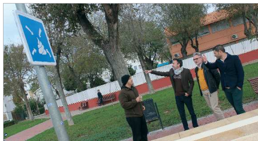
El parque Félix Rodríguez de la Fuente ya luce su nueva señalética.

gir con sus respectivos alumnados, esta nueva iniciativa". Recientemente, el CEIP La Paz han instalado la señalética en el parque Félix Rodríguez de la Fuente. Cada centro educativo tiene asignado un parque o espacio verde de La Rinconada sobre el que trabajará y que concluirá con la instalación de mobiliario urbano creado por los propios alumnos y alumnas que se inste a su conservación y cuidado. Estas actividades se llevarán a cabo durante el tercer trimestre escolar. Los parques encomendados son El Majuelo (CEIP Los Azahares), Jardines 28 de Febrero, Quintero, León y Quiroga, y Parque Estrasburgo (Guadalquivir), Avenida de La Unión (CEIP La Unión), Félix Rodríguez de la Fuente y 8 de Marzo (CEIP La Paz), Las Graveras (CEIP Nuestra Señora del Patrocinio -PÚA-), Miguel de Mañara y Los Pintores (CEIP Júpiter), Primero de Mayo y Valle Inclán (CEIP Blanca de los Ríos), Dehesa Boyal (CEIP Pepe González), Bulevar del Almonazar (CEIP Maestro Antonio Rodríguez), y zonas verdes de la Barriada Santa Cruz (Colegio San José).