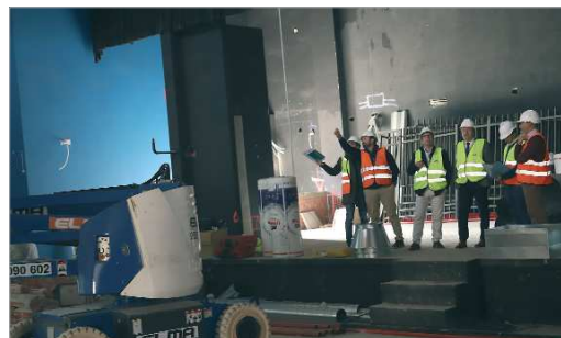
El alcalde y el edil de Hábitat Urbano, en el escenario del Centro Cultural.

misma manera que trabajamos en las mejoras de otras instalaciones y en la puesta en servicio de otras nuevas". Las obras tienen un pre-