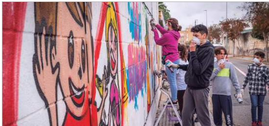
Concurso de Graffitis en el Muro de los Azucareros.

Celebrada la XII edición de este festival que incluyó música en directo, bailes, diferentes creaciones plásticas y una fiesta de video juegos retro atrayendo a más de novecientas personas de público. La lluvia obligó a trasladar el II concurso de Rock a próximas fechas