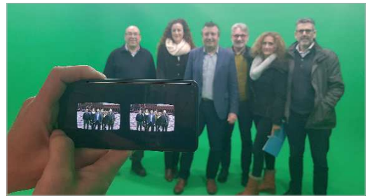
Imagen virtual grupal en Plaza de España, con el fondo real de la imagen.

'Soluciones Inmersivas' estará, con un stand propio, en la próxima edición de FITUR.