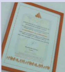
Premio a la 'Excelencia Social'.

La Rinconada es uno de los únicos dos municipios españoles de más de 20.000 habitantes que han alcanzado por cuarto año consecutivo (el total de los que se lleva entregando) la excelencia en inversión de servicios sociales, según los datos hechos públicos por la Asociación Estatal de Directores y Gerentes de Servicios Sociales.