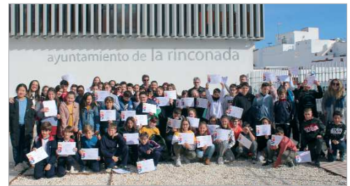
Los CEIP Maestro Antonio Rodríguez, La Paz, y el colegio San José.