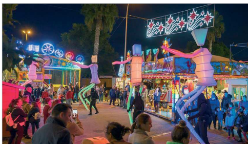
Numerosas acciones han llenado de actividad el Mercadillo Navideño.

tes han podido disfrutar del espectáculo 'Big Dancers', una propuesta cultural presentada por la compañía 'El Carromato', actividades de ludoteca infantil, espectáculos de magia, Reyes Magos, espectáculos de fuego y una zambomba flamenca. Además, han pasado por el parque Estrasburgo el Bufón Du Roi, Alberto 'El Romero' y los 'Juegos de Habilidades e Ingenio' que propone 'La Guasa' para toda la familia. Estas actividades también se desarrollarán durante el Mercadillo en San José. Las otras novedades que tienen lugar son el aumento de atracciones, que han