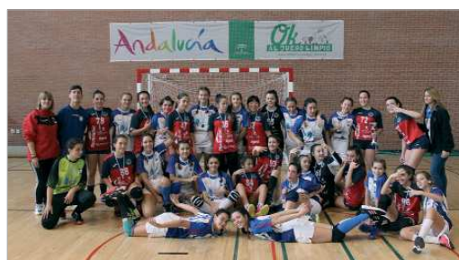
El club cuenta esta campaña con dos equipos femeninos.