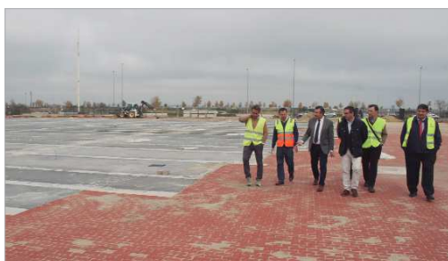
El recinto 'El Abrazo' afronta la etapa más importante de su transformación.

'El Abrazo' será un gran parque de 80.000 metros cuadrados multifuncional y polivalente para atraer eventos y acontecimientos con un potencial increíble, construido al pie de la autovía de Acceso Norte a la altura del Viaducto que cruza Pago de Enmedio. Un lugar con unas características que no tiene ningún otro sitio en la provincia de Sevilla. Se sitúa como una pieza central en el Eje del Agua, que transcurre por la localidad desde Las Graveras al Guadalquivir en el parque El Majuelo, convirtiéndose en otro pulmón en la red de espacios libres del municipio. Consta de una gran plaza central, un edificio multiusos, jardines ornamentales, juegos infantiles, juegos saludables, pistas deportivas, zona de aparcamiento con 1.500 plazas, un bulevar con pérgolas para generar espacios de paseo a la sombra y un gran espacio multiusos para acoger grandes eventos. Dispone también de un edificio textil de 2.500 metros cuadrados abierto por todos sitios y con capacidad para 4.000 personas. Asimismo, el nuevo recinto, entre otras múltiples actividades que lo mantendrán operativo todo el año, también acogerá la nueva Feria del municipio. Un proyecto estrella dentro de la estrategia Ciudad Única que ha planteado La Rinconada y por las que ha recibido cinco millones de euros de fondos europeos que, además, permitirá dar un salto cuantitativo y cualitativo en las infraestructuras dotacionales del municipio.