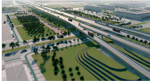
Imagen virtual de la zona de Pago de Enmedio tras finalizar el Viaducto.

ción del nuevo viaducto, actuación cofinanciada con fondos FEDER, cuenta con una longitud de 854 metros. El proyecto contempla un viaducto de 590 metros de longitud sobre los suelos de Pago de Enmedio, un terraplén intermedio y un segundo viaducto de 178 metros de longitud para salvar la glorieta del enlace norte con la vía autonómica que une La Rinconada con la estación de San José (carretera A-8001). El nuevo viaducto resolverá además los problemas de accesibilidad de estas dos poblaciones con la capital hispalense, ya que enlaza con las dos glorietas existentes en Pago de Enmedio, incluyendo nuevos ramales de conexión del viario local con el tronco principal, a la vez que permitirá solucionar los problemas de acceso a la capital desde la zona norte, lo que beneficiará a más de