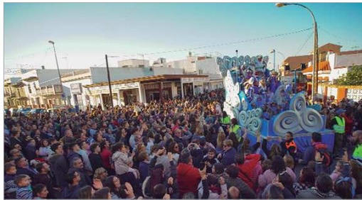
La Cabalgata de Reyes Magos, una cita ineludible en La Rinconada.

Antes, el 3 de enero, en el parque de Los Pintores, se coronará a los Reyes y a la Estrella de la Ilusión, en otro acto que creará