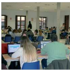
Las bibliotecas amplían horarios.

Estudio Abierto es un programa clásico dentro de la amplia programación del área de cultura, que supone un refuerzo a la apuesta por la educación de calidad del Ayuntamiento, en este caso, facilitando un lugar para poder preparar los exámenes parciales.