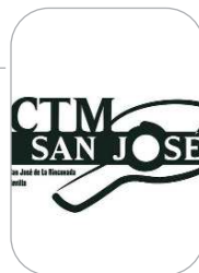
CTM San José Tenis de Mesa

La Piscina Cubierta ha sido escenario recientemente de la segunda edición del Villa de La Rinconada de Natación, organizado por el club local, en el que sus jóvenes promesas han puesto de manifiesto sus evoluciones y la entidad ha exhibido su trabajo.