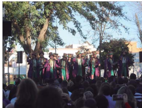
'La Antología del Loco' deleitó con sus coplas a los presentes en el Carnavalito.