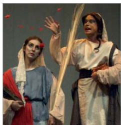
'En Sevilla hay que morir'.