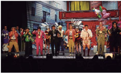
La Chirigota de 'Los Surferos' vuelve a pisar las tablas del Antonio Gala.

se acercó al stand de Radio Rinconada para comentar sus impresiones de la fiesta destacando "la importancia provincial que se ha ganado el Concurso, donde cerca de una veintena de agrupaciones que no son locales han venido a participar". El primer edil se refirió también al nuevo 'Antonio Gala', del que dijo "es el corazón de la cultura en La