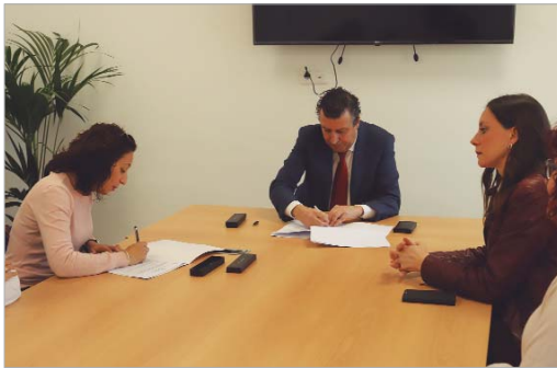
El alcalde, la presidenta de AFADI y la delegada de Servicios Sociales.

De este modo, se ha suscrito un primer convenio de 45.000 euros que irán destinados a garantizar el transporte de los usuarios y usuarias de AFADI a los diversos centros