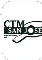
CTM San José Tenis de Mesa