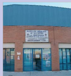
Pabellón Agustín Andrade.

La cita será este año en el Pabellón Deportivo Agustín Andrade, en el núcleo de La Rinconada, hasta donde se pondrá en marcha un servicio gratuito de lanzadera entre ambos núcleos para facilitar el traslado de las personas interesadas en acudir al evento. Como explicaban las delegadas