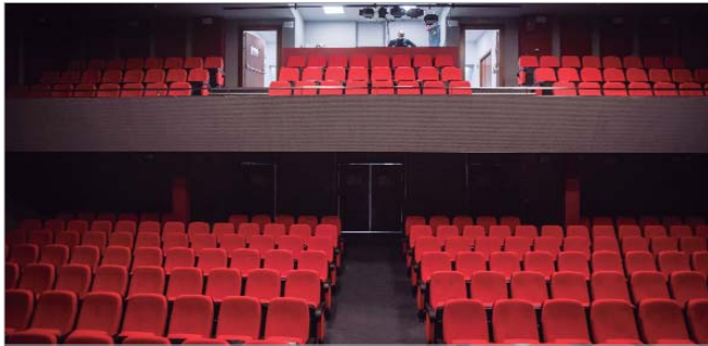
El nuevo anfiteatro permite incrementar el aforo del Antonio Gala hasta las 300 butacas.