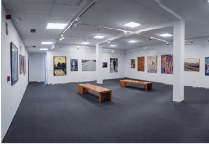
Una nueva sala de exposiciones en el Antonio Gala.