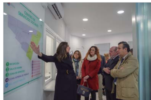
Se realizó una visita por las diferentes dependencias.