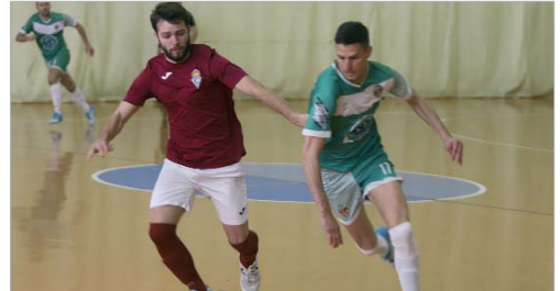
El Tres Calles quebró su racha triunfal ante el Alchoyano.

El Tres Calles perdió su último partido -otra vez en casa- ante el Alchoyano (1-2), en un partido bronco, cargado de polémica y que supone un frenazo a la