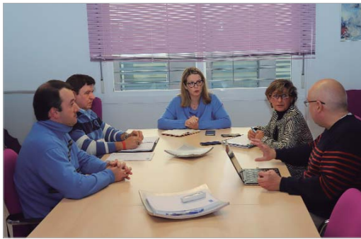
Las primeras reuniones para la elaboración del plan ya están en marcha.