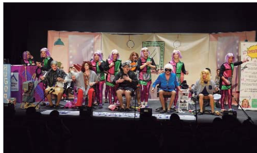
La chirigota local '¡¡Venga niña, que llevo prisa!!', en la final por primera vez.