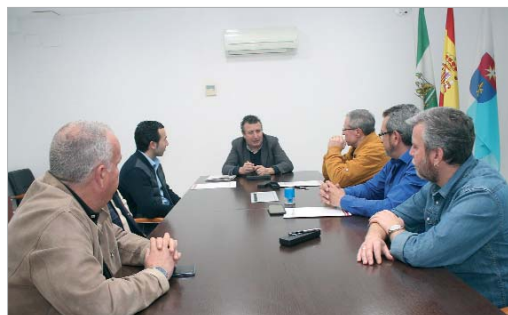
La representación directiva de San José y Rinconada, con el alcalde.