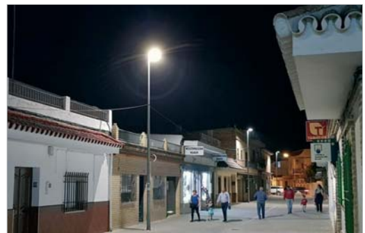
La luminaria de La Rinconada será ampliamente renovada.

Y con respecto a los cuadros de mando, de 108 unidades que inte-