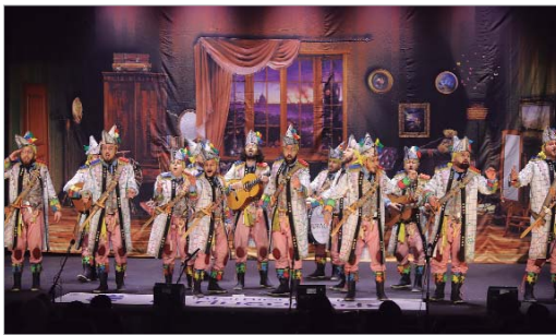
'El Batallón del Garabato' se quedó en el corte para pasar a la final.

Rinconada y permitirá no sólo disfrutar del Carnaval, sino de una programación cultural muy completa". Fernández invitó a todo el municipio a ponerse un disfraz y salir a la calle, porque "el Carnaval no para en La Rinconada" y, por último, avanzó que el municipio contará a partir del año que viene con un "Museo Audiovisual sobre el Carnaval que llevará el nombre de