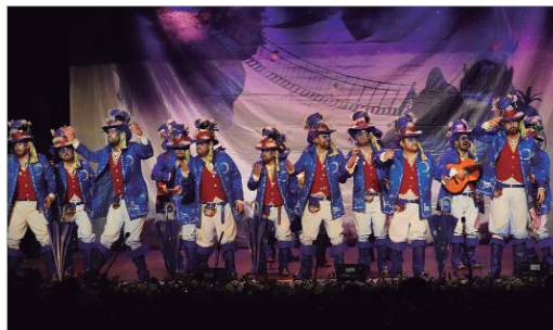
'El Arenero', comparsa ganadora.