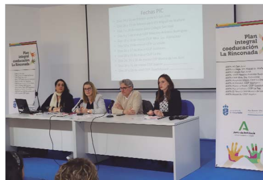
Presentación del proyecto coeducativo 'Aprendiendo a mirar'.

Los talleres formativos del programa 'Aprendiendo a mirar' facilitan la población claves para el análisis de los medios audiovisuales desde una perspectiva de género. Con el desarrollo de estos talleres, se busca que menores y ado-