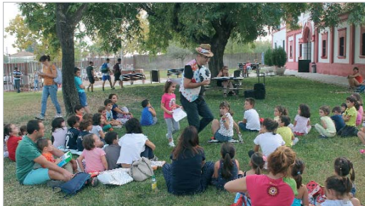
El ‘Cuentacuentos’ de la Biblioteca de la Hacienda Santa Cruz, un clásico.

Además, la oferta se complementa con visitas al edificio, gymkhanas, sesiones de leyendas urbanas y talleres de lectura