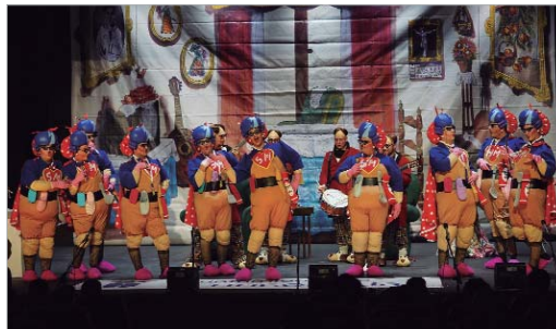
'Las supermamá's', primer premio en chirigotas.