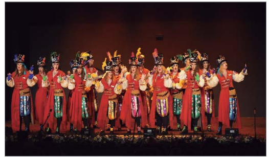
'La Intratable', premio 'Dolores La Mora' por su piropro a La Rinconada.