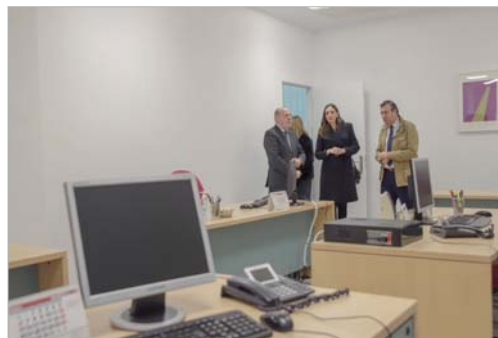
La sede se ha dotado de mobiliario y equipos informáticos nuevos.

El centro, en pleno rendimiento, ya es lugar de referencia para los usuarios de los servicios sociales