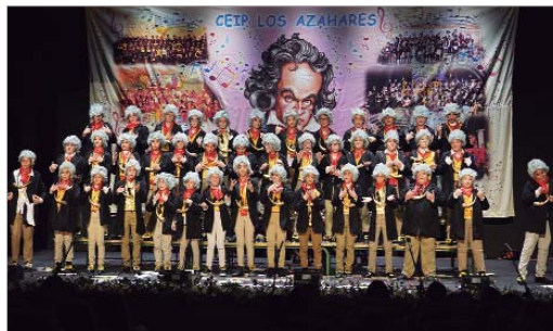
En esta edición, la cantera del CEIP Los Azahares tampoco faltó a la final.