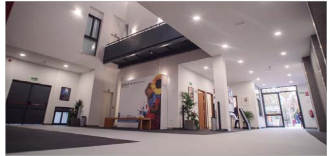
El nuevo acceso por la Avenida de La Ermita hace el recinto más moderno y funcional.