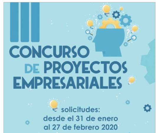
Cartel de la III edición del Concurso de Proyectos Empresariales.

res/as, que cuenten con un proyecto empresarial innovador, así como empresas constituidas con menos de un año de antigüedad, que cuenten con un proyecto empresarial para desarrollar de forma inmediata y efectiva. El premio consistirá en el apoyo a la puesta en marcha del proyecto empresarial mediante el alojamiento gratuito del mismo durante cinco años en una nave industrial de propiedad municipal.