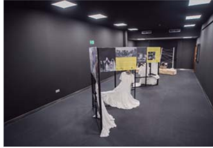
La Trastería decoró con su historia la sala Eugenio Barba.