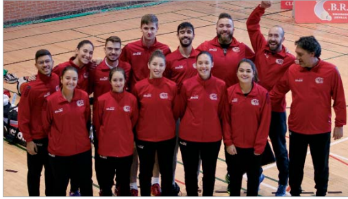
La plantilla del Bádminon Rinconada espera estar en la final