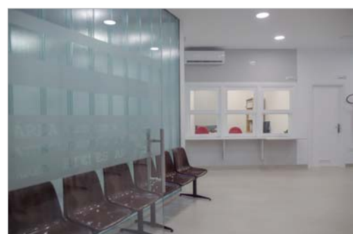
Nuevo espacio más moderno y funcional.