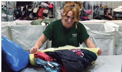
Humana recicla los residuos textiles recogidos.

En los quince contenedores de recogida de ropa, calzado y textil de Humana Fundación Pueblo para Pueblo instalados en la localidad, se han depositado 2.660 kilos más de ropa que el año anterior lo que supone un incremento del 5 por ciento