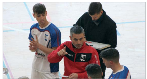
El entrenador rinconero da instrucciones a sus jugadores.

El Balonmano San José sigue en una magnífica dinámica y ha reforzado el primer puesto del Grupo D de Primera Andaluza, aprovechando los tropiezos del que