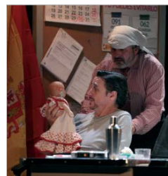
'El Asesino de la Regañá'.

años del municipio, mezcla en su música recursos del reggae, la canción de autor o el pop, aunque su