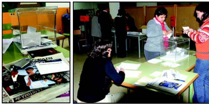
La jornada electoral discurrió sin incidentes, con goteo de electores y con especial seguimiento a los medios de comunicación.