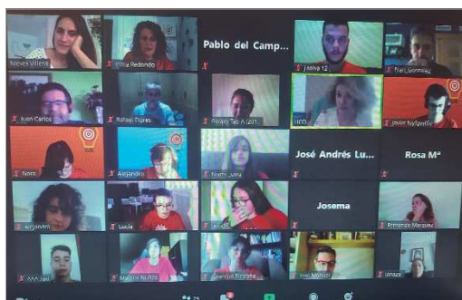
Imagen de la videoconferencia final de la Escuela de Jóvenes Emprendedores.

El curso se ha dividido en dos fases, una primera, enfocada a la formación en torno a habilidades como la comunicación, el compromiso, la perseverancia o el trabajo en equipo, y la segunda, por proyectos, se les enseña a emprender a través de la metodología design thinking, donde