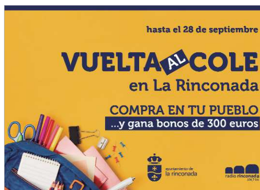
Cartel promocional de la campaña.

Para fomentar el consumo local, se realizará el sorteo de dos premios de 300 euros en bonos para gastar en los comercios adheridos. Participar es tan sencillo como realizar una compra en uno de los comercios adheridos a la campaña, por cada 10 euros de compra se entregará una papeleta que deberá