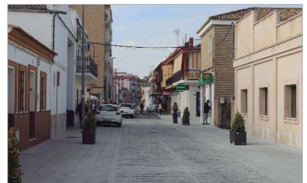
La calle Manuel de Rodas, tras su remodelación.