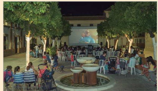
Cartelera del cine de verano en La Rinconada.

Eastwood, que pudo visualizarse el pasado viernes, 19 de junio, en el parque Miguel de Mañana. Los otros títulos de junio son 'Playmóbil: La película', el miércoles 24 en La Caldera y 'Mujercitas', el 26 en San José. El resto de films que componen el programa de 2020 son 'Elcano y Magallanes, la primera vuelta al mundo' (1 de julio), 'Los siete magníficos' (3 de julio), 'Godzilla: Rey de los monstruos' (8 de julio), 'Men in Black: International' (10 de julio), 'Spider-Man: Lejos de casa' (15 de julio), 'Érase una vez en... Hollywood' (17 de julio), 'Astérix: El secreto de la poción mágica' (22 de julio), 'Playmóbil: La película' (25 de julio), 'La