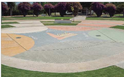
La Plaza Factoría Creativa en el interior del Dehesa Boyal.