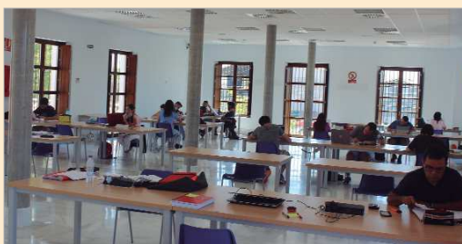
Estudio Abierto se ha adaptado a la "nueva realidad".

no es ininterrumpida, sino que se divide en dos sesiones, una de mañana, de 9:00 a 14:30, y otra de tarde, de 15:00 a 22:30 horas, puesto que es necesario hacer un receso a mitad del día para la limpieza y desinfección del espacio.