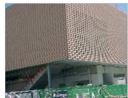
El Centro Cívico 'Los Silos'