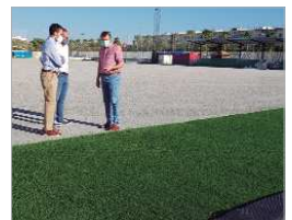
El 'Castañita' tendrá nuevo césped.