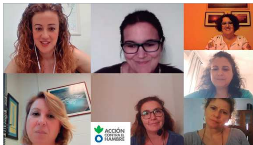
Clausura telemática de la última edición.

A través de una metodología innovadora de trabajo en equipo se ha puesto en valor las capacidades para ayudar a cada participante a conseguir sus objetivos laborales. El transcurso del programa