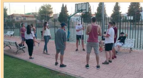
La patrulla Covid-19 informando a un grupo de jóvenes de La Rinconada.

El plazo de inscripción ya se encuentra abierto y las solicitudes pueden descargarse de la sede electrónica de la página web del ayuntamiento, o enviando un email a informacionjuvenil@aytolarinconada.es . Su entrega se puede realizar en el Registro del Ayuntamiento o de la Tenencia de Alcaldía o de forma telemática a través de la web en 'Trámites online. General. Solicitud Genérica'. Más información en el Centro Joven La Estación, bajo cita previa, o en el 954793900.