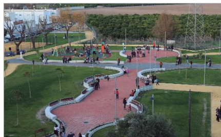
El parque 'La Caldera' en Lomas del Charco y Huerto de Benito.