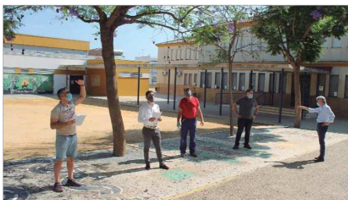
Los edificios Rafael Reyes y Antonio Marín, en el colegio Guadalquivir.