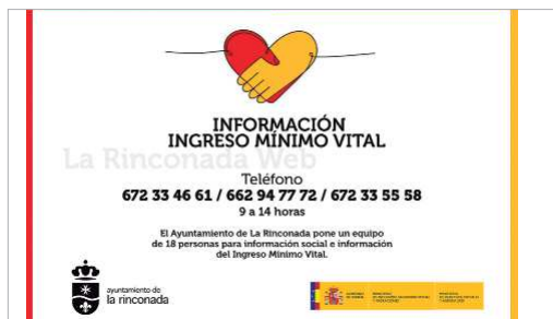
La Rinconada ha habilitado tres líneas telefónicas para asesoramiento.

El primer edil rinconero lo anunciaba en su página de Facebook: "Una vez aprobado y publicado el ingreso mínimo vital, ponemos en marcha en La Rinconada una oficina virtual, telemática y telefónica para informar sobre los requisitos y todos los detalles de esta prestación para aquellas familias susceptibles de poder recibirla." Así, el Ayuntamiento ha habilitado tres números de teléfono y a quince