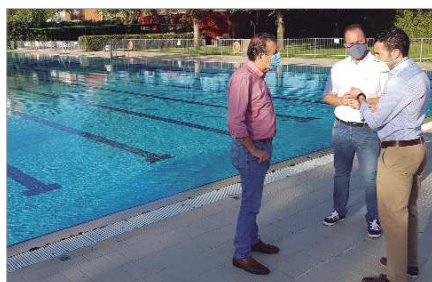
Piscina pública en el Francisco Sánchez 'Castañita'.