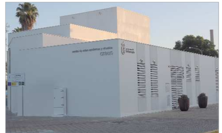
El nuevo centro de Artes Visuales y Escénicas de La Rinconada.