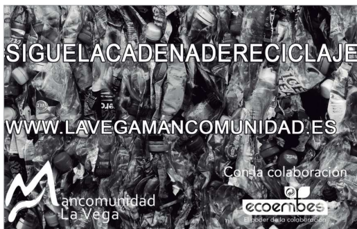
Cartel promocional de la campaña.

La Mancomunidad de Servicios La Vega, con el apoyo de los ayuntamientos de los municipios que forman parte de la entidad, lleva a cabo durante todo el año campañas de comunicación en el ámbito local que favorezca la concienciación medioambiental de la ciudadanía y permita, en la medida de lo posible, incrementar el volumen de recuperación de residuos. Estas acciones, junto con la planta de tratamiento automatizada, referente a nivel regional y nacional, donde se realiza una gestión y valorización de residuos, ha permitido que durante el primer trimestre del año 2020 (enero-abril), la Mancomunidad ha conseguido recuperar 268.820 kgs. de envases ligeros (envases de plástico, briks y latas), que supone un incremento de 28,57% con respecto al mismo periodo del año anterior; En el caso del contenedor azul (papel y cartón), se han recuperado 158.540 kgs, un 21,15% más; Mientras que en el contenedor verde (envases de vidrio), se han recuperado 221.240 kgs, un 1,1% más.