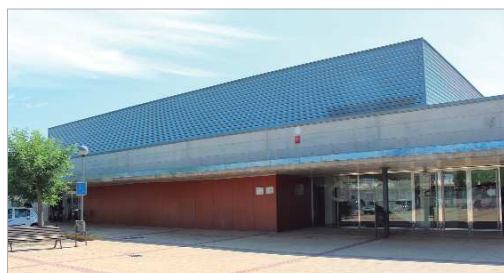
Imagen exterior del Patronato Municipal de Deportes.

e, incluso, llamando a la propia institución. Respecto al peso, la mitad se ha mantenido, o incluso perdido peso, y la otra mitad ha ganado kilos. Eso sí, quienes han ganado, han aumentado más kilos que quienes lo han disminuido. El delegado de Deportes ha destacado que "durante el Estado de alarma hemos seguido muy pendientes de la evolución de nuestros usuarios y, con la finalidad de seguir trabajando en posibles opciones compatibles con las restricciones existentes, adecuadas a sus necesidades, estamos elaborando un perfil de la actividad realizada en este tiempo".