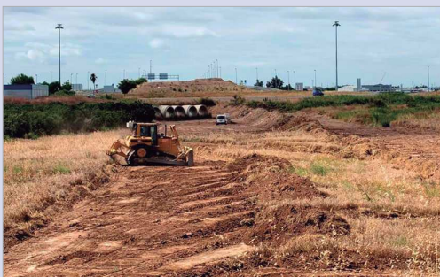
Ya han comenzado las obras del Viaducto de La Unión.

A mayores, sigue el desarrollo de zonas como el entorno del aeropuerto, en la zona situada en el término municipal de La Rinconada, el proyecto del gran centro logístico de Andalucía en los suelos de Majaravique, y el desarrollo de nuevas oportunidades en el parque aeronáutico Aerópolis. Por último, cabe mencionar la construcción de nuevas viviendas. Tanto impulsadas desde lo público, con unas condiciones muy ventajosas para sus beneficiarios, como desde la iniciativa privada, creando nuevas urbanizaciones residenciales en la localidad.