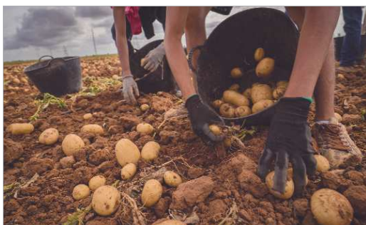
La patata nueva, un producto característico de La Rinconada.