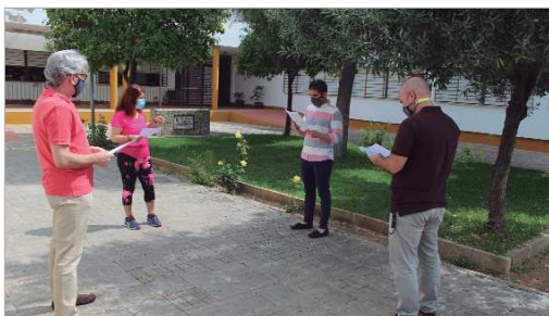
El CEIP Maestro Antonio Rodríguez, donde se actuará en verano.

"La suspensión de las clases nos da mayor margen de actuación para acometer las reformas necesarias, de manera que, una vez vuelvan las clases, los centros estén en perfecto estado de revista", añade el edil de