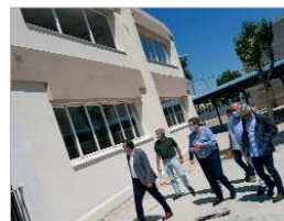
Visita a las obras del PÚA.