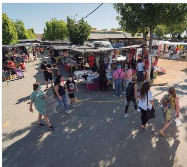
El Mercadillo de San José, con la "nueva realidad".

Ambos mercadillos tendrán una única entrada y sólo una salida, que estarán controladas por personal habilitado para velar por el aforo del recinto.