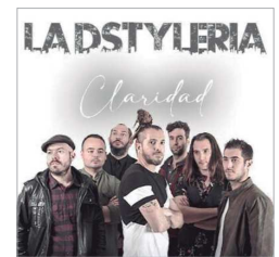
El grupo local 'La Dstylería'.

Además, durante las dos semanas, de lunes a jueves, 'Nómadas, artistas en movimiento', del Centro de Artes Escénicas y Visuales de La Rinconada (CRAES), representarán varias piezas teatrales a la finalización del espectáculo en la zona de césped de la Hacienda Santa Cruz. Se trata de espectáculos que ya grabaron en vídeo y difundieron durante el Estado de Alarma, un lo que supone también, un homenaje a su labor durante los momentos más duros de la pandemia.