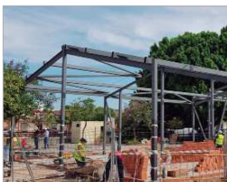
Obras de la Casa del Flamenco.

Por último, también se han abierto a la ciudadanía las calles del centro de La Rinconada tras un impulso sin precedentes para su modernización. Se ha mejorado la accesibilidad y la eliminación de barreras arquitectónicas, se ha peatonalizado Virgen de Gracia y se han creado bolsas de aparcamientos que facilitan el desplazamiento a pie por una de las principales arterias comerciales de La Rinconada, avanzando hacia La Rinconada del futuro.