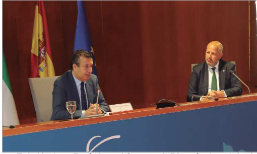
El alcalde, Javier Fernández, y el Consejero de Educación, Javier Imbroda.

En cuanto a las enseñanzas, toda está enfocada a la formación profesional, tanto educacional como de búsqueda de empleo. En un primer momento se implantarán nuevos