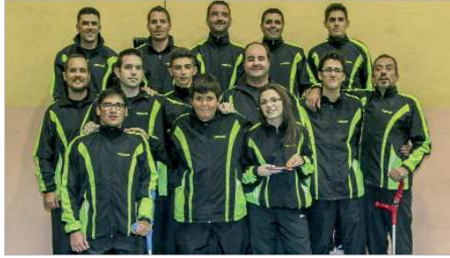
El CTM San José cuenta los días para volver a disfrutar del Tenis de Mesa.

Y es que, en estos momentos y después de tantas batallas a sus espaldas, la prioridad de ambos diri-