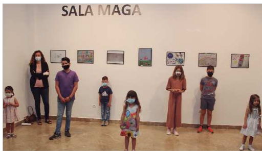
Foto de Familia tras la entrega de premios.

Durante el Estado de Alarma, el área de Cultura, junto a las bibliotecas municipales, convocaron este certamen para los escolares de Infantil y Primaria de la localidad