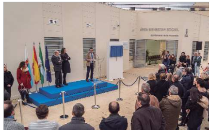
Imagen de la apertura del nuevo centro de Bienestar Social.