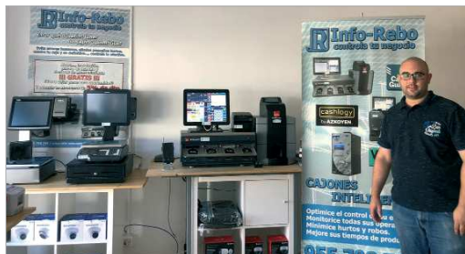
Info-Rebo, tu nueva tienda de informática en el Centro Comercial 'El Rincón'.

encuentra, además de este soporte a empresas, equipos y accesorios informáticos para particulares, como ordenadores, teclados, tintas, papeles especiales de impresión, altavoces, auriculares... Adaptándose a los tiempos que corren ofrecen el servicio a los hosteleros de digitalizar la carta del restaurante, modernizando el servicio y reduciendo así el riesgo de contagio. Asimismo, dispone de cajones inteligentes con los que se evita el contacto al pagar en efectivo entre el cliente y el trabajador; cuentan con mascarillas ffp2, con cámaras termográficas para el control automático de temperatura y con multitud de ideas y soluciones para las empresas.