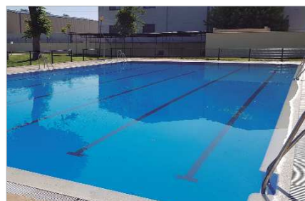
La piscina de La Rinconada, en el Polideportivo 'El Negro'.