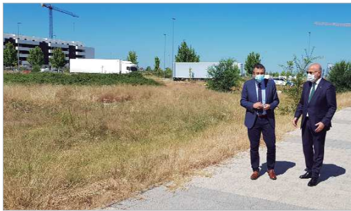
Tras el acto, visitaron la parcela donde se ubicará el centro.

ciclos formativos que den respuesta a las necesidades de las empresas del sector aeronáutico como los de grado superior de Mantenimiento Aeromecánico de Aviones con Motor de Turbina, Mantenimiento de Sistemas Electrónicos y Aviónicos de Aeronaves o Mantenimiento Aeromecánico de