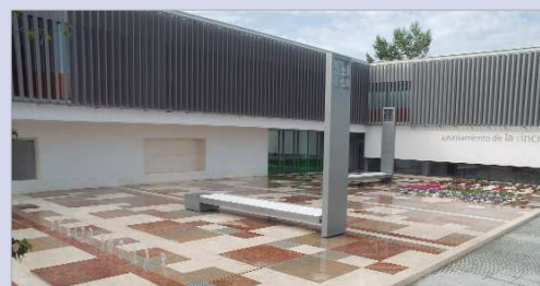
La Rinconada mantiene Deuda 0 con entidades financieras.

La Rinconada mantiene Deuda 0 con entidades financieras, la empresa pública Soderinsa arroja beneficios por segundo año consecutivo y se supera el gasto computable del ejercicio 2018 en un 10 por ciento esencialmente por mayores inversiones y programas de empleo