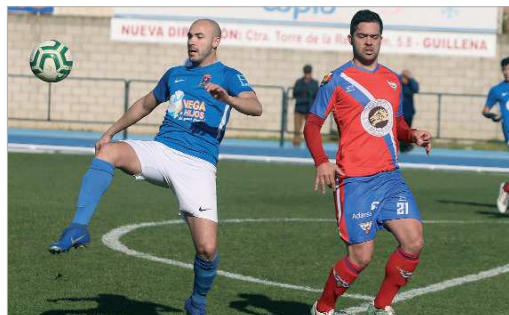
El Coria ha sido el que ha fichado finalmente a Lobo.

mucho en mí y yo tenía que devolverles esa confianza. Yo sigo confiando en 'Che' y el cuerpo técnico, en lo que se puede hacer esta temporada, ya que sabe cómo es la División de Honor, los jugadores que tiene y que pueden renovar, y seguro que él y el equipo están seguros de que se lucharía desde primera hora por la zona alta.