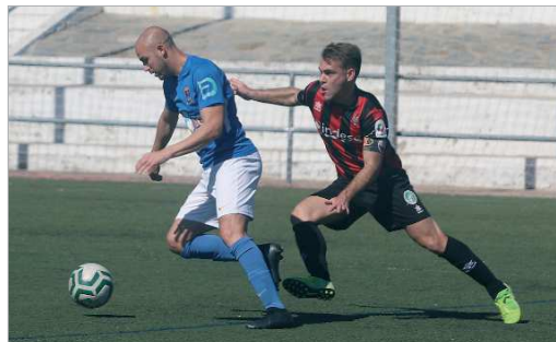
Lobo se lleva el balón ante un rival en un duelo de la pasada campaña.

Por el momento (cuando se realizó la entrevista) sigo a la espera de si llegan ofertas poder valorar unas y otras. Mi primera intención, como la cualquier futbolista ambicioso, es seguir creciendo y mejorando. La A.D. San José es mi casa y donde he disfrutado mucho del fútbol y los compañeros. Tanto el club como el cuerpo técnico han confiado