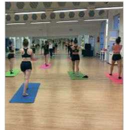
Imagen de un entrenamiento.

El Club de Gimnasia Rítmica Oso Panda ha vuelto a los entrenamientos, puesto que el calendario, a partir del mes de septiembre, sigue vigente, y la idea de la entidad es llegar a esas fechas en un estado de forma óptimo de sus deportistas.