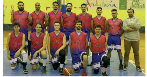
Los directivos aún no saben si podrán federar al equipo Senior.

El Estado de alarma ha obligado a suspender el Torneo de Primavera y el Campus de Verano del Club Baloncesto La Vega lo que, suma-