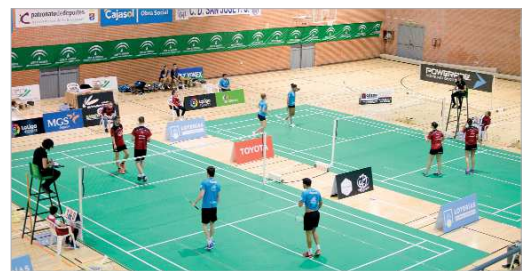
No habrá clásico del bádminton español en la Final del Campeonato.

situación que estamos viviendo y saber que su disputa no la habrían podido disfrutar los aficionados, estaba por ver lo mermaidas que iban a estar las plantillas atendien-