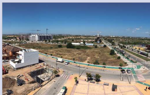
La parcela en la que se ubicará el Centro de Formación Profesional.