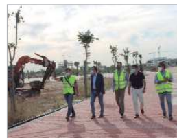
El recinto multifuncional 'El Abrazo'.