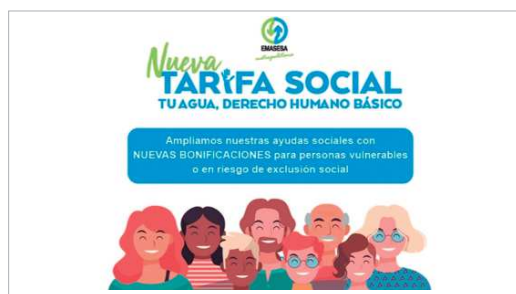
Cartel anunciador de la nueva tarifa social de Emasesa.

La Tarifa Social podrá solicitarse cumplimentando y firmando la solicitud de bonificación tarifaria 2020, que se facilitará en cualquier oficina o punto de atención presencial de Emasesa.