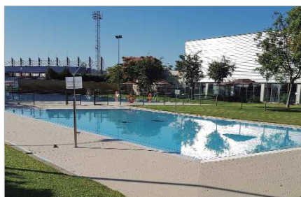
La piscina de verano del Anexo a Piscina Cubierta.