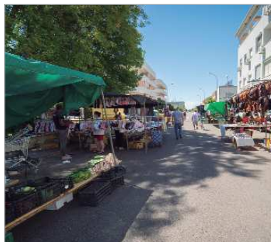
El Mercadillo de La Rinconada, tras su reapertura.