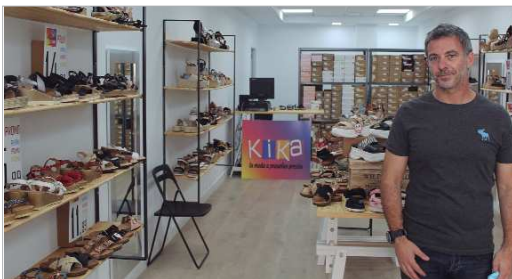
La Zapatería Kika, ubicada en la calle Madrid.

Este nuevo comercio, que cuenta con una gran variedad de modelos en calzado de señora y caballero a precios muy competitivos y bajo la premisa de la comodidad