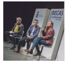
Entrega de Becas 2019.

En los próximos días se entregarán más de 300, con una cuantía de 60 euros cada una que tienen como finalidad ayudar en la compra de material curricular a través de chequealibros canjeables en los comercios locales, mientras que en octubre y noviembre se podrán solicitar las de Bachillerato, Ciclos Formativos y Universitarias