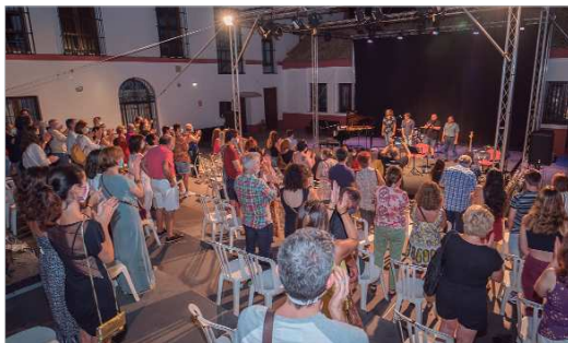
La Hacienda Encantada se ha retransmitido via streaming.