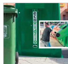
Reciclaje de vidrio.

Son los resultados de la campaña llevada a cabo durante este año por Ecovidrio, la Mancomunidad de Servicios de la Vega y las áreas de Comercio e Infraestructuras Públicas del Ayuntamiento de La Rinconada en la que han participado 95 establecimientos