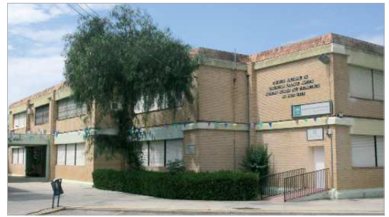
Arriba, la imagen del PÚA reformado. Abajo, el mismo centro antes de las obras.