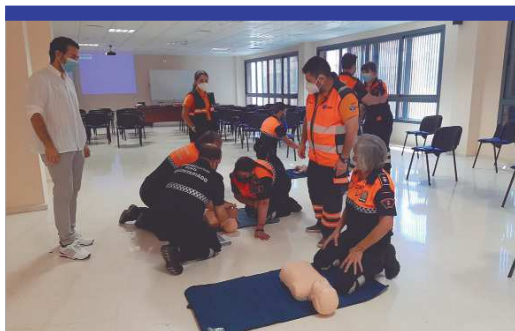
Imagen de la última acción formativa desarrollada por Protección Civil.

de Innovación del Ayuntamiento de La Rinconada, "hoy en día, el acceso a las nuevas tecnologías es básico y desde la administración local lo vamos a hacer posible en estos parques buscando la facilidad en el uso y la seguridad de las personas usuarias". La puesta en marcha de esta red está prevista para antes de finales de año y cuando los trabajos de instalación finalicen, la red wifi gratuita se activará en los diez parques indicados de manera simultánea.