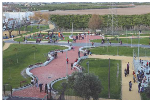
El parque de 'La Caldera' dispondrá de wifi gratis.

En cuanto a las características técnicas de esta red, contará con una velocidad de 100 Megas incluso con cincuenta personas conectadas de manera simultánea