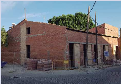
La Casa del Flamenco avanza su construcción según los plazos.

Las obras han contado con una inversión de en torno a 50.000 euros con cargo a los Fondos FEAR de la Diputación de Sevilla.