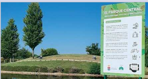
El parque Central de La Unión.

Como concluye Reyes, "la conservación y salvaguarda de nuestros espacios verdes también suponen riqueza para el municipio".