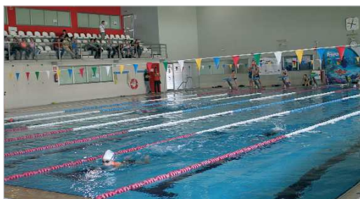
La Escuelas Deportivas en agua tendrán finalidad terapéutica.

El Patronato reduce la oferta de su programa formativo por excelencia para evitar la posible propagación del Covid-19, pero mantiene aquellas con finalidad terapéutica