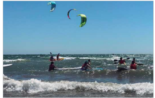
Los participantes han disfrutado de actividades multiaventura.

Por último y en clave deportiva, los participantes inscritos fueron hasta la localidad onubense de Punta Umbría para disfrutar de la playa y