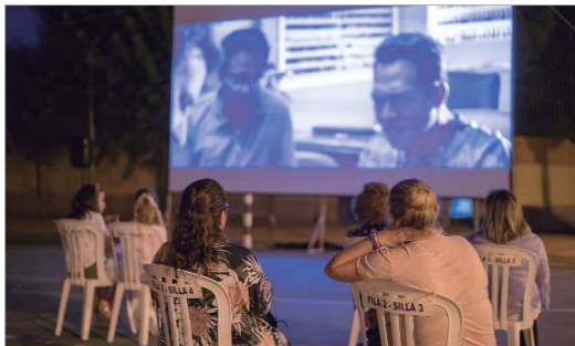
La Caldera, el Parque Miguel de Mañara y La Jarilla acogieron el cine.

'La Hacienda Encantada', 'Jarilla Estival' y 'Verano de cine' han sido las apuestas durante el verano para seguir empoderando a la cultura local con todas las medidas de seguridad