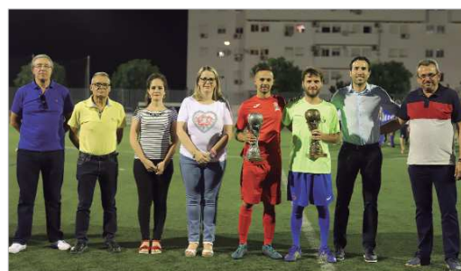
Entrega de premios de la última edición disputada el verano de 2019.