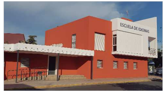
Imagen exterior del nuevo Centro de Idiomas, recientemente remodelado.

El alcalde ha manifestado que "las áreas municipales trabajan de forma transversal en beneficio de la ciudadanía y un ejemplo de ello es este centro de idiomas, que permitirá la adquisición de una serie de competencias educativas a precios asequibles".