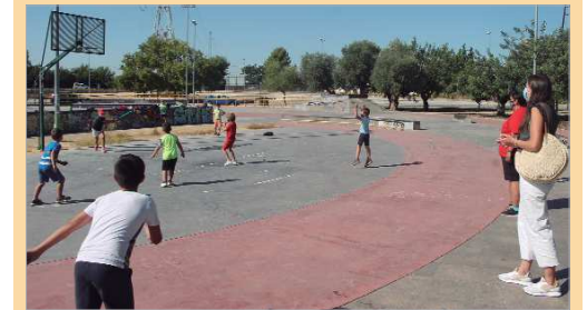
Una de las actividades exteriores, celebrada en el Skate Park.

Además, como actividades especiales se realizaron salidas a la piscina, al Centro Andaluz de Arte Contemporáneo, a la Mancomunidad de La Vega y a distintos parques del municipio.