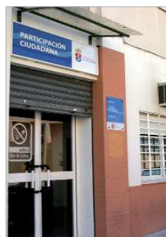
Sede de la OMIC en La Rinconada.

antes de formalizar la contratación de un servicio...en todos esos supuestos y