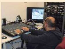
Emisión de los Plenos.

Cerrando el capítulo de programas de producción propia incluimos la retransmisión en diferido de los Plenos Municipales. Estas emisiones íntegras se programan para el sábado siguiente a la celebración del pleno y comenzando siempre a las nueve de la mañana.