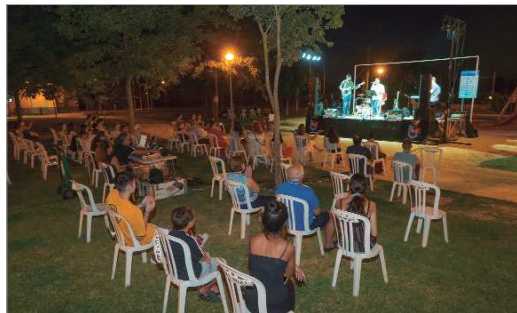
La música ha sido la protagonista de Jarilla Estival.