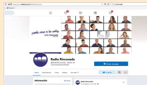
Radio Rinconada está presente en Redes Sociales.

Basta con descargarse la app de la mencionada plataforma para poder disfrutar en cualquier momento y lugar, de los contenidos más interesantes emitidos por la emisora municipal de La Rinconada.