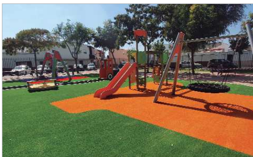
El césped amortiguador y las atracciones infantiles del 'Miguel de Mañara'.

para diferentes rangos de edad, pero separadas entre las dos zonas. Por último, se ha colocado en el suelo una serie de tableros y circuitos de juegos tradicionales para que niños y niñas puedan jugar sobre ellos.