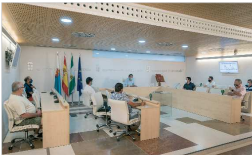
El alcalde y el edil de Deportes, con los clubes del municipio.

El Ayuntamiento ha canalizado una aportación económica a los diferentes clubes del municipio, derivada del plan de subvenciones municipales. En total, el importe subvencionado ronda los 70.000 euros, que suponen un gran apoyo a la realización de las actividades por parte de los clubes locales. Entre los