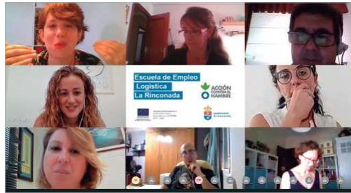
Presentación telemática de la III Escuela Social de Logística.

formación en el sector y personas con amplia experiencia que pretenden incorporarse de nuevo al mercado laboral. Estarán trabajando durante seis meses, mediante sesiones grupales e individualizadas, los aspectos básicos de logística, tendrán contactos directos con empresas, conocerán de primera mano el funcionamiento de negocios del sector y podrán participar en foros y encuentros. El formato en el que se imparte comenzará siendo online, según las recomendaciones del Gobierno ante la crisis