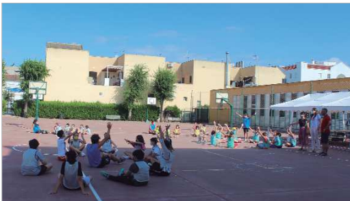
Los jóvenes de la localidad han disfrutado del Campamento Urbano.

Se ha celebrado con el 50 por ciento de su aforo, respetando las medidas de seguridad recomendadas y en grupos reducidos para restringir las relaciones sociales y los contactos