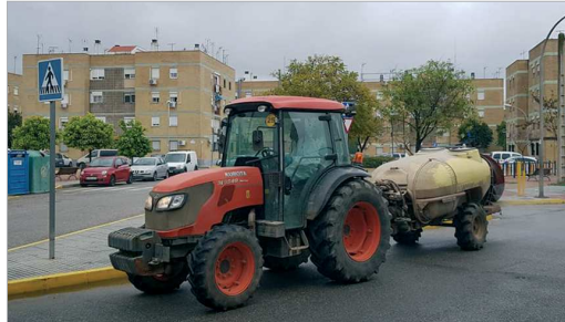
Todos los martes, los tractores refuerzan la limpieza de la vía pública.