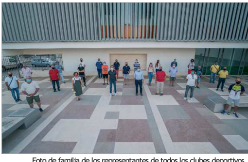
Foto de familia de los representantes de todos los clubes deportivos.

El Ayuntamiento entrega las subvenciones a los clubes deportivos para contribuir a la Formación y Competición Federada, actividades de Deporte de Ocio, Recreación y Naturaleza, y Grandes Eventos organizados por entidades locales. Se suman más de 160.000 euros que implican la cesión gratuita de las instalaciones municipales