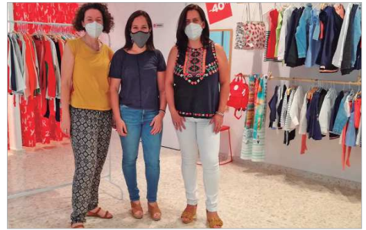
La delegada de Comercio visitaba 'El Patinete Moda'.

pequeñas, porque a las niñas les gusta elegir su propia ropa e incluso vienen con su monedero a comprarse ellas mismas sus modelitos", explica. Trabajan con marcas como 'Losan', demandada por su buena relación calidad/precio y 'Street Monkey', "difícil de encontrar en el municipio y que ofrece cosas muy divertidas y de calidad, aspecto importante para las madres a la hora de comprar". Todas las novedades y promociones de 'El Patinete Moda' las encuentran en su página de Facebook, con ese mismo nombre. Ahora, como oferta de lanzamiento por su apertura, tienen un