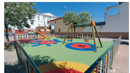
Uno de los parques infantiles del municipio.