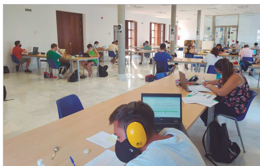
Imagen de la Biblioteca Santa Cruz, en una sesión del programa Estudio Abierto.

plazas por la obligatoriedad de mantener la distancia de seguridad, en caso de que la demanda de plazas supere a las ofertadas, tienen preferencia las personas empadronadas