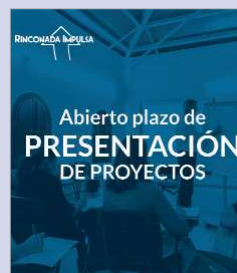
Abierto el plazo de presentación.

fases. Una primera enfocada a la conversión de ideas abstractas en modelos de negocio. La segunda fase del proceso girará en torno a validar o no el modelo de negocio definido en la fase anterior y, por último, llegará el momento de desarrollar el modelo validado hasta que se convierta en una realidad empresarial y solvente. En estas tres fases los participantes recibirán formación en comunicación, finanzas, marketing, estrategias de ventas y