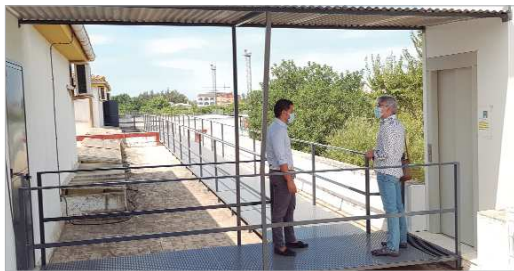
Los delegados de Infraestructuras Públicas y Educación.

Tradicionalmente, en La Rinconada, con las vacaciones de verano, el Ayuntamiento visita los distintos centros educativos del municipio, atendiendo, de la mano de la dirección de los mismos, las posibles deficiencias derivadas del uso que hubieran podido producirse durante el periodo lectivo para que, en septiembre, una vez se produzca la vuelta a las clases, estén en perfecto estado de revista. Este año, el Estado de Alarma por la pandemia sanitaria del Coronavirus obligó a suspender las clases, por lo que la visita se adelantaba para disponer de más tiempo a la hora de acometer