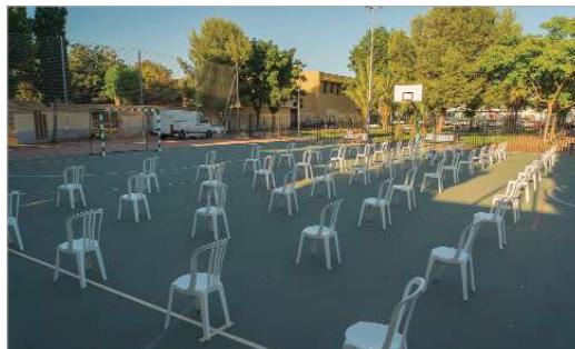
Los actos se han celebrado siguiendo las recomendaciones sanitarias.