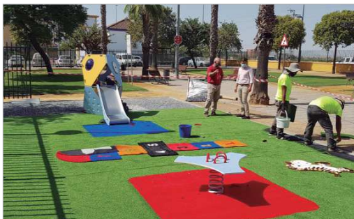
Realización de las obras (ya finalizadas) en el parque '8 de marzo'.

más la seguridad de estos espacios destinados al disfrute infantil. Además, se han instalado nuevos juegos y atracciones diseñadas