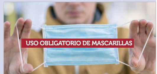
El uso de mascarillas es obligatorio.

Según las últimas informaciones, el número de personas contagiadas se está viendo incrementado tanto dentro como fuera de la localidad por lo que la prevención basada en la distancia física, el uso correcto de mascarilla y el cuidado de la higiene de las manos sigue siendo la mejor fórmula