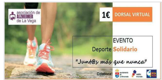
Cartel del evento solidario.

de cualquier deporte, ya sea correr, bicicleta, natación o caminar, entre otros. Desde la asociación comentan que "en este momento, todos y todas necesitamos sentirnos unidos y caminar 'Junt@s más que nunca', además de apoyar a todas esas personas que padecen esta enfermedad y a sus familias. La inscripción estará abierta hasta el próximo 16 de octubre y los interesados podrán hacerlo a través de la página web www.lavegacec.es . El precio del dorsal es de un euro y,