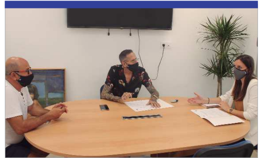
Reunión entre AR San José y el área de Bienestar Social del Consistorio.