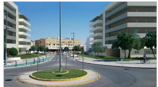
Recreación virtual de la futura Urbanización Bulevar, en el centro de San José.

vida elijan asentarse en La Rinconada, pero también tenemos promociones destinadas a