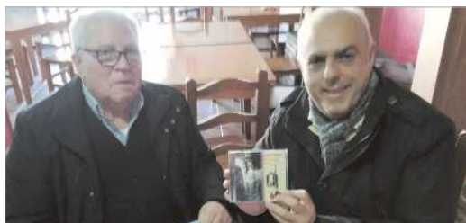
Los responsables del disco, con el trabajo ya editado.

El trabajo discográfico ya está a disposición de los amantes de la música cofrade a través de la Hermandad de los Dolores