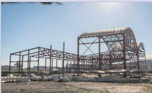
Desarrollo de las obras del segundo hangar de Ryanair.

Este segundo taller de reparaciones debe estar operativo a finales de 2021 para cumplir con los plazos propuestos y dará trabajo a varias decenas de profesionales altamente cualificados.