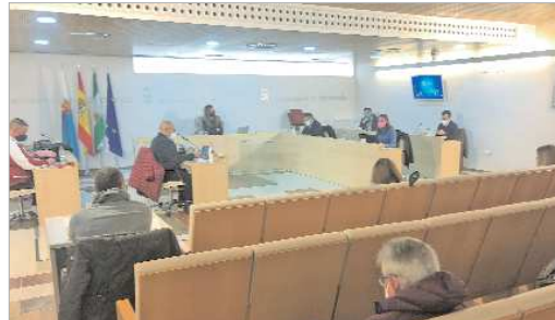
Imagen del Pleno municipal en el que se aprobaba el Plan de Emergencias.

La Rinconada acaba de aprobar en Pleno su nuevo Plan de Emergencia Municipal teniendo en cuenta la normativa vigente aplicable. Como todo Plan de emergencia, se estructura en un parte general, común a todos los municipios, que marca las pautas que se deben seguir en caso de emergencia cuando el ámbito trasciende lo local, y una parte específica, que tiene en cuenta la idiosincrasia de La Rinconada, atendiendo a características geográficas, de población, de territorio, activida-