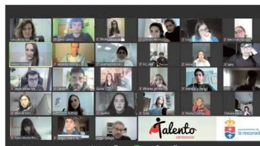
Reunión por videoconferencia de los participantes en este programa.

Institutos y Centros educativos de La Rinconada, el programa contempla dos etapas, la primera se realiza en los Institutos de La Rinconada que deseen adherirse al programa y consta de aproximadamente 16 talleres de una hora de duración para difundir el espíritu emprendedor y dar a conocer el programa, que comenzaba en el mes de octubre y ha llegado a unos 400 jóvenes y la segunda, que empieza ahora y que consta de 24 talleres individuales, de dos horas de