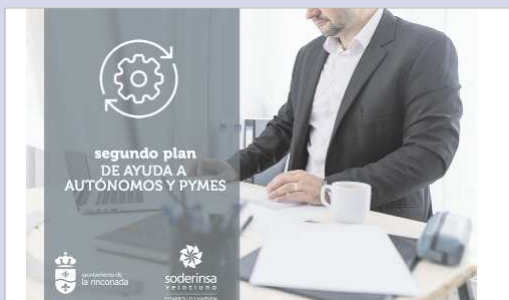
El Ayuntamiento va a entregar una segunda remesa de ayudas a Autónomos.

El objetivo de estas ayudas es el de mitigar las graves consecuencias económicas provocadas por la crisis del Covid-19 y sufridas por las empresas emplazadas en la localidad cuyos establecimientos se han visto afectados. Se busca aten-