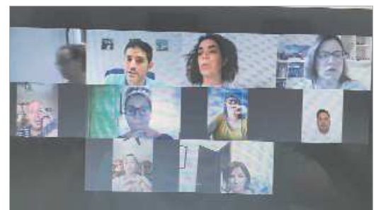
Imagen de una reunión de la Mesa del Carnaval durante el Estado de Alarma.

Además, desde una óptica radiofónica, se van a elaborar una serie de programas temáticos concretos sobre aspectos que rodean