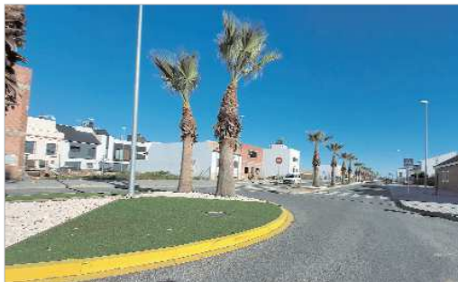
Las piedras ornamentales de las medianas de San José Norte cambiarán.

Como destaca el edil del ramo, "esta actuación parte de una demanda vecinal y se engloba dentro del plan integral de modernización y embellecimiento de la Rinconada que lleva a cabo el área de Servicios Generales".