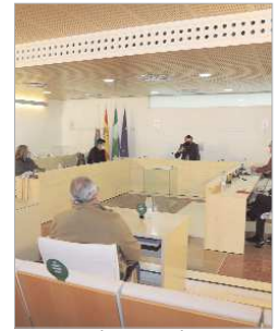
Reunión en el Salón de Plenos.

Próximamente, otros colectivos locales, tanto en el ámbito de la Cultura, como de carácter social, también recibirán subvenciones extraordinarias para facilitarles su labor en un marco de actuación marcado por las restricciones y los problemas ocasionados por el Covid-19.