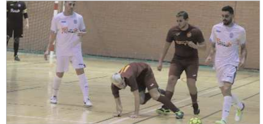
Imagen del partido ante Los más Pitufos en el Fernando Martín.

El San José FS comenzó la segunda vuelta de la competición en Tercera Andaluza con un nuevo triunfo ante el Cerro Balompié por 3-7, con los que suma nueve de los últimos nueve puntos en disputa y se