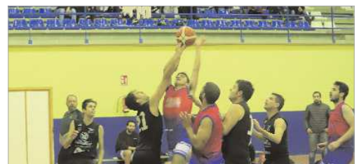
El Wifiguay La Vega jugará la segunda fase con los segundos de grupo.

El Wifiguay Baloncesto La Vega de La Rinconada cumplió su parte del trato para ser segundo en el grupo B de Segunda Provincial con un triunfo incontestable ante el Cafetería La Tata Santiponce por 76-52, un +22 que sirve a los