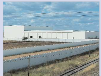
El nuevo Centro Agroalimentario del Arroz, en proceso.

Herba construye en los terrenos de la antigua azucarera un nuevo Centro Agroalimentario del Arroz, una oportunidad de desarrollo económico que, a la vez, conlleva una importante transformación de la fisonomía del entorno de Santa Cruz y Santa Caridad, pues lleva consigo un proyecto integral que implica una importante modernización y dinamización del entorno, que avanza según las previsiones establecidas.