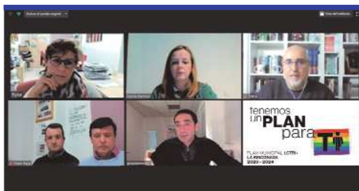
Los diferentes participantes en la reunión, a través de videoconferencia.

Tras su aprobación y homologación, se establece una fase de Implantación de seis meses, dirigida a su instalación inicial y a posibilitar el desarrollo y operatividad del mismo, al tiempo que se desarrollarán un conjunto de medidas que garanticen su permanente adecuación, a las nuevas realidades territoriales que puedan producirse, y su capacidad de respuesta.