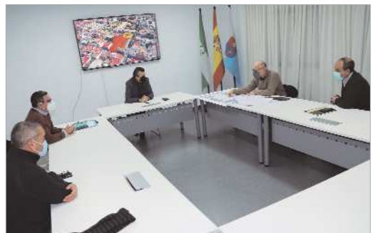
El alcalde, junto al equipo redactor del proyecto del Mercado de Abastos.

La nueva Plaza de Abastos se situará en el pasaje que conecta la nueva bolsa de aparcamientos de calle Virgen de las Flores, con la calle Virgen de Gracia, totalmente peatonal. El nuevo edificio tendrá unos 500 metros cuadrados, lo que posibilitará la instalación de unos ocho puestos, más servicio de bar y zonas