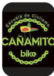
Cañamito Bike Ciclismo

El entrenador rinconero se ha proclamado recientemente campeón de la Liga Sub 18 del norte de China, dirigiendo al filial de Wuhan Three Town, que se impuso en la final a un coloso en el país asiático, como el Guangzhou Evergrande.