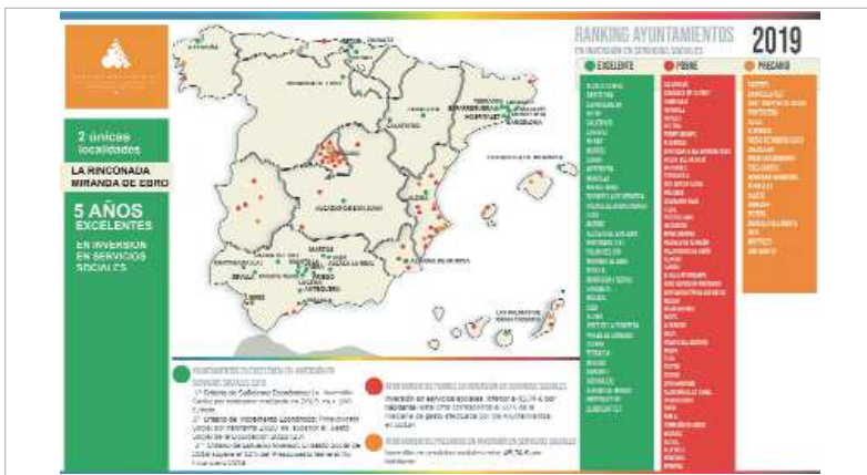
Ranking nacional de los municipios distinguidos por su 'Excelencia Social', entre los que está La Rinconada.

Ayuntamientos con Excelencia en su gasto en servicios sociales es Andalucía con 14 Ayuntamientos, seguida de Cataluña con 7, y País Vasco con 3, Aragón con 2, y el resto de CCAA con 1 solo Ayuntamiento, a excepción de Asturias, Cantabria, Extremadura, Murcia, Navarra y La Rioja en las que no cuentan ni un solo Ayuntamiento que atienda a estos criterios de excelencia. En la provincia de Sevilla, sólo la capital y La Rinconada cumplen con los parámetros para la obtención de la 'Excelencia'. Es la liquidación de 2019, los consistorios que han alcanzado la 'Excelencia' se han elevado en seis, respecto al año pasado, mientras que siete más que en 2018 han sido calificados como 'Pobres', cuyo gasto en Servicios Sociales se sitúa por debajo de 45,74 euros por habitante, mientras que 19 ayuntamientos (15 menos que el año pasado), han sido catalogados como precarios (superan el umbral de la pobreza, pero no llegan a una inversión de 50 euros por habitante). El resto se sitúa por encima de los 50 euros, pero no llega a los 100 que delimitan la 'Excelencia'.