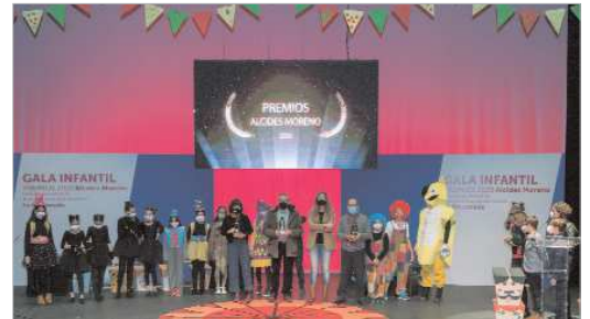
Foto de familia con todos los protagonistas de la IV Gala 'Alcides Moreno'.

El acto conduyó con una foto de familia y un prolongado aplauso de todos los presentes.