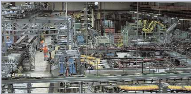
Interior de la planta embotelladora de Coca Cola en La Rinconada, a pleno rendimiento.