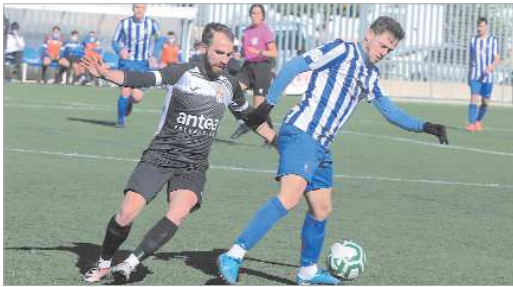
La vuelta de Colela ha aportado mayor seguridad defensiva al Rinconada.

El Rinconada comienza 2021 con un cambio sustancial en su juego, mucho más seguro atrás, y en los resultados, con un triunfo en Hytasa y un empate ante el líder de la competición, lo que permite afrontar con optimismo el resto del calendario en esta primera fase