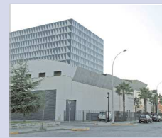
Placas fotovoltaicas en La Villa.

Por otro lado, El Ayuntamiento ha aprobado en Pleno la ratificación de los decretos aceptación de la subvención para proyectos singulares de Entidades Locales que favorezcan el paso a una economía baja en carbono, en el marco del Programa Operativo FEDER de Crecimiento Sostenible, por la que el municipio recibirá un importe de 430.000 euros, también provenientes del IDAE, para la instalación de placas fotovoltaicas en la cubierta de distintos edificios públicos, como el Centro Cultural de La Villa, la Central Mixta de Seguridad, el edificio Juan Pérez Mercader, la Piscina Cubierta y el CEIP Guadalupe, que pasarán a ser autosuficientes a nivel de recursos energéticos, lo que permitirá "seguir reduciendo emisiones y avanzar en el uso y aprovechamiento de energías limpias, inocuas