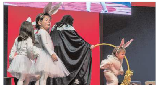
El alumnado de 'La Incubadora' se encargó de amenizar y dinamizar la función.