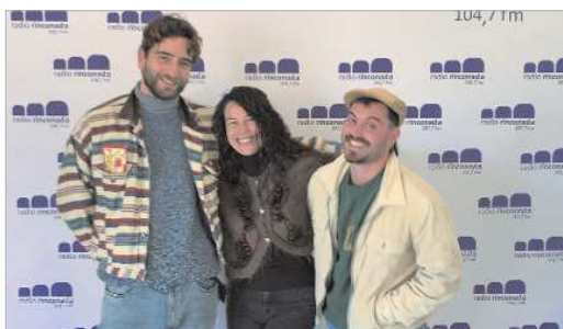
Una representación del grupo 'Panopicos', en la Radio.

Con la inspiración del confinamiento de fondo, le han dado forma a temas como Sayonara: "cuando pierdes el contacto y ya no puedes hacer cosas como darle un abrazo a tu abuela, te das cuenta de las cosas que son importantes". Entre otras muchas creacio-