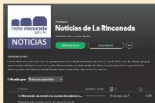
Visual del canal Spotify.

El nuevo canal de Spotify se suma al ya existente en ivoox donde el pasado año 2020 se publicaron cerca de 430 audios que acumularon un total de 5.416 escuchas.