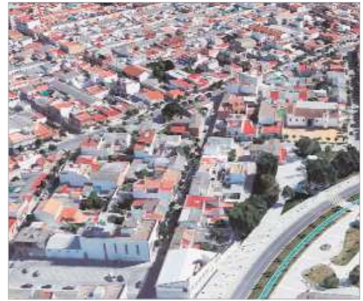
Vista aérea de La Rinconada.