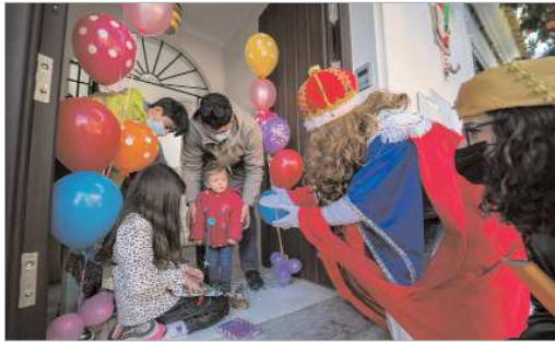
Los Reyes Magos, durante una de las visitas a un domicilio de La Rinconada.