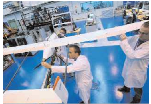
El interior del Catec, a pleno rendimiento.

Y recientemente, la periodista Myriam Ávila escribía en 'Invertia', la sección tecnológica de 'El Español', que "el municipio sevillano de La Rinconada puede presumir de ser una referencia mundial. Da cobijo a la planta de Coca Cola más grande de Europa y al único centro nacional de mantenimiento de aeronaves de Ryanair. Además de una larga