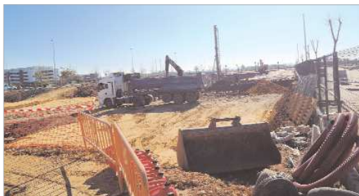
Las obras de la nueva tienda de Mercadona.

El Ayuntamiento ha aprobado el estudio de detalle de unos terrenos en el entorno del Aeropuerto para hangares y logística