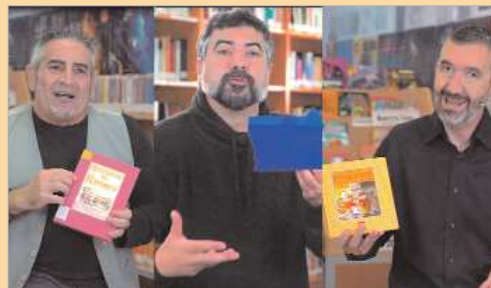
La Ventana de la biblio empieza con cuentos infantiles.