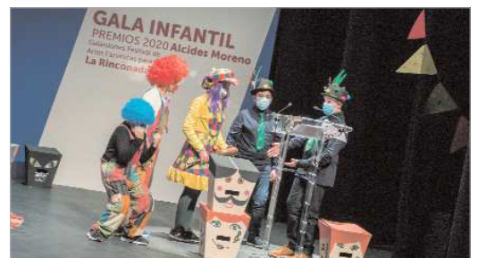
Estos premios tienen de especial que son entregados por un Jurado Infantil.