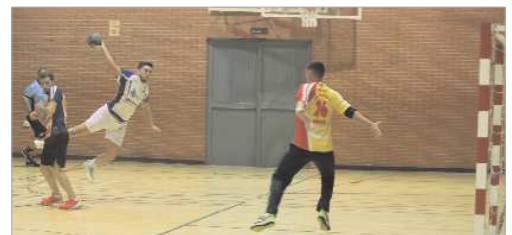
El BM San José sumó ante Martia la segunda victoria del curso.