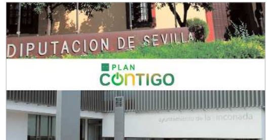
La Rinconada dispondrá de cinco millones de euros del Plan Contigo.

Y, en este sentido, La Rinconada, que sigue trabajando, no sólo implementando programas propios, sino también con estrategias transversales con otras administraciones y cofinanciando proyectos de entidades supramunicipales que repercutan en la ciudadanía del municipio, tiene previsto adherirse a esta iniciativa, lo que se aprobará en el próximo Pleno municipal y permitirá una cofinanciación de proyectos de cerca de cinco millones de euros adicionales para inversiones y Agenda Urbana, reactivación económica y social, ayudas de emergencia, planes de empleo, vehículos ecoefi-