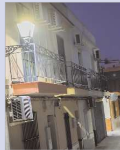
Iluminación de La Rinconada.

ciones en el resto de la localidad y se prolongará hasta diciembre de 2022 y, en este caso, estará cofinanciado por el Instituto para la Diversificación y Ahorro de la Energía (IDAE), dependiente del Ministerio para la Transición Ecológica. En esta ocasión, el nivel de inversión será de 3.718.627,67 € y la reducción de consumo de energía eléctrica con respecto a años anteriores rondará el 63 por ciento. Esta fase abarcará la sustitución de 5.817 luminarias que redundará en una reducción de 1.114 toneladas de emisiones de dióxido de carbono al año al pasar de 893 kW instalados actualmente a 270 kW.