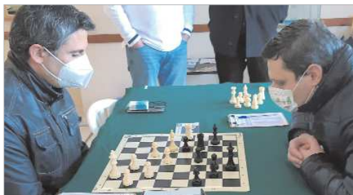
Uno de los enfrentamientos de la ida del ascenso a División de Honor.

Los rinconeros vencieron en la ida al Casino Primitivo de Jaén por 4-0 y, salvo debate, logrará el objetivo