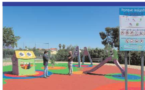
Hasta quince parques de la localidad renovarán el suelo de sus zonas infantiles.

Estas acciones se suman a las implementadas al inicio del curso, cuando se había trazado un plan para minimizar los posibles riesgos de contagio en las aulas, incluso antes de la decisión de la vuelta presencial. A las tradicionales mejoras que se llevan a cabo en los centros educativos durante el verano, se unía en esta edición un Plan Covid-19 para los centros educativos, que contemplaba la desinfección y limpieza constante de los espacios, además de una persona por la mañana para la limpieza por colegio, como refuerzo para las zonas de mayor tránsito o de uso continuado. Además, se instalaban en torno a 400 dispensadores de gel hidroalcohólico repartidos entre ellos, cartelería en las aulas enfocadas al público infantil con las recomendaciones sanitarias y las medidas oportunas, murales en las puertas con mensajes de motivación ante la pandemia y un protocolo de reorganización de entrada y salida a los centros para evitar las aglomeraciones y conseguir mantener el distanciamiento social.