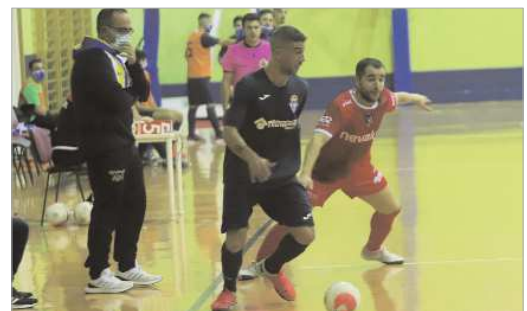
Viola se lleva el balón durante un encuentro del Tres Calles.

Una semana más tarde, llegaba uno de esos envites en los que no se esperaba puntuar, ante el líder, el Alcalá FS, a domicilio. Y, aunque se cumplieron los pronósticos, el equipo cuajó un gran partido, adelantándose dos veces en el marcador y sólo cediendo al final, con dos goles en el último minuto (5-2), lo que permite ser optimista dentro de sus opciones y el potencial rival.