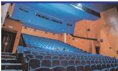
Vista del patio de butacas en el interior del Centro Cultural de La Villa.

con buenos servicios públicos, zonas de esparcimiento y contacto con el medio ambiente, y una amplia y variada oferta cultural y deportiva".