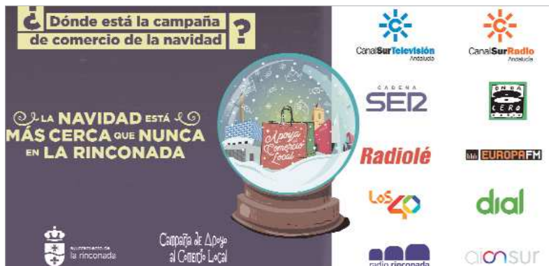
La Campaña de Navidad ha gozado de gran promoción en diversos medios de comunicación.

Ya el lema que se elegía, 'La Navidad está más cerca que nunca en La Rinconada', hacía referencia a las limitaciones de movilidad y a las medidas sanitarias de seguridad ante la pandemia del Covid-19. Como explica la edil de Comercio, "hemos trabajado mucho para compaginar dinamización de calles