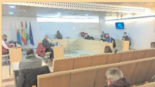
Sesión Plenaria en la que se aprobó el Plan para la Infancia y Adolescencia.

Este Plan forma parte de los hitos comprometidos por el Consistorio para ser considerada por Unicef como 'Ciudad