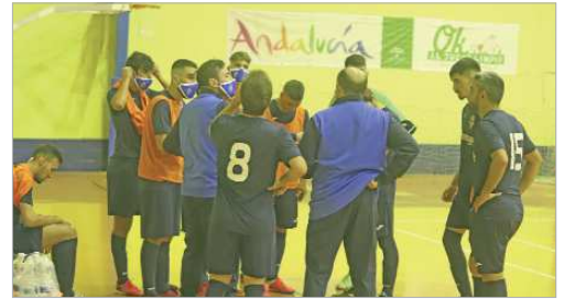
Imagen del partido ante Los más Pitufos en el Fernando Martín.

Finalizaba la primera fase del Grupo 17 de la Tercera Nacional de Fútbol Sala y lo hacía con buen sabor de boca para el Tres Calles de Domingo Ramírez, que se despedía de la misma con una victoria ante el Nevaluz. Con ella,