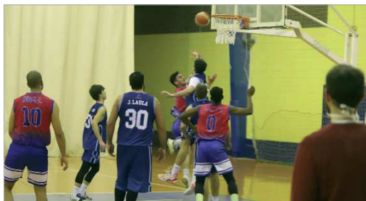
Imagen del duelo en el Agustín Andrade entre Wifiguay La Vega y Qalat.

Los rinconeros, que aspiran a meterse en los Play Off de Ascenso, han derrotado con solvencia a Qalat y Paradas