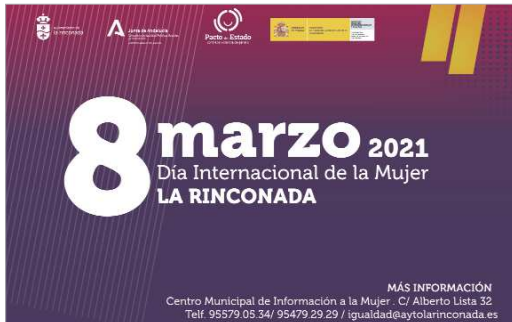
Cartel promocional del Día 8 de marzo en La Rinconada.

El compromiso del Ayuntamiento de La Rinconada es perfectamente constatable a lo largo del tiempo. 30 años lleva en plena efervescencia el Centro Municipal de Información a la Mujer con un compromiso claro, que no es otro que la equiparación de derechos y el avance hacia la igualdad real de género. Este año, se cumplen, además, diez años de la inauguración de la actual sede, en la calle Alberto Lista, que suponía la dotación de un edificio exclusivo para el desarrollo formativo y orientativo de las políticas de Igualdad de La Rinconada.