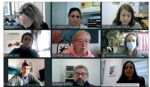
'Raíces emocionales', un nuevo proyecto del área de Juventud.

'Raíces emocionales' se llevará a la práctica durante los meses de abril y mayo de 2021. Se desarrollarán tres talleres sobre educación en valores, diálogo intercultural e inclusión social; sensibilización desde el flamenco social; y circo social. Los talleres se desarrollarán en el 'Centro Joven La Estación'. Asimismo, la creación del producto final del proyecto, se basará en un trabajo que se llevará a cabo en el mismo escenario. También en La Rinconada tendrá lugar la puesta de largo y ensayo general de la representación del producto final creado.