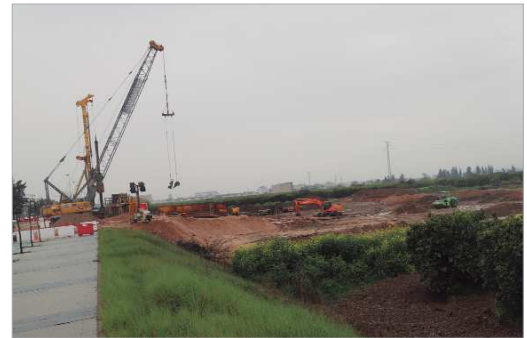
Las obras del Viaducto, a la altura de la Avenida de La Unión.

San José a la altura de la Central Mixta de Seguridad, o viceversa. El desarrollo de las actuaciones corre a cargo de Unión Temporal de Empresas (UTE) Obrascón Huarte Lain-UC10, a quien se le adjudicó la obra por un total de 18,4 millones de euros. Se trata de la fase dos del vial metropolitano de acceso