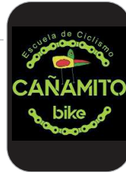
Cañamito Bike Ciclismo

El joven deportista rinconero acaba de proclamarse campeón de Andalucía Sub 20 de Triple Salto en un evento celebrado en Antequera en el que consiguió su mejor marca personal con un salto de 14,19 que le valió para colgarse la medalla de oro.