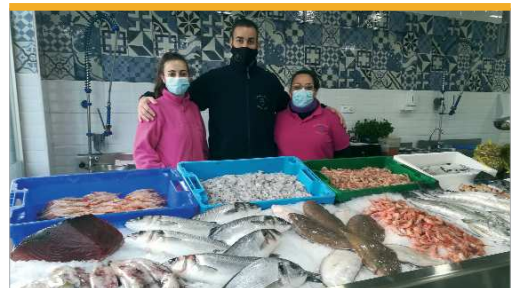
Pescadería Cascales, en Avenida Jardín de las Delicias.

Entre los proyectos de futuro se encuentra abrir una tercera tienda en la Calle San Cristóbal, donde poder encontrar tallas especiales y complementos personalizados