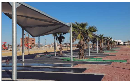
El recinto 'El Abrazo' tendrá una tipología única en la provincia.

características que no tiene ningún otro sitio en la provincia de Sevilla. Se sitúa como una pieza central en el Eje del Agua, que transcurre por la localidad desde Las Graveras al Guadalquivir en el parque El Majuelo, convirtiéndose en otro pulmón en la red de espacios libres del municipio. Consta de una gran plaza central, un edificio multiusos, jardines ornamentales, juegos infantiles, juegos saludables, pistas depor-