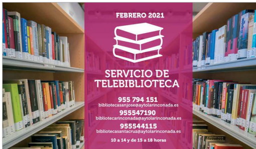
'Telebiblioteca', una apuesta del área de Cultura en tiempos de Covid-19.

El Ayuntamiento de La Rinconada, a través del área de Cultura, con motivo de las nuevas medidas restrictivas por el aumento de la incidencia de casos de Covid-19 en La Rinconada,