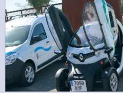
Se adquirirán vehículos ecoeficientes.

ficientes. Por ello, el Ayuntamiento ha adquirido un furgón eléctrico de dos plazas, con autonomía de 200 kilómetros que permite, además, de una mayor limpieza y desinfección, el transporte de personal de limpieza, herramientas y material. A ello destina cerca de 30.000 euros