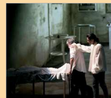
'J&H', de Aura Flamenca.

A mayores, durante la primavera, en el marco del día del libro se llevará a cabo la 'Estación de las letras' y sus encuentros literarios