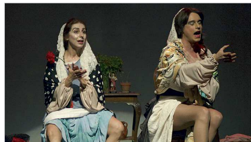
'En Sevilla hay que vivi', de La Pava Teatro, en La Villa el próximo 16 de abril.