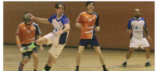
Imagen de archivo de un duelo de la Fase Regular