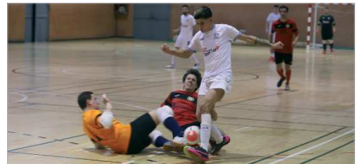
El BM San José sumó ante Martia la segunda victoria del curso.

El San José FS es un equipo de rachas, demasiado irregular. Capaz de sumar seis triunfos seguidos y perder tres consecutivos en el momento clave de la competición. En su último envite, caía por 3-1 en San Juan, lo que propicia que los