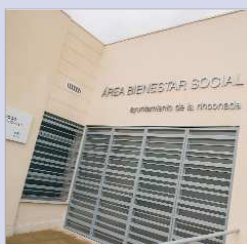
Nuevo edificio de Bienestar Social.

El Presupuesto Municipal contempla 600.000 euros, complementados con 500.000 más del Plan RESET, para prevenir la exclusión social y lanzar ayudas de emergencias a las familias