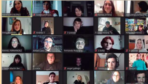
Imagen del streaming del 'Mentor Day', del programa 'Talento Emprendedor'.

El Ayuntamiento de La Rinconada, a través del área de Juventud ha puesto en marcha un nuevo programa formativo que, bajo el nombre de 'Talento Emprendedor', tiene como objetivo dotar a los alumnos de las habilidades, capacidades y valores que les faciliten el autoempleo y mejoren las perspectivas de empleabilidad en el futuro, al mismo tiempo que se fomentan los valores de responsabilidad, compromiso y esfuerzo junto a su desarrollo personal y profesional. Dentro de las actividades que desarrolla, ha celebrado el 'Mentor Day', una acción donde se ha acercado a los jóvenes participantes la posibilidad de cono-