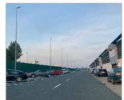
Nuevos aparcamientos en Aerópolis.

Además, también se ha actuado en la vía pública en el entorno de esas nuevas urbanizaciones, dotándolas de mobiliario urbano y elementos de señalética, a la vez que se han llevado a cabo labores de desbroce y adecuación de los espacios para ganar en calidad de vida.