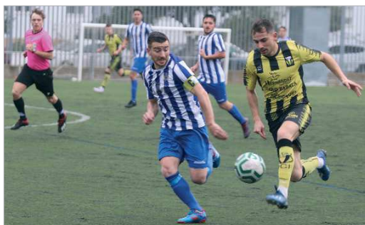
Charro persigue a un jugador del Villafranco en el último duelo en casa.

Los de Nando de la Rosa han dejado sus mejores momentos de la primera fase ante los equipos de arriba, mientras que han sufrido una sangría de puntos ante los que pelean por la permanencia