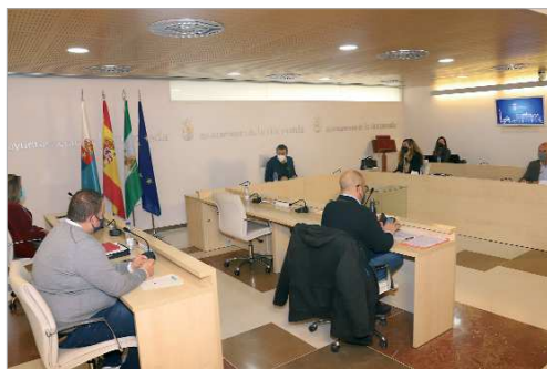
Pleno municipal en el que se aprobó el Plan Contigo.

Entre las acciones previstas, se encuentran acciones formativas referentes a digitalización (15.000 euros); dos ediciones de Aceleradora de Empresa, que se enfoca en formación intensiva y mentorización para impulsar negocios viables (40.000 euros); formación para empresas y emprendedores (planes de negocio, competencias, fiscalidad, comercio exterior...) a través de La Rinconada Punto de Encuentro Empresarial (20.000 euros); crea-