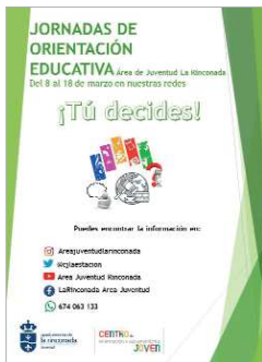
Jornadas de orientación educativa.

El área de Juventud editará diferentes videos explicativos con la oferta formativa local y provincial, para ayudar a la toma de decisiones al alumnado, principalmente de 4º de ESO y de 2º Bachillerato