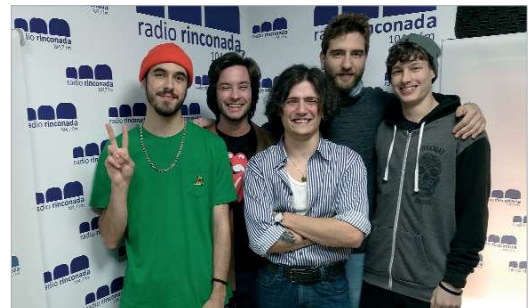
'The Surroyal', tras presentar su último single en Radio Rinconada.

las plataformas el 18 de febrero, coincidiendo con la visita del grupo a los estudios de Radio Rinconada. Como ellos mismos la