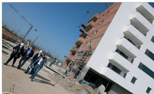
El alcalde, Javier Fernández, tras finalizar la visita a las 30 VPO de La Unión.

Para ampliar información, se puede contactar con Soderinsa en el teléfono 95 579 05 70 o en info@soderin.com .