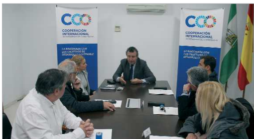
Imagen de archivo de la última entrega de subvenciones, antes del Covid-19.

En esta convocatoria tres entidades locales, Hulmen Luz, Ananaw Wasi e Infancia Solidaria podrán seguir trabajando por la Salud y la Educación gracias a sus respectivos proyectos que se ejecutarán en Togo, en Perú y en Guinea Bissau. El mantenimiento de la Guardería Atachiarare, el proyecto educativo en Cuzco y el Centro