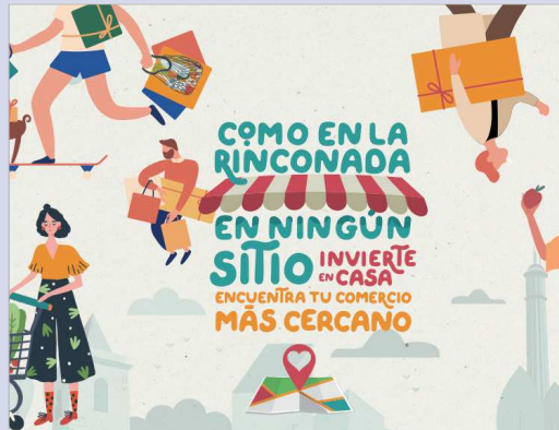
Cartel promocional de la última campaña lanzada por el área de Comercio.

Además de las acciones ya mencionadas, 'Como en La Rinconada, en ningún sitio' incluye la creación de un mapa en el que se reflejan los comer-