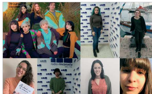
Collage de los protagonistas que han pasado por el programa 'Andén 21'.