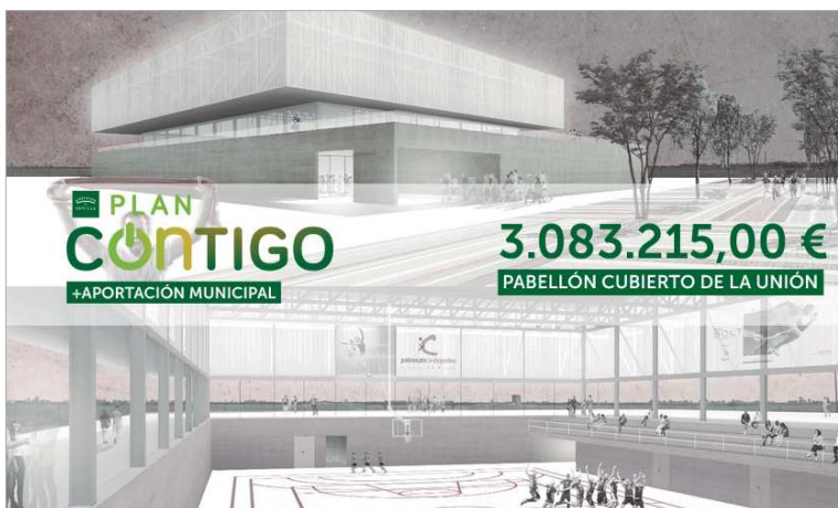
Imagen virtual del nuevo pabellón deportivo que se va a construir en los suelos de La Unión.

Entre las bondades de la nueva instalación, a mayores de la optimización de servicios públicos