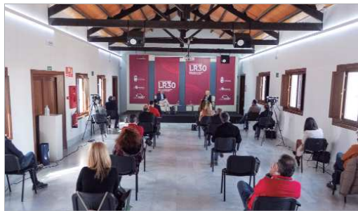
El público pudo asistir con todas las medidas de seguridad.

bilitaron que yo pudiera estudiar y fuera la primera de una familia de ocho hermanos en poder hacerlo", abogando por "tener la altura de miras necesaria para posibilitar duran-