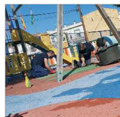
Trabajos de renovación del caucho.