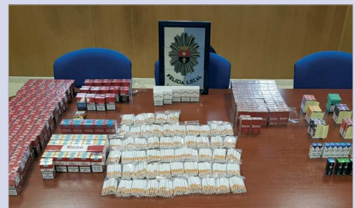
Imagen del tabaco de contrabando aprehendido en La Rinconada.