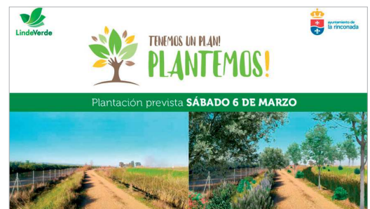
La primera plantación se realizaba el pasado sábado.

quieran colaborar en este proyecto, eligiendo un árbol o arbusto, plantándolo con sus propias manos y comprometiendo a su cuidado, cada revegetación será llevada a cabo por voluntarios coordinados por los técnicos de 'Linde Verde'. Así, quienes