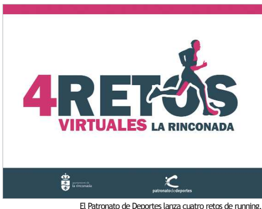
El Patronato de Deportes lanza cuatro retos de running.

Se trata de iniciativas de running consistentes en cubrir varias distancias y enviar el resultado a través de cualquier aplicación GPS. Habrá obsequio para los cien primeros en hacerlo