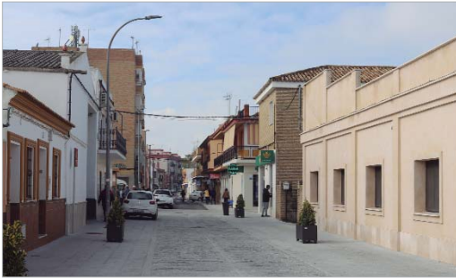
La Calle Manuel de Rodas ha experimentado un gran impulso modernizador.

Manuel de Rodas, Paseo del Majuelo, Virgen de los Dolores o Virgen de Gracia han cambiado su fisonomía. Las obras, desarrolladas por Emasesa, cuyo origen fue la renovación de las redes de abastecimiento y saneamiento, han servido para dar un importante impulso modernizador a la zona, dentro de un plan integral de todo el entorno