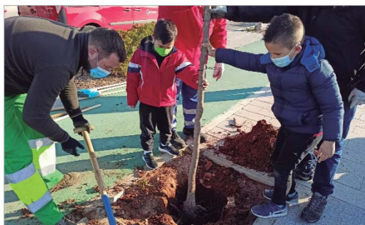
El alumnado de La Rinconada ha tomado parte en el Plan Árbol.

Bajo el título ¡Planta vida, planta árboles!, el alumnado ha sembrado árboles en los recintos, comprometiéndose, además, al cuidado y mantenimiento de los mismos.