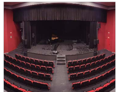
El teatro puede cubrir las necesidades de las compañías.

El centro cultural dispone de nuevos equipamientos de iluminación y sonido. Ambas dotaciones, financiadas con cargo a casi 50.000 euros procedentes del Plan Supera VII de la Diputación de Sevilla. De esta manera, el centro también actualiza en todo lo relativo a luz y sonido destinados a los espectáculos en una adaptación integral a las nuevas tecnologías y respondiendo al paradigma del ahorro energético requerido. Con estos nuevos equipamientos, se ha ampliado el número de obras que puede recibir el teatro al poder cubrir cualquier necesidad requerida por las diferentes compañías en sus montajes. En este sentido, la oferta programática del centro se ve irremediadamente ampliada revertiendo positivamente en el público asistente.