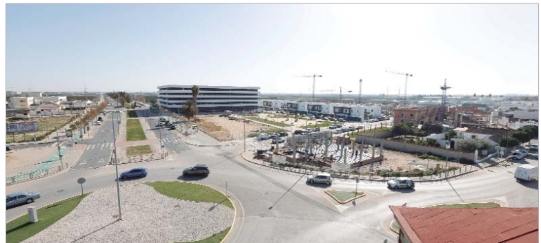
Las obras del nuevo Juzgado de Paz avanzan a pleno rendimiento.

A mayores, en estos momentos se está trabajando en el acceso que comunica Las Ventillas con la Autovía de Acceso Norte, creando una salida del Polígono '28 de Febrero', que enlace con la vía. La empresa Inmova, en colaboración con el Consistorio, está llevando a cabo las actuaciones.