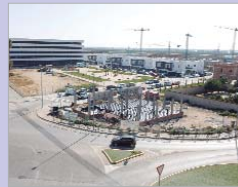
Vista del nuevo Juzgado de Paz.