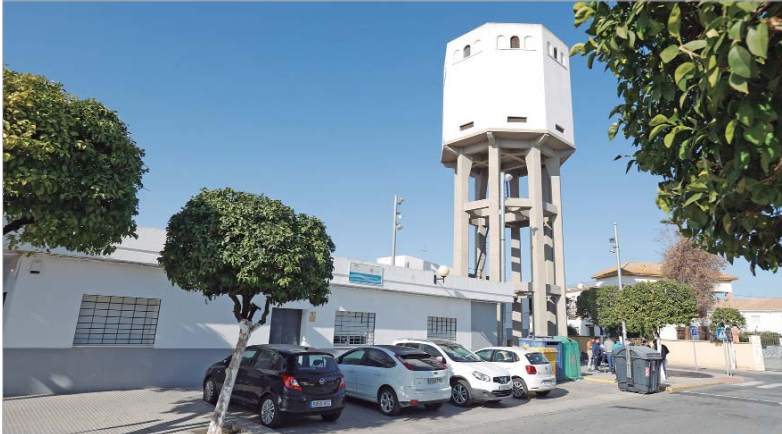
Fachada de las dependencias de Servicios Sociales en el núcleo de La Rinconada.

El traslado del Centro de Adultos a las antiguas dependencias del Juzgado de Paz permitirá liberar espacio para dos aulas más en la Unidad de Trabajo Social de La Rinconada