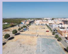
Solares de autoconstrucción.

experimentando una modernización sin precedentes. Existe un plan integral de actuación en el municipio, que está conformando un puzzle para optimizar las dotaciones y servicios. Muchas actuaciones se han desarrollado en el centro histórico y comercial del núcleo de Rinconada, donde no hay espacios para expandirse, lo que nos ha obligado a ejecutar, de manera simultánea, numerosas actuaciones para alcanzar el fin deseado. Hemos modernizado los accesos al municipio y el centro histórico y comercial, aprovechando las actuaciones no sólo para mejorar la estética, sino para ser un municipio más funcional, accesible y eficiente, que apuesta por la movilidad peatonal, el medio ambiente y el desarrollo sostenible. Además, hemos puesto en servicio el Centro Cívico 'Los Silos', trabajamos en un nuevo Mercado de Abastos y un nuevo Juzgado de Paz, cuya construcción implica adecuación de instalaciones y servicios para hacerlos más óptimos para la ciudadanía. Ampliamos los servicios Sociales y las dotaciones para el tercer sector, hemos remodelado el Centro Cultural Antonio Gala y vamos a hacer lo propio con el pabellón Agustín Andrade, y hemos reubicado al alumnado del IES Antonio de Ulloa mientras se ejecutan las obras de ampliación del centro.