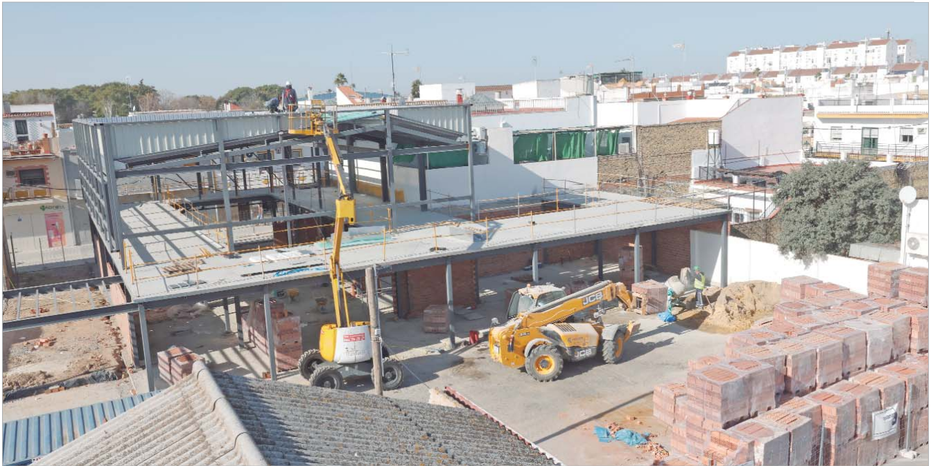
Vista aérea de las obras del Mercado de Cercanía que se ubica en el entorno de Manuel de Rodas y calle Virgen de Gracia.