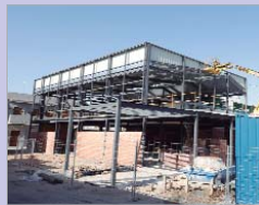
El nuevo Mercado de Abastos.

A mayores de la situación sanitaria, ¿cómo valora las actuaciones que se están llevando a cabo en La Rinconada? Creo que el núcleo de Rinconada está