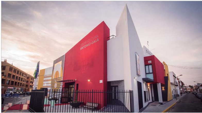
Nueva estética del Centro Cultural Antonio Gala tras su renovación integral.

En esta legislatura este edificio singular ha sido sometido a una remodelación integral con cofinanciación de Fondos FEDER, con un presupuesto próximo a los 700.000 euros, nueva fisonomía, que incluye mayor aforo, sala de exposiciones y nuevas dependencias para compañías y participación ciudadana. Se han sumado nuevos equipamientos de iluminación y sonido, financiadas con casi 50.000 euros procedentes del Plan Supera VII