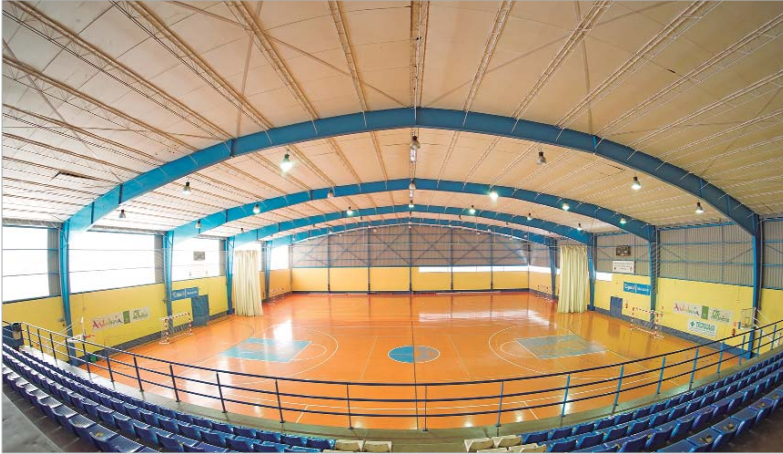
Vista interior del pabellón Agustín Andrade, cuyas pistas e iluminación se van a renovar próximamente.

El pabellón cubierto de La Rinconada va a sustituir el pavimento y la iluminación en los próximos meses