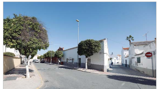
La Tercera fase comprende la construcción de 39 viviendas.

estos momentos, se última El Plan Especial de Reforma Interior (PERI) con la idea de que todo esté listo para comenzar durante el primer trimestre del año. En total, se va a construir 39 viviendas de diferentes tipologías, desde renta libre hasta con distintos tipos de protección.