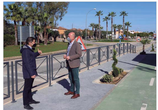
Se ha actuado en las entradas desde San José y desde Sevilla.

lares a los situados en la confluencia de las calles Cultura y Alcalde Pepe Iglesias, así como, algunos parterres, con una inversión total de 19.000 euros provenientes también del presupuesto de Servicios Generales. El edil de Infraestructuras Públicas refiere que "éstas han sido actuaciones del plan integral de renovación y mejora de dotaciones existentes en la vía pública, así como de la modernización continua de la escena urbana, que ha supuesto un importante salto cualitativo a efectos estéticos en la imagen del núcleo de La Rinconada".