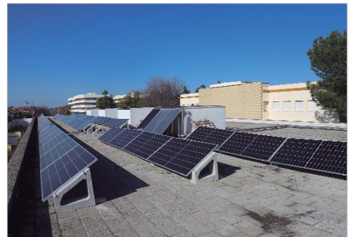
El Guadalquivir tendrá placas fotovoltaicas para lograr ahorro energético.

Como señala el delegado de Educación, Antonio Marín, "la instalación de paneles solares en los centros educativos no solo supone un ahorro energético, también implica que el alumnado conozca alternativas energéticas sostenibles y su importancia para el futuro de su entorno". En líneas generales, en los meses más soleados, el ahorro energético puede llegar a suponer hasta un 70% del total de luz.