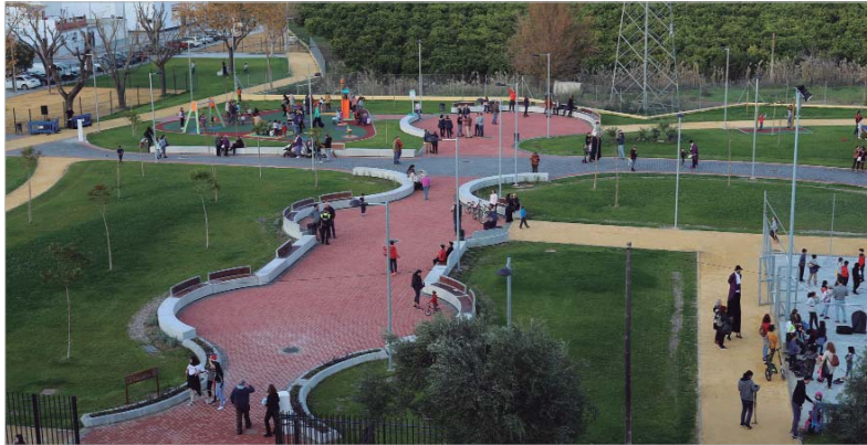
Vista panorámica del parque La Caldera, un nuevo pulmón en el núcleo de Rinconada.

El recinto, cofinanciado con Fondos FEDER con una inversión superior a los 600.000 euros, se ubica en el entorno de Lomas del Charco y Huerto de Benito