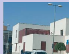
Centro de Salud de Rinconada.

recogía las quejas de la ciudadanía y las trasladaba al Defensor del