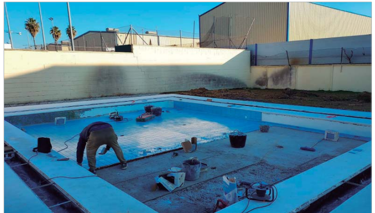
Operarios municipales han actuado en el vaso de chapoteo de la piscina Antonio Romero 'El Negro'.