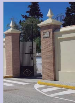
Cementerio de La Rinconada.

"Es un tema de sensibilidades, de nostalgia y de valores, los vecinos y vecinas sienten que ese cementerio les pertenece, y quiero agradecerles que han sabido estar a la altura en cada momento del proceso"