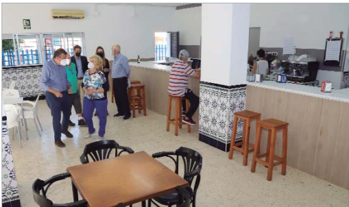
Las actuaciones se han centrado en la zona de servicios.

Las áreas de Infraestructuras Públicas y Mayores han acometido una ambiciosa reforma del bar del Centro de Día de La Rinconada, '20 de Julio', a raíz de la escucha activa de sus usuarios y usuarias y tras una reunión con la Junta Directiva.