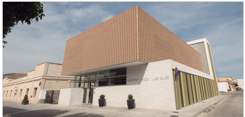
Exterior del Centro Cívico Los Silos.

Las actuaciones han tenido un coste superior al millón de euros, provenientes del Fondo de Desarrollo Regional (FEDER), a través del proyecto 'Ciudad Única'.