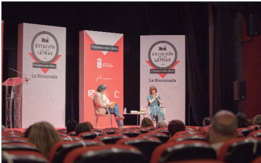
Irene Vallejo, Premio Nacional de Ensayo, en el Gala.