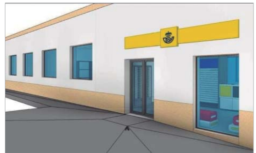
Imagen virtual del edificio de Correos tras las obras de ampliación.