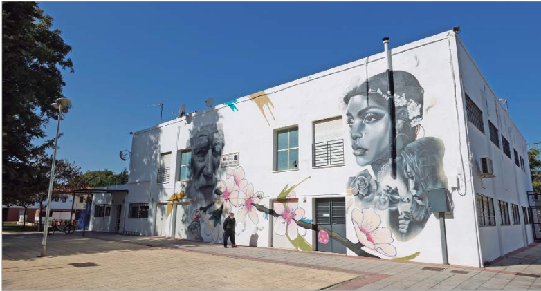
El Ayuntamiento ha llevado a cabo una importante modernización en las dependencias del Centro '20 de Julio'