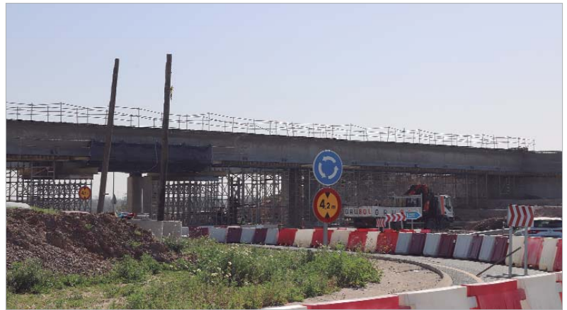
Las obras del Viaducto que cruzará en altura los suelos de La Unión avanzan según los plazos previstos.