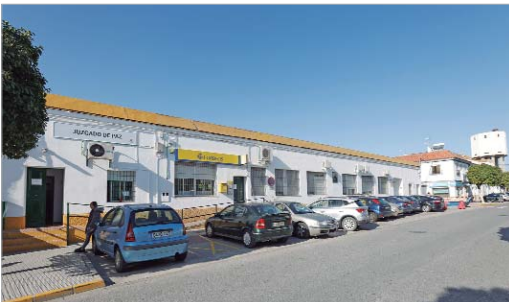
El edificio de Correos se va a ampliar para mejorar los servicios.

Invertirá 200.000 euros para anexionarse parte de las instalaciones del actual Juzgado de Paz, lo que le permitirá mejorar el servicio y ampliar el personal