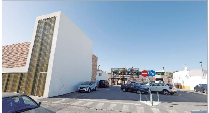
Compromiso municipal para crecer de forma ordenada, con dotaciones que cubran las necesidades de la población.

tes a la nueva dotación pública, también venía a descongestionar el casco histórico de La Rinconada y a favorecer -con la peatonalización de Virgen de Gracia-, la movilidad a pie. Además, también ofrece servicio al Nuevo Mercado de Abastos, aunque éste lleva un