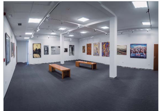
Nueva Sala de Exposiciones.