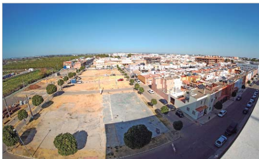
La zona de la antigua Feria tendrá viviendas de autoconstrucción.

A mayores, también habrá doce solares para viviendas de protección oficial en el entorno de Huerto Benito y el parque La Caldera que, aunque no serán de autoconstrucción, sí están sujetos a los mismos requisitos.