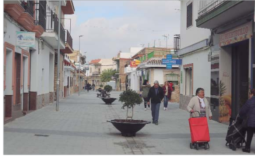
La calle Virgen de Gracia se ha peatonalizado completamente.

La Rinconada se encuentra desarrollando un Plan Integral que tiene como finalidad una modernización sin precedentes del centro histórico y comercial del núcleo de La Rinconada, con la idea de aumentar la accesibilidad, la funcionalidad y la movilidad sostenible, generando espacios de convivencia en los que la prioridad es para el peatón.