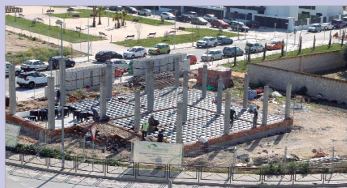
Solar en el que se levanta el nuevo Juzgado de Paz.

Con esta nueva infraestructura, La Rinconada mejora el espacio y las condiciones tanto de los trabajadores del centro como de los usuarios del mismo, tanto de puertas para adentro del edificio, como en el entorno. Y es que la nueva dotación contará con una Sala de Usos Múltiples, despachos para el juez y secretario, despacho de uso polivalente y dos oficinas de atención al ciudadano; pero también con una tipología de doble circulación y diferente acceso para que usuarios y personal no interfieran entre sí. El nuevo edificio se encuen-