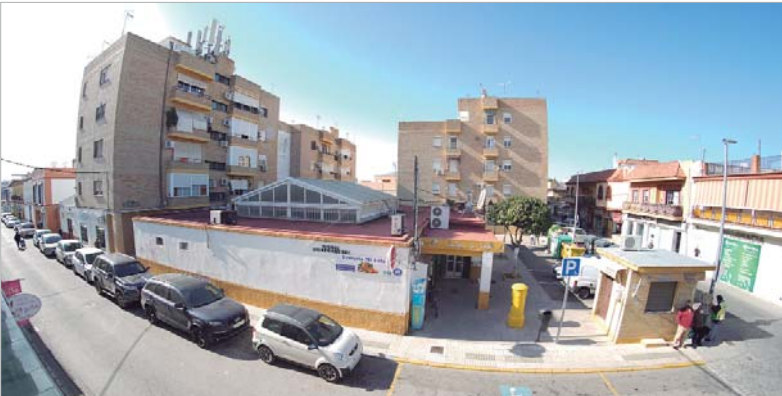
La demolición de la antigua Plaza de Abastos traerá a este entorno una nueva plaza para ocio y esparcimiento.

Una vez se abra la nueva instalación, el antiguo edificio será derribado, permitiendo una nueva zona para el disfrute ciudadano que estará integrada en la peatonalizada Virgen de Gracia y en Manuel de Rodas