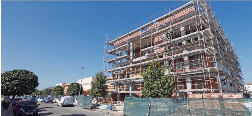
Las obras de ampliación del IES Antonio de Ulloa, avanzan según los plazos previstos y estarán finalizadas para el próximo curso.

El Instituto de Enseñanza Secundaria Antonio de Ulloa de La Rinconada sigue avanzando en su ampliación, que tiene como objetivo aumentar la capacidad para el alumnado, así como mejorar los servicios y prestaciones que ofrece el centro educativo. En concreto, se van a ejecutar seis nuevas aulas, así como zonas comunes, se va a colocar un ascensor y se van a ejecutar nuevos aseos. El plazo de ejecución de las obras es de ocho meses, por lo que deben estar finalizadas en torno al próximo mes de mayo.