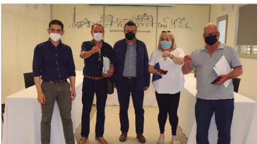
El antiguo Salón Rurra se ha dividido para acoger a tres asociaciones.