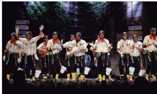
'Los del verdadero TikToc' se hacen con el premio al mejor piropro a Rinconada