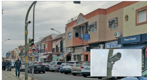
Cámara de vigilancia en el cruce entre calle Madrid y calle Cultura.