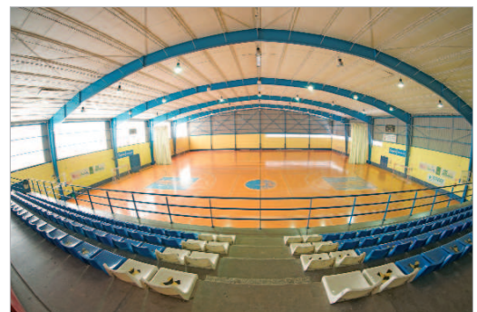
El pabellón Agustín Andrade 'Gorri' renovará el pavimento y la iluminación.

pista del Agustín Andrade necesita una renovación porque el pavimento está deteriorado por el uso, por lo que desde el Patronato vamos a actuar para optimizar sus prestaciones. El edil añadió que, "también vamos a sustituir la iluminación para lograr una mayor eficiencia energética, dentro del plan integral por el medio ambiente que lleva a cabo el Consistorio".