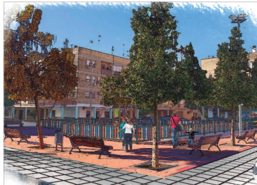
Infografías del aspecto que tendrá la barriada Santa Cruz tras la reforma integral.

El Ayuntamiento de La Rinconada va a acometer una renovación integral de la Barriada Santa Cruz, que va a suponer una modernización sin precedentes.