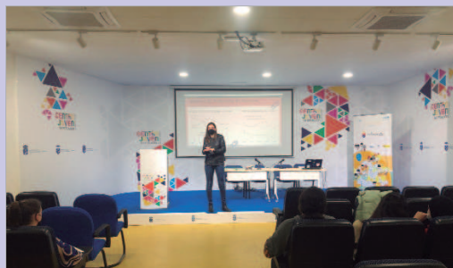
La delegada de Juventud en una de las reuniones del Órgano.

Este galardón obliga a considerar a los niños y niñas como protagonistas de esas agendas, a escucharles y a llevar a cabo las acciones necesarias para hacer realidad las decisiones que tomen en sus espacios de participa-