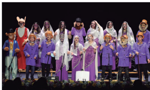
Los alumnos del CEIP Los Azahares presentaron su repertorio en el Gala.