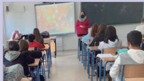
Alumnado de un centro educativo en el programa de Juventud.

Para ello, este grupo de alumnado, propuesto por el centro, trabaja en trece sesiones contenidos de autocontrol, autogestión, igualdad, tolerancia, respeto, homofobia, racismo, xenofobia, emociones y convivencia.