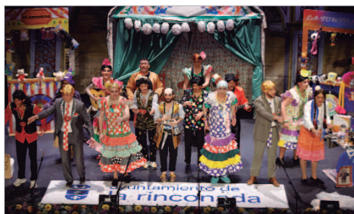
'La última y no nos vamos', primer premio en chirigota.