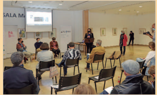
Mesa redonda sobre el proyecto en la que intervino la edil de Cultura.