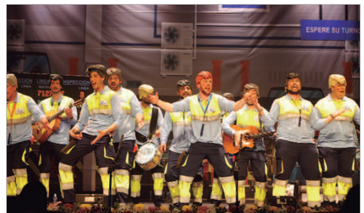
‘Aquí no pasa ni Dios’ en su actuación en la final.