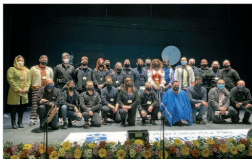
Equipo de trabajo en la edición del Carnaval 2022.