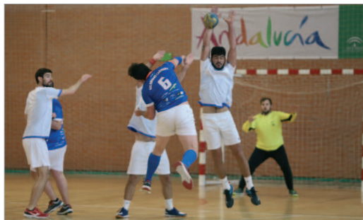
El BM San José tras dos derrotas, sumaba ocho victorias consecutivas.

Pocos esperaban que el Balonmano San José peleara por el ascenso, después de los dos primeros partidos de la competición, saldados con derrota ante Lebrija y CBMU. La disparidad de nivel en el