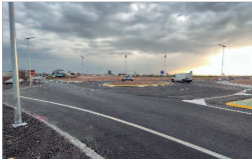
Una glorieta permite el acceso a la fábrica sin pasar por el núcleo urbano.

Esta nueva ha supuesto una inversión de 80 millones de euros en