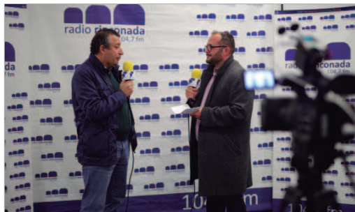
El alcalde asistió a la gran final y habló con Radio Rinconada.