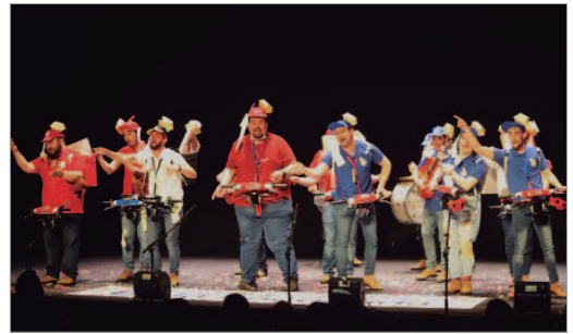
La chirigota local ‘Calentita te la vas a comer’ en las tablas del Antonio Gala.