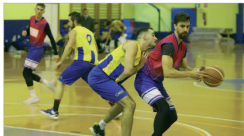
El Wifiguay trata de reengancharse a los mejores de su grupo.

Cinco semanas sin ganar eran demasiadas. Tres derrotas, algunas frente a rivales directos, como el Fresas, y dos partidos aplazados por casos de Covid en sus rivales.