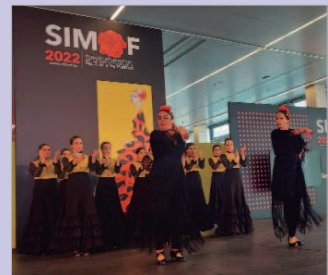
La Academia Antonia de los Santos.