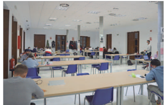
Sala de estudios de la biblioteca Hacienda Santa Cruz.

Como señalan desde las bibliotecas, "tras esta nueva edición volveremos a escuchar las peticiones de los estudiantes y también analizaremos las cifras en las diferentes franjas horarias, para seguir mejorando el servicio". En cuanto a horarios, el grueso de estudiantes se da de lunes a viernes y prevalecen las horas de mañana y tarde.