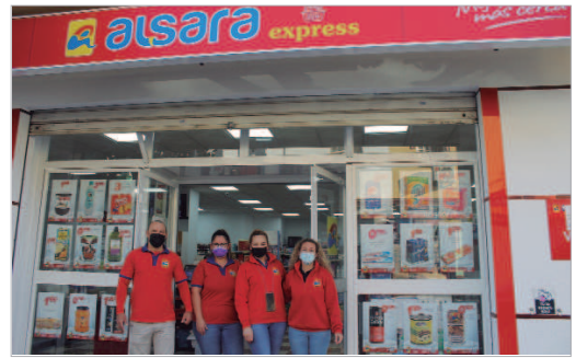
Equipo del supermercado Alsara en la puerta del establecimiento.

das cantidades también son promociones presentes a lo largo del año. Ofrecen también la posibilidad de preparar una compra previamente y realizar encargos de productos determinados. Además durante el confinamiento por la pandemia, el por entonces Supermercado Victoria ya ofrecía llevar a domicilio las compras. Y es que todo en sí en 'Alsara La Rinconada' es un tándem de calidad y trato cercano con su clientela. El nuevo local se ubica concretamente en la calle Carretera Nueva, ahora en el número 25, en