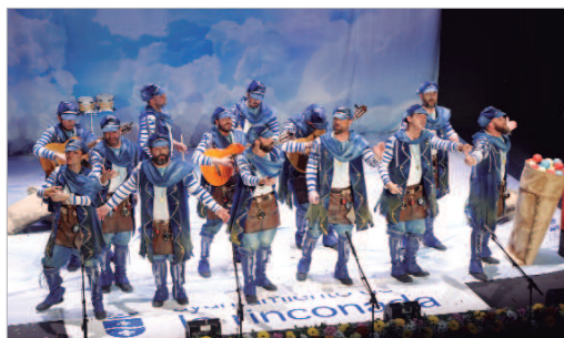
La comparsa 'Padre Nuestro' se hace con el primer premio de esta modalidad.