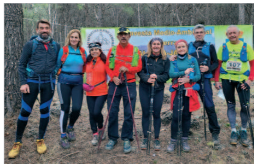
El equipo del Club Senderismo La Vega, en la prueba.

En esta primera prueba el club local de senderismo ha sumado el máximo total de puntos posible (24).