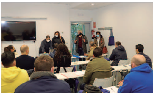
El edil de Educación visitó al alumnado en el primer día de clase.