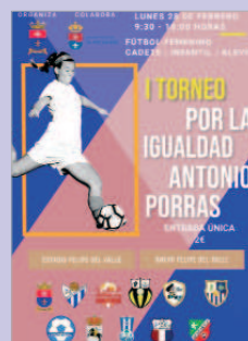
Cartel del Torneo de fútbol.

En este calendario de acciones, pendiente aún por cerrar algunas actividades, el CMIM cuenta con el compromiso de múltiples colectivos y la coordinación de todas las áreas municipales. Así en materia deportiva, los días 27 y 28 de febrero se celebra el I Torneo por la Igualdad Antonio Porras. En marzo está prevista una charla coloquio sobre fútbol femenino.