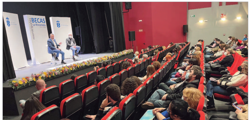
El alcalde, junto al delegado de Educación en la entrega de becas universitarias en el teatro Antonio Gala.

Estas ayudas al estudio se suman a las 250 becas para Bachillerato y Ciclos entregadas el pasado mes de diciembre y a las de Segundo Ciclo de Infantil, que superaron las 300 unidades, lo incrementa el total invertido en becas municipales a 123.000 euros. Ello se une a las subvenciones para AMPAS y Centros educativos, el servicio de auxiliares de apoyo al Ciclo de Infantil, que financia íntegramente el Ayuntamiento, o el mantenimiento de los centros educativos.