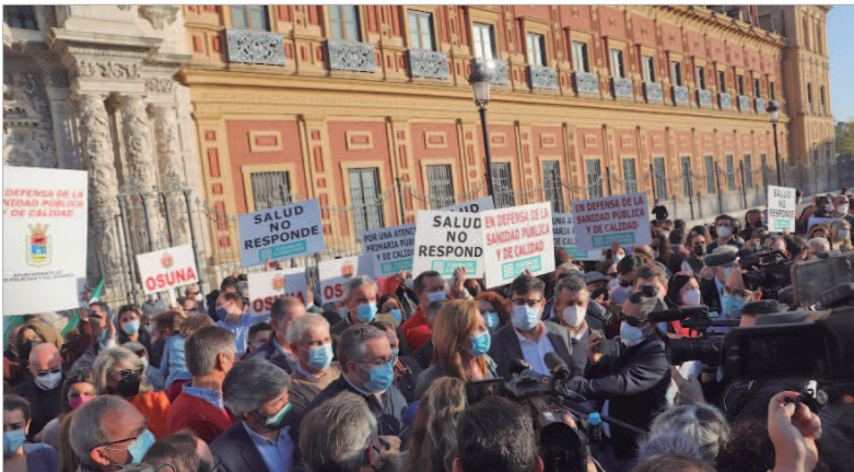
La Rinconada forma parte de esta Plataforma por la Sanidad Pública.