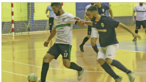
Imagen del duelo entre el Tres Calles y el Águila de Pedrera.

El Tres Calles hizo historia al meterse en la pelea por el ascenso a Segunda b. Lo hizo sobre la bocina, ganando el último partido en Benalup pero, en la segunda fase partía lejos de los puestos de privilegio y, además, desde entonces, suma dos derrotas en casa ante el Águila de Pedrera y el filial del Córdoba Patrimonio de la Humanidad, lo que reduce aun más sus ya exiguas opciones. No obstante, el objetivo está cumplido y sólo queda disfrutar.