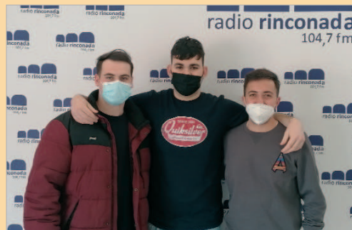
Los directores de 'La última y no nos vamos', visitaron los estudios.