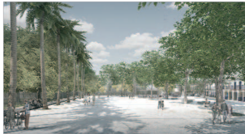
Recreación virtual del Parque Santa Cruz

Abrazo', con un presupuesto que se acerca al millón y medio de euros y