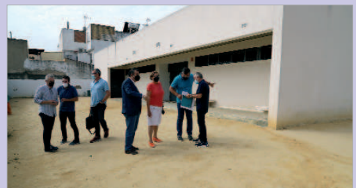
Reunión mantenida con la directora del colegio San José.

implican la ampliación del Centro Cívico Santa Cruz, un espacio público contiguo al centro educativo, de carácter polivalente en el sentido de que su uso es compartido siguiendo el modelo del parque anexo al IES Miguel de Mañara. Si bien el colegio San José lo utiliza en horarios lectivos para desarrollar las actividades propias del centro, así como las propuestas por el AMPA, una vez finaliza el horario escolar, esas mismas instalaciones acogen distintas actividades de interés municipal, principalmente vinculadas a la formación.