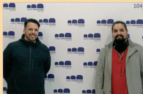
La Chirigota del Barbas, 'Los del verdadero TikToc'.