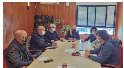
Reunión de los ediles de Salud y Educación con los directores de los centros.