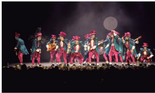
La comparsa de Morón se estrena en estas tablas con un tercer premio.