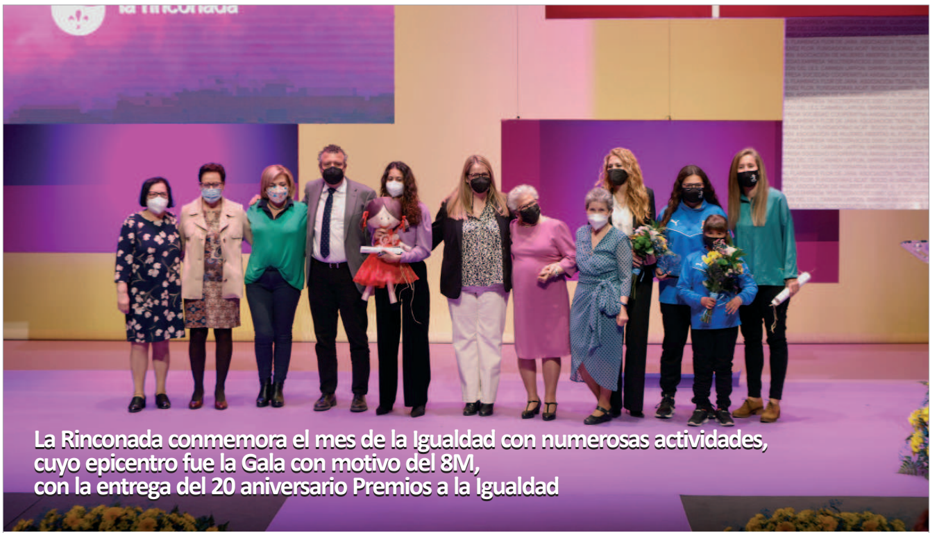
La Rinconada conmemora el mes de la Igualdad con numerosas actividades, cuyo epicentro fue la Gala con motivo del 8M, con la entrega del 20 aniversario Premios a la Igualdad