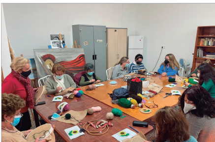
La edil de Igualdad en una visita a uno de los talleres.

La Asamblea de Cooperación por la Paz organizó 'Mujeres en ruta', un taller para la creación de una ruta cultural sobre el rol de las mujeres en la construcción social y económica del municipio. Uno de los aspectos más relevantes para avanzar hacia la igualdad es la coeducación. Los centros de Educación Infantil y Primaria recibieron el taller coeducativo 'Pepuka y el monstruo que se llevó su sonrisa' y durante los meses de marzo y abril, los centros de Secundaria y Primaria del municipio tienen diferentes talleres formativos.