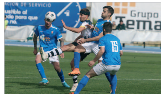
El San José perdió en casa su primer partido esta campaña ante el Mairena.