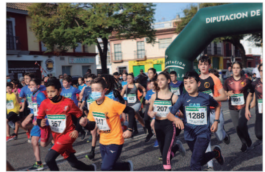
Diferentes pruebas con distintos recorridos, seña de identidad de la Popular.