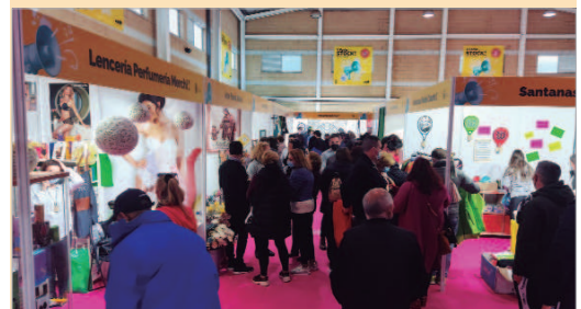
La Feria del Stock llenó de actividad comercial el Maestro Antonio Rodríguez.

Con motivo de la pasada Feria del Stock, Radio Rinconada participó de manera activa en la difusión del evento gracias a la colaboración de los comercios y artistas participantes en la misma. Para ello y durante la semana previa a la celebración del evento, la casi totalidad de las firmas con stand en el CEIP Maestro Antonio Rodríguez y los artistas que en ella actuaron, pudieron dirigirse a la audiencia avanzando los artículos, promociones y actividades que cada una de ellas iba a llevar a cabo