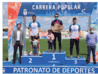
Los atletas, con sus hijos, en el podium.