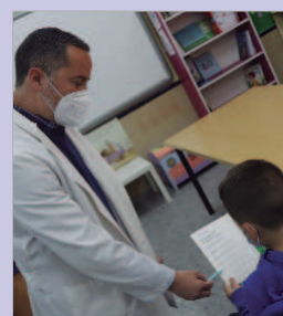
Opticalia revisará la vista a escolares.