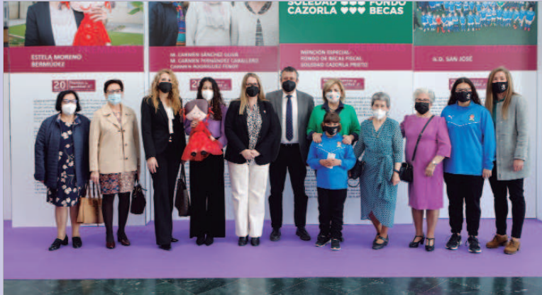
Foto de familia de todas las premiadas en los XX Premios a la Igualdad.