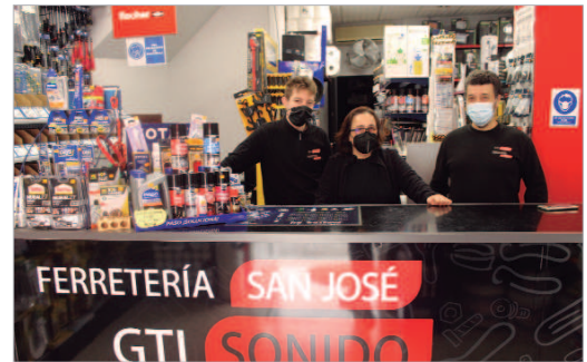
Los responsables de la empresa GTI Sonido, ahora también Ferretería.

Ambos comercios se ubican en la calle San Juan n° 7, además de