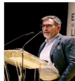
Víctor del Árbol durante su pregon.

El Centro Cultural de La Villa ha recibido al escritor Víctor del Árbol que este año ha sido el encargado de dar el pregon de la IX edición de la Feria del Libro de La Rinconada y que ha contado con alumnado de los IES locales como público. La delegada de Cultura, Raquel Vega, encargada de presentar al escritor catalán, ha definido a Víctor del Árbol como "un maquinista rebelde, un narrador hecho a sí mismo". "Un escritor capaz de convertirlo lo que ha vivido o pensado en universal... narrando desde las emociones que nos identifican, porque son precisamente universales". Vega ha subrayado que para este escritor la escritura es como "respirar" y la literatura le dio "seguridad y protección" y con los libros aprendió "el silencio y el asombro de leer cosas".