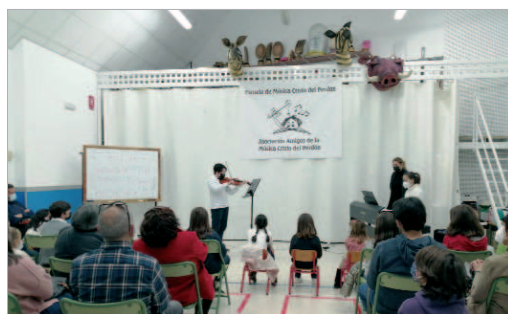
Una de las demostraciones llevadas a cabo en la Semana Blanca.

diferentes audiciones. Así, ha habido recitales de violín, viento metal, percusión, piano, clarinete, saxofón, flauta travesera y guitarra. "Es una suerte contar con estos jóvenes músicos, este profesorado y un público tan cercano. Estamos muy orgullosos", apuntan desde la Casa de la Música.