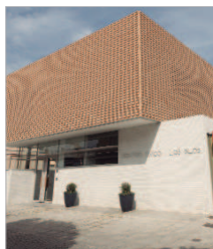
Centro Cívico Los Silos.

El Centro de Información y Asesoramiento Joven con el que cuenta el municipio, está presente en el núcleo de La Rinconada en el Centro Cívico Los Silos, que ofrece sus servicios los miércoles por la tarde en horario de 17:00 a 19:00 horas. En él, se atienden las necesidades específicas de la población juvenil para facilitarle solución a sus problemas y demandas y se les informa sobre diferentes materias que les concierne y les preocupa, así como programas específicos para jóvenes.