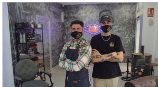
Imagen de los responsables del nuevo negocio local 'The Men VIP Barber'.

Se trata de una unión de tradición y modernidad, haciendo que el corte de pelo y el cuidado masculino sea un hábito y un estilo de vida, más allá de una necesidad. Esta unión es posible gracias al