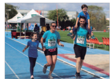
Los atletas tiraron de su familia en la línea de meta.