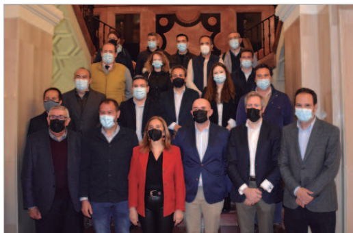
Foto familia municipios participantes.

La forma en la que los habitantes de estos municipios podrán hacerse eco de este Reto será a través de diarios digitales, emisoras de radio de esta zona de la provincia de Sevilla, Redes Sociales y una acción de street marketing itinerante liderada por monitores en todos los municipios, que recorrerán en patinete lugares de afluencia para interactuar con los vecinos. Estos monitores contarán de primera mano el funcionamiento de este Reto, y tratarán de hacer entender el papel que ocupa el reciclaje de envases dentro del ámbito de la economía circular, así como informar sobre los residuos que se deben depositar en los contenedores amarillos y azules, y los que no.