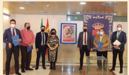
Convenios con las Hermandades y se presentó el cartel de la Semana Santa.

Antes de la presentación del Cartel, los diferentes representantes de las Hermandades locales y de 'El Olivo', firmaban las subvenciones para reconocer