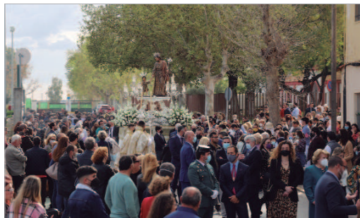
El Patrón volvió a recorrer las calles del barrio tras dos años sin poder salir.