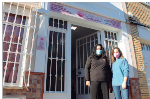
Esencia Centro Estético estrena nueva ubicación para su clientela.