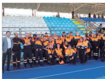
Los voluntarios de Protección Civil, al pie del cañón.