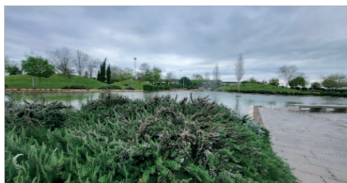
Imagen del Parque Central de La Unión.

Así, en el marco de un plan integral medioambiental impulsado por el Ayuntamiento de La Rinconada y con el objetivo de optimizar y mejorar el patrimonio verde del término municipal, el equipo liderado por el profesor del Área de Botánica, Modesto Luceño Garcés, ha realizado un estudio y un inventario completo de las especies arbóreas y arbustivas, así como un diagnóstico de su estado de conservación cuyos resultados, que se han hecho públicos, destacan entre sus conclusiones que "La Rinconada supera la media nacional de zonas verdes y las conserva en buen estado". Igualmente, en los resultados se contemplan algunos aspectos que se pueden mejorar, centrados principalmente en la