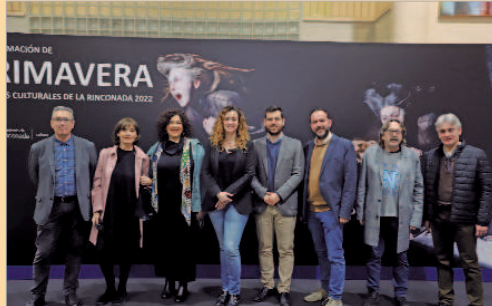
Foto de familia del Día Mundial del Teatro.