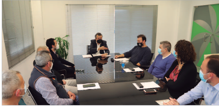
El alcalde y el edl de Deportes con los clubes locales en la firma de los convenios.

En la firma de los convenios, que tuvo lugar en el Ayuntamiento,