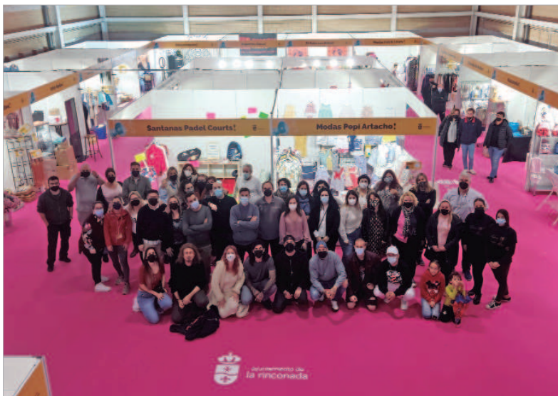
Foto de familia de los comerciantes que participaron en la V Feria del Stock.

El CEIP Maestro Antonio Rodríguez ha acogido una nueva edición del evento del Comercio Local que une un espacio de exposición y venta, con grandes descuentos y actividades paralelas para toda la familia