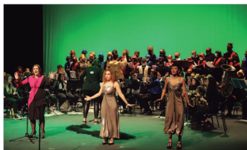
Uno de los momentos de la actuación del undécimo Carnavalitis.

El concierto comenzó con el tema 'Dramas y comedias' de Alaska, para continuar con un video de estos dos años de pandemia y de cómo la Escuela se ha ido adaptando para que sus estudiantes continuasen con la formación. También sonaron temas de Queen, Coldplay y el famoso tema de Wilson Pickett 'Land of 1000 dances'. Los más pequeños