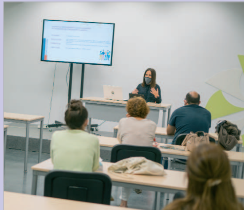
La delegada de Comercio, Reyes Romero, en una reunión con el sector.

Para que todo ello se lleve a cabo, el Plan Estratégico de Comercio tira de originalidad, de forma que sea un plan único e individual, que competirá en un mundo global; participativo y que contemple todas las perspectivas de un sector tan amplio, como es el tejido comercial de La Rinconada, encaminándose hacia una ejecución que avance hacia la sostenibilidad, prioridad presente en todos los proyectos que se llevan a cabo transversalmente desde todas las áreas del Consistorio rinconero. Reyes Romero ha querido valorar este proyecto después de la primera toma de contactos con los comerciantes locales, y ha destacado que "es un proyecto fundamental para seguir desarrollando y avanzando, de manera conjunta, en este sector, adaptándose a las necesidades de un mercado cada vez más competitivo y global, pero sin perder la esencia que lo diferencia en el trato y la cercanía". La concejala ha reiterado la "importancia" del tejido comercial de La Rinconada y el compromiso del Consistorio, porque "es un motor de desarrollo fundamental".