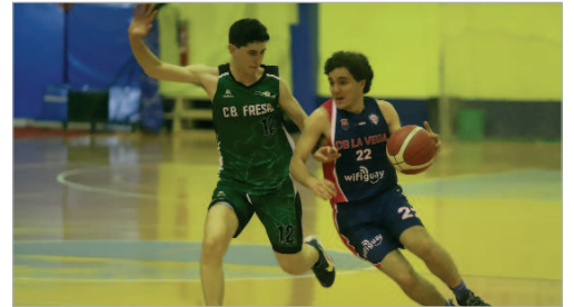
Las lesiones se han cebado especialmente con el Wifiguay La Vega.

Tras una esperanzadora primera vuelta, el Wifiguay La Vega Baloncesto se ha desfondado en la segunda, donde sólo suma un triunfo, lo que ha hecho que pase