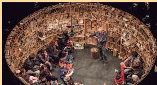
Imagen del espectáculo 'Biblioteca de cuerdas y nudos'.