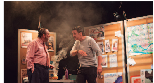
'El asesino de la regañá' estará en La Villa el próximo 8 de abril.

Asimismo, hasta el 17 de abril, la Sala Maga acoge la exposición 'Visionarios a pedales: Bicicletas Gaitán'. A través de fotografías se puede conocer la historia de un emprendedor que en 1936 montó un taller de bicicletas y lo