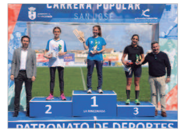
Cerca de 2.000 participantes tomaron la salida.