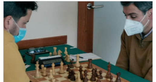
Imagen de uno de los duelos del Club Ajedrez San José.

El Club Ajedrez San José ha completado la primera fase de la temporada de manera brillante. El conjunto rinconero ha sumado un pleno de triunfos, lo que le ha con-