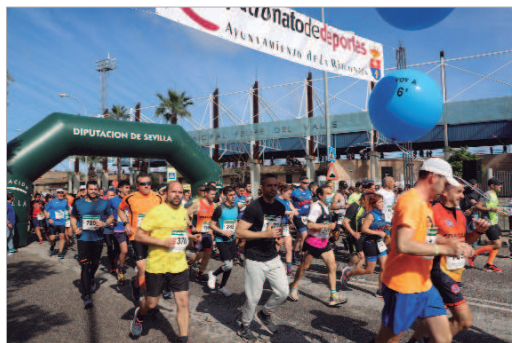
El Estadio Felipe del Valle volvió a ser el epicentro de la Carrera Popular.

muchos de ellos coordinados por el área de Juventud, la Agrupación de Voluntarios de Protección Civil de la Rinconada, la Policía Local y la Guardia Civil, también pusieron su granito de arena en la prueba, contribuyendo a que todo transcurriera según lo previsto sin ningún tipo de incidentes, poniendo de manifiesto la sobrada capacidad del Patronato para albergar y organizar eventos del más alto nivel.