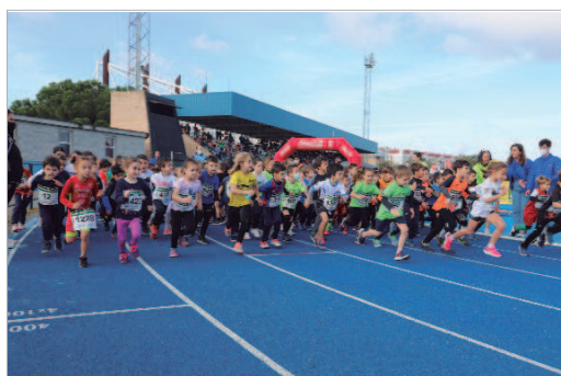
Entre las novedades, este año se ha estrenado la categoría 'Pequeñín'.