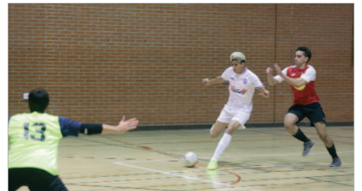
Imagen del derbi entre el San José FS y el Cañamera Futsal.

La Tercera Andaluza de fútbol sala no está dejando muy buenas noticias a los clubes locales. El Cañamera Futsal es el mejor clasificado en la parte media de la tabla,