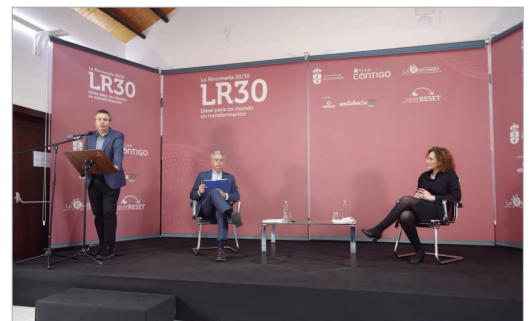
El alcalde presentó a la secretaria general de CCOO Andalucía en el encuentro.

En cuanto al paro de transportistas ha destacado que "durante 10 años se han hecho políticas de austeridad en este país y desregulación, y muchas personas que hoy son autónomos eran antes de plantillas de empresas a los que la reforma laboral de 2012 les costó su puesto. Todo tiene una consecuencia, de esas políticas de austeridad, de esa desregulación y de ese control de las empresas logísticas. Nosotros demandamos una regulación del sector efectiva, además de las medidas que se tienen que tomar en la UE para fijar precios y control de costes".