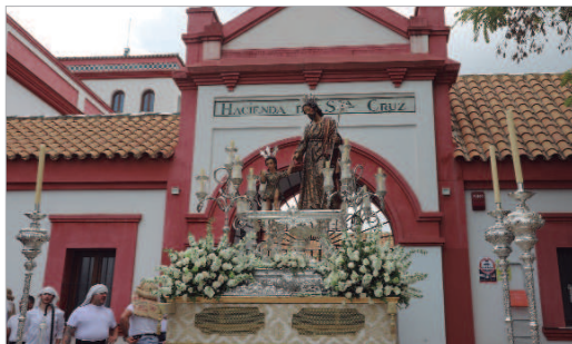
Este año el recorrido se modificó y San José salió de la Hacienda Santa Cruz.

Previamente, los días 16, 17 y 18 de marzo se celebró en Solemne Triduo en la Iglesia San José en adoración al Patrón.