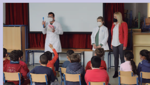
Vitaldent seguirá revisando la higiene bucodental en los CEIP de la localidad.

Tras las revisiones, las familias de los menores recibirán un informe a título informativo con el diagnóstico, que no será de carácter vinculante. "Nuestro objetivo es informar en caso de que se detecte alguna necesidad para que se tenga constancia, pero luego cada uno decide cómo actuar".