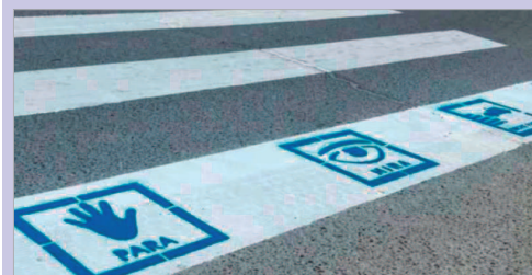
Ejemplo de pictogramas en un paso de peatones.