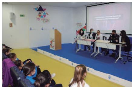
Coloquio 'Fútbol femenino: de sueño a realidad'.