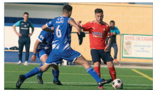
Pipi, el cerebro fichado por el San José, toca la pelota ante el Ventippo.