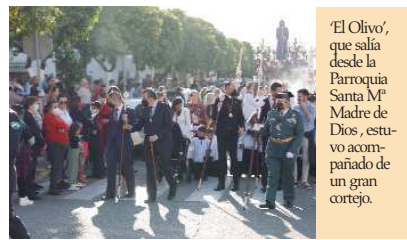
'El Olivo', que salía desde la Parroquia Santa M a Madre de Dios, estuvo acompañado de un gran cortejo.