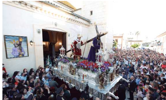
La Hermandad de la Salud comenzaba su salida procesional a las 20 horas ante una Plaza de España abarrotada. La Rinconada volvió a llenarse de incienso y sonos cofrades el Miércoles Santo.