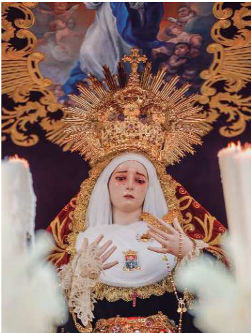
Primera salida en Semana Santa de la Virgen de los Dolores tras su restauración por el IAPH.