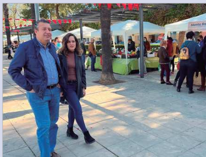
El alcalde y la edil de Comercio visitaron el Ecomercado.

El concierto de 'Lobo y los Coyotes', la meta cidista, palomitas de maíz hechas con energía solar y varios sorteos formaron parte de la actividad paralela al evento