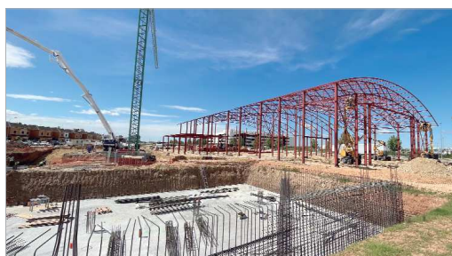
El nuevo Centro de FP Integrado de Base Tecnológica sigue su avance.

Este proyecto, que el Consistorio lleva trabajando de la mano del IES San José desde hace mucho tiempo, cuando el centro solicitó un Ciclo Formativo de Aviónica, a partir de lo cual empezaron a reunirse con diferentes departamentos de la Junta de