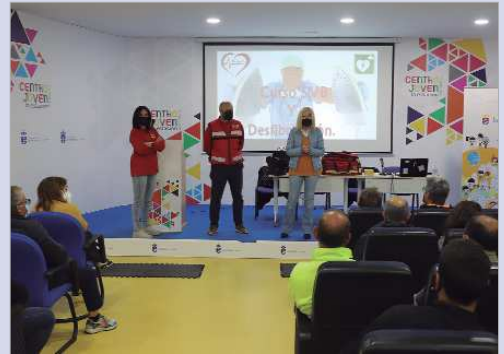
La edil de Salud durante la formación en RCP de los clubes deportivos.

En estos tres últimos años, lo que va de legislatura, se ha realizado casi un