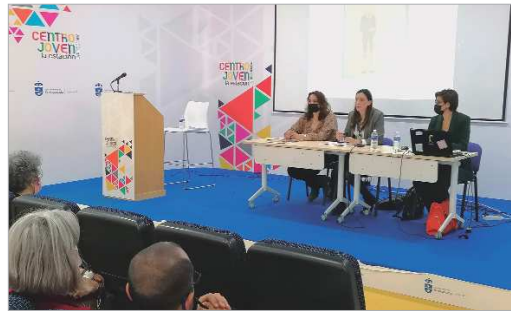
La delegada de Juventud en la primera píldora informativa.

"Aula Joven viene a complementar otras herramientas que ya están puestas en marcha como las asesorías que llevamos a cabo desde el punto Forma Joven y el