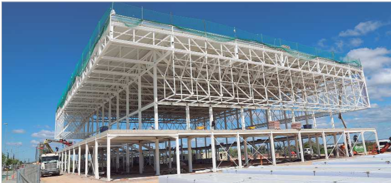
Las obras del nuevo Pabellón Deportivo avanzan a un ritmo vertiginoso y estarán acabadas a finales de 2022.

Entre las bondades de la nueva instalación, a mayores de la optimización de servicios públicos en la zona de La Unión y en barriadas emergentes, en un espacio de proximidad a la Autovía y el Viaducto, además de la dinamización económica del entorno mediante la captación de pruebas deportivas y eventos supramunicipales, centrada básicamente en el sector servicios.