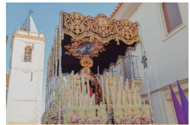
La salida procesional de nuestra Patrona, el Sábado Santo, marca el final de este tiempo de penitencia y da paso a la Gloria de la Resurrección.