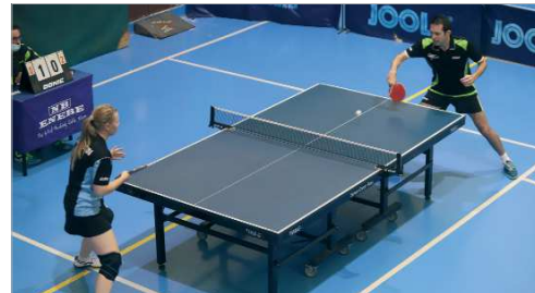
Imagen del derbi entre el San José FS y el Cañamera Futsal.

El Club de Tenis de Mesa San José logró vencer a Hispanidad B (2-4) y, con ello, lograr su principal objetivo, que no era otro que la permanencia en Tercera Nacional. Aunque hubo momentos de la campaña en los que el equipo se