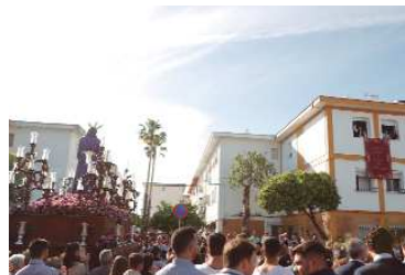
Saetas al paso del Señor de la Humildad en el Prendimiento al pasar por su barriada de La Paz.