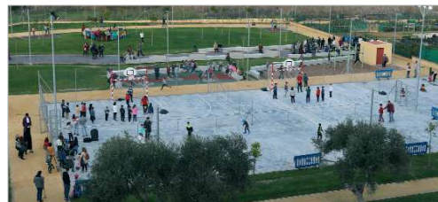
Imagen de las pistas deportivas del parque de La Caldera.

El área de Infraestructuras Públicas, dentro de su Plan Integral para la conservación y optimización de las zonas verdes, se encuen-