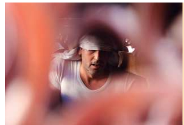
Los costaleros, los pies del paso, los que acercan las imágenes a sus fieles.