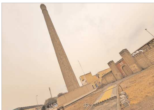
Imagen de las obras en Plaza Maracena ante la mirada de la Torre del Cádiz.

Las obras ultiman estos días la culminación de las labores de urbanización, al tiempo que comienzan las labores de jardinería, tras lo que sólo quedará la iluminación