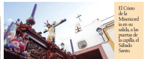
El Cristo de la Misericordia en su salida, a las puertas de la capilla, el Sábado Santo.