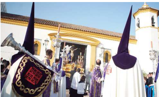
Sobre las siete de la tarde la Iglesia San José abrió sus puertas para que la Hermandad del Perdón realizara su estación de penitencia. Regresó el Perdón a las calles de La Rinconada, volvió el Viernes Santo.