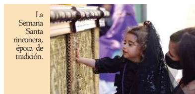
La Semana Santa rinconera, época de tradición.