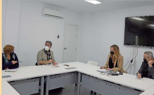
La edil de Cultura ha mantenido una reunión para trabajar nuevos proyectos.