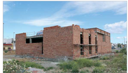
Las obras para la construcción del Juzgado de Paz están muy avanzadas.

Mientras se desarrollan las obras, el Juzgado de Paz se ubica, provisionalmente, en el antiguo edificio de Juventud en La Rinconada, ya que las dependencias donde estaba esta infraestructura van a pasar a formar parte de la ampliación de Correos.