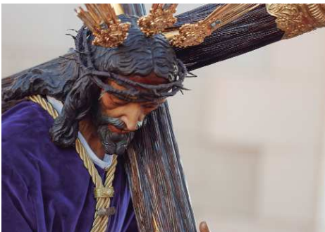
Nuestro Padre Jesús Nazareno volvía a reencontrarse con La Rinconada el Miércoles Santo, tras dos años sin procesiones.