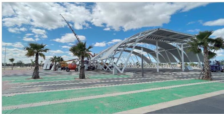
El nuevo recinto ferial está ubicado en El Abrazo.

"Tenemos muchas ganas de volver a celebrar y en esta ocasión será especial. En estos días,