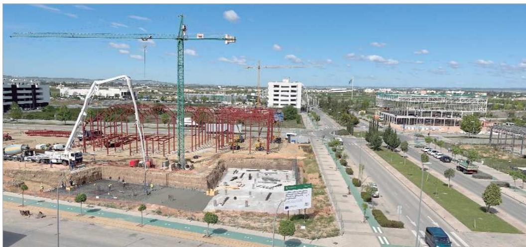
La Unión avanza en cuanto a dotaciones e infraestructuras para vertebrar la unión física de los dos núcleos de población: Rinconada y San José.