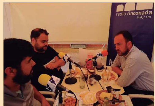
El equipo deportivo de la Tertulia Deportiva de la Radio, en Casa Funes.

El Tres Calles, que cierra una temporada de ensueño en el Agustín Andrade ante el Nevaluz Ecija, el Club de Ajedrez San José, que opta a volver a División de Honor y que viene de celebrar el Memorial