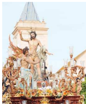
El Cristo Resucitado realizaba su salida procesional acompañado de un gran cortejo y mantillas blancas. El imaginero Ricardo Rivera acudió a ver a su tala.