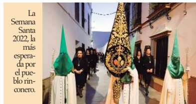
La Semana Santa 2022, la más esperada por el pueblo rinconero.