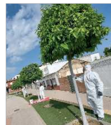
Encalado de naranjos.

La Rinconada cuenta con 3.000 naranjos. El área de Infraestructuras Públicas, dentro de la campaña anual de poda y recogida de naranja amarga de la escena urbana, ha procedido a encalar los árboles ubicados en las principales zonas del municipio, con la idea de mantener en perfecto estado de revista la vía pública. Estas actuaciones se llevan a cabo con el inicio de la primavera.