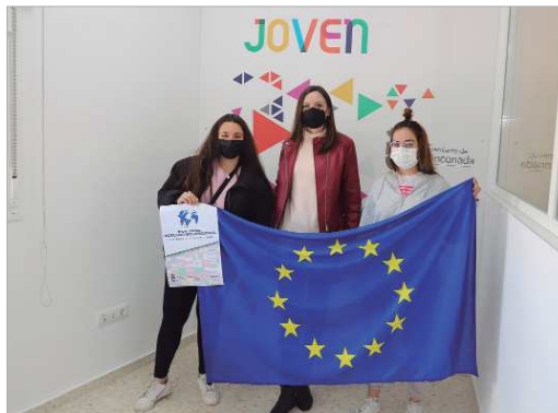
La delegada de Juventud con dos jóvenes becadas.

Este servicio consiste en informar, atender y asesorar a los jóvenes de los planes de movilidad existentes y de voluntariado europeo, teniendo como líneas de trabajo principales el Programa Erasmus+ y Cuerpo Europeo de Solidaridad. Con ella, se le brinda a la juventud la oportunidad de descubrir otras realidades en Europa al mismo tiempo que siguen sus