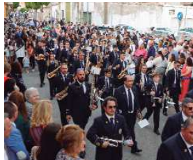
La Banda de Música Cristo del Perdón de La Rinconada acompaña a María Santísima en su Mayor Dolor.