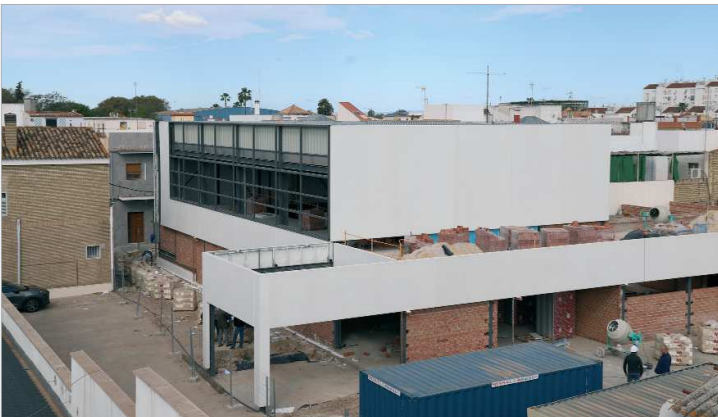
El nuevo Mercado de Abastos encara la recta final de su construcción en la calle Virgen de Gracia.