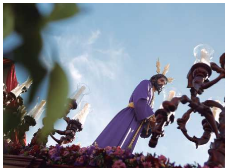
Por primera vez, la Agrupación Parroquial 'El Olivo' procesionó por las calles de San José en una tarde inolvidable. Miles de vecinos y vecinas acudieron al encuentro.