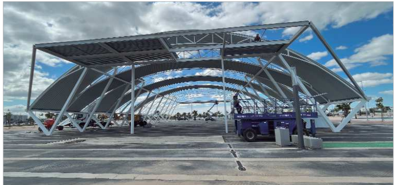
El 'Palenque' culmina el recinto multifuncional 'El Abrazo', que próximamente se abrirá a la ciudadanía.

viaducto, estará a pie de autovía, a cinco minutos de la capital abriendo un amplio abanico de posibilidades al municipio". Un lugar con unas características que no tiene ningún otro sitio en la provincia de Sevilla. Se sitúa como una pieza central en el Eje del Agua, que transcurre por la localidad desde Las Graveras al Guadalquivir en el parque El Majuelo, convirtiéndose en otro pulmón en la red de espacios libres del municipio. Consta de una gran