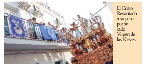
El Cristo Resucitado a su paso por su calle Virgen de las Nieves.