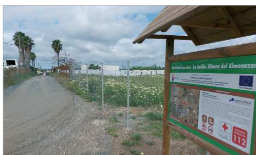
Vía verde peatonal y ciclista que une San José con 'El Castellón'.

El Ayuntamiento de La Rinconada ha licitado, por un importe cercano a los 15.000 euros, el contrato para poder redactar el proyecto de carril bici 'Eje del agua', que supondrá 4,9 kilómetros de vía ciclista que discurrirá paralela al arroyo Almonazar y a la ribera del Guadalquivir y con el que quedarán conectadas urbanizaciones dispersas entre La Rinconada y San José de la Rinconada. Con esta nueva licitación, el municipio sevillano alcanzará los 30 kilómetros de carriles bici, con los que "cubre" los cascos urbanos de San José y La Rinconada, la conexión entre ambas localidades y las urbanizaciones "periféricas", como destaca el delegado de Medio Ambiente, José Manuel Romero Campos, quien añade: "los carriles bici, a mayores de una alternativa sostenible para el ocio y el esparci-