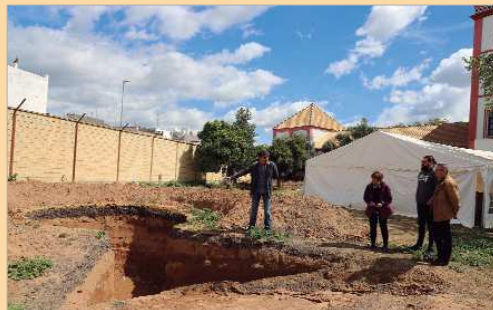
El horno turdetano del proyecto Ergasteria se ubica en la Hacienda Santa Cruz.