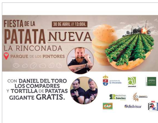
La Fiesta de la Patata tendrá lugar en el parque de Los Pintores a las 13.00 h.

Este evento no se ha podido celebrar en dos años debido a la pandemia, pero aún recuerda la última edición de 2019 que también se