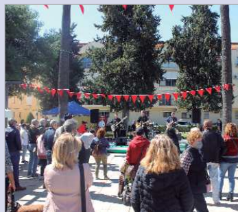
La gente disfrutó de Lobo y los Coyotes.

Como cada primer sábado del mes, el Mercado Eco Cercano de la Asociación Toma Tomate 'La Vega' se llevó a cabo el sábado 2 de abril celebrando su tercer aniversario, de forma que su encuentro mensual fue acompañado de