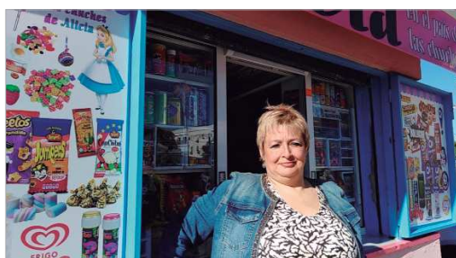
Se ubica frente al instituto Carmen Laffón.

refrescos, bebidas energéticas y bollería. Y es que no todo queda ahí, ya que Alicia en el País de las Chuches está presente también de forma virtual. En aliciaenelpaisdelaschuches.com publica ofertas periódicas y con la que quiere poner al alcance del vecindario rinconero su gran servicio de productos para eventos y celebraciones: desde fiestas infantiles hasta cumpleaños, comuniones, bautizos, etc., con lotes de golosinas individualizados y elaboración propia de tartas de gominolas que pueden entregarse a domicilio en el municipio.