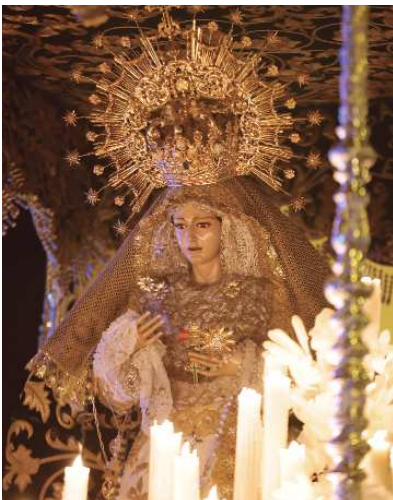
María Santísima de la Salud lucía radiante, con su toca de sobremanto restaurada. Bajo las miradas de sus fieles, arropada por todo su pueblo, recorrió las calles céntricas de La Rinconada.