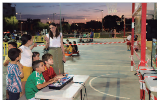
Multitud de actividades para disfrutar de la noche de los sábados.

asistido durante las 3 sesiones celebradas y participado en las diferentes actividades planteadas y zonas de juego. Así, han jugado a los bolos, paracaídas, tiro con arco, saltado en cama elástica,