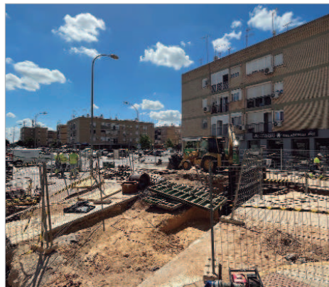
Emasesa desarrolla estas actuaciones, que estarán listas a final de año.

Los adjudicatarios deben tener en cuenta los plazos establecidos que implican: