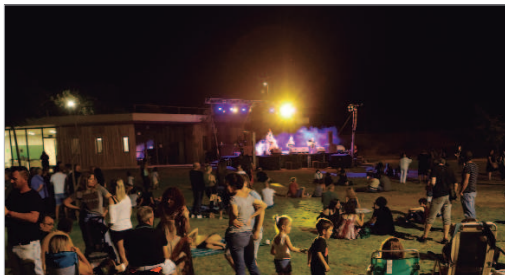
El parque de Las Graveras volvió a acoger este festival único.

Vita Vinum en acústico abrió el festival con su espectáculo Virelay basado en las Cantigas, la gran colección de cantos a la Virgen María