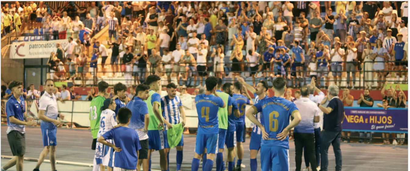
La plantilla del Rinconada agradece el apoyo a sus aficionados, que abarrotaron el Felipe del Valle, después de la derrota ante el Villafranco y de no consumir el ascenso a División de Honor.