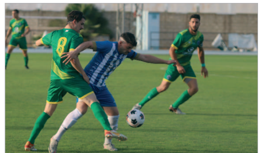
Mimi fue el autor del gol decisivo ante el Ventipito, que dio el pase a la final.