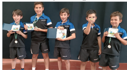
Las jóvenes promesas del CTM San José, tras el Torneo de Gibraltár.

El CTM San José ha participado en los torneos internacionales de Ayamonte y Gibraltár, sumando un oro y una plata en la modalidad Prebenjamín-Benjamín, y un bronce en Alevín. En Gibraltár el