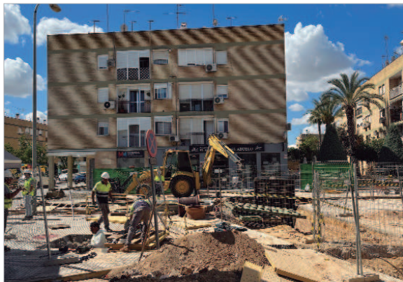
Las obras en la barriada Santa Cruz avanzan para cambiar la fisionomía de la zona.

afectadas por las obras, mejoras en la accesibilidad y en las zonas de esparcimiento. Por otro lado, respecto a la iluminación, se sustituirá toda la red