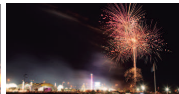
El espectáculo de fuegos artificiales puso el broche final a esta ciudad efímera.