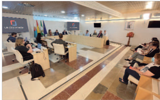
Reunión político técnica sobre la Agenda Urbana.

near los objetivos de un entorno local con los objetivos estratégicos que plantean las agendas nacionales e internacionales, como son la Agenda 2030, Nueva Agenda Urbana Internacional, Agenda Urbana para la Unión Europea y Agenda Urbana Española. Además, implica consensuar políticas y decisiones de los principales actores públicos y privados y facilita el acceso a los Fondos Europeos y Fondos Next Generation para la financiación de proyectos relacionados con el Desarrollo Urbano Sostenible. El papel de las ciudades y territorios es esencial para