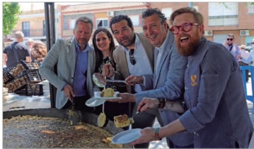
Los asistentes al evento pudieron degustar una tortilla de patatas gigante.

En pleno comienzo de temporada de la patata nueva de La Rinconada se enmarcó la Fiesta de la Patata Nueva 2022 en el Parque de Los Pintores, un enclave del municipio que vivió, por segunda vez, la celebración de este evento dada su buena acogida en la última edición de 2019. Así, el área de Comercio y Agroindustria, en colaboración con Prodetur, Asociafruit y con el apoyo de las empresas locales Patatas Arrebola, Patatas Sánchez, DistriSur Agrícola, Patatas Rubio Martínez y