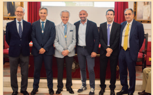
Los organizadores y participantes en la presentación de las IV Jornadas.

Durante la disertación inicial, se abordó la importancia de la salud en la práctica deportiva, haciendo especial énfasis en los avances que se han producido en los últimos años. Como decía Monchi, esto ha cambiado porque "cuando yo jugaba sólo había dos tipos de lesiones: las que te impedían entrenarte y las que no lo hacían". También se abordó cómo los rectores deportivos pueden llegar a presionar a los servicios médicos para forzar la participación de algún futbolista o la