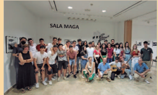
Foto de familia de alumnado participante en la exposición.