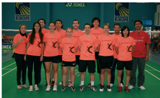
La plantilla rinconera en su última Copa de Europa en Pécs (Hungría) en 2012.