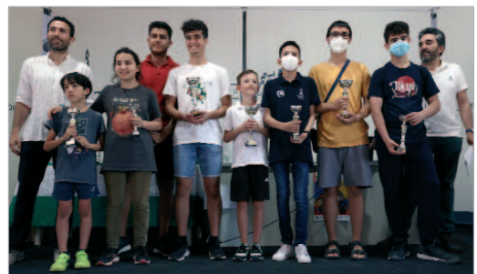
Cuadro de Honor del XXVI Trofeo de Feria, que tuvo 120 participantes.

En lo que se refiere a la clasificación general el vencedor fue el gran favorito, el Gran Maestro de Armenia, afincado en la localidad