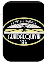
Guadalquivir 86' Remo

El nadador, que se entrena con el CNUR y que compete con el Jerez Natación Máster, ha participado en los Campeonatos de Andalucía de Verano para Veteranos, en Palma del Río (Córdoba), donde ha conseguido tres oros y dos platas.