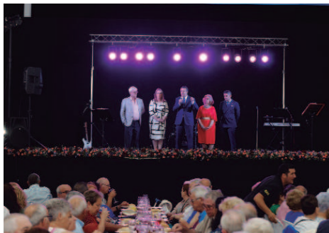
Tradicional recepción a los pensionistas de la localidad en la Caseta Municipal para celebrar la cena del pescaito.