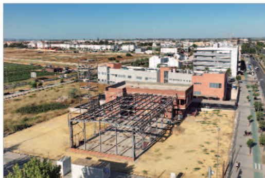
Las obras tienen un periodo de ejecución de 8 meses.