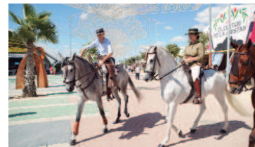
Paseo de caballos y enganches por el recinto.