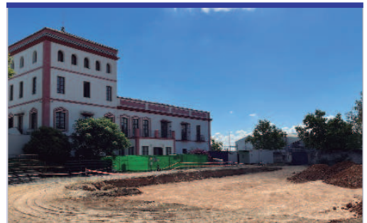
Los trabajos previos al inicio de las obras se están desarrollando.