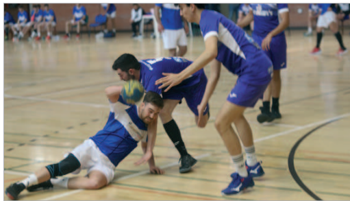
Imagen del duelo ante el Pozoblanco, en el Play Off de Ascenso.