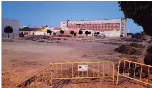
Las obras de sectorización y reparcelación están muy avanzadas.

Estará abierto hasta el 14 de julio y, para optar a ellas, hay que entregar en el Juan Pérez Mercader el impreso relleno que se puede descargar en la web www.soderin.com