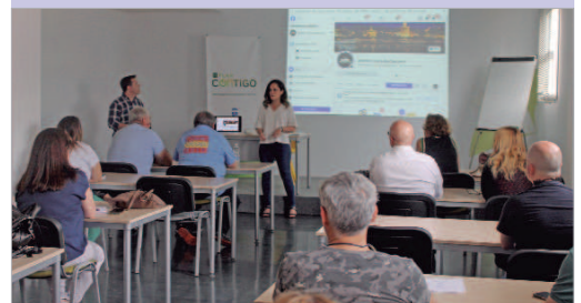
19 empresas locales han mejorado su marca en redes sociales.