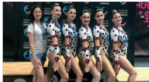
Gimnastas del Oso Panda participando en el Campeonato de Andalucía.

El Club de Gimnasia Rítmica Oso Panda ha tomado parte en el Campeonato de Andalucía Absoluto y de Base por Equipos. En el torneo, las ositas lograban