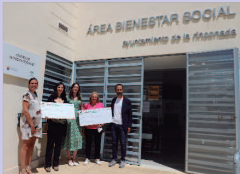
Ecovidrio hizo entrega de los cheques tras superarse el reto.