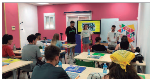
15 jóvenes participan en el segundo nivel de Cultura Urbana.