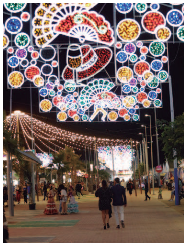
El Abrazo se llenó de gente, color, luces, volantes, albero y diversión durante cinco días para vivir su primera Feria.