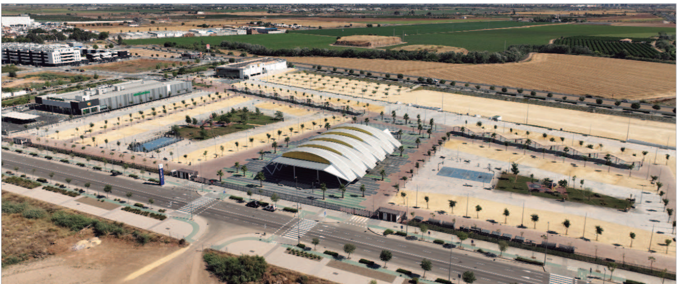
Imagen área del nuevo recinto multifuncional El Abrazo.

'El Abrazo' es un gran parque de 80.000 metros cuadrados multifuncional y polivalente para atraer eventos y acontecimientos con un potencial increíble, construido al pie de la autovía de Acceso Norte a la altura del Viaducto que cruza Pago de Enmedio. Un lugar con unas características que no tiene nin-