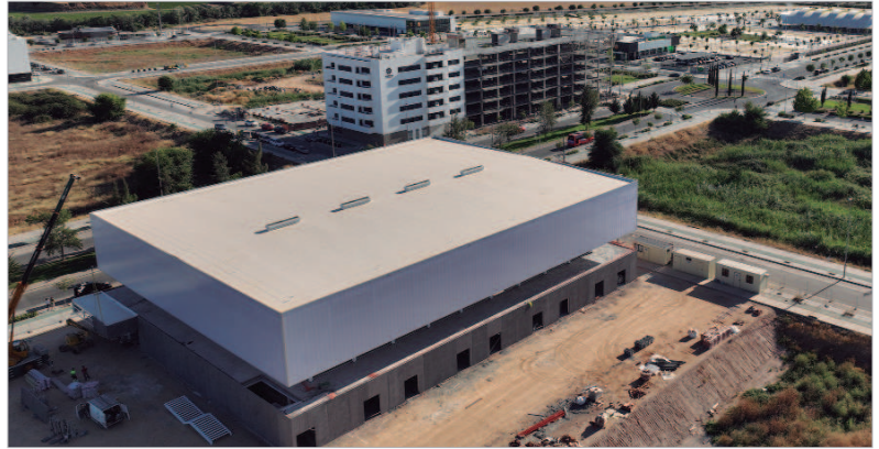
Las obras avanzan a buen ritmo y permitirá ampliar las instalaciones deportivas.

Contará con una superficie cercana a los 6.000 metros cuadrados, y dispondrá de una pista deportiva con tres canchas auxiliares para la práctica de balonmano, baloncesto, fútbol-sala, hockey, tenis, voleibol, rítmica, mini basket y bádminton. Contempla, además, vestuarios, gradas para al menos 250 espectadores