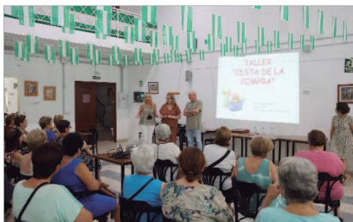
Las delegadas de Salud y de Mayores dieron la bienvenida a la charla.