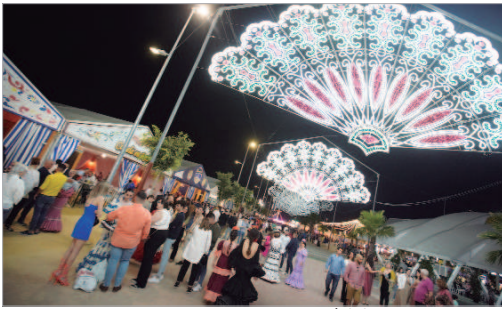
Un nuevo recinto se vistió de largo por primera vez.

El castillo de fuegos artificiales pone fin a la primera celebración en el nuevo recinto, por el que pasaron miles de personas, que transcurrió sin incidentes reseñables y que se ha ganado en su estreno la catalogación de "una de las mejores de la provincia"