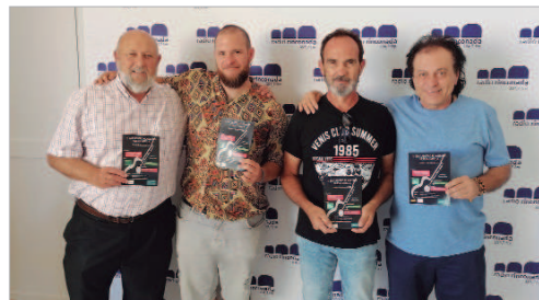
Sus protagonistas presentaron un nuevo encuentro flamenco en La Jarilla.

en su madurez interpretativa". Con este tema da la bienvenida al verano y va a recorrer las costas españolas de gira. También avanzó que está trabajando en un nuevo tema que saldrá en otoño.