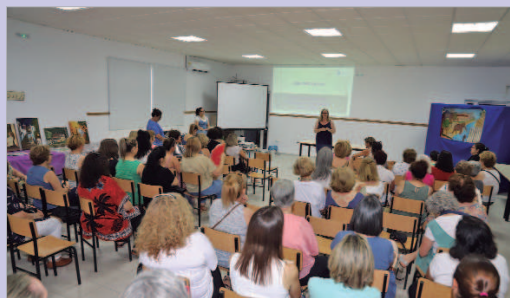
La delegada de Igualdad en la clausura del curso de los talleres del CMIM.

En torno a más de medio millar de mujeres han vuelto a participar en las diferentes actividades desarrolladas durante el año a través de diferentes programas. Así, con Creciendo Juntas, las usuarias del CMIM han dado clases de yoga, pilates, dibujo y pintura, artesanía creativa y un taller