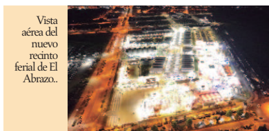
Vista aérea del nuevo recinto ferial de El Abrazo.