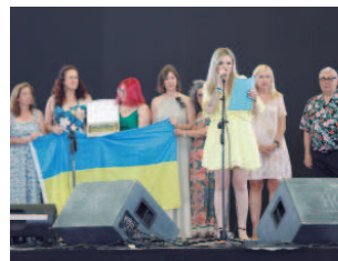
El Festival Flamenco homenajeó al voluntariado que estuvo envuelto en la recogida de alimentos para Ucrania.