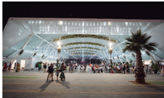
La Caseta Municipal, que cuenta con 2.500 metros cuadrados, acogió una amplia programación musical y de baile durante todos los días de la Feria.