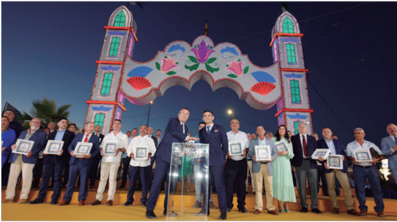
Momento del encendido del alumbrado, que daba inicio a la esperada Feria de El Abrazo.