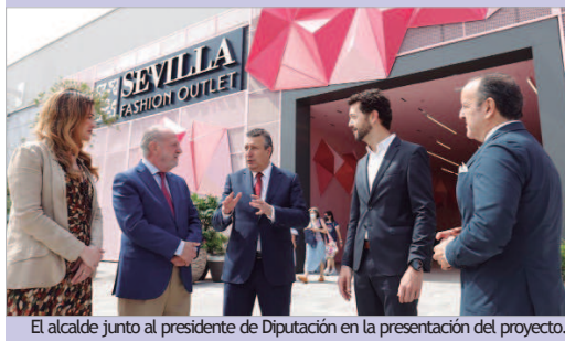
El alcalde junto al presidente de Diputación en la presentación del proyecto.

de shopping Premium de Andalucía. El proyecto será un catalizador de nuevo negocio e inversión en la ciudad gracias a las nuevas firmas globales que entrarán a formar parte del portafolio de Sevilla Fashion Outlet. El espacio, además, será un escaparate de talento andaluz, con una destacada presencia de las grandes enseñas de moda y retail del sur. VIA Outlets está realizando una inversión de 17,5 millones de euros en esta ampliación. Se estima que la ampliación generará unos 150 puestos de trabajo.