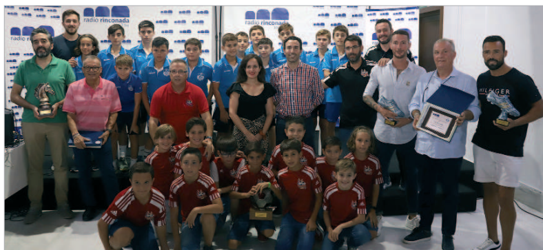
Foto de familia con todos los clubes y deportistas galardonados en los XXI Premios Radio Rinconada