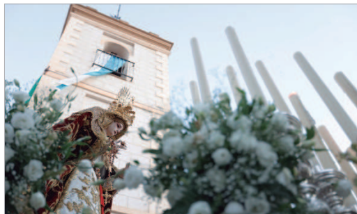
La Patrona de La Rinconada a su salida de la iglesia.