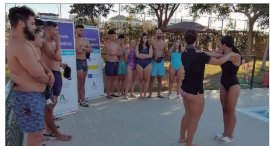
Itinerario Formativo de Socorrismo en instalaciones acuáticas.