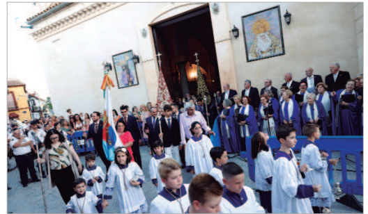
La Coral Nuestra Señora de las Nieves actuó a la salida de la Virgen.