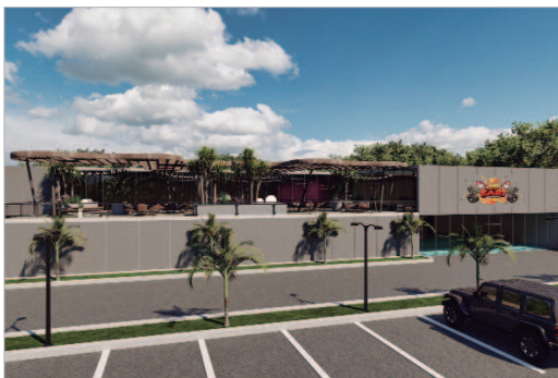
Imagen virtual de la entrada del centro de ocio.

esté en servicio en el primer trimestre 2023.