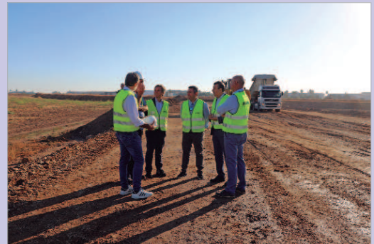
El alcalde en una visita a las obras del ramal.