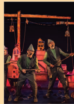
Espectáculo 'Hamelin' de Xip Xap.

como seres humanos, lo que nos aleja de la naturaleza... que ir al teatro sea algo al alcance de todos". Así subraya que "Abecedaria se suma a nuestro Festival de Artes Escénicas para Niñas y Niños que desarrollamos en el mes de noviembre desde hace 27 años y, por primera vez, también incorporamos el Festival Transmutaciones, cultura social comunitaria para toda la ciudadanía. Todo ello para sembrar desde edades tempranas en el amor a las artes escénicas, para que tengan una primera experiencia en el teatro, que les enganche, que les haga reflexionar".