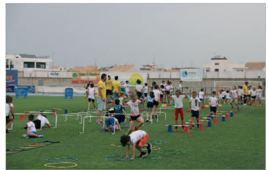
La iniciación deportiva y la psicomotricidad, un clásico de las Escuelas.

"Para esta nueva temporada pondremos en marcha todas las disciplinas deportivas que nos