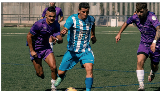
Kaki se lleva el balón ante dos rivales.

El Rinconada perdona al Alcalá y lo acaba pagando con la derrota en el Nuevo Ramos Yerga (1-2), mientras que el San José, con falta de pegada, no pasa del empate con el Mosqueo (0-0)