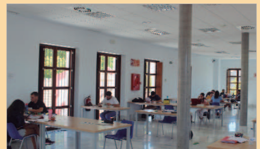
Sala de estudio de la Hacienda Santa Cruz.

Del 9 de mayo al 30 de junio y del 16 de agosto al 14 de septiembre, en horario de lunes a viernes de 9.00 a 22.30 horas; sábados, domingos y festivos de 9.00 a 21.00 horas, dejando media hora en el ecuador de la jornada para limpieza y desin-