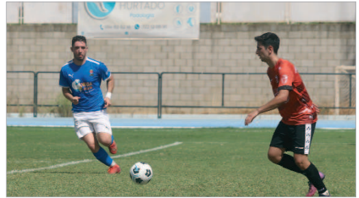
La ida tuvo color cañamero y la vuelta fue del Rinconada, que logró el pase.

La segunda parte rompió el partido. El inicio fue como el de la primera parte, pero, a diferencia del comienzo, los rinconeros encontra-