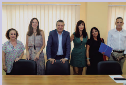
Firma de convenio con ACAT, AR y Alzheimer La Vega.