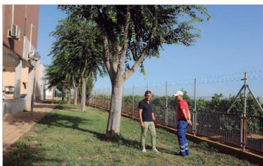
Rafael Reyes en la trasera de las viviendas.

Así, tal y como ha explicado el delegado de Infraestructuras Públicas, Rafael Reyes, en una visita a las intervenciones ya finalizadas, "estas actuaciones parten de una petición vecinal y del proceso de escucha activa que mantenemos con la ciudadanía para que nos hagan llegar sus necesidades. En concreto, en este caso hemos eliminado espacios en las partes traseras y laterales de los edificios, que estaban compuestos de albero y matorros, por un espacio verde, en el que se combinan zonas de grama y ensolado, dando un importante cambio a la zona".