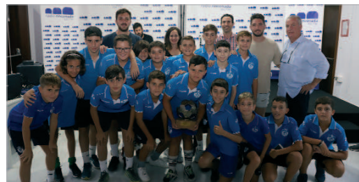
El Alevín del Rinconada de Kisko y Junior, reconocido por su ascenso.