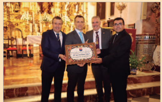
El pregonero recibió una placa conmemorativa de parte del Ayuntamiento.

llegaba septiembre. El Rosario de la Aurora, los cohetes mañaneros, las voces del coro entonando la Salve Dolorosa y los desayunos posteriores fueron algunas de las imágenes de recuerdos y vivencias correspondientes a una época de los años ochenta. Poco a poco y saltando de la prosa al verso, el pregonero fue desglosando todo un recorrido vital.