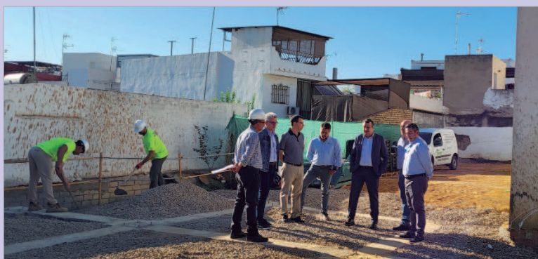
El alcalde y los ediles de Hábitat Urbano y Educación visitaron las obras recientemente.

AMPAS de todos los centros educativos de la localidad, al tiempo que aseguró que el Ayuntamiento siempre estaría a su lado en la "apasionante aventura educativa": "La educación es transversal e implica a las familias y a los centros educativos que desarrollan una labor encomiable en la que siempre contarán con el apoyo del Ayuntamiento". Durante el verano, las instalaciones se han sometido a distintas mejoras para que estén en perfecto estado de revista una vez se reanudarán las clases, cuya inversión se ha acercado a los 300.000 euros. A mayores de las labores previstas, que se llevan a cabo de forma regular en todos los centros, dentro del compromiso municipal, en esta edición se han acometido la pintura del CEIP Júpiter; además de las obras necesarias en la cubierta del gimnasio; la pintura del Pepe González, donde también se llevarán a cabo labores para el acondicionamiento y mejora del patio; y trabajos para la mejora y optimización de las pistas deportivas de Nuestra Señora del Patrocinio (PÚA) y Guadalquivir: "Cada colegio es una herramienta poderosa que otorga igualdad a nuestros niños y niñas. El mantenimiento y mejora de nuestras instalaciones educativas es fundamental para garantizar una educación de calidad. Hemos llevado a cabo una potente acción inversora, llegando a todos los centros, para garantizar la mejor vuelta al cole posible", explica Reyes.