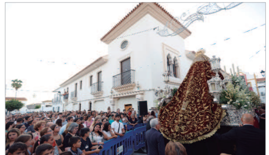
Un numeroso público acompañó a la patrona en este día tan especial.

de La Rinconada había colocado para tan magna ocasión y la tradicional 'petalá', previa a su paso por la Plaza de España, en la calle Laguna, durante el camino de vuelta a su templo. Sobre las once y media, Nuestra Señora de los Dolores llegaba a su capilla, para poner fin a un 15 de septiembre para recordar.