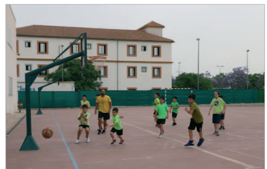
El baloncesto está de moda y muchos niños y niñas quieren practicarlo.

han venido acompañando en las últimas temporadas y que tan buena respuesta han tenido por parte de las personas usuarias. Contamos con programas dirigidos a todas las edades, desde bebés a partir de 5 meses hasta la tercera edad. El deporte debe estar al alcance de todos como