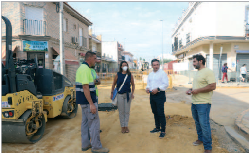
Las obras de la calle María Auxiliadora avanzan según lo previsto.