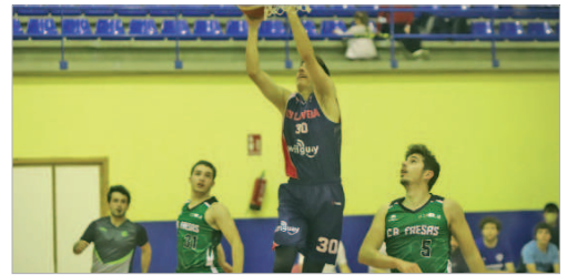
El Wifiguay volverá a verse las caras con el Baloncesto Fresas.

La Primera Provincial de baloncesto celebraba recientemente el sorteo de los grupos que integrarán la categoría. El Wifiguay La Vega quedaba emparejado en el grupo A, junto al Fresas, Pilas, Carmona, Tartessos de Lebrija, Lemon CNS, Sajuma, Alcalá, Careba, Betis B, Guillena, San Pablo y Marchena. Un grupo difícil del