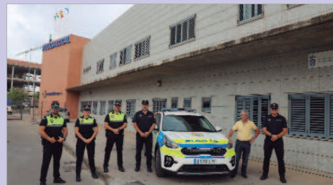
El delegado de Seguridad junto a Policía Local en la Central Mixta.

La Policía Local adquiere un nuevo vehículo dotado con un kit de transporte de detenidos y habilitado con los últimos adelantos que permiten una mayor optimización del trabajo