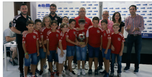
El equipo Benjamín de Esfubasa logró el ascenso tras una campaña.