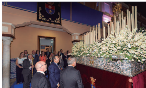
Ofrenda floral a la Virgen a su paso por el Consistorio.