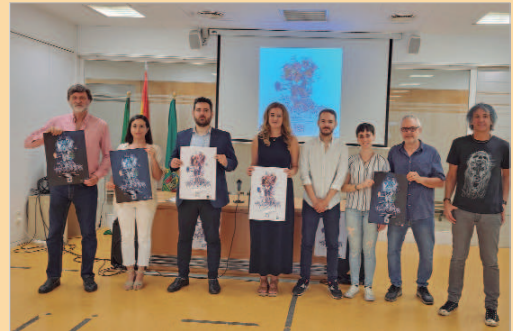
Presentación de Transmutaciones en la Diputación de Sevilla.

Además, ha querido destacar el papel de Diputación de Sevilla en su apuesta firme por el apoyo a este tipo de iniciativas culturales. "Otoño Cultural sitúa la salud y fortaleza de la colaboración con Diputación, de la mano del Festival Flamenco El Búcaro, a través de la renovación con Cipaem, de la línea de reactivación