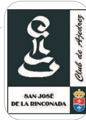
San José Ajedrez

El biker rinconero sigue acumulando éxitos en las diferentes pruebas en las que toma parte. Después de sus últimos resultados, lidera la clasificación Absoluta y la Elite a falta de tres pruebas para la finalización del Circuito Provincial de Sevilla.