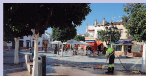
Limpieza de la plaza Rodríguez Montes.