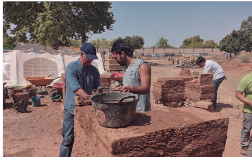
Proyecto de arqueología experimental en la Hacienda Santa Cruz.

Vuelven las visitas al horno turdetano que expertos en arqueología experimental de la Universidad de Sevilla están construyendo en la