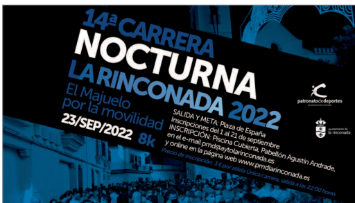
Cartel de la Carrera Nocturna, que tiene lugar el viernes.

La Carrera Nocturna 'El Majuelo por la Movilidad' será el inicio del calendario deportivo municipal que seguirá con la Media Maratón Entreparkes el 27 de noviembre.