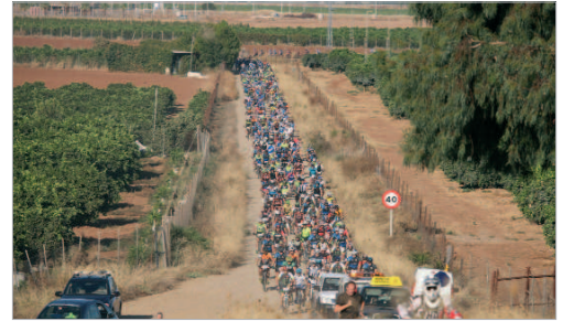
Imagen de la I edición de una prueba que cumple diez años.

El domingo, con los dorsales agotados, concienciado sobre la ELA, y con múltiples novedades, se celebra la prueba