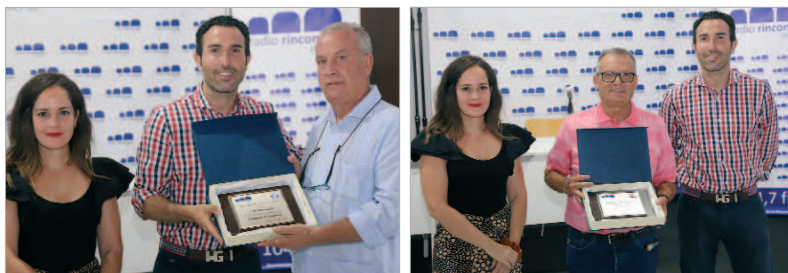
El mérito de la campaña del Rinconada, reconocido.