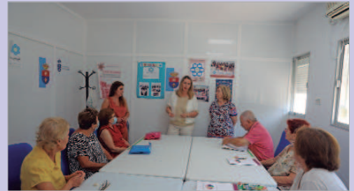
La delegada de Mayores en el taller de memoria del 20 de Julio.

El área de Mayores y el Centro de Estimulación Cognitiva de La Rinconada ponen en marcha estos talleres en el 20 de Julio y en el Pablo Picasso para trabajar con las personas mayores la memoria y enlentecer el progreso del deterioro cognitivo leve