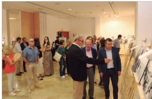
El alcalde, el presidente de Diputación y el secretario de UGT Sevilla.

Las trabajadoras han sido una clave fundamental para el desarrollo de la agricultura y la ganadería en España. Pilares fundamentales que sostuvieron el mundo rural durante la Guerra Civil española y posterior postguerra y que ha continuado hasta la actualidad de la mano de nuevos modelos de negocios y explotación del medio rural. Por todo ello, UGT Sevilla, en colaboración con Diputación de Sevilla a través de Prodetur, ha organizado la exposición 'Pasado, Presente y Futuro de la Mujer Trabajadora en el Mundo Rural', en la que a través de 37 fotografías recoge cómo la mujer mantuvo los campos en la pasado, cómo se adapta el medio rural a las necesidades actuales y cómo investiga de cara al futuro