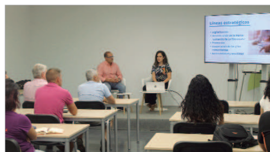
La delegada de Comercio en una reunión con comerciantes del municipio.

Así, La Rinconada ocupa la tercera posición en transparencia en la provincia de Sevilla de municipios con más de 15.000 habitantes. Además, se trata de un proceso abierto en el que el Consistorio rinconero puede ir completando y cumpliendo los indicadores y niveles para seguir avanzando hacia un gobierno más participativo, abierto y transparente.