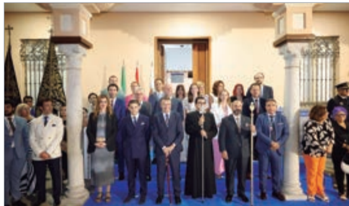
Corporación municipal a la espera del paso de la Virgen.