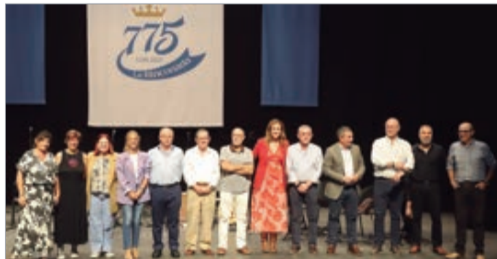
Comisión Ciudadana y responsables municipales en la presentación del programa.