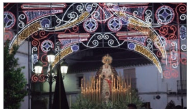
El Ayuntamiento adornó las calles con arcos luminosos.