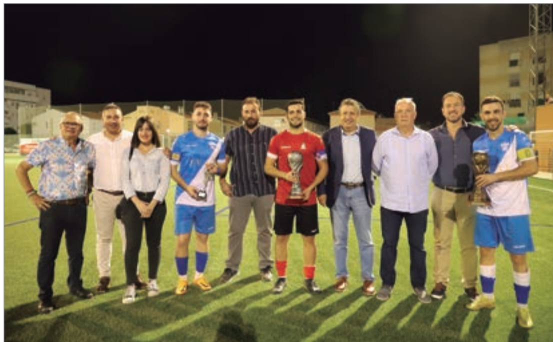
Foto de familia con el cuadro de honor del XIV Trofeo Radio Rinconada en el césped del Nuevo Ramos Yerga.