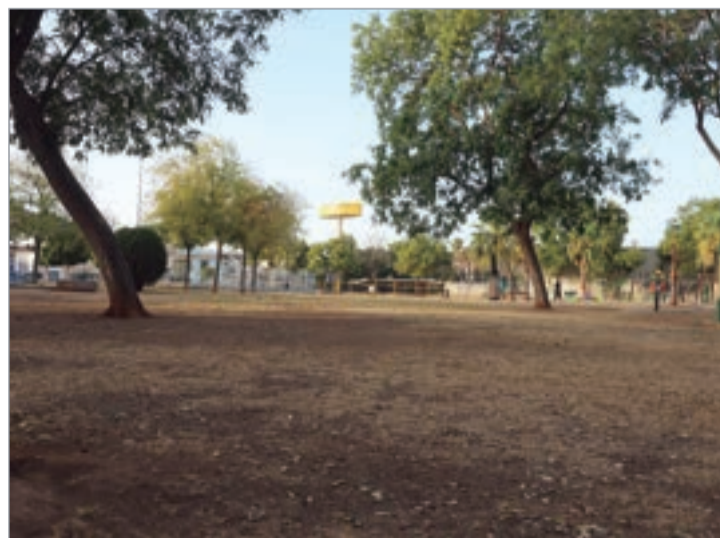
El parque 'Primero de Mayo', uno de los más afectados por la sequía.

unos recintos sí y en otros no, en base a las reservas hidráulicas del