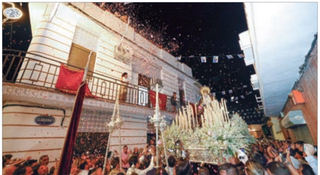
La Virgen de los Dolores a su paso por la calle Laguna.

En su paso de gloria, ornamentado por ramos de nardos y flores blancas, la Virgen de Los Dolores, fue realizando su recorrido por las calles del municipio