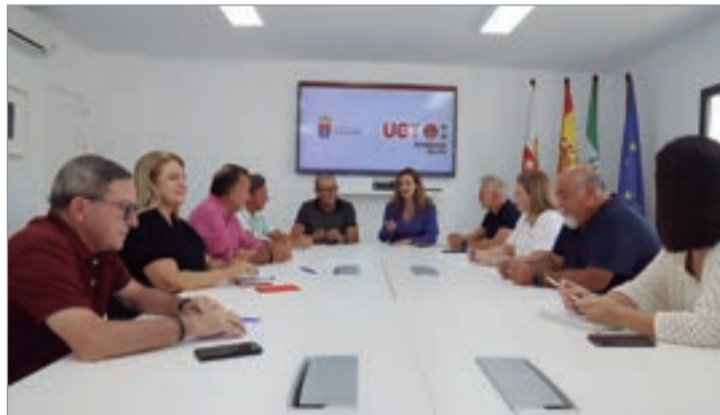
Un momento de la reunión con UGT en el edificio del Consistorio rinconero.