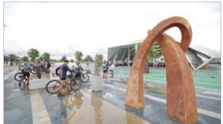
La edición más dura de cuantas se han celebrado acabó en 'El Abrazo'

solares de esta instalación que se ha convertido en un referente por sus proyectos pioneros como el cultivo agrivoltaico, el apiario solar o el pastoreo para el desbroce natural del terreno, elementos que han hecho que esta planta haya sido reconocida este año con el Sello de Sostenibilidad de UNEF. Ni la lluvia ni el recorrido embarrado fue motivo de abandono en la edición más dura y épica que se ha desarrollado hasta la fecha y que acabó con una gran fiesta de todos los