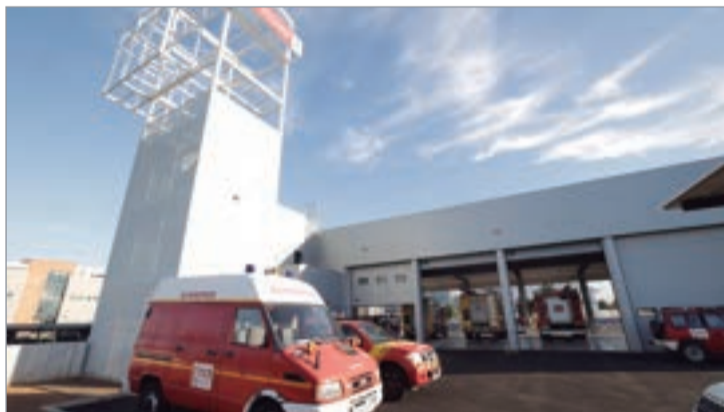
Patio interior del nuevo Parque.