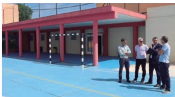
El alcalde en una visita al CEIP La Paz en el inicio de curso.

En este sentido, el Consistorio vuelve a financiar las cuidadoras del Segundo Ciclo de Infantil, ya que no lo hace la Junta de Andalucía. En total, la inversión en este servicio, que presta la empresa Eulen, asciende a 108.900 euros. A ello, habría que añadir las becas que se entregan en todos los niveles educativos, también en Infantil y que superan las 300 unidades de 70 euros cada una.