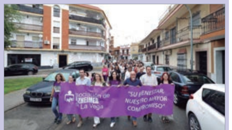
Numerosos vecinos participaron en la marcha.