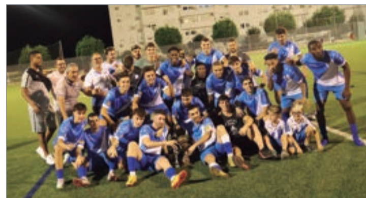
La plantilla del Rinconada posa con su trofeo de campeón tras el duelo.