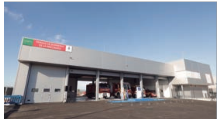
Exterior del Parque de Bomberos.