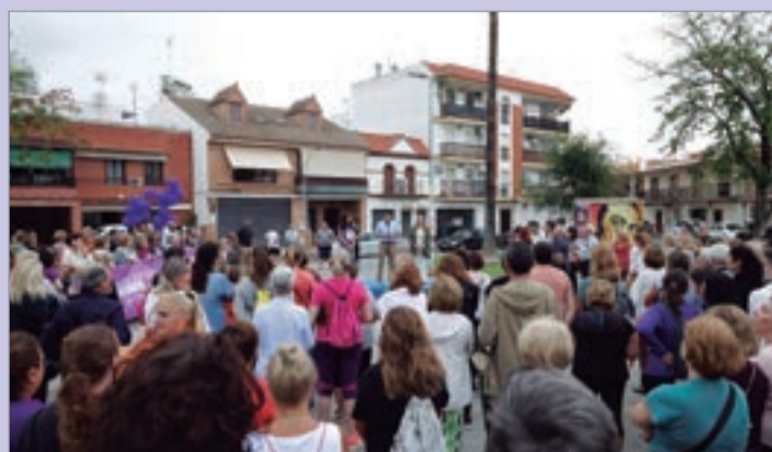
El parque de Los Pintores acogió el acto final del evento.