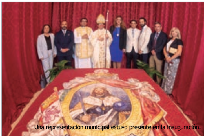
Una representación municipal estuvo presente en la inauguración.

Con motivo del 775 aniversario de la llegada de Fernando III a La Rinconada y dentro de los actos que se están llevando a cabo por esta onomástica, se ha colocado esta obra en la capilla que fue antiguo Hospital de la Misericordia