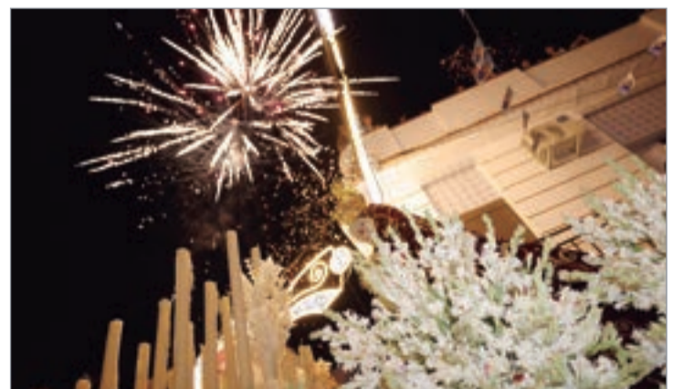
Fuegos artificiales a la llegada a su capilla.

Para cualquier consultas-propuesta-incidencias Servicio de Atención a la Ciudadanía