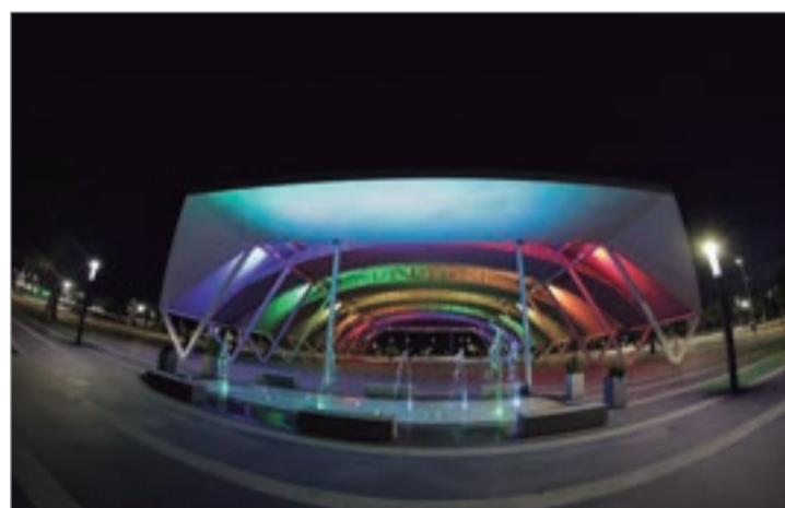
La infraestructura central de 'El Abrazo', luce con un ejemplo de iluminación.