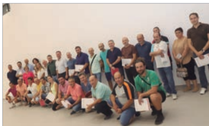
Foto familia de clubes que han recibido ayudas.

ya que son excelentes embajadores del municipio en cualquier lugar". En el apartado de Formación y Competición Federada, los clubes subvencionados son el Oso Panda Rinconada, de gimnasia rítmica, San