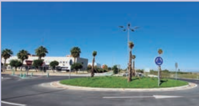
La rotonda de Haza de la Era, en pleno funcionamiento.

Las obras las ha llevado a cabo Inmova, que es quien está llevando a cabo las labores de urbanización de Haza de la Era.