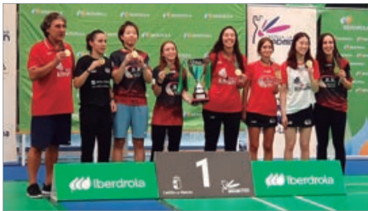
La plantilla del Bádminton Rinconada que tomó parte en la Copa Iberdrola.

Toledo fue la sede de la Copa Iberdrola de clubes, donde el Bádminton Rinconada volvió a ser campeón. Las jugadoras rinconeras consiguieron realizar un campeonato inmaculado sin dar opción a ninguno de sus rivales, a los que se impuso por el idéntico tante de 3-1.