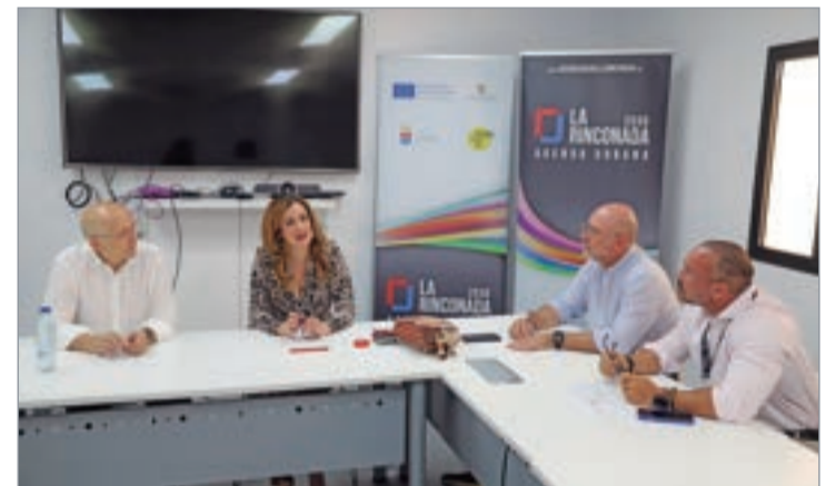
Reunión con Rinconada Global.