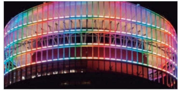
Proyecto Atalaya Torre Sevilla.

tipos de iluminaciones posibles que ofrecen auténticos espectáculos de luces, han sido necesarios cerca de 3000 metros de cable entre eléctricos y DMX específicos para iluminación además de otros 600 metros de cables de acero, 300 luminarias, 3 prototipos a tamaño real y todo eso instalado a más de 190 metros de altura. Con estas impresionantes cifras de materiales todos ellos tecnología de última generación, de eficiencia energética y medioambientalmente sostenibles, un equipo formado por más de 50 personas ha hecho posible que las 40 plantas de esta torre destaquen y sea visible desde diferentes puntos de la pro-