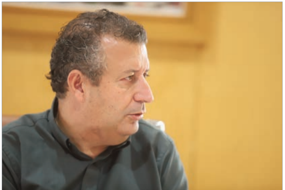
“Somos un municipio saneado que nunca ha gastado lo que no tiene y que no le debe nada a nadie”.

Soy un convencido del área metropolitana. Creo que temas como el de la Línea 3 del Metro, supondrían un gran avance no sólo para La Rinconada, sino para