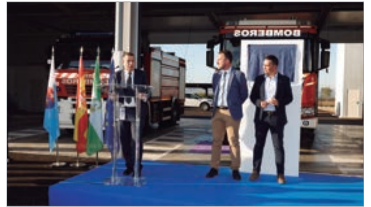
El alcalde durante su discurso de inauguración del nuevo parque de Bomberos.

pales vías de comunicación, tanto a través de La Unión, como para el acceso a las vías que comunican el municipio con otros del arco norte de la provincia". Por otro lado, su puesta en servicio permitirá "desbloquear el proyecto que La Rinconada tiene para el actual parque de bomberos, que se convertirá en un centro deportivo de barrio que será sede de escuelas deportivas relacionadas con la gimnasia rítmica y el tenis, entre otras disciplinas", explica el delegado de Hábitat Urbano, José Manuel Romero Campos. Para este complejo, se prevé una inversión de 200.000 euros, y cuenta con financiación procedente de una subvención de fondos europeos.