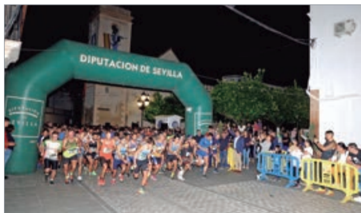
Salida de la carrera desde la Plaza de España.

Por último, respecto a grandes eventos, el Consistorio inyecta una aportación económica al Concurso ‘Ángel Pascual’, de la Sociedad Columbicultora; al V Trofeo Surfcasting San José La Unión; al Campeonato de Andalucía Senior, organizado por el Club Bádminton Rinconada, al XXV Villa de La Rinconada de Gimnasia Rítmica del Oso Panda; al V Villa de La Rinconada de Natación del CNUR; al Mar-Costa y FEEDER del club La Carpa; al XIII Memorial ‘Manuel Romero Pradas’ del Balonmano San José; a la XI Cicloturista de Biciomanía Xtreme; a la Liga 3x3 del Club Baloncesto La Vega; al XXV Open de Feria; la Cañamo Cup de la Agrupación Deportiva San José; y el Maratón de Fútbol Sala del Cañamera Futsal.