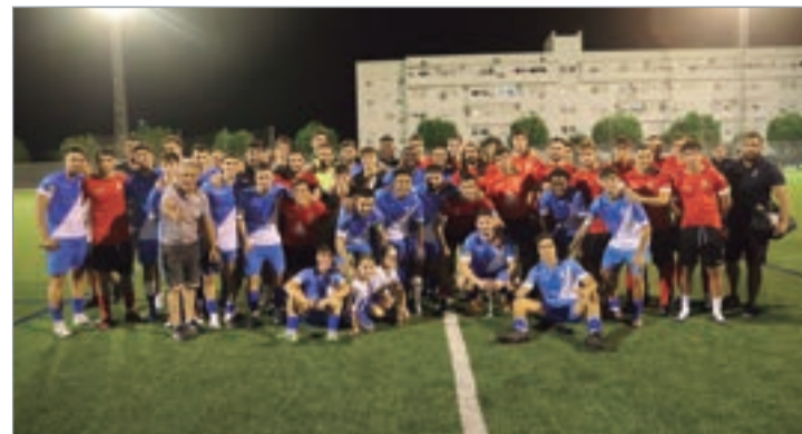
La deportividad brilló en todo momento durante el transcurso del encuentro.