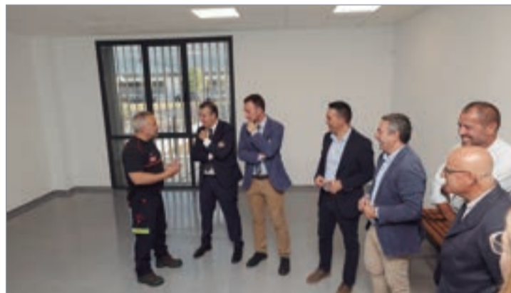
Visita institucional al nuevo recinto.