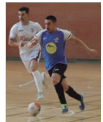
Gori, uno de los «veteranos».

La próxima semana, en el estreno a domicilio, visitarán Lora del Río para jugar con el Cerro Balompié.