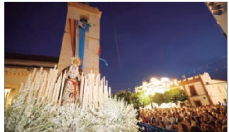
La Patrona fue arropada por sus vecinos y vecinas.