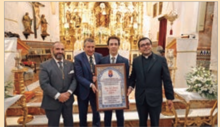
El pregonero recibió un azulejo conmemorativo de manos del alcalde.