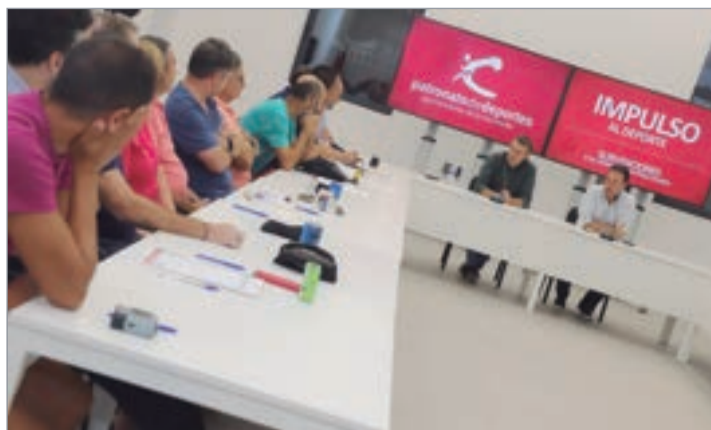
El alcalde y edil de Deportes con los clubes deportivos.

Por su parte, Fernández recaló que, “a mayores de los resultados deportivos porque, evidentemente, nos gusta que nuestros equipos ganen y los apoyamos para que lo consigan, es casi más importante la incansable labor de formación y promoción de la localidad que realizan,