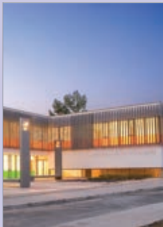
Ayuntamiento de La Rinconada.