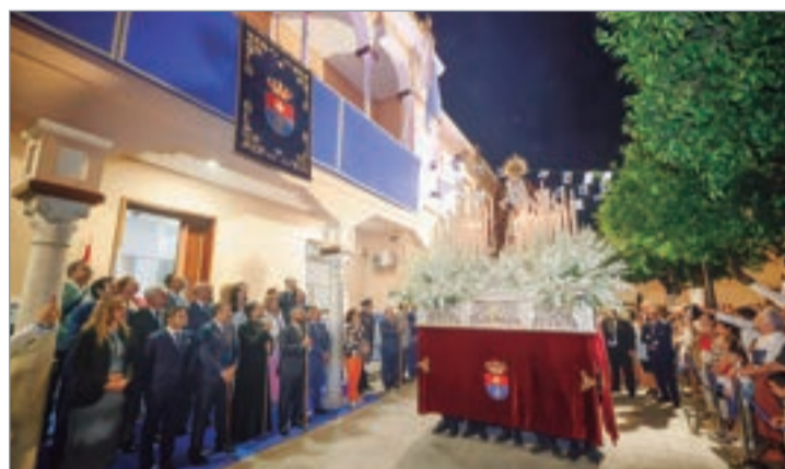
El alcalde entregó un ramo a la Virgen a su paso por el Ayuntamiento.