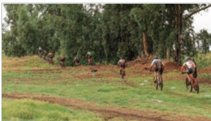
Una imagen del espectacular recorrido de la XI Cicloturista de La Rinconada.