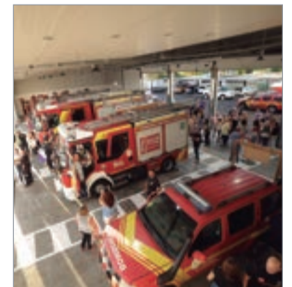
Vehículos del Parque del Bomberos.