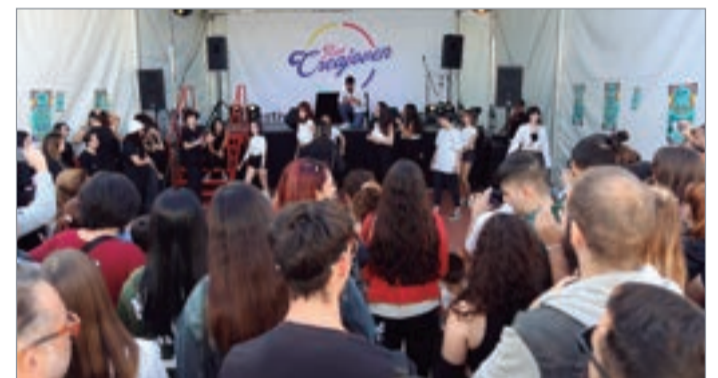
Imagen de la edición de 2022 del Festival Red Creajoven.

Una vez tramitada la inscripción, los solicitantes podrán acceder a todo tipo de información sobre concursos, muestras, premios y otras actividades que pueden ser de su interés, así