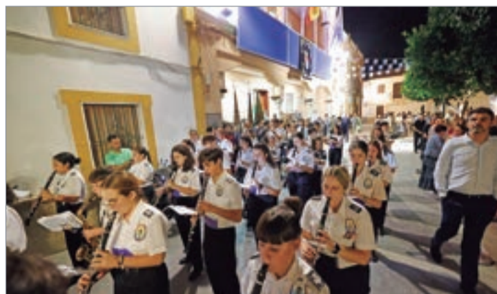
La Banda Municipal acompañó el paso en su recorrido.