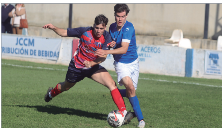
Ceballos pelea un balón con el lateral del Puebla en el duelo del San Sebastián.

El San José logra sendos triunfos ante Diablos Rojos y Demo, que le permiten salir de los puestos de abajo y ganar crédito de cara a la segunda mitad de la temporada