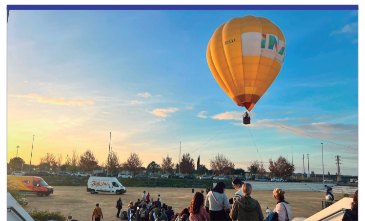
El globo solidario tuvo muy buena acogida.