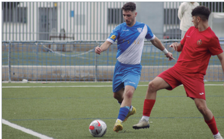
Kisko, que abrió el marcador ante el Diablos Rojos, se lleva el balón.

Tres victorias consecutivas alejan los fantasmas del Nuevo Ramos Yerga y cambian el objetivo del equipo