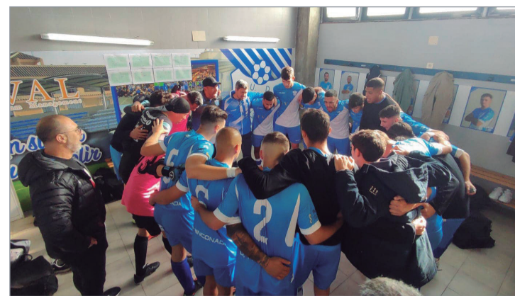
El equipo rinconero se conjuga en el cestuario para conseguir la victoria.