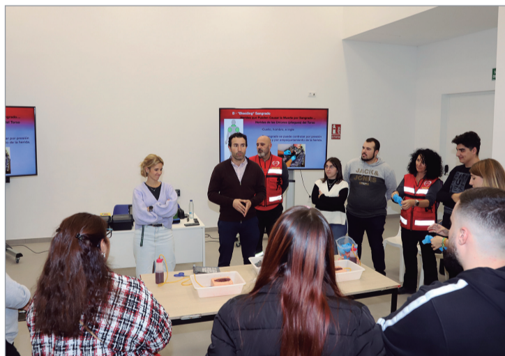
El delegado de Salud y la edil de Participación Ciudadana en uno de los talleres.

Desde el área de Salud llevan a cabo esta formación para que las personas participantes sean capaces de detectar, analizar y abordar de forma eficiente situaciones de emergencias que puedan darse en su futuro entorno laboral o en su vida diaria