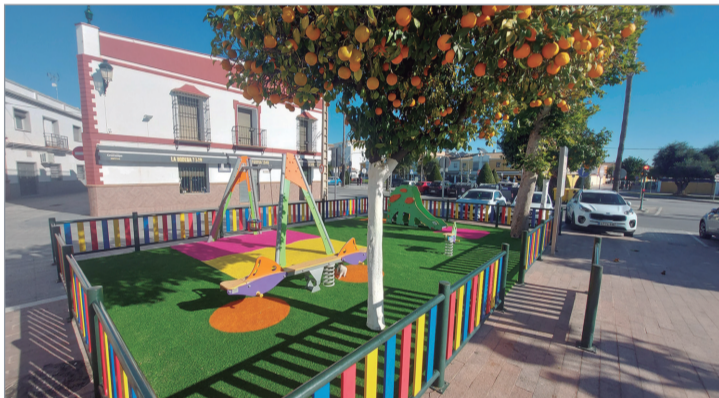
La plaza ya remodelada.