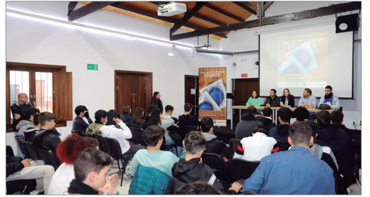
Presentación de la campaña en la Hacienda Santa Cruz.