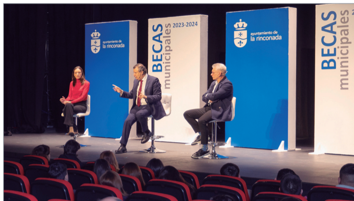
El alcalde y los ediles de Educación y Juventud en la entrega de becas.

alumnado beneficiario de las ayudas: "tenéis entre 16 y 18 años y claro que es el momento de divertirte y estar con los amigos, pero no podéis perder de vista que estáis invirtiendo en vosotros, que de lo que sembréis hoy dependerá vuestro futuro y que, en unos años, cuando ya estéis incorporados al mercado laboral, comprenderéis que, a mayor formación, más oportunidades".