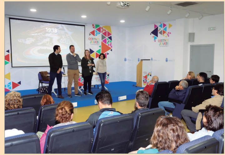
Presentación del programa en La Estación.

En esa misma línea ha hablado el edil de Deportes que ha resaltado que es “una acción cooperativa, no competi-