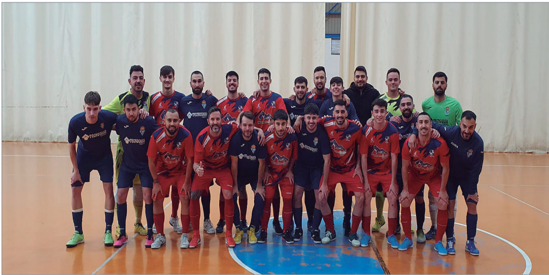
Los integrantes del Tres Calles y el Cañamera Futsal posan antes del derbi que les enfrentó en el Agustín Andrade.