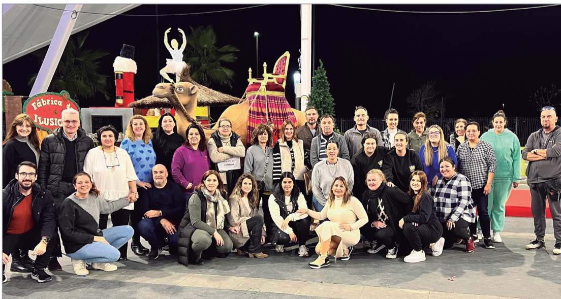
Foto de familia de participantes en el Mercadillo Navideño de El Abrazo.

campaña 'Los barrios son tu Navidad', que se desarrolla del 12 al 28 de diciembre en diferentes puntos del municipio. La campaña incluye además de atracciones para los más pequeños, actuaciones musicales, nevadas, chocolatadas y pasacalles para que pequeños y mayores disfruten de estos días y paseen por las principales zonas comerciales del municipio.