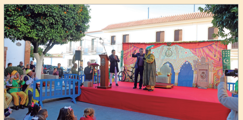
El alcalde entregó las llaves de la ciudad al Visir.

el bienestar de las personas participantes, que se establezcan sinergias entre vosotros y vosotras, sino que permiten que surjan nuevas ideas y, además, abre el centro para que se conozca lo que se realiza en el CPA". Han sido muchas horas de trabajo de aguja e hilo, durante 10 meses, donde han participado alrededor de una quincena de usuarias. La exposición está abierta al público los fines de semanas de 5 a 7 de la tarde.