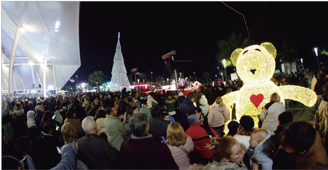
El Abrazo reunió a gran público en el encendido del alumbrado.