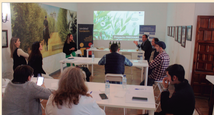
Participantes en una de las acciones formativas desarrolladas.

De esta forma, los participantes han ampliado sus conocimientos sobre el proceso de obtención del aceite de oliva y sus propiedades organolépticas. Además, han tenido la oportunidad de conocer iniciativas innovadoras que permiten la evolución de la industria aceitera como es el caso de Prediabo, un proyecto desarrollado por Acesur y