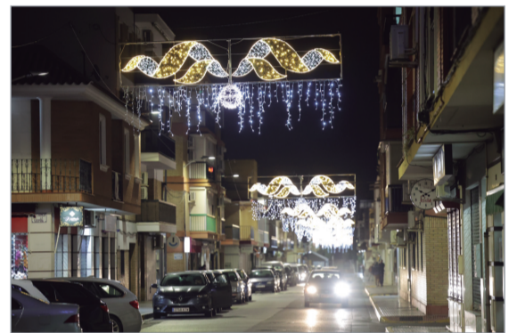
Alumbrado de la calle Córdoba.