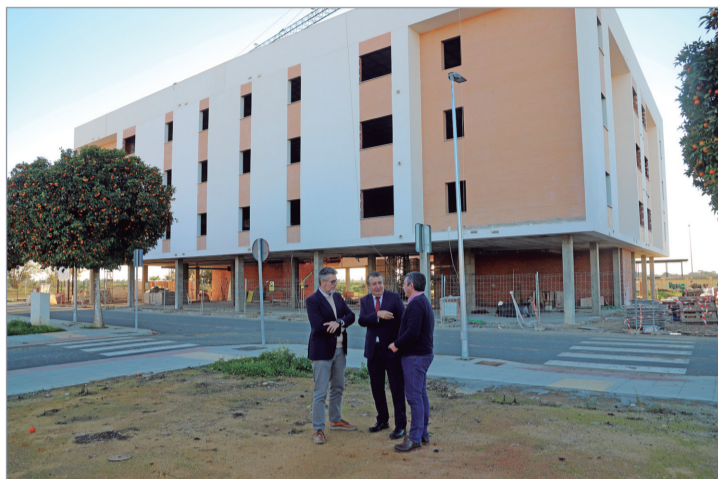
El alcalde visitó las obras de construcción de las viviendas.

En esta primera fase se llevaron a cabo los trabajos previos de preparación y acondicionamiento del terreno para a continuación pasar a la eje-