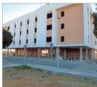
24 viviendas en alquiler.

vpo. Continúa la planificación de nuevos desarrollos residenciales como Las Ventillas, Haza de la Era, San José Norte o Bulevar Almonazar.