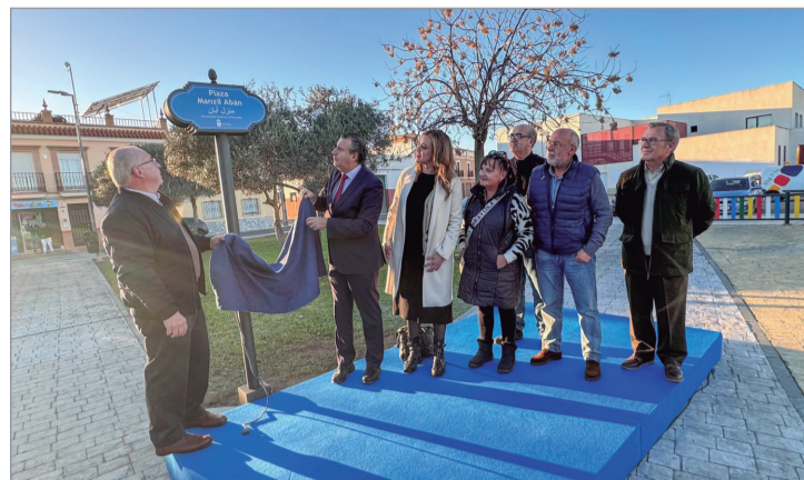
El alcalde, la edil de Cultura y la Comisión descubren la placa.

El alcalde ha agradecido el trabajo de la Comisión por su labor importante de recopilación documental y ha reconocido a todas las personas, entidades y colectivos que se han sumado "a una efeméride que está marcando un hecho identitario, pues se conmemora