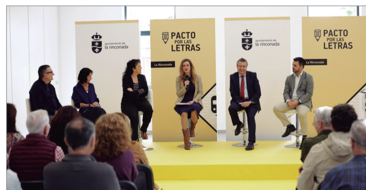
La Rinconada Ciudad de los Libros y las Letras.

miento en programas estrella como piscinas, medicina deportiva, escuelas deportivas; más fondos para clubes, deportistas y eventos y nuevos proyectos para este 2024”, ha señalado la delegada de Hacienda. Sin olvidar la apuesta por la juventud, un Plan Integral Joven, transversal a todas las áreas municipales, que implica vivienda, empleo, formación, becas, cultura, deporte o emprendimiento.