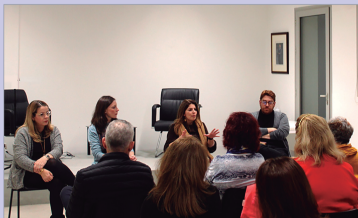
Presentación del proyecto en Los Silos.