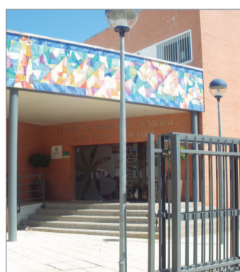
13 millones de euros para Soderinsa.

Por su parte Soderinsa dispondrá 13 millones de euros; Desarrollo Económico crece un 49%; Innovación un 3,52% y