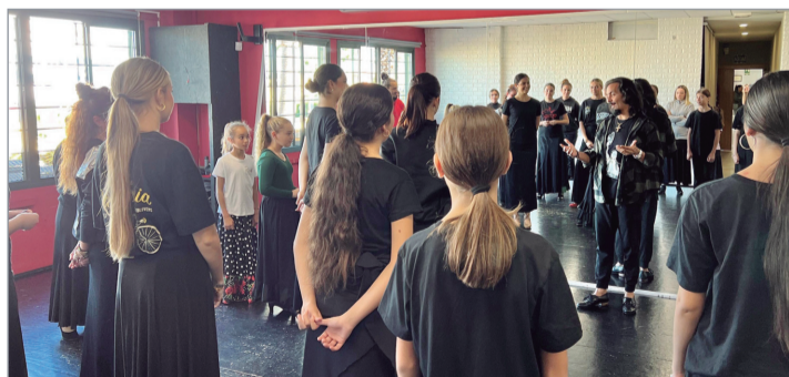
Farruquito durante la masterclass que impartió en la escuela.