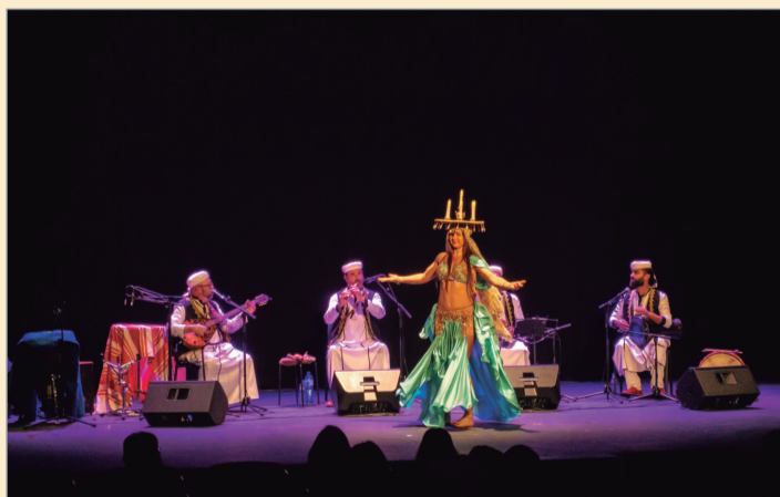
Momento de la actuación del grupo Caravan.

Egipto, Grecia, Irak y muchos más. El concierto se encuadró en el objetivo de que el Mediterráneo quiere Paz y respeto a los Derechos Humanos. "Siempre hemos entendido que la cultura es la mejor arma