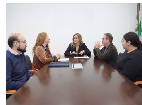
Firma de acuerdos programáticos.

árboles junto a la comunidad educativa; Potenciar el Plan de Comercio vigente, con la ampliación de las acciones orientadas a fidelizar la marca Rinconada y el consumo en establecimientos del municipio; Continuar avanzando en sistemas de refuerzo de la seguridad vial mediante la ampliación de pilotos como el de pasos de peatones iluminados mediante captadores solares; Estudiar nuevos sistemas de participación ciudadana multicanal que sigan redundando en la simplificación administrativa, la eficiencia de la tramitación de respuestas vecinales y la gobernanza abierta.