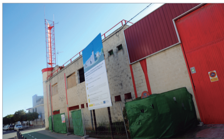
Las obras avanzan a buen ritmo.

Las obras, que ejecuta la empresa local Revesán con un presupuesto de 850.000 euros, avanzan según lo previsto