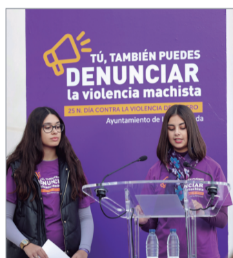
Contra la violencia machista.

Desde 2016, La Rinconada es reconocida como excelente en inversión social por la Asociación de Gerentes y Directores de Servicios Sociales de España. Así, Bienestar Social roza los 6 millones de euros (un 3,8% más que en 2023). Destacan los crecimientos en el Bono de Alquiler Municipal (+15%), en el escudo de protección a familias o el incremento en Ayuda a Domicilio (2,6 millones de euros, +6%). También aumenta la colaboración con el Tercer Sector (+4%, 1,7 millones). El Patronato Municipal de Personas con Discapacidad recibe más fondos que nunca, un 16,6% más, 2,34 millones “para seguir proporcionando servicios integrales, digni-