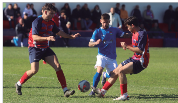
Carlitos debe ser el jugador diferencial del San José para conseguir el objetivo.

ción, y tienen encarrilada la final ante dos de la Sierra Sur, dado que en el Complejo Deportivo Sergio Carnerero Gil lograron imponerse por 0-2. La vuelta no será fácil, dado el potencial del equipo de Pedro García Gambín, pero sí es cierto que empieza muy de cara para los azulinos