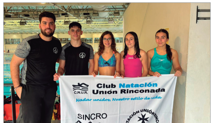
Los integrantes del CNUR, con su entrenador, en el Campeonato.

El Club Natación Unión Rinconada sigue creciendo en número de integrantes y en las marcas de los mismos, lo que se traduce en acceso a nuevas competiciones y a espacios que, hace no tanto tiempo, parecían una utopía.