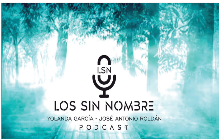
'Los sin nombre', el programa de misterio de Radio Rinconada.