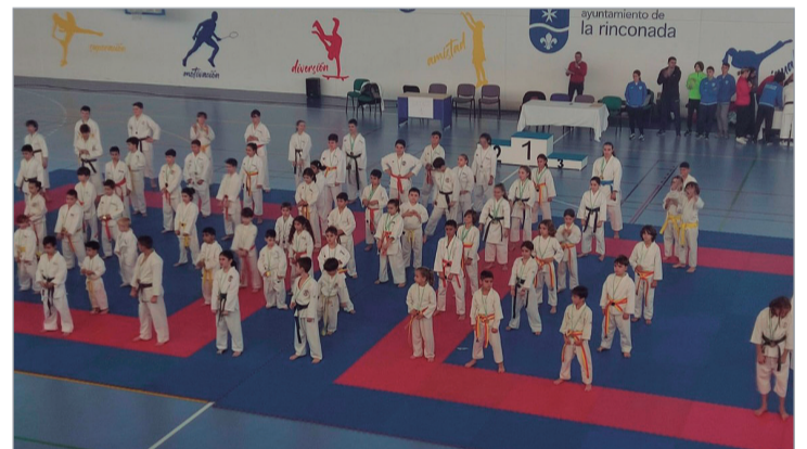
Integrantes del Club Shotokan La Rinconada, durante la exhibición de katas.

Alrededor de 350 personas se dieron cita en el pabellón de La Unión para la celebración de una nueva edición del Villa de La Rinconada de Karate, organizado por el Club