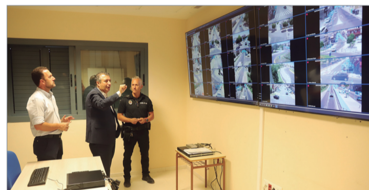
Sistema de videovigilancia en la Central Mixta de Seguridad.

el Agua y Contra el Cambio Climáticos de la mano de Medio Ambiente, Movilidad y Agenda 2030, 2 millones de euros (+11%); potenciación del transporte público (404.200 euros) y ampliación de la red de carriles bici; nuevos planes generales urbanísticos: PGOM y POU; fomento de la economía circular con casi 600 puntos de nuevos contenedores de reciclaje; Ordenación del Territorio suma + 30,4%, más de 678.000 euros.