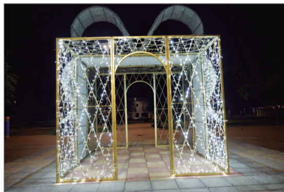
Adorno navideño en uno de los parques.