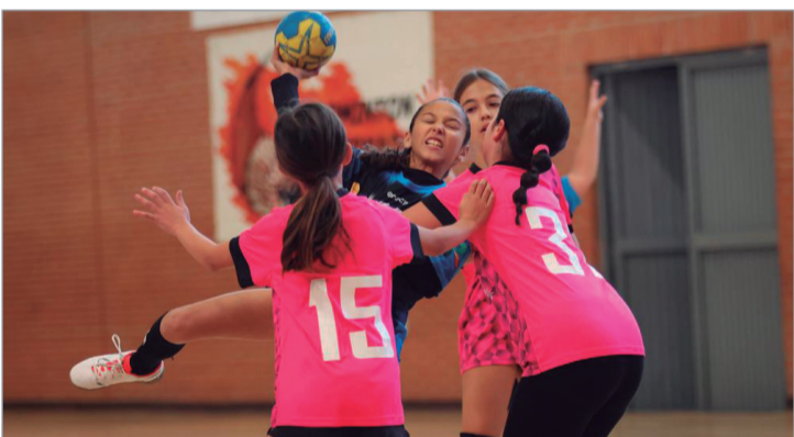
El balonmano femenino ha experimentado un gran auge. @Rafael Román.