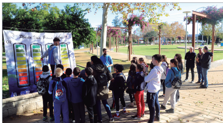
Los ediles de Educación y Medio Ambiente visitaron la actividad.

El procedimiento será el traslado, a través de los distintos carriles bici del municipio, desde los centros educativos, a distintos parques y zonas de esparcimiento de la localidad, en las que se llevarán a cabo dinámicas que ahondarán en la formación y concienciación de manera lúdica para que los escolares adquieran las pautas necesarias para el uso responsable del agua. A