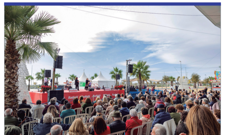
Un numeroso público acudió a la Gala de Navidad.