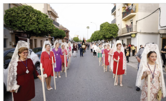
Mujeres y niñas de mantilla.