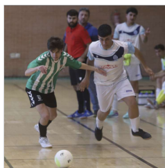
San José FS vs Marqués de Nervión.

Quedan doce puntos por jugar y, matemáticamente, aún quedan esperanzas, aunque, siendo realistas, la situación del Tres Calles es crítica y necesita un milagro grande para dar la campanada. Los rinconeros, tras la última derrota en Morón (8-4) se quedan a nueve puntos de la permanencia a falta de doce por disputar, por lo que están virtualmente descendidos.