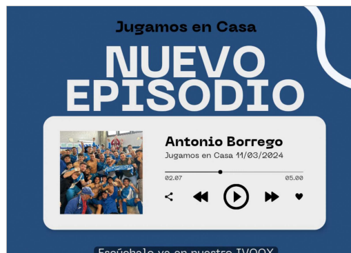
Imagen de 'Jugamos en Casa' en Instagram de Radio Rinconada.

Aunque su difusión se lleva a cabo principalmente en las Redes Sociales de Radio Rinconada (Facebook, Twitter e Instagram), a