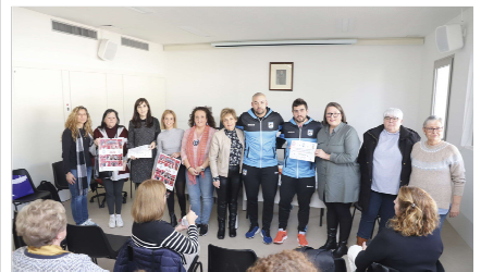
La delegada de Participación Ciudadana con los colectivos.

Lo recaudado con su venta ha sido donado a las asociaciones locales Amama y Alzheimer La Vega