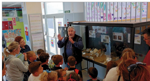
El Museo trasladó piezas al colegio para conocer el patrimonio local.

La Semana Cultural del centro ha estado dedicada al 775 aniversario del municipio. Los niños y niñas han cocinado con patata nueva de La Rinconada, han cantado coplas del carnaval rincronero y han podido visitar el museo