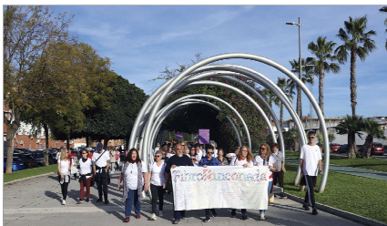
Numerosas personas participaron en la marcha.

La marcha, organizada por Fibrorinconada, partió de la Delegación de Igualdad y recorrió las calles de la localidad hasta llegar al Parque Central de La Unión