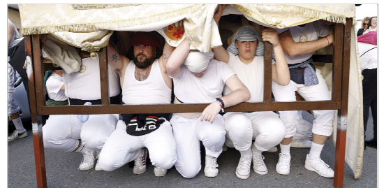
Costaleros descansando en un momento de la procesión.