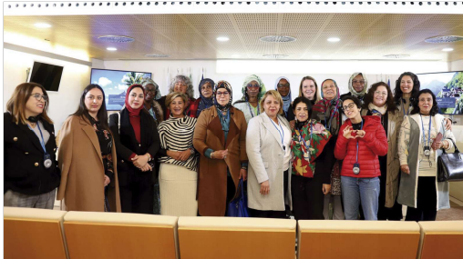
Delegación internacional en el Consistorio.

El Fondo Andaluz de Municipios para la Solidaridad Internacional (FAIMSI) lidera el proyecto "Promoción de la igualdad de género y alianzas regionales para la incorporación de la participación de las mujeres en la agenda política local y su empoderamiento económico en Marruecos, Mauritania y Túnez", cofinanciado por la Agencia Española de Cooperación Internacional para el Desarrollo (AECID), y las diputaciones de Jaén y Cádiz; en colaboración con la Federación ANMAR, la Dirección general de colectividades territoriales (DGCT)