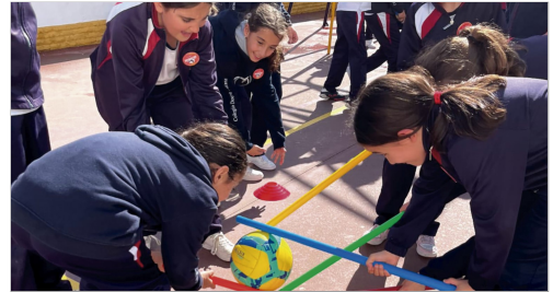
El alumnado participando en una de las pruebas.

color identifican cada casa desde sus respectivas banderas y estandartes. 85 son los alumnos y alumnas que componen cada una de ellas, contando con un capitán o capitana y un subcapitán o subcapitana, cargo que ostentan los más mayores, alumnos y alumnas de tercero y cuarto de la ESO. También el profesorado está involucrado en este proyecto formando parte de las distintas casas, tras cuya constitución en esta jornada inaugural se dio paso a la celebración de distintas competiciones deportivas. Pero este proyecto no solo despliega la competencia y la cooperación deportiva, también desarrolla estas y otras habilidades a través de un concurso de poesía, un torneo de ajedrez, un concurso de carteles de Semana Santa o un proyecto de reciclaje en el que las distintas casas competirán por ver quién acumula más reciclaje de plástico. Además, los mejores expedientes de cada clase puntuarán para sus respectivas casas.