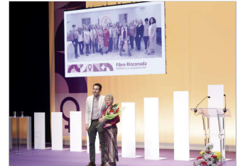
El colectivo FibroRinconada fue reconocido.