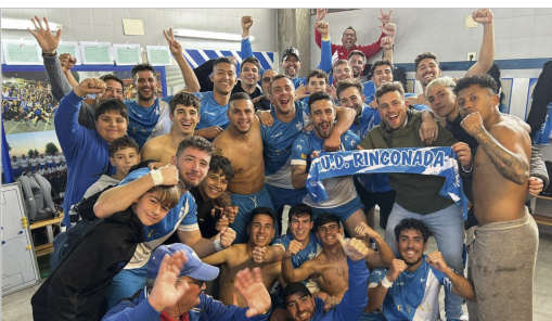
Celebración de la victoria ante el Alcalá que completaba una vuelta sin perder.

La derrota por la mínima ante el Ventippo frena la euforia y aprieta la pelea por el segundo puesto de cara a los Play Offs