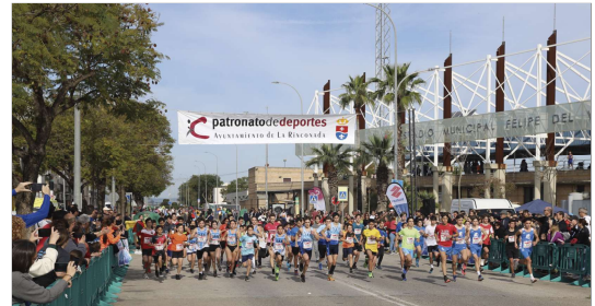
La salida de una de las pruebas de la cantera.