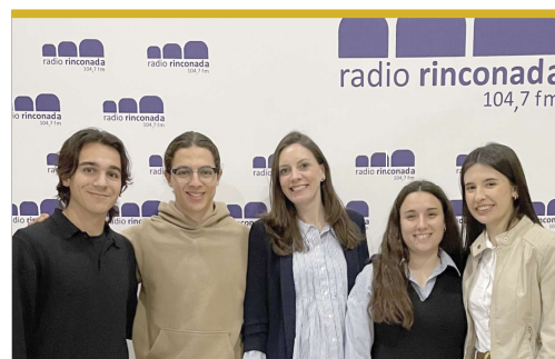
Los protagonistas, en la emisora de Radio Rinconada.