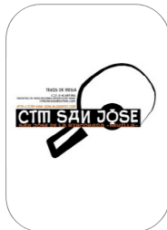
CTM San José Tenis de Mesa

El nadador del CNUR ha tomado parte en el Campeonato de España Infantil, que se ha celebrado recientemente en Tarrasa (Barcelona). El deportista se ha colgado la medalla de plata en los 50 metros Braza, lo que incide en su gran futuro.