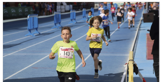
Participantes de la prueba Atletín entrando en la línea de meta.