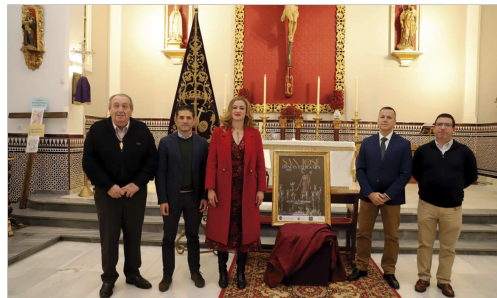
La iglesia San José acogió la presentación del cartel.

Rafael Reyes ha señalado que, en el ámbito de las Fiestas Mayores, “hay dos estaciones que comienzan antes que en ningún otro lugar, el otoño comienza cuando la Virgen de los Dolores sale en procesión el 15 de septiembre y la primavera comienza el 19 de marzo, con San José, porque para nosotros es un día de primavera, de luz, de tradiciones, de reencontros y de mucha alegría. San José es mucho más que una salida