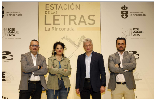
El teatro Antonio Gala ha acogido la presentación de Estación de las Letras.