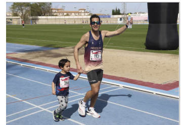
Una escena típica: Un padre entrando con su hijo.