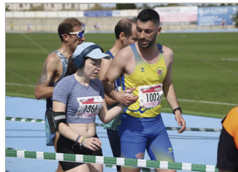
Más de 2.000 participantes en la prueba.