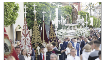
Un día radiante para disfrutar del Patrón.