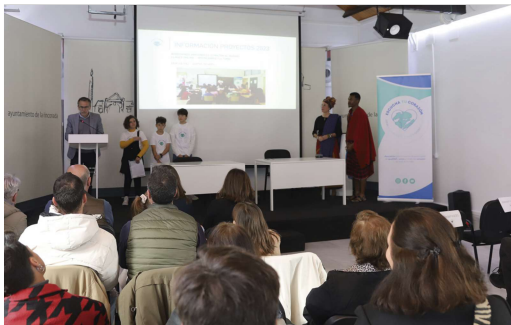
La Hacienda Santa Cruz acogió este evento de la ONGD.

La ONGD 'Escucha tu corazón' celebra un encuentro-presentación en la Hacienda Santa Cruz para dar a conocer sus proyectos de cooperación en Tanzania. También contó con un mercadillo solidario, improvisación musical y ambigü