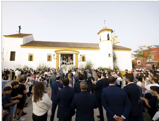
Numerosos fieles se dieron cita a su salida del templo..

Las puertas del templo volvían a abrirse pasadas las once y media de la noche con la llegada del paso después de hacer su recorrido marcado de momentos esperados como es el paso de San José por la Barrada La Paz y su parroquia Santa María Madre de Dios. Cabe destacar que, para la ocasión, el Ayuntamiento ha optimizado el alumbrado extraordinario colocándose arcos y pórticos lumínicos por las principales calles además de haberse aumentado el exorno del recorrido.