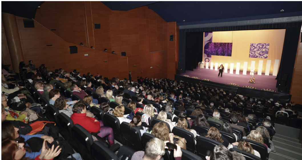
El teatro de La Villa volvió a tener lleno absoluto en una Gala que reivindica la igualdad y el feminismo.