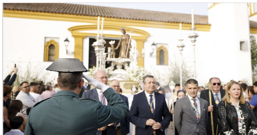
Autoridades en el cortejo procesional.