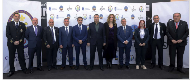
Foto de los directores de la agrupación junto al alcalde y la edil de Cultura.