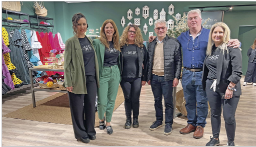
El edil de Comercio con los comerciantes participantes.

La muestra, que estará abierta hasta el 22 de abril, no sólo es un escaparate para los negocios participantes sino también una celebración de la tradición y la identidad flamenca hecha en La Rinconada.