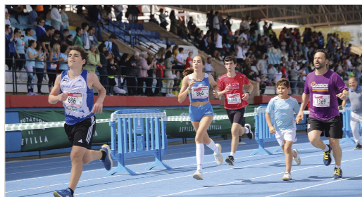
Las gradas del Felipe del Valle se llenaron de público.