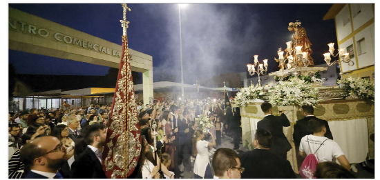
Momento inolvidable su paso por La Paz.