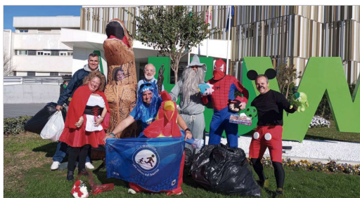
Los integrantes de Los Niños del Barrio a las puertas del Hospital.

Como ya llevan haciendo desde hace 8 años, el Club Atletismo Los Niños del Barrio han estado presentes en el Hospital Universitario Virgen Macarena, en el ala de oncología, haciendo entrega de juguetes y alegría para los pequeños guerreros que allí se encuentran.