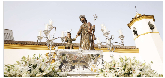
San José a su salida de la iglesia.