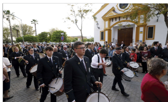
Banda Municipal Cristo del Perdón.