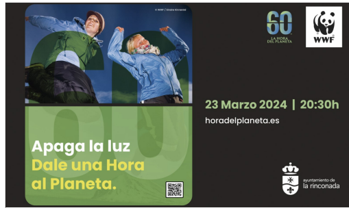
Diferentes edificios municipales se apagarán entre las 20.30 y las 21.30 horas.

La Hora del Planeta nació en Sidney, en Australia, en 2007, como un gesto simbólico para llamar la atención sobre el problema del cambio climático, apagando las luces de