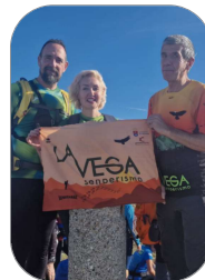
La Vega Senderismo