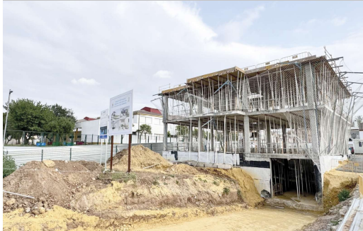
La estructura de la nueva sede de Emasesa está ya finalizada.

Las obras de este edificio, que comenzaron el pasado mes de mayo de 2023 y su finalización está prevista para finales de enero de 2025, han significado una inversión