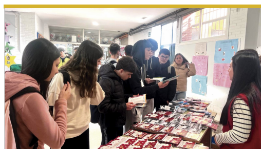
Alumnado recibiendo información en su instituto.

El programa tiene como requisitos tener una edad comprendida entre los 14 y 35 años preferentemente, tener las habilidades y capacidades básicas para su desarrollo e inscribirse previamente a la formación en la que se quiera participar. Más información en el Centro Joven La Estación, al 954793900 o escribir a informacionjuvenil@aytolarinconada.es