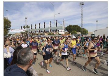
Imagen de la salida de la prueba Absoluta.