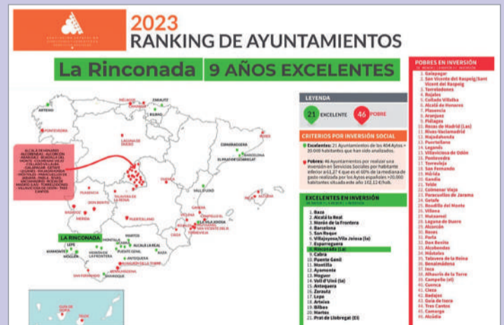
Sólo dos municipios de Sevilla lo han conseguido y uno es La Rinconada.