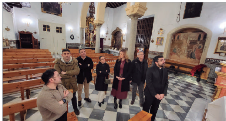
Visita institucional al retablo de la iglesia junto con el restaurador técnico.

pieza general para eliminar la suciedad superficial, los depósitos acumulados y la cera en superficie, además de retirar los barnices oxidados y los repintes históricos. "El objetivo de esta intervención fue devolver al retablo su estabilidad material y estructural, recuperar sus valores artísticos y permitir su contemplación tal como fue concebido en su época de ejecución. Se