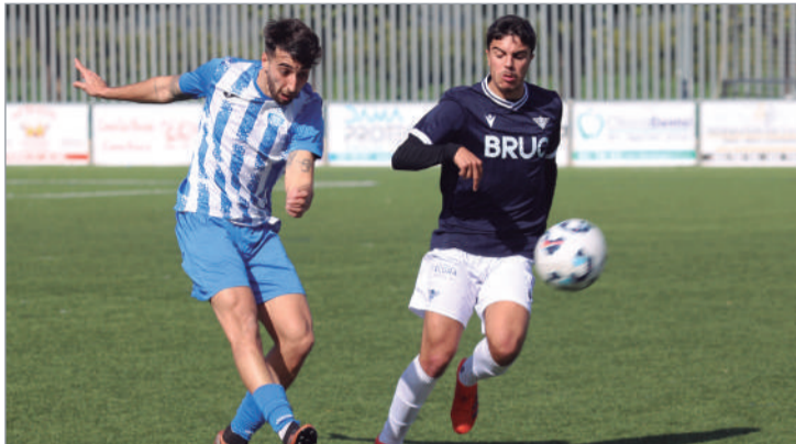
Pipi se lleva la pelota en el estreno liguero ante el Alcalá.

El cuadro cañamero debuta en un campo complicado, como el Municipal de Alcalá, con un resultado de 1-0