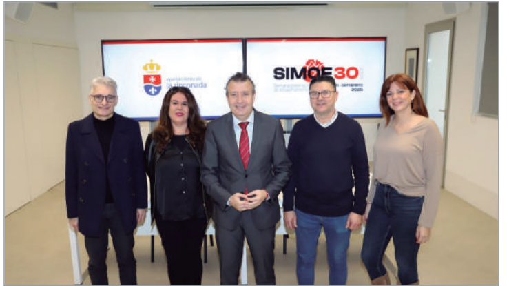
Firma de convenios con el alcalde y el edil de Comercio.

responde, tal y como la propia diseñadora explica, a su amor “por Andalucía, la tierra, sus colores”. De nuevo el color marca esta colección, todo el arco iris en sus complementos, el pan de oro, la mezcla de lunares y estampados... Pendientes largos que imitan diferentes tipos de raíces, para simbolizar el apego a nuestra tierra, a nuestra identidad.