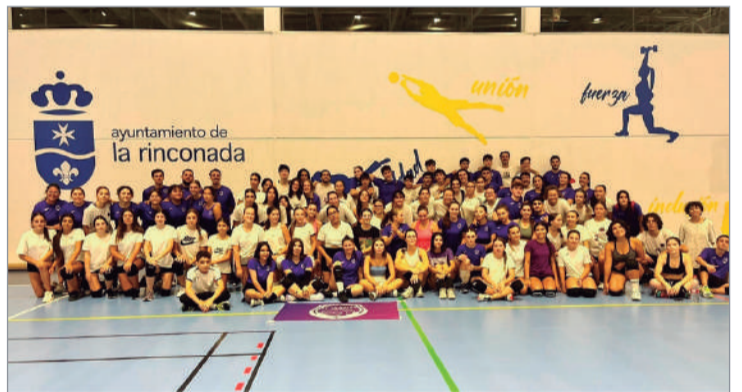
Foto de familia de todos los integrantes del Club Voleibol La Unión.