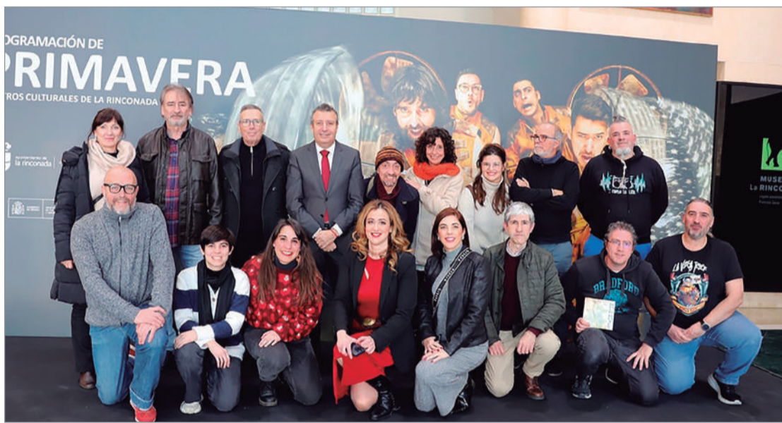
Presentación de la programación de los Centros Culturales de esta primavera.

El área de Cultura ha presentado las propuestas escénicas para los centros culturales de La Villa y Antonio Gala a la que sumará Estación de las Letras que tendrá como preludeo el Premio Almudena Grandes de las Letras; Esprim, escenarios de primavera; Huellas, danza en paisajes urbanos; exposiciones en la Sala Maga; acciones patrimoniales; artes plásticas; festivales de música... "La Rinconada afronta una primavera cultural extraordinaria. Como Ciudad de la Cultura, donde las artes y la creación son protagonistas de nuestros teatros, de los espacios públicos, para unir a todos los públicos en torno a proyectos plurales y potentes", afirma la I Teniente de Alcalde y delegada de Cultura, Raquel Vega.