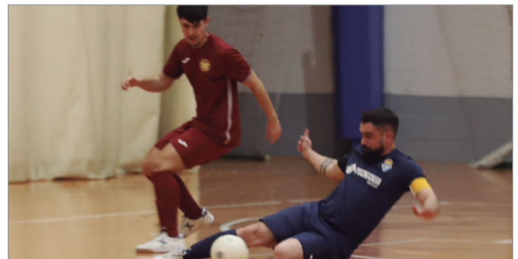
El Tres Calles perdió contra pronóstico en el Gorri con Los más Pitufos.