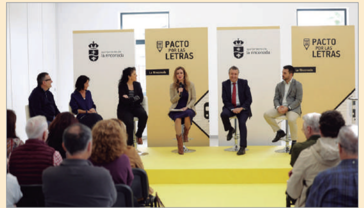
Imagen de archivo de la presentación del Pacto por las Letras.

“La Rinconada está comprometida firmemente en que la cultura y la creatividad sean parte integral de nuestras estrategias de desarrollo, con prácticas innovadoras en la planificación urbana centrada en el ser humano para conseguir un entorno urbano seguro, resi-