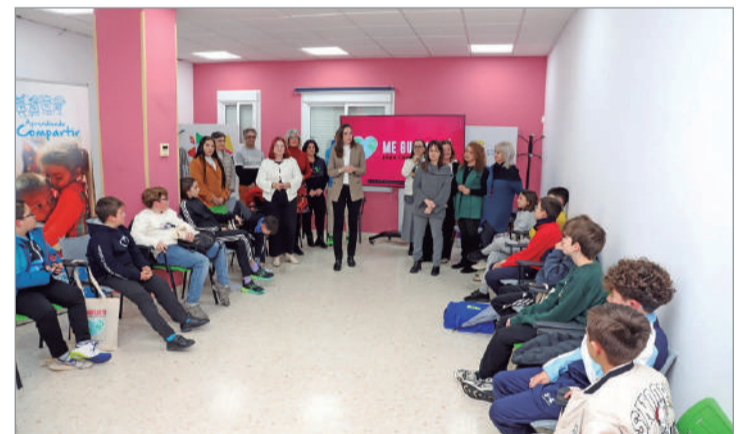
Presentación al OPI de las ONG locales.