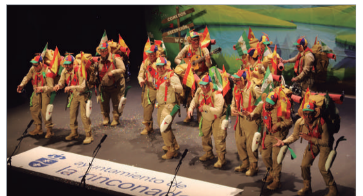
La chirigota del Maldo: Cuerpos Especiales no entró en la gran final.