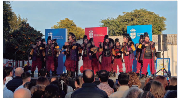
'La oveja negra' de Martínez Ares.