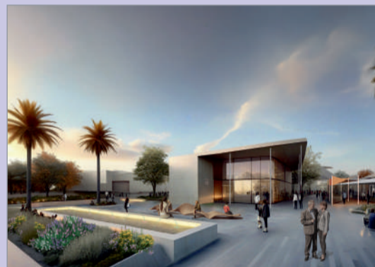
Se va a regenerar la barriada La Paz.

Un nuevo Centro de Estimulación Cognitiva en el edificio San Francisco Javier, ubicado en Carretera Nueva. Ante la demanda de mayor espacio del actual, “ponemos recursos públi-