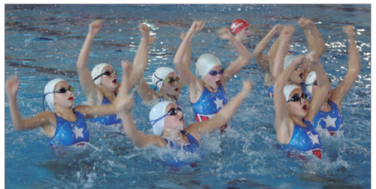
Clubes destacados de Natación Sincronizada estuvieron en La Rinconada.

La Rinconada acogía durante dos fines de semana la celebración del Campeonato de Andalucía de Natación Sincronizada, que reunió