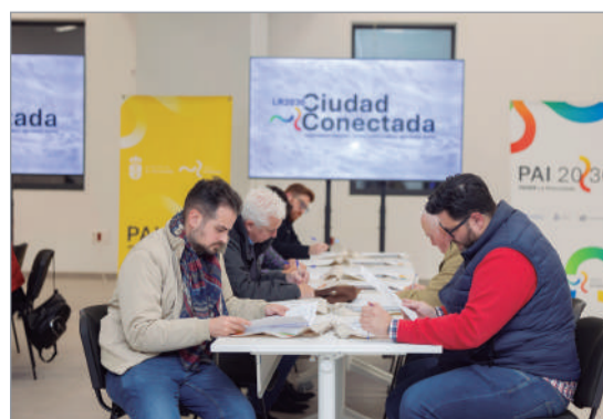
Más de 300 personas refrendan Ciudad Conectada.

ante la UE y el Gobierno de España, a través de la nueva convocatoria Estrategia de Desarrollo Integrado Local (EDIL).