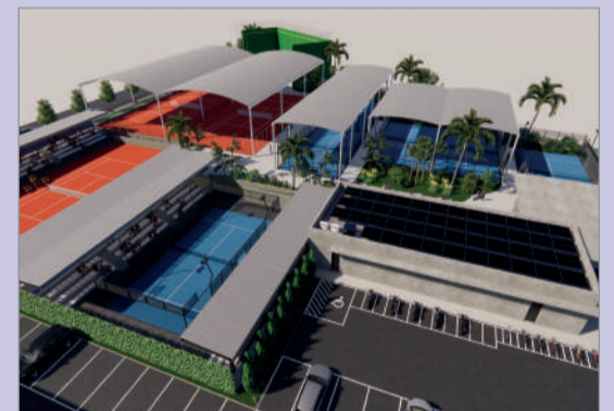
Se creará la Ciudad de la Raqueta.

cos para pacientes y familias”. Más accesible, con una zona ecosostenible al aire libre y más aulas para la Escuela de Cuidadores”.