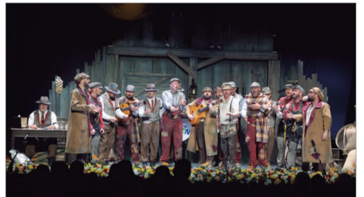
La comparsa de Morón de la Frontera, 'Sociedad Anónima', primer premio.