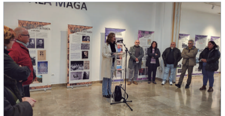
La delegada de Cultura durante su intervención en la apertura de la muestra.

La exposición, fruto de un laborioso trabajo en equipo, muestra, a través de 29 láminas, el largo alcance de la persecución, la esclavitud y la deportación de los republicanos españoles. Fueron víctimas los hombres y mujeres deportados a los campos nazis —desde su captura por el ejército alemán o por su implica-