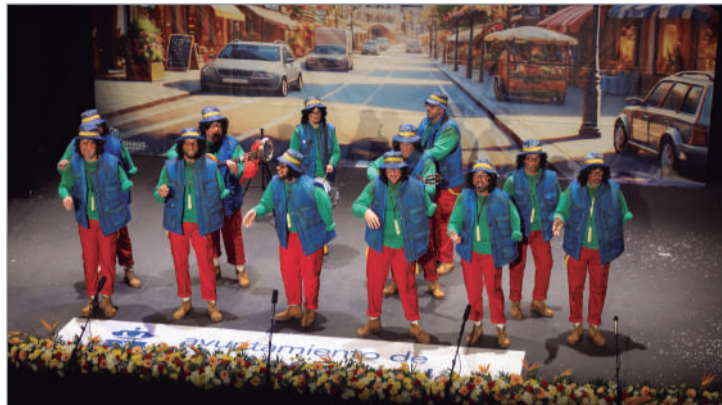
La chirigota 'Con una me sobra', de Los Palacios, primer premio.