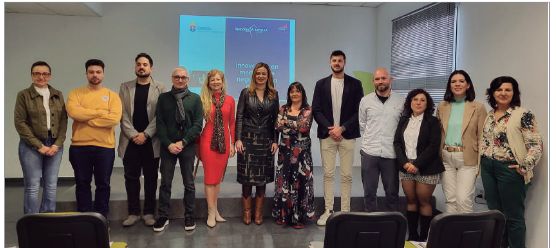
Presentación de la sexta edición de la Aceleradora de Empresas.

El responsable municipal de Desarrollo Económico ha subrayado que "desde el Ayuntamiento de La Rinconada vamos a estar de la mano y pondremos todos los medios para que las ideas tengan acompañamiento y se puedan poner en marcha. Este es un programa