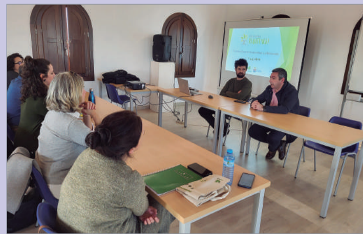
El edil de Hábitat Urbano y el presidente de Linde Verde en la presentación.

Por su parte, el presidente de Linde Verde ha detallado el proyecto. La Rinconada cuenta con una extensa red de caminos públicos y arroyos desprovistos de vegeta-