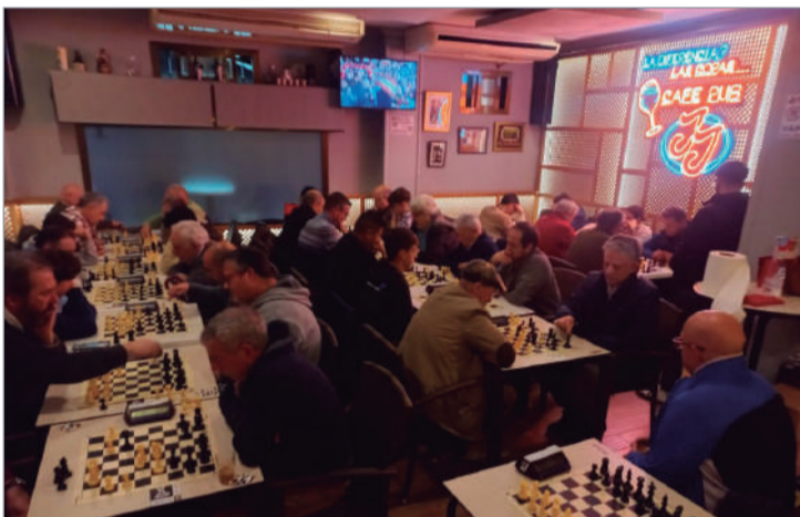
Una de las actividades que realiza el Club Ajedrez San José.

La entidad ha conformado cinco equipos, de los que el primero suma un empate, una derrota y una victoria en Primera Andaluza y cuatro militan en categorías provinciales