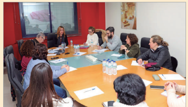
Reunión con librerías y editoriales para la Feria del Libro 2025.

Además, como cada edición, las bibliotecas públicas municipales reconocerán a los mejores lectores del pasado año. Éstos serán elegidos en base a los datos recogidos, a lo largo del último año, por la Red de Bibliotecas Públicas de La Rinconada en las categorías: adulto, infantil y juvenil. No fal-