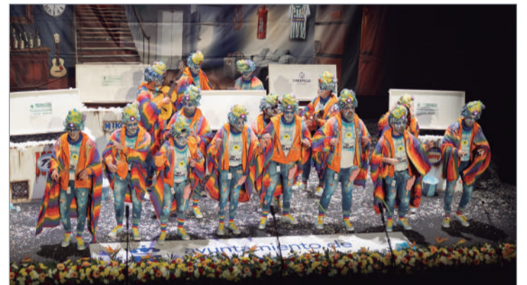
La agrupación 'De aquí salimos tiriti tiritando', tercer premio en chirigotas.