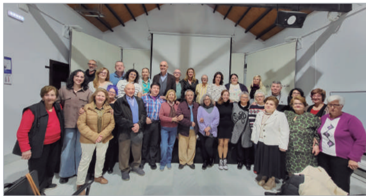
Foto de familia de la presentación del documento audiovisual.

El área de Memoria Histórica junto con el Museo de La Rinconada está llevando a cabo este proyecto en el que se entrevista a personas mayores para que narren cómo vivieron las familias rinconeras el golpe de estado, la guerra, la dictadura y la transición a la democracia