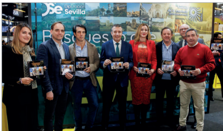
Presentación del proyecto rinconero en FITUR.

La Primera Teniente de Alcalde de La Rinconada ha explicado que “debemos entender el turismo como algo más que sol y playa y, en La Rinconada, además, podemos