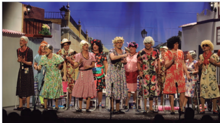
La chirigota 'Buscando la Fresca', la mejor clasificada de la localidad (2º).