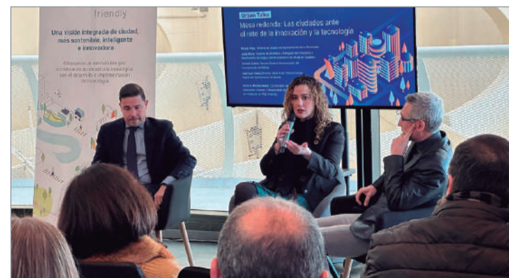
La delegada de Agenda 2030 en el foro celebrado en Las Setas.

dos en inteligencia artificial. También ha mencionado la apuesta por redes energéticas inteligentes y edificios sostenibles; el apoyo a la participación ciudadana digital; la transformación de la economía local o automatización de los entornos de trabajo y procesos productivos.