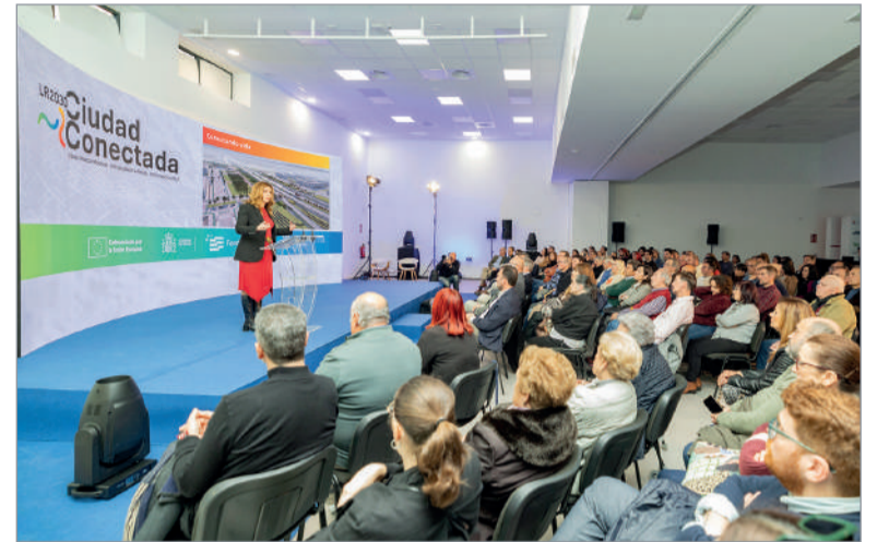
La I Teniente de Alcalde desgranó los proyectos previstos en el PAI.

salud, fortaleciendo el eje de la innovación, la digitalización, la acción contra el cambio climático, la inclusión social y las señas de identidad de La Rinconada como son la cultura y el deporte. Supondrán hasta 15 millones de euros para la transformación del municipio de los próximos años como una ciudad con alma de gran pueblo, que aspira a tener un liderazgo importante en Sevilla y estar a la vanguardia en convivencia, emprendimiento y oportunidades”, ha afirmado.