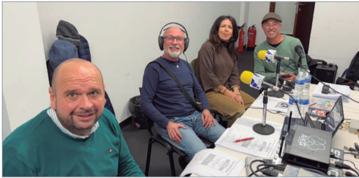
Los pregoneros del Carnaval, en el estudio de Radio Rinconada.

Como es habitual, Radio Rinconada ha puesto toda la carne en el asador para llevar a todos los hogares, a través de radio y televisión, la retransmisión del concurso