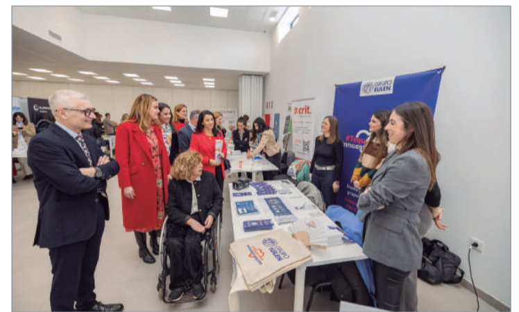
Los responsables municipales y COCEMFE visitando los stands de la Feria.

inauguración y ha hecho hincapié en seguir avanzando en las alianzas con empresas, tercer sector e instituciones públicas: "Si no vamos de la