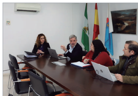
Ronda de contacto con portavoces municipales.

“Se mantiene viva la línea de trabajo permanente para poner sobre la mesa un proyecto más plural y representativo de todo el territorio”