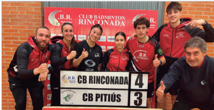
La plantilla del Bádminton Rinconada tras el último triunfo ante el Pitius.

El cuadro local, que recibía al Bádminton Ibiza en un duelo vital para seguir aspirando a su principal objetivo de esta campaña, se llevó el partido a la heroica por 4-3, remontando y sobreponiéndose a las bajas, que han asolado a la entidad en sus últimos compromisos