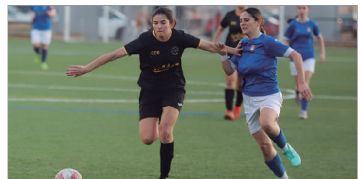
Imagen del último partido disputado en el Anexo ante el Golden Team (5-2).

En las últimas semanas, el equipo se ha impuesto al Golden Team (5-2) y al Bormujos (2-3), situándose en la décima posición de la tabla, a siete del Olivarensé Atlético y con cuatro de ventaja sobre el Arahál.