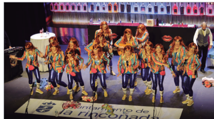
La chirigota 'A la moda' fue penalizada y, por ello, no entró en la final.