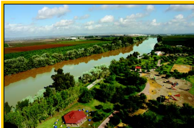
El Majuelo se ampliará en 85 hectáreas para mayor realce del Guadalquivir. Un gran anillo verde permitirá la práctica peatonal y ciclista. Se creará un nuevo parque junto al Cerro Macareno que añadirá valor a este yacimiento.

Desde el río emergerá un entramado que ofertará un recorrido peatonal y ciclista de unos 25 kilómetros y enlazará los principales espacios verdes. Penetrará en el Pago del Medio hasta el bulevar del Almonazar, atravesará Los Cañamos, conectará con el Dehesa Boyal y delimitará un nuevo entorno de esparcimiento y deporte en el futuro Parque de Las Graveras, junto a las Navas del Tabaco. Un gran recinto de 30 hectáreas vinculado al agua, la aventura y el motor, que ofertará una alternativa más para los jóvenes, a partir de un área de ocio