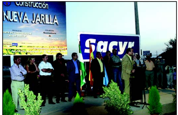
Más de quinientas personas fueron testigos de la colocación de la primera piedra que avanza una nueva Jarilla.