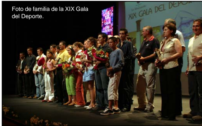
Foto de familia de la XIX Gala del Deporte.

Deportistas, aficionados, representantes de clubes, entrenadores y patrocinadores llenarán las 462 butacas del Centro Cultural de La Villa para presenciar la entrega de premios