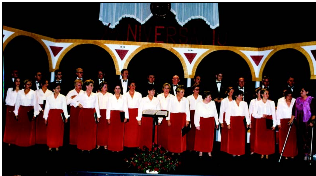
La Coral calienta motores para el grueso del programa celebración del 25 aniversario de su fundación.

Virgen de las Nieves conformaron el programa en torno a la festividad de la Patrona.