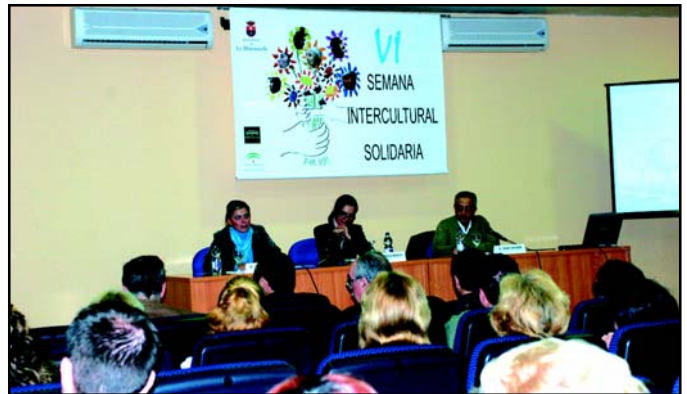
El Centro Cívico Juvenil acogió la celebración de la jornada de análisis del fenómeno de la inmigración en Andalucía.

Por otro lado, Bravo subrayó el papel «clave» de la mujer, como «la gran mediadora intercultural», al tiempo en que insistió en «una sociedad respetuosa con todas las identidades». «Debemos -resaltó- hacer un esfuerzo de compren-