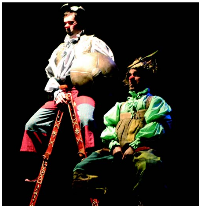
Clown Quijote cerró el 11 Festival de Teatro para Niños y Niñas.

Cerrado este ciclo, Cultura ya trabaja en el 12 Festival que estará listo en noviembre de 2006.