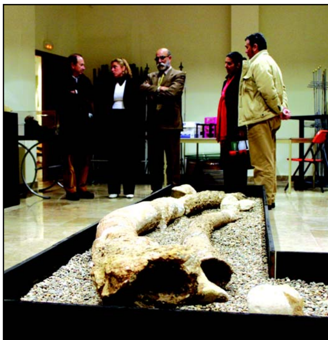
La colección. En el apartado arqueológico, hay una amplia muestra de cerámica de entre los siglos VIII y I a. C., con piezas tartésicas, fenicias, griegas, íberas y romanas. En Paleontología, destacan los grandes colmillos encontrados del Elephas Antiquus , precedente prehistórico del elefante que habitó en La Rinconada hace 100.000 millones de años.

El estudio solicitado, en el que el Ayuntamiento invertirá 26.600 euros y que estará listo en el plazo de seis meses, dará las claves para facilitar la redacción de un proyecto de acuerdo a la Ley Andaluza en