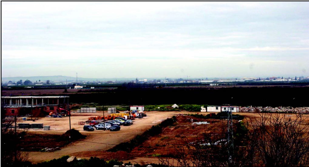
El Pago de En Medio se elevará como el corazón de la nueva ciudad. Secadero de Gutiérrez es el salto que desde San José se da hacia La Rinconada (al fondo).

El Ayuntamiento quiere crear corresponsabilidad entre el empresariado local y obtener precios asequibles en la construcción del Pago de En Medio para que de la riqueza generada se beneficien todos los ciudadanos. Unas jornadas dirigidas al sector darán a conocer el proceso.