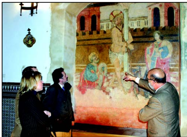
La delegada local de Cultura, con Bueno y los técnicos de la Consejería encargados de la restauración.

Algo más de un año y 36.000 euros ha invertido la Consejería de Cultura en la restauración. En su visita tras