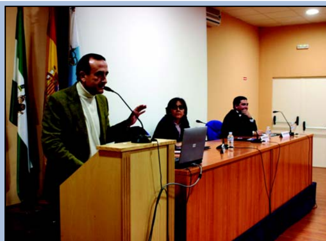
El alcalde fue el encargado de abrir las jornadas y de comprometerse «a seguir prestando atención de primera a ciudadanos de primera».

Y el círculo está a punto de cerrarse puesto que al Centro Ocupacional -servicio embrionario del macrocomplejo- se han ido sumando la residencia para adultos, cuya segunda fase y ampliación a 32 está ya proyectada, y en los últimos meses la unidad de día, destinada a 19 personas con un alto grado de dependencia pero