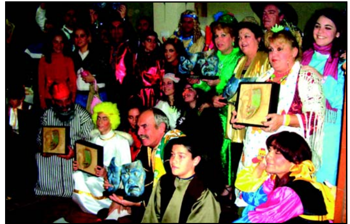
'La Trastería' en una reciente actuación.

La labor que la asociación cultural 'La Caracola' viene desempeñando desde 1998 será merecedora de otro de los Premios a la Igualdad. Un colectivo integrado por jóvenes con entre 17 y 35 años que centra su actividad en la animación sociocultural. Entre otras iniciativas, 'La Caracola' ha tomado parte en el programa 'Diversia 180º', en diferen-