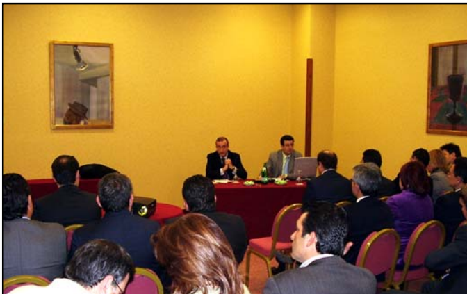
Cuarenta empresarios y emprendedores se desplazaron a Madrid para asistir a la presentación del Cáñamo III.

E l Ayuntamiento de La Rinconada, en colaboración con el Fondo Social Europeo y el Servicio Andaluz de Empleo, convoca 25 plazas becadas para prácticas profesionales en empresas. Esta acción formativa tendrá una duración de entre 3 y 4 meses. Está dirigida a jóvenes menores de 30 años, con titulación en Formación Profesional Reglada (Grado Medio o Superior) o con certificación de curso de F.P.O. También es requisito que no haya transcurrido más de dos años desde la obtención de la titulación o certificación y carecer de experiencia profesional relacionada con dicha cualificación.