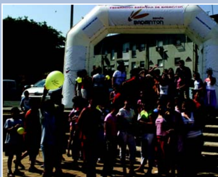
La calle del ocio