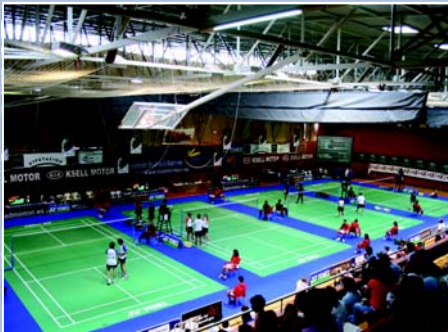
Listos para el gran evento