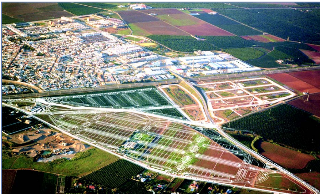
Vista aérea del parcelario

De igual modo y como apoyo de transporte público a los Cádiz, un segundo