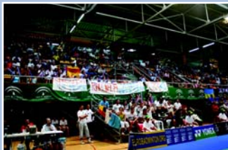
La grada fue una olla a presión