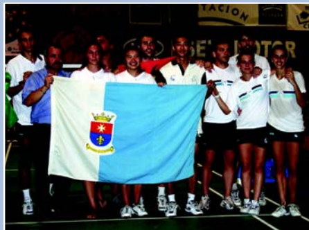
En la celebración no podía faltar la bandera