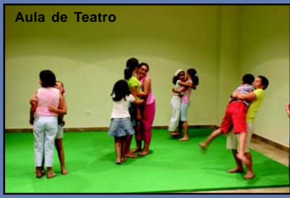
Aula de Teatro