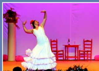
Humor, música, baile, luz y mucho color