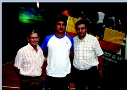
Las autoridades mostraron su apoyo al club