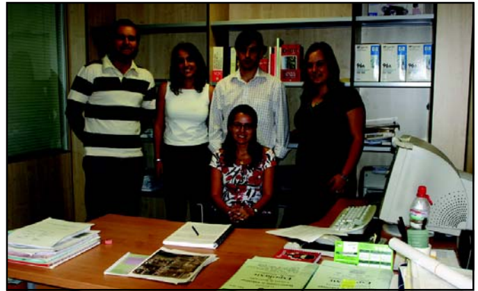
15 jóvenes iniciaron su contrato en el consistorio el 20 de junio.

Los datos locales apuntan que una media de 50 jóvenes acaban cada curso su formación universitaria e inician una nueva etapa vinculada al mun-