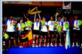
La copa de los campeones