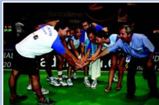
El grito de la victoria