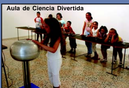
Aula de Ciencia Divertida

versión. En horario de mañana, los participantes en ambos núcleos aprenden y se divierten con las Aulas de Teatro y Ciencia Divertida, respectivamente. Por un lado, aprenden a hablar en público y pierden el miedo escénico con divertidos ejercicios corporales y de interpre-