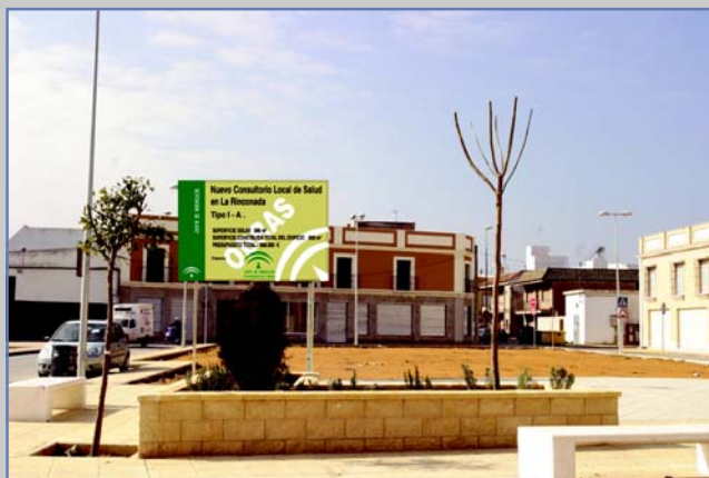
En la imagen, la parcela municipal de 546 metros cuadrados destinada al nuevo centro de salud de La Rinconada.

La iniciativa, que depende en cuanto a su ejecución de la Junta de Andalucía, se encuentra en este momento en fase de redacción, toda vez que el Gobierno autonómico -que financia las obras- ya ha librado