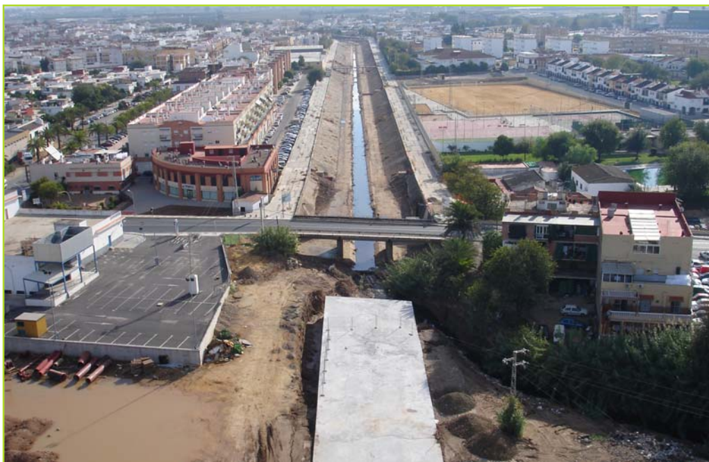
La zona de Secadero de Gutiérrez es un muy buen ejemplo de cómo se va a actuar y cuál va a ser el resultado final del encauzamiento subterráneo que se ejecutará en los dos kilómetros que ahora atraviesan San José.

Por delante en la parte administrativa, la firma del con-