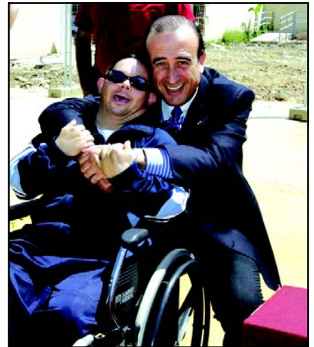
Abad saluda a Chaves momentos antes de la inauguración del primer tramo de la autovía, una de las referencias de la legislatura en movilidad. A la derecha, en una reciente visita a la ciudad de la discapacidad de Torrepavas. Debajo, junto a la ministra de Medio Ambiente, en el reconocimiento institucional por el respaldo económico del Gobierno de Zapatero al soterramiento del Almonazar.

ha permitido la retroalimentación en este devenir juntos» y «que tiene una focalización nítida y transparente de La Rinconada como un pueblo de excelencia».