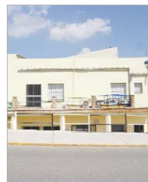
Nuevo edificio de Juventud.