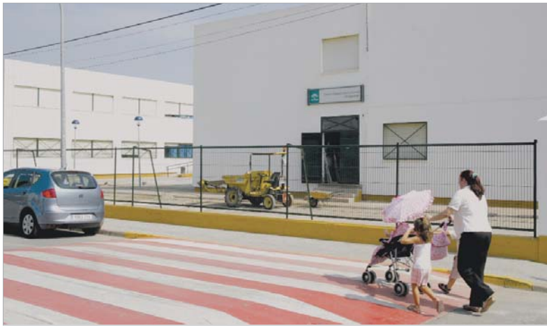
El colegio Azahares acogerá en La Rinconada al Aula de Mayores.