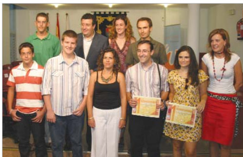
Los ganadores verán sus obras publicadas el próximo año.

Gran Vega premia a los jóvenes que narran su visión sobre la comarca