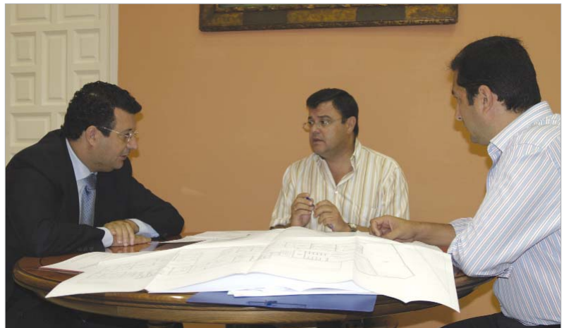
La primera cita tras verano reunió al alcalde y al delegado de Seguridad con el subdelegado del Gobierno.

El nuevo complejo permitirá además que servicios de la Guardia Civil ya vinculados a esta zona se integren en La Rinconada, como son la Policía Judicial, el Seprona, los mandos de la Primera Compañía y personal administrativo.