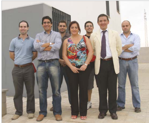
La delegada de Desarrollo Económico con los integrantes del Vivero de Oficinas del Cañamo II.

En este caso, las cinco firmas son de reciente creación y desarrollan actividades relacionadas con las nuevas tecnologías y los servicios avanzados. Programación informática, integración tecnológica, asesora-