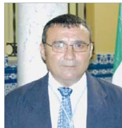
El delegado de Urbanismo.

ción contempla la edificación en una parcela de algo más de 2.000 metros cuadrados, con una ter-