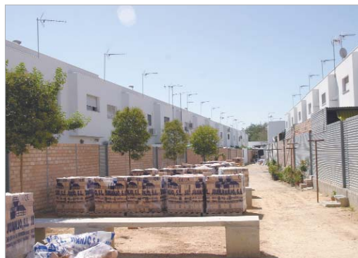
Una zona del Huerto del Benito en la que se está trabajando.

En cuanto a la finalización de los trabajos, está previsto que sea a mediados de octubre.