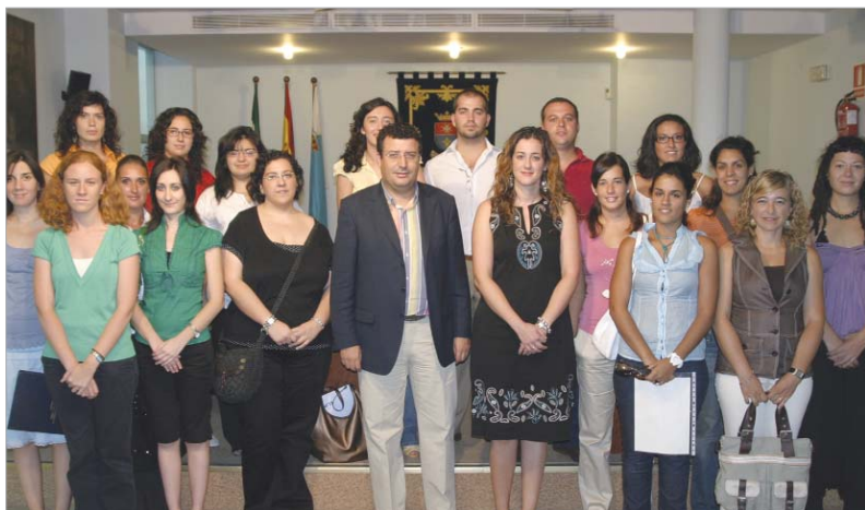
Los recién contratados fueron recibidos por el alcalde y la delegada de Recursos Humanos.

Se abre así una ventana directa a través de la que recibir información sobre concursos, muestras o premios a nivel provincial, regional y nacional.