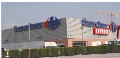
Imagen del edificio en el que se ha abierto el nuevo Carrefour.

nal donde se ofertarán todo tipo de productos habituales de alimentación, limpieza, hogar textil y también electrodomésticos, una nueva línea con la que esta cadena quiere aterrizar en zonas metropolitanas y acercar su producto.