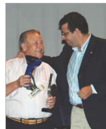
Momento emotivo del año pasado.