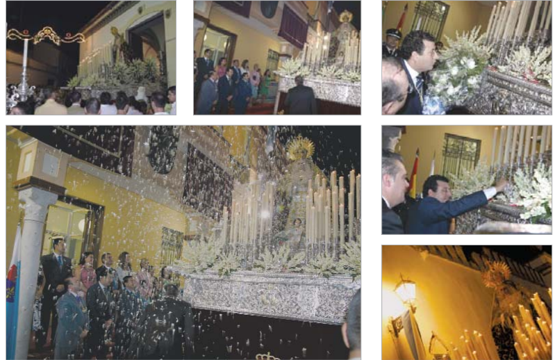
La procesión incluyó novedades emotivas a las puertas del Ayuntamiento.

Patrona ante el fervor y el aplauso generalizado de todos los asistentes al acto y el acompañamiento musical de la Banda Cristo del Perdón. Posteriormente, la procesión recorrió las calles Morillo de los Ríos, Aire y Plaza Rodríguez Montes antes de regresar a la Plaza de España y recogerse en la Capilla de los Dolores en torno a la una de la madrugada.