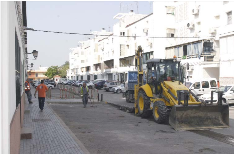
Operarios trabajando en la remodelación del asfalto.