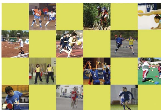
cartel de las escuelas deportivas municipales.