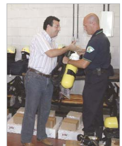
Momento de la entrega.

Los bomberos conocieron la intención municipal en un encuentro con el alcalde en el que éste les hizo entrega de 12 equipos completos de material de trabajo y protección valorados en 36.000 euros.