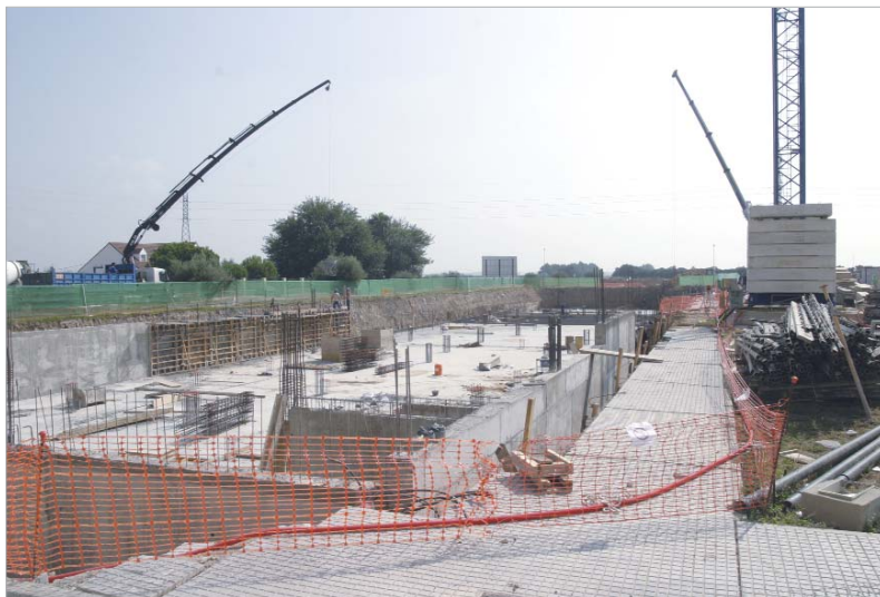
Imagen de los terrenos en los que se está construyendo la promoción de viviendas.

La promoción de 64 pisos incluye 88 plazas de garaje y 13 locales comerciales