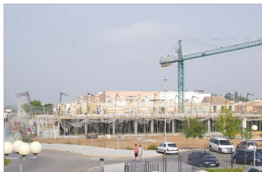
El nuevo colegio de San José al 20 por ciento.