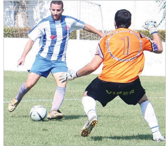
Morillo pudo adelantar dos veces al Rinconada ante el Villafranco.