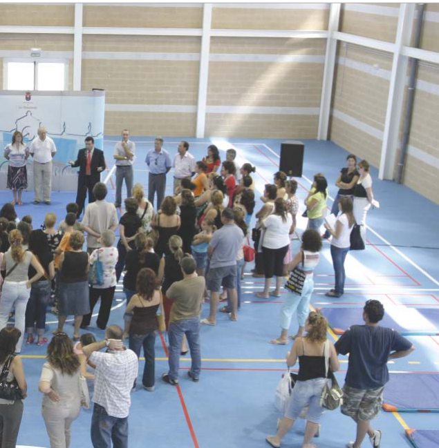
Profesores y padres fueron testigos de la inauguración oficial de los pabellones cubiertos.

Las Asociaciones de Madres y Padres recibirán más de 20.000 euros en subvenciones para actividades