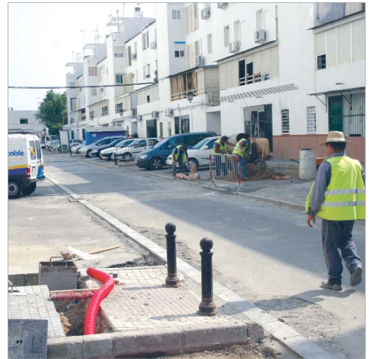
Imagen que presenta la calle sobre la que se está actuando.