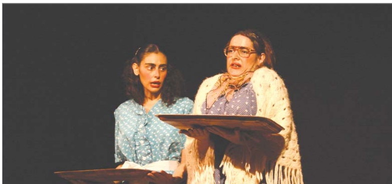
Dos de las actrices de la obra Princesas del Pacífico, en una de sus actuaciones.