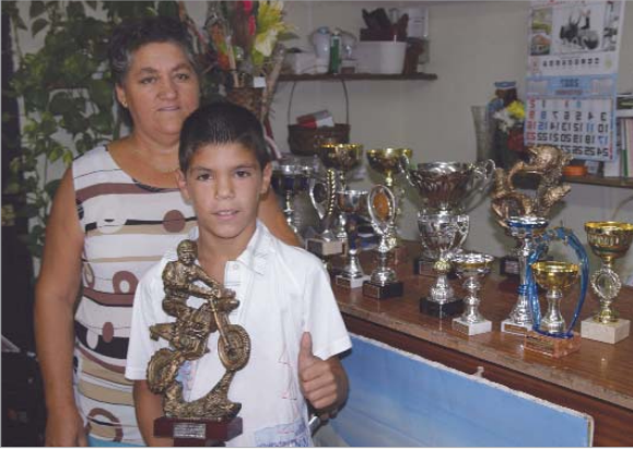
El joven rinconero muestra todos sus trofeos.