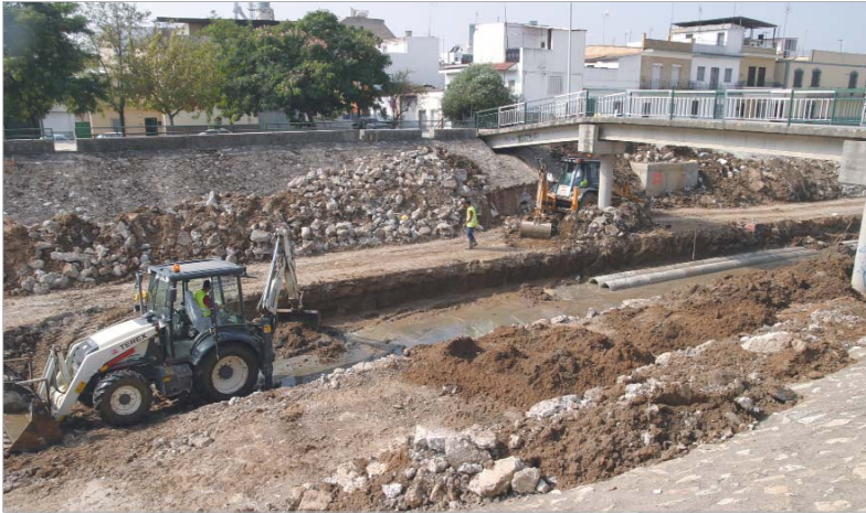
Una rampa de tierra compacta facilita el acceso de la maquinaria al cauce del arroyo.