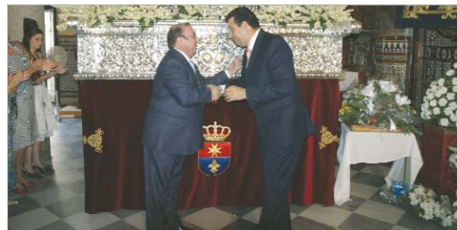
Arriba el alcalde entrega el libro. Abajo en la presentación del bordado.

El Ayuntamiento regaló también a la Hermandad el faldón delantero del paso de la Virgen, que presentaba bordado el escudo del municipio y que la Patrona lució majestuosa durante su recorrido procesional.