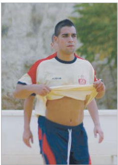
Negro se retira tras ser expulsado.