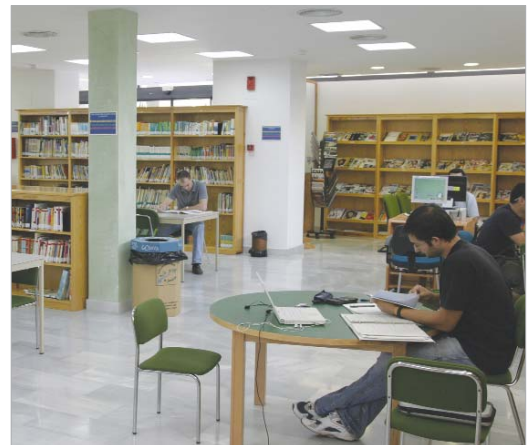
Biblioteca de San José.

Vista la masiva respuesta que el servicio ha tenido, desde Cultura se plantea que este programa piloto forme parte