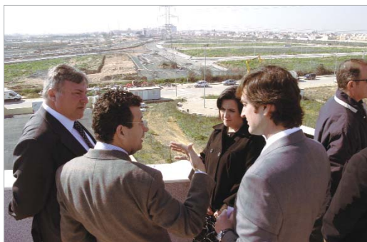
El alcalde y la delegada de Desarrollo Económico, mirando El Cádiz 3