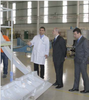
El presidente Manuel Chaves se interesó por la actividad empresarial de la zona.