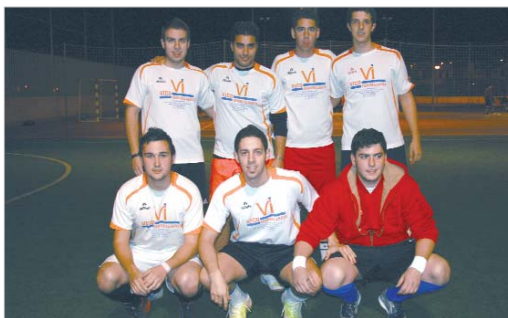
Los Globber Trotters Vico Inmobiliaria posan para Toma Nota.

La próxima jornada aclarará un poco las cosas.