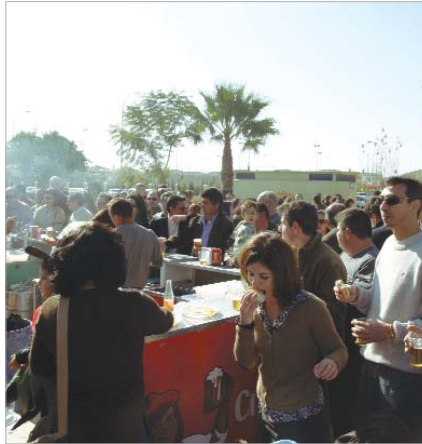
Ambiente carnavalesco en la plaza de Estrasburgo.