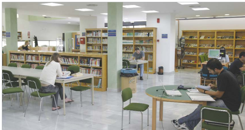
Sala de estudio de la Biblioteca de San José.

Las sesiones de lectura de cuentos tendrán lugar los viernes de 17.00 a 18.00 horas. Además, los padres, madres y abuelos que lo deseen pueden leer un libro de