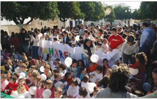
Niños del Colegio Los Azahares, en la Plaza de España.