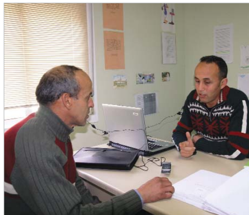
Un trabajador atiende con el nuevo sistema a un subsahariano.