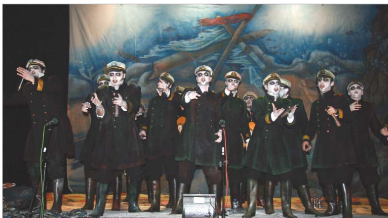
La comparsa El último Puerto, dedicó el primer premio del concurso de Carmona a toda La Rinconada.

Las siete agrupaciones participantes levantaron al público de sus asientos y demostraron que el nivel crece año tras año. El veredicto final del jurado se conocerá el próximo domingo en la plaza