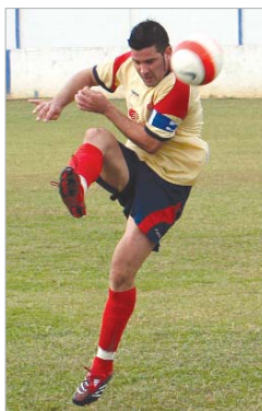
Alves con la elástica rinconera y en la chirigota Las Carmen.

No lo sé. Antes salía uno con más ganas de ganar, pero ahora