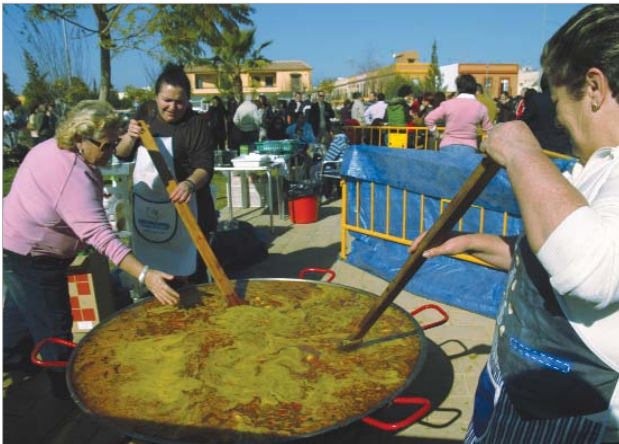
Un grupo de mujeres prepararon una gigantesca paella para celebrar el Carnavalito.