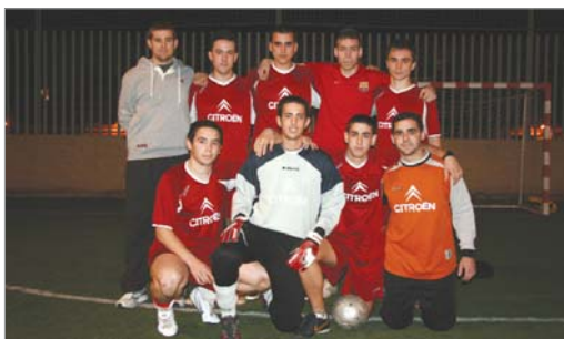
Los Paquetes, de Segunda, en la previa del choque ante el Rinky United.