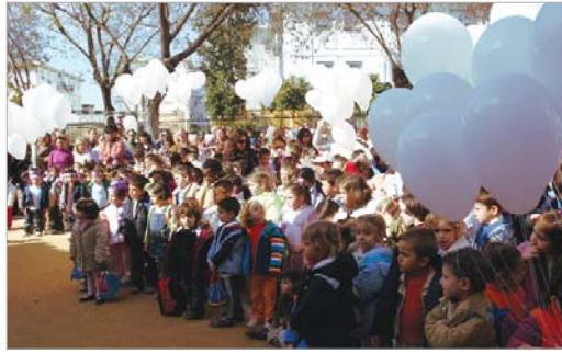
Los alumnos de La Paz, entregaron a Sevilla Acoge dinero para la ONG