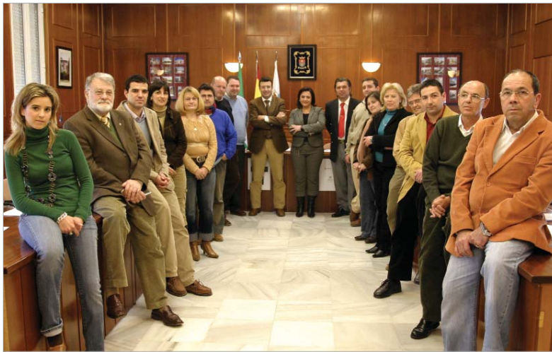
Los consejeros de Soderinsa Veintiuno, en el primer histórico Consejo de Administración.