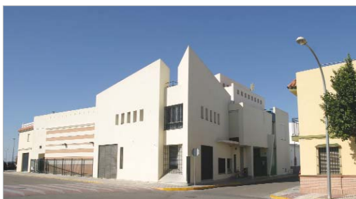
En el Antonio Gala tendrá lugar la final de teatro.

El Área de Cultura pone en marcha la XIII edición del Concurso Factoria Creativa