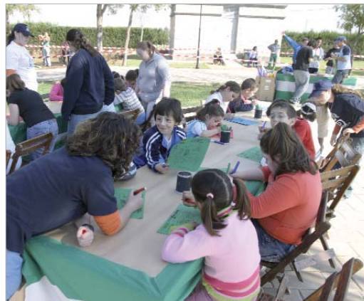
Niños celebrando el Día de Andalucía el año pasado.

Y cuando don Carnal empiece la retirada, Festejos se vuelca con doña Cuaresma en colaboración con las hermandades para preparar todo el camino que lleva a la estación de penitencia con