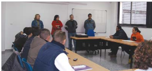
La delegada de Desarrollo Económico visitando el nuevo curso.

El pasado 30 de enero arrancaron los cursos de Formación Profesional Ocupacional de Informática de usuarios y electricista de edificios, promovidos por Soderinsa Veintiuno, la Consejería de Empleo y el Fondo Social Europeo. Ambos talleres