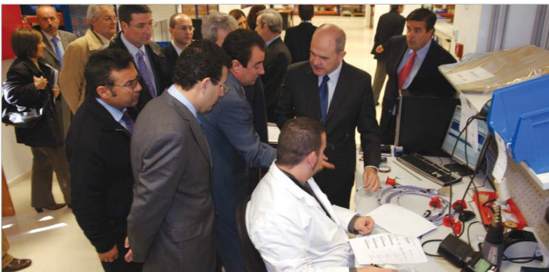
21 empresas auxiliares dedicadas a la fabricación aeronáutica producen en La Rinconada.

Chaves anuncia la ampliación del parque y el alcalde avanza que La Rinconada ha reservado suelo como zona de oportunidad tecnológica-empresarial