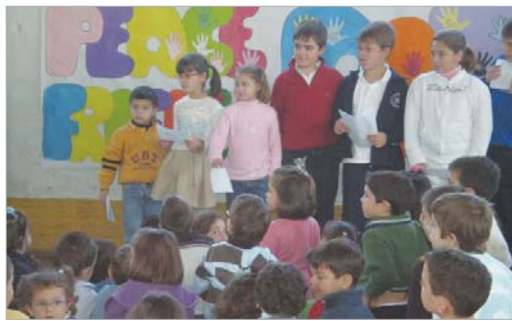
El Colegio San José también protagonizó la lectura de un manifiesto

Pero este no fue el único centro educativo que celebró el Día de La Paz. Los Azahares llevó a cabo en la plaza de España una