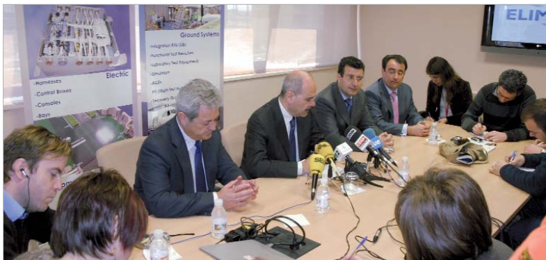
En rueda de prensa Manuel Chaves reafirmó su fuerte apuesta por el parque empresarial.