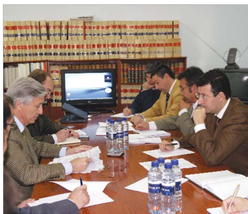
Ayuntamiento, Adif y Renfe, reunidos para estudiar el proyecto.

El material del que estará hecho el apeadero será de vidrio resistente con colores que identifiquen claramente de lo que se trata, y contará con un vestíbulo,