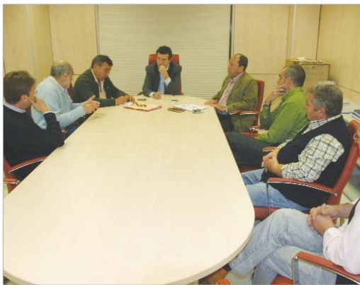
El alcalde hablando del futuro de la Azucarera con los sindicatos.