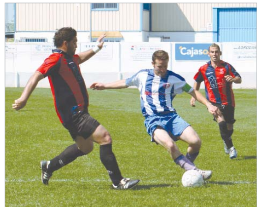
Pato se lleva el esférico entre dos jugadores del Brenes.

Una victoria que certificaba la permanencia y que daba la posibilidad de seguir soñando con dar una campanada que aún se antoja utópica. En la jornada siguiente, tocaba ratificar la mejoría en un feudo inexpugnable ante La Liara, el mejor local de la Liga junto al todopoderoso líder, el Lora. Los rinconeros saltaron al campo sin complejos, decididos a continuar con su recién estrenada buena racha y, aunque el triunfo no pudo lograrse, el punto conseguido supo a gloria y puso fin a otro de los estigmas que habían acompañado al club en las últimas jornadas: la fragilidad defensiva. Ante los palacie-