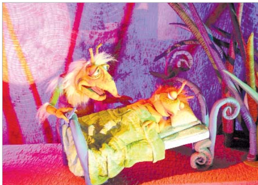
Escena de la obra infantil del grupo Espejo Negro.