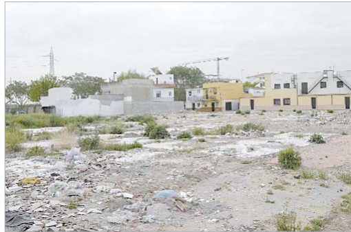
Terrenos en los que se ubicará las viviendas de Huerto de Benito.

De momento se están ejecutando las obras de los 64 pisos de Lomas del Charco que se encuentran a la mitad de su ejecución (en estos momentos se está actuando