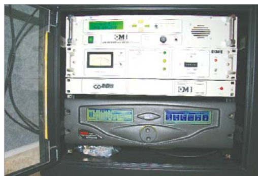
El nuevo procesador Solidyne 562 DSP SRS WOW del 104.7 FM.

Además, ya está operativa la nueva dirección on line de la cadena, www.radiorinconada.es, que permite sintonizarla desde cualquier lugar del mundo con calidad CD y con diferentes opciones de reproducción.