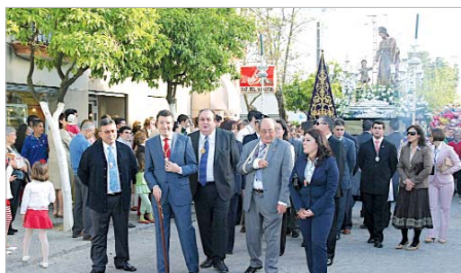
Cientos de rinconeros acompañaron a San José.

En esta nueva edición, el paso estrenó un nuevo plateado, que lució espléndidamente con el soleado día en el que procesionó.