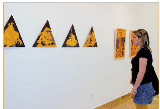
Imagen de la sala de exposiciones de La Villa.

Tanto las obras finalistas, en cada una de las categorías como el resto de las presentadas permanecerán expuestas al público, del 15 al 25 de abril en el Centro Cultural de La Villa, y será entonces cuando se conozca el fallo del jurado.