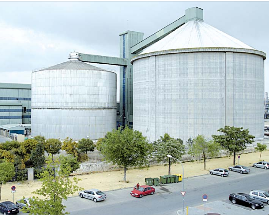
Vista general de la Azucarera Ebro Puleva.

Los fijos discontinuos conformarán una bolsa de empleo con preferencias de contratación para la empresa