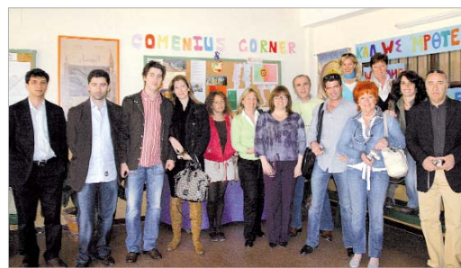
La delegada de Educación junto al director del Júpiter y los profesores.

Todos los alumnos del centro han estado durante el segundo trimestre realizando trabajos