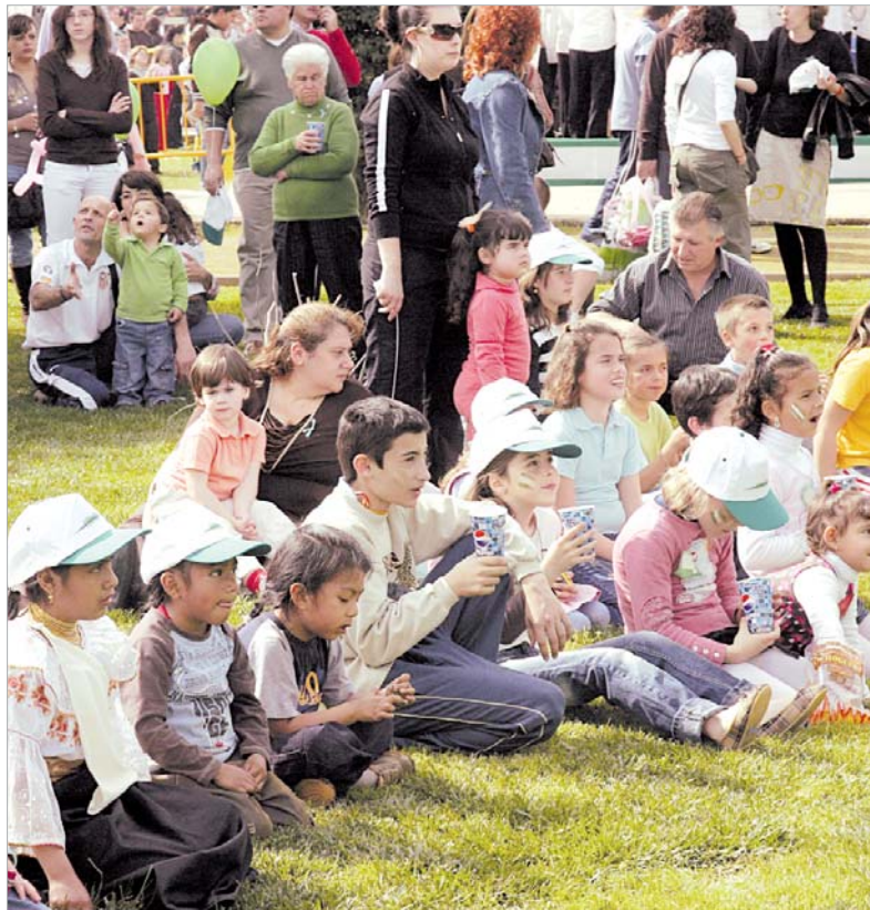
El 60 por ciento de la población rinconera procede de otro municipio de la provincia de Sevilla.