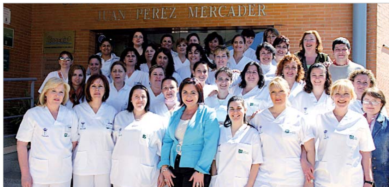
La delegada de Empleo, con todas las alumnas del Taller de Empleo.

El periodo formativo se extiende durante un año (comenzó el pasado 17 de diciembre) y en este tiempo las beneficiarias están contratadas percibiendo 1,5 veces el salario mínimo establecido. La particularidad de este Taller de