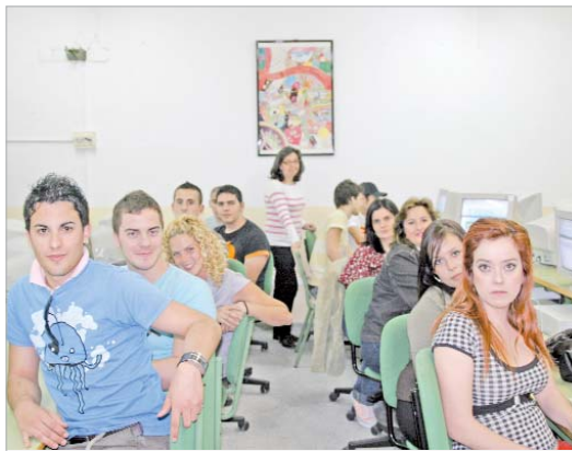
Sacan tiempo de sus ratos libres para investigar y buscar la información.