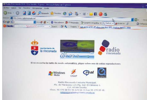
La nueva web donde escuchar la emisora. www.radiorinconada.es.