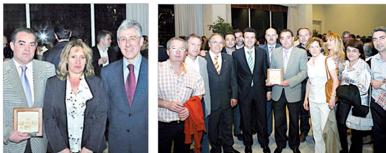
El consejero de Educación y el alcalde con los premiados.