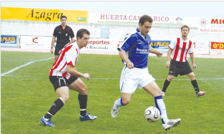
Israel volvió a llevar la batuta del centro del campo del San José ante un San Martín que no opuso resistencia.

Quizás eran los dos choques más complicados que le quedaban. El Mosqueo, a pesar de estar en la zona baja, sabe desenvolverse en esas latitudes y acostumbra a esprintar en los tramos finales del Campeonato. Por otro lado,