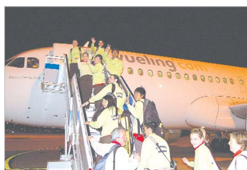
La expedición partía a Xátiva muy animada y sabedora de sus opciones.