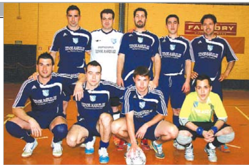
El Chiquitistán pierde casi todas sus opciones de revalidar el título del año pasado.

asciende. En segunda es donde hay mayor emoción. Maquinarias HR se mantiene en cabeza tras ganar al Bar Corona (9-3), mientras que Nuevosol le pisa los talones tras golear al Benito Cárnela. Por detrás, viene el Unión San José B y la Balompédica Cañamera.