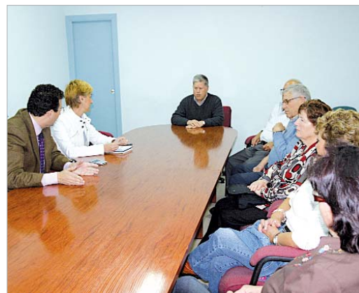
El alcalde y la delegada de Bienestar Social con la junta directiva.

La nueva dirección afronta esta nueva etapa con mucha ilusión y ganas de poner en marcha numerosas actividades dentro de una ordenada planificación del centro, para que los 600 socios del Hogar, puedan seguir gozando de los servicios que allí se ofrecen.