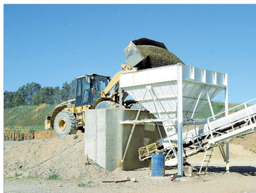
Zona en la que trabajan el hormigón.

razgo en el mercado. Las claves para mantenerse son, según el gerente de la empresa "ofrecer unas garantías al cliente y demostrar la valía de lo que se hace con sello de calidad".