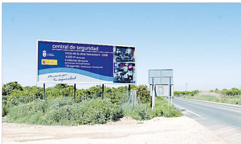
Imagen del cartel que anuncia la nueva central y la zona en la que irá ubicada.