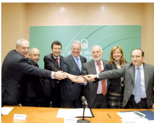
Sindicatos, empresa, Junta y Ayuntamiento, sellando el acuerdo.

La voluntad de encontrar la mejor solución se firmó con luz y taquígrafos y, de aquellas aguas, estos lodos: CC.OO. y UGT, valoran como "muy positiva" la salida que se da al empleo una vez que en septiembre próximo se dé cerrojazo a la histórica producción de azúcar en San José.