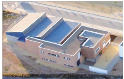
Imagen del Vivero de Empresas.

Para ser beneficiario del vivero, aquellas empresas y emprendedores con interés deben presentar una solicitud acompañada de un plan de empresa. Para ampliar información sobre condiciones de ocupación o visitar las instalaciones de vivero puede contactar con Soderinsa Veintiuno.