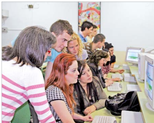
Cada grupo trabaja en diferentes áreas simulando una redacción.

Otra de las cuestiones que están ahora barajando es el nombre que llevará su publicación. Estos alumnos enviarán su trabajo a El País antes del día 25 de abril y, una vez que se haga esto podrá consultarse en la web www.estudiantes.elpais.es .