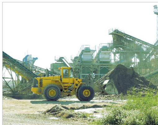
Zona de extracción de áridos.