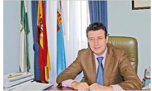
Javier Fernández, alcalde de La Rinconada