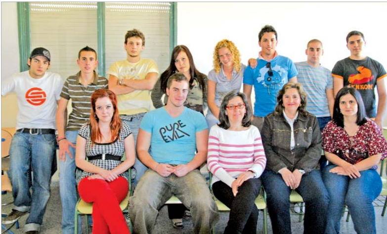
El grupo de alumnos del IES San José que están haciendo el periódico, con la profesora en el centro.