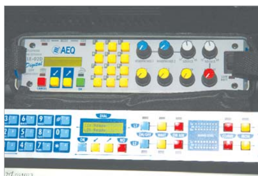
La línea RDSI ha supuesto un avance significativo en las comunicaciones.