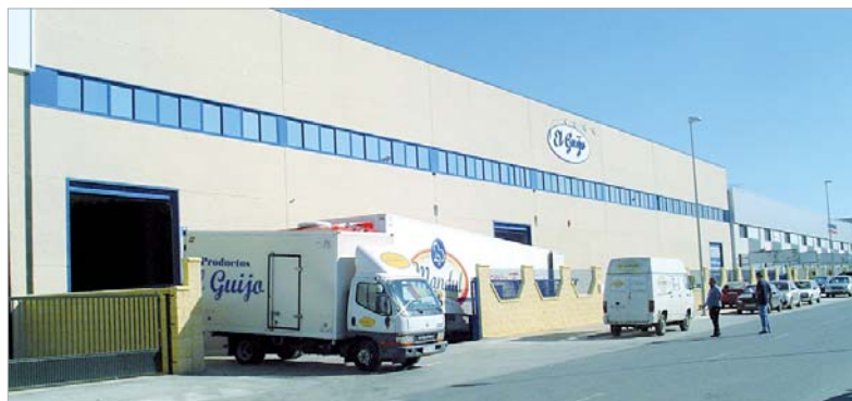
Las instalaciones de Dulcesguijo, en El Cádiz 2.

La empresa ha experimentado un constante incremento en su volumen de negocio, ya que desde que se constituyó ha multiplicado