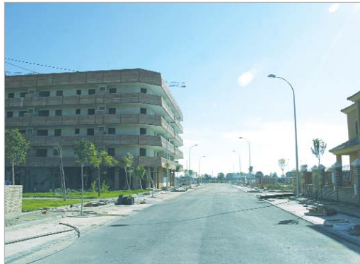
Imagen de los terrenos en los que se construirán las viviendas.

tiva que Soderinsa Veintiuno quiere poner en marcha para facilitar a la gente joven el acceso a una vivienda.