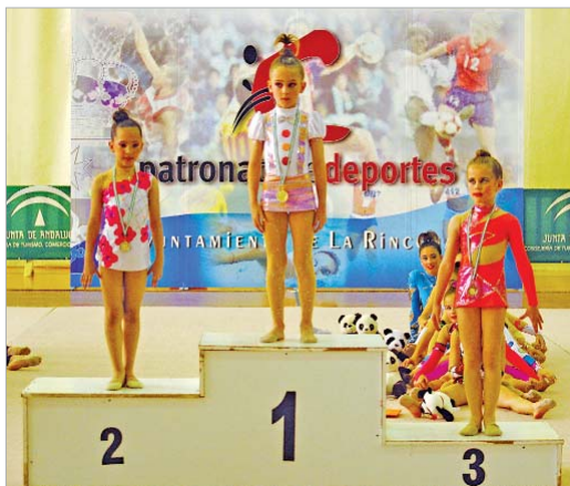
El Oso Panda logró grandes registros y demostró la calidad del plantel.