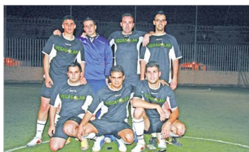
El Vega Solar lucha por no ser el farolillo rojo de la Tercera división.