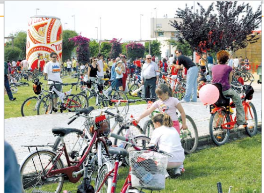
El pelotón salió del polideportivo Francisco Sánchez.