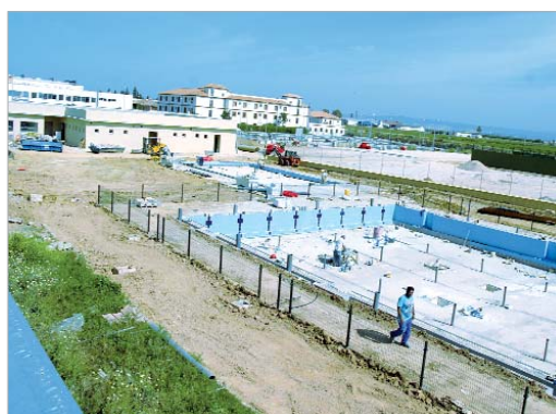
La intención es abrir la nueva piscina para la temporada de verano.