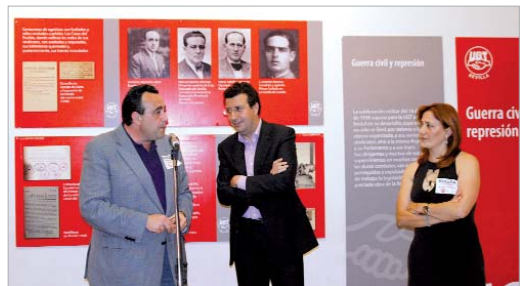
El alcalde y el secretario general de UGT de Sevilla, en la inauguración.

los trabajadores del campo, a quienes dio su apoyo incondicional en la lucha por sus intereses.