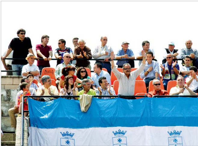
El presidente se saltó el protocolo del palco para hacer la ola reclamado por la afición.

Menudo sustituyó a los pesos pesados del equipo para que fueran ovacionados por un público entregado