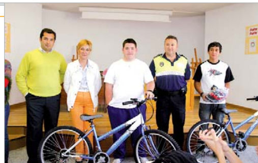
Los ganadores del concurso con los delegado de Seguridad y Bienestar Social.

La campaña se realiza desde hace ya algunos años con unos resulta-