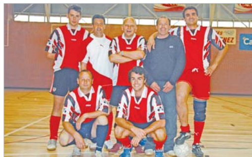
El Benito Cárnela no ha podido evitar el descenso a Tercera.

En Tercera, el Dépor San José y el Boca Juniors ya son equipos de Segunda para el próximo ejercicio, mientras que el Pub La Gruta lo tiene todo a favor para ser el que lo acompaña. Por abajo, Vega Solar y Poli Lejido luchan por evitar ser el farolillo rojo.