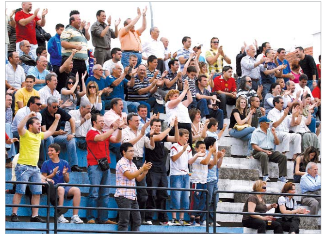
Las más de 1.500 personas que llenaron el Felipe del Valle vibraron con su equipo.