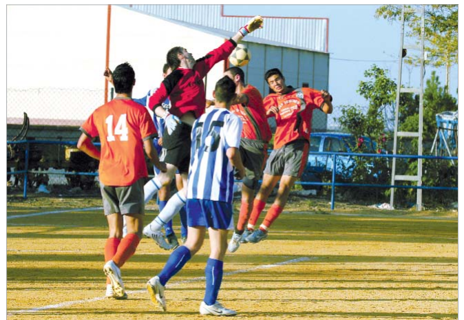
La estrategia de colgar balones no dio el resultado apetecido frente al Trajano.