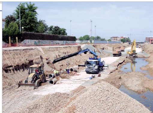
El arroyo estará totalmente soterrado en noviembre de 2009.

La eliminación de los puentes y la reordenación del tráfico serán las siguientes fases por las que pase la obra de ingeniería urbanística más importante de la historia local. Casi 20 millones de euros se invierten en el desmantelamiento del arroyo. La eliminación de las bancadas ha evacuado 100.000 metros cúbicos de tierra y, en la actualidad, se construyen los ovoides de canalización de aguas. Aún queda eliminar el muro de un lado y otro y construir el cajón hidráulico. En noviembre de 2009 estará listo para urbanizar y embellecer. "El Ayuntamiento actualiza los proyectos de aprovechamiento de la superficie resultante así como las vías de financiación", señala Blázquez.