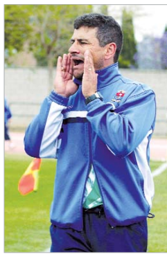
Menudo es un técnico expresivo.