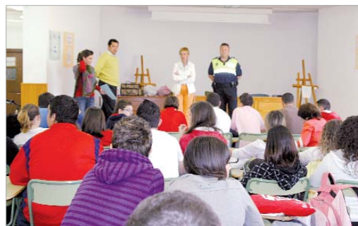
El IES San José, el primero en recibir la clase de Seguridad Vial.