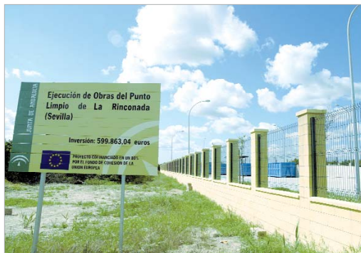
Lugar en el que va ubicado el Punto Limpio.