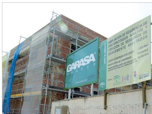
La ampliación de la Residencia finalizará durante el verano.