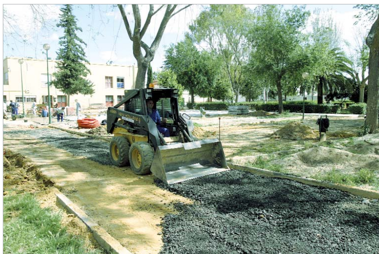
El Parque de la Comunidad Económica Europea, en obras.

En este sentido, se están cambiando los parterres, se están colocando lozas en determinadas zonas, en carpintería, los