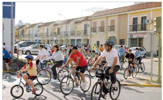
En el parque Dehesa Boyal se hizo un sorteo de bicicletas.