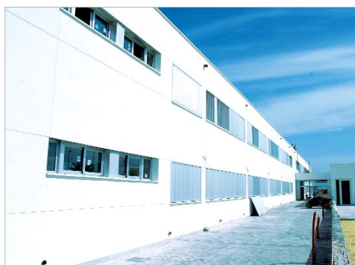
El colegio estará listo en mayo y operativo en septiembre.