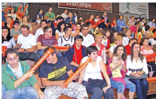
Las gradas de Pabellón San Pablo contaron con muchos aficionados rinconeros.