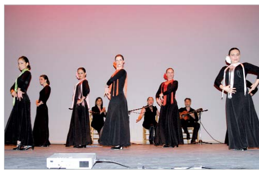
Las alumnas del taller de danza ofrecieron 3 coreografías.

'Ventana en el Jardín' y a nivel regional, Juan Antonio Quintana se alzó con el primer premio con su trabajo '¿qué? Na, ¿qué? Na'. Acto seguido, los monitores de las