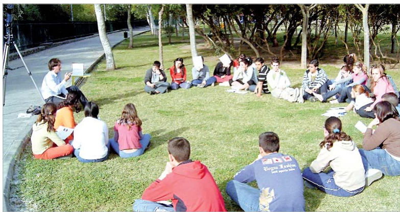
Alumnos del Antonio de Ulloa, preparando algunas actividades para la Feria.

En total, del IES Miguel de Mañara acudirán como divulgadores unos 85 alumnos. No obstante, el resto de jóvenes de ambos centros de Secundaria visitarán la Feria y se desplazarán allí a través de autobuses que el Ayuntamiento pondrá, como cada año, a disposición de los centros educativos.