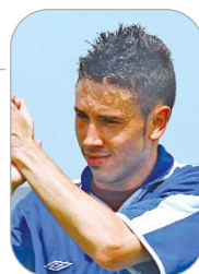
Lobo Jugador del San José

El pequeño ariete saltó más que todos los defensores del Puebla para llevar el 0-1 al marcador y dar así un triunfo clave en las opciones cañameras de ascenso. Además, se fajó en defensa y demostró el porqué de su fichaje.