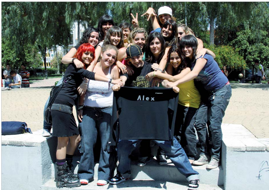
El rinconero Alejandro Gutiérrez acaba de aterrizar en la localidad tras su éxito en el programa Fama, de Cuatro.