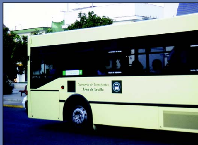
El Consorcio de Transportes, al que el La Rinconada pertenece, mejora el servicio con 15 nuevas marquesinas y postes informativos. Para la reducción de tarifas, el Ayuntamiento aportará este año más de 64.000 euros.