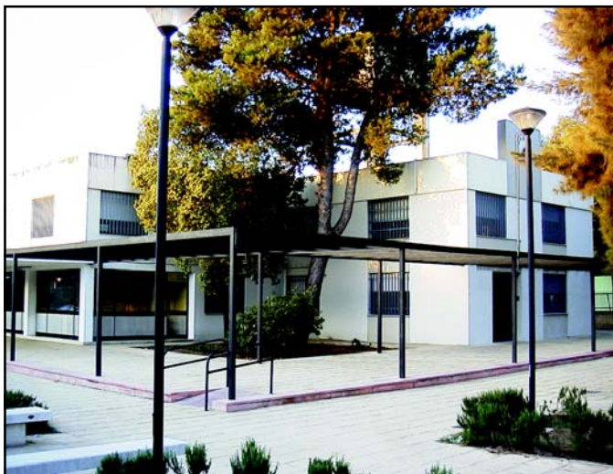
El edificio de la Tenencia de Alcaldía seguirá siendo el centro de la gestión urbanística ahora también como sede del Inmuplas. Aquí se tramitará toda la documentación y licencias de particulares y se planificarán las futuras incorporaciones de suelo.

Como objetivo práctico, el Inmuplas se encargará de la aplicación y revisión del Plan General de Ordenación Urbana, «el principal documento de crecimiento que el próximo 7 de octubre cumplirá el primero de los dos cuatrienios de ejecución y será entonces cuando haya que readaptarlo para su segunda fase», tal y como valora el teniente de alcalde de-