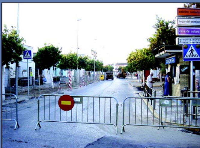
El área de Infraestructura ha comenzado ya con la reestructuración de los acerados de la calle Carretera Nueva, un tramo especialmente conflictivo para el tráfico donde se tiene previsto crear más de 60 plazas de aparcamiento.