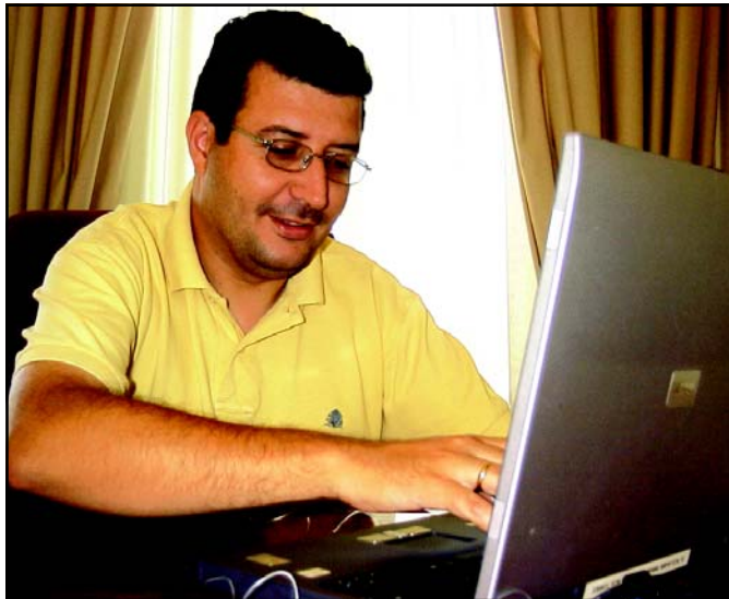
El primer teniente de alcalde implantará un servicio telefónico de permanente atención al vecino que optimice los recursos municipales.

Está a la vista. Hay dos promociones en marcha, una en cada núcleo y el Pago del