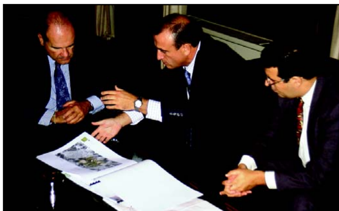
Chaves inaugurará el parque Aeroespacial. Tema colateral de la reunión mantenida en San Telmo fue la inauguración, en la segunda quincena de octubre, del parque Aeroespacial de La Rinconada, un evento que contará con la presencia del presidente de la Junta, Manuel Chaves.

La reunión en San Telmo, cita ya habitual al comienzo de cada legislatura municipal, denotó la «sintonía» existente entre ambas administraciones, como destacaron Abad y Fernández, que catalogaron la