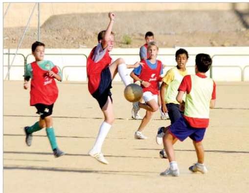
Niños jugando en un campo de fútbol siete.