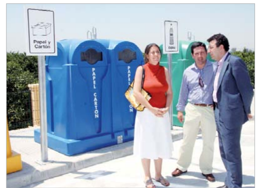
Las autoridades, en la zona de reciclaje de vidrio y papel.