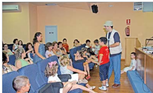
Última sesión de Cuentacientos.

Por su parte, la biblioteca de La Rinconada inaugura el próximo 11 de julio a las 11.30 horas una nueva