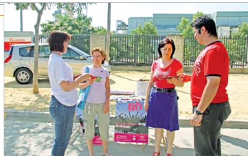
Bienestar Social y AR se desplazaron al mercadillo de San José.

ron folletos y consejos sobre la prevención ante todo tipo de drogas.