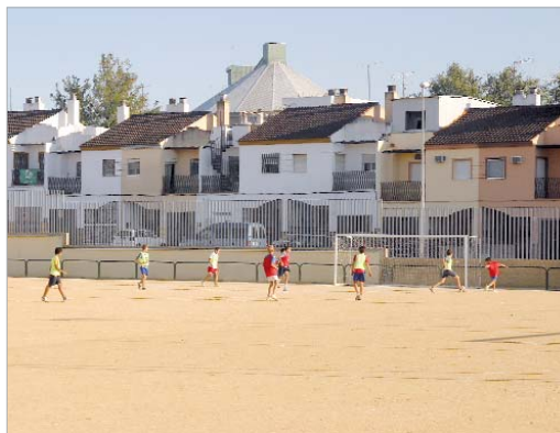
Campo de albero del polideportivo Santa Marta.

Para que este ambicioso plan se ejecute con rigor, se creará una Comisión de Seguimiento que velará por la ejecución del proyecto.