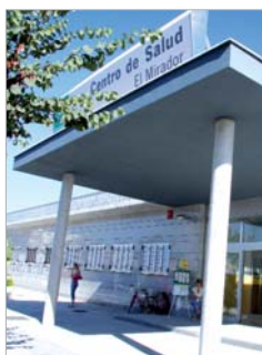
Entrada al Centro de Salud.

Además, el nuevo centro dispone de un área de atención a la mujer con consultas de Tocoginecología y sala de educación sanitaria, en las que se realizará la asistencia a las mujeres por parte de la matrona y tocoginecólogos del Hospital Virgen Macarena, lo que evitará anualmente más de 1.700 desplazamientos de pacientes al centro hospitalario