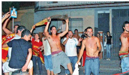
Los aficionados tomaron las calles rinconeras para celebrar el título.

Quienes habían visto el partido en casa salieron y se unieron a los que habían disfrutado de la final en los establecimientos de ocio de la localidad y juntos olvidaron sus diferencias para latir a un mismo son: el que marcaba la 'Roja' que, en ese momento, también celebraba el logro conseguido en la zona mixta del Ernst Happel de Viena.