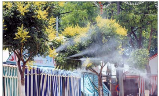
Sistema de pulverización de agua para la Feria.