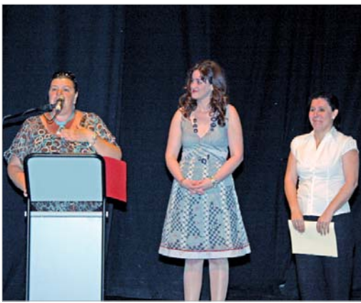
El grupo ganador ofreció unas palabras a los asistentes.

El grupo la Revolera con su obra 'La Revuelta' gana la edición XIII del certamen de Factoría Creativa