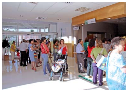
Usuarios en El Mirador el mismo día de la apertura.

Así, un total de 126 calles quedan desde el pasado lunes