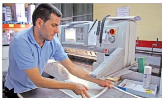
Uno de los trabajadores trabajando en una guillotina.

Trabajan para empresas de cualquier sector y se arriesgan con todo tipo de impresiones