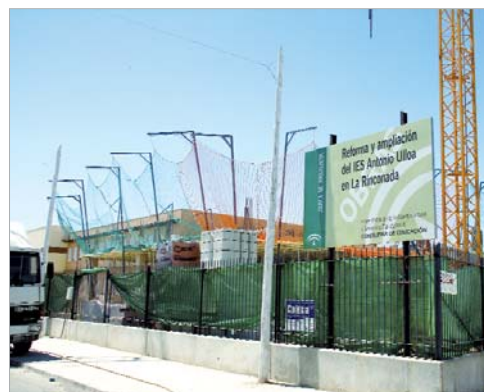
También se visitaron las obras de ampliación de aulas del Ulloa.

Ulloa, que está ampliando su aulario para que el próximo curso cuente con su primera línea de bachilleratos. La tercera guardería pública municipal en Santa Cruz, para 150 niños de entre cero y tres años, y el nuevo Colegio de Infantil y Primaria de El Mirador para 450 alumnos, cerraron el intenso programa de la visita del delegado.