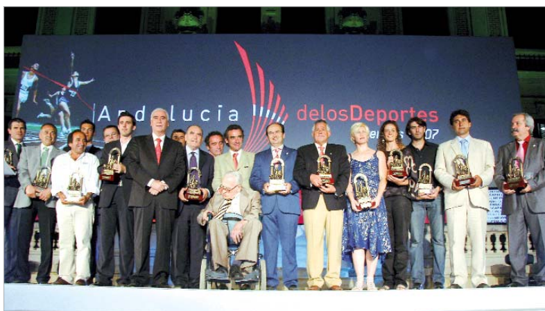
Foto de familia de todos los premiados en los Premios Andalucía de los Deportes 2007 junto al Consejero.