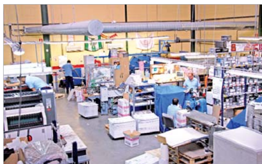
Imagen de todas las máquinas en las que se realiza la fabricación.

lizarse se plasma en una de sus últimas ideas: la creación de un software en todos los ordenadores que permite conocer en tiempo real cómo va el proceso de fabricación de algún trabajo para dar cuenta al cliente de en cuánto tiempo exactamente lo tendrá disponible.