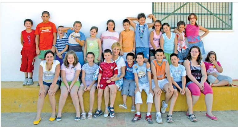
La delegada del área junto a los pequeños en el Colegio Los Azahares.

En definitiva, 90 niños y niñas, que aprovechan el tiempo libre que ofrece el verano, para realizar actividades socializadoras, educativas y de ocio.