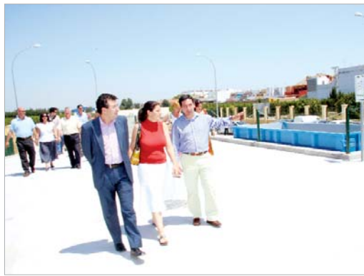
La delegada de Medio Ambiente, el alcalde y el delegado de Vía Pública

Este nuevo servicio podrá ser utilizado de lunes a viernes entre las 12.00 y las 19.00 horas y los sábados entre las 13.00 y las 18.00 horas.