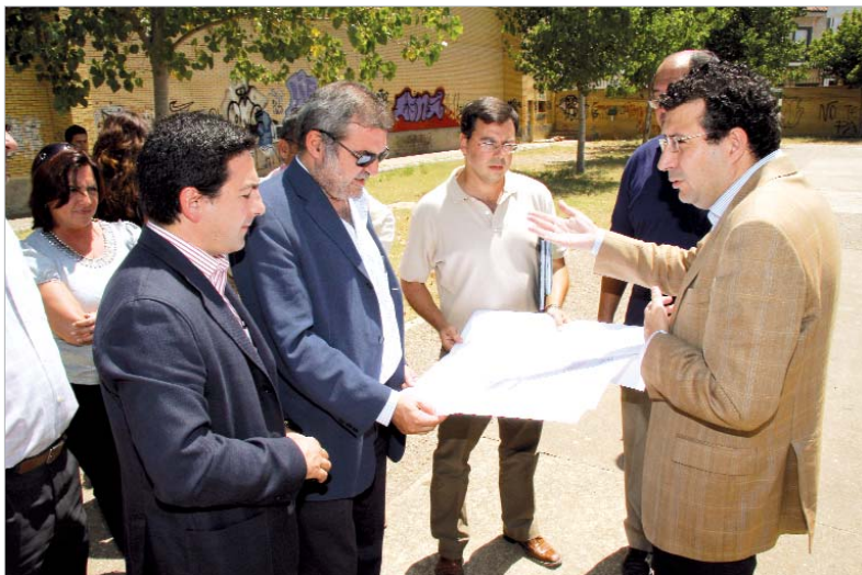
Alcalde y delegado provincial de Educación visualizan cómo quedará el patio.

El delegado provincial de Educación ha firmado un convenio con el alcalde para invertir 700.000 euros en la reforma del patio del IES Miguel de Mañara. Funcionará fuera de horario lectivo como parque público