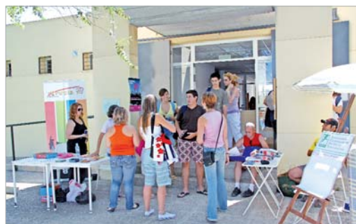
Juventud y ACAT en la piscina municipal de San José.