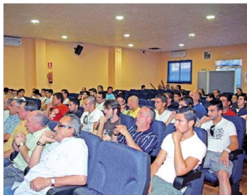
La familia futbolística de la localidad no faltó a la cita.