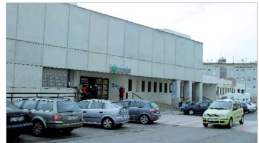
Fachada del Centro de Los Carteros.

La cartera de servicios del nuevo centro de salud se completa con: atención sanitaria en consulta médica y enfermería, atención médica y enfermería a domicilio, seguimiento del embarazo, educación maternal, seguimiento de la salud infantil (vacunaciones, metabopatías y seguimiento de la salud infantil y escolar), planificación familiar, examen de salud para mayores de 65 años, atención sanitaria a problemas específicos, deshabituación tabáquica, anticoagulación oral, inmunizaciones no sistemáticas, detección precoz de cáncer de mama, atención al climaterio, atención a los problemas de salud de los jóvenes, atención a las personas en riesgo social, cirugía menor y ecografía, entre otros.