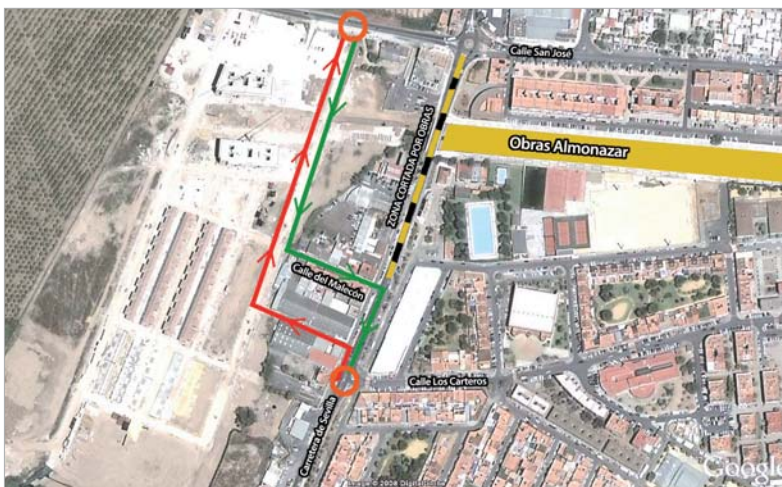
Imagen del trazado alternativo para el tráfico rodado.

Junto al nuevo itinerario de salida hacia Sevilla previsto por obras, Tráfico recomienda usar las carreteras 8007 (de La Jarilla), la 8002 (Alcalá-Sevilla) y la 8001 (San José - La Rinconada)