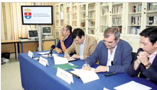
Momento en el que ambas administraciones firman el convenio.

Para el uso público -que se concreta fuera de horario lectivo, los fines de semana y en período estival- se construirán dos accesos, uno a través de la calle Cultura, y otro por la calle Valdés Leal.