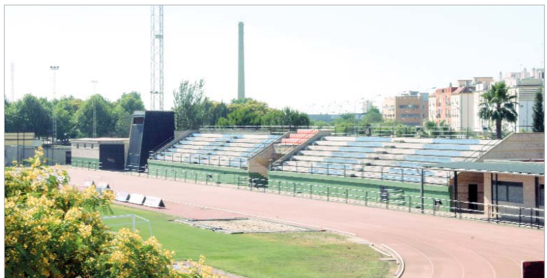
Gradas del Estadio Felipe del Valle.