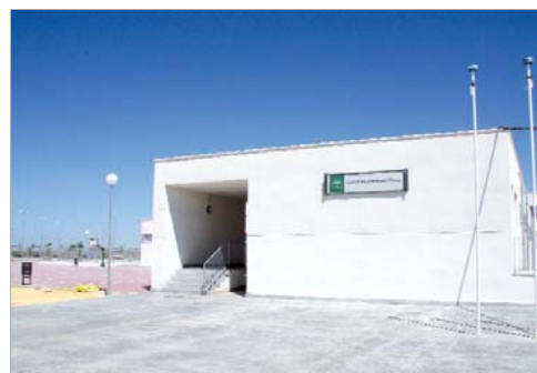
Las obras del colegio El Mirador ya han terminado.

El delegado provincial de Educación aprovechó su visita para conocer el estado de las obras de varios centros educativos de la localidad en los que el Ayuntamiento, en colaboración con la Junta de Andalucía, invierte algo más de 5,3 millones de euros.