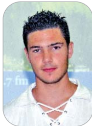
Pozo Jugador Rinconada