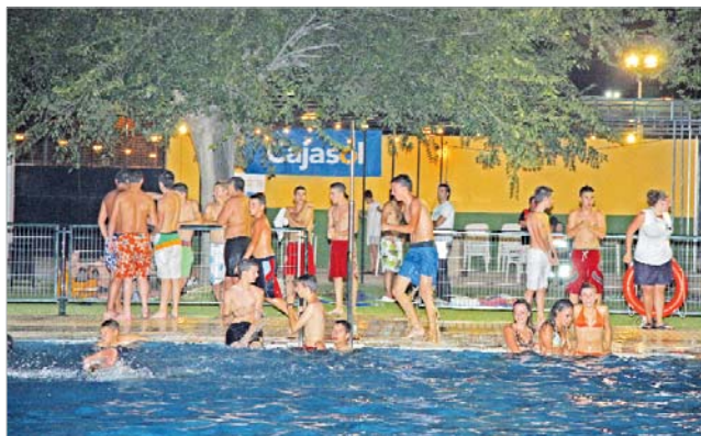
Los jóvenes disfrutaron de un chapuzón en la piscina.