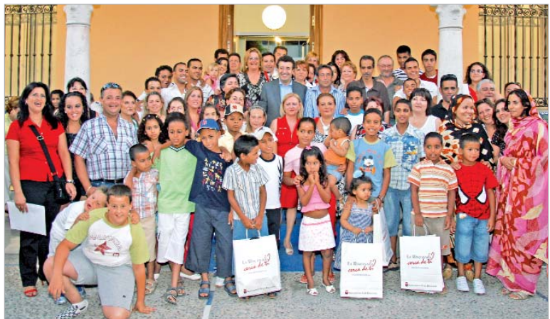
Foto de familia en la puerta del Ayuntamiento.

vidades con el que los pequeños disfrutaran de unas semanas de ocio y convivencia. Este año se inicia una actividad de nueva creación con una visita guiada a Granada. Con esta iniciativa se pretende que cada año conozcan una nueva ciudad para que aprendan el nexo entre la cultura árabe y la andaluza.