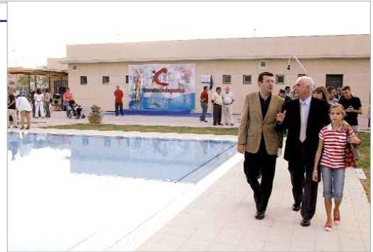
El alcalde y el consejero durante la inauguración del Complejo Natatorio.

albero del Felipe del Valle, que se convertirá en uno de césped artificial apto para fútbol 11 y compatible con dos campos de fútbol 7, con sistemas de riego e iluminación. Además, en estas mismas instalaciones, se construirá un voladizo visera para el graderío de público del propio Estadio.