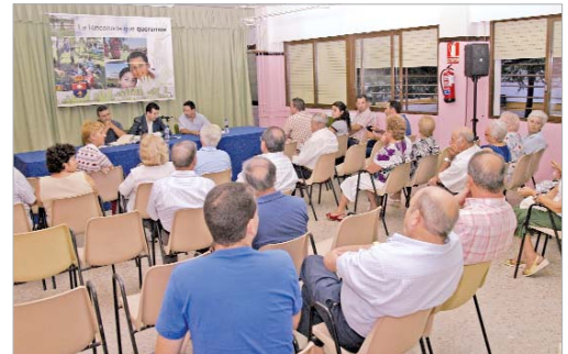
El alcalde y el Equipo de Gobierno reunido con los vecinos de Los Carteros.

La próxima reunión se celebrará el próximo 2 de octubre a las 19.30 en el colegio Miguel de Mañara y será sobre la reforma del patio del centro educativo.