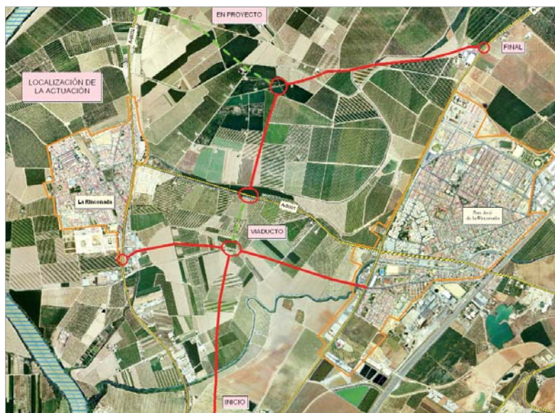
Infografía de la zona por la que discurrirá la autovía.