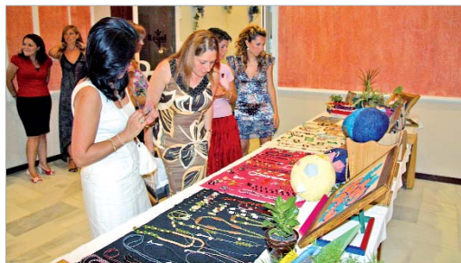
Los usuarios expusieron sus productos en la cena de fin de curso en el Salón Royal.