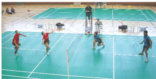
Imagen del primer encuentro de Liga ante La Orden de Huelva.