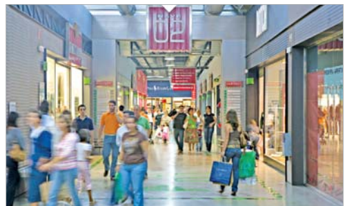
Imagen del Factory, en el polígono Los Espartales.

Fuentes de la empresa destacan que si habitualmente la ofer-