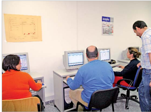
Alumnos de un taller de informática que se impartió en Soderinsa.

Por último, el Área de Juventud se encargará del curso de 'Monitor de actividades de tiempo libre infantil y juvenil', de 259 horas y que se impartirá por las tardes. Además, se desarrollará otro curso sobre 'Informática de gestión', de