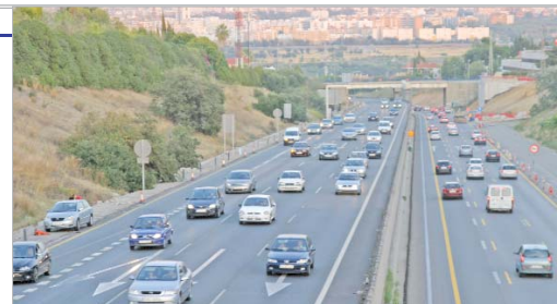
Un tramo de la A-49 a su paso por El Aljarafe.