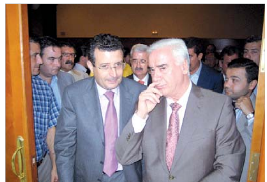
Momentos antes a la firma del convenio.

En el Polideportivo Francisco Sánchez 'Castañita' se repetirá la operación de sustitución del campo de albero por otro de césped artificial. También se remodelará por completo el actual vaso de la piscina olímpica al aire