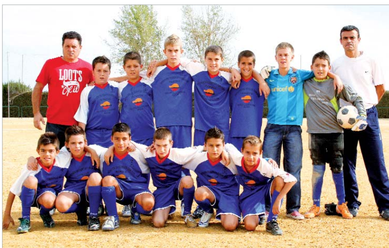
La plantilla del San José Alevín A posa junto al entrenador y el delegado en los prolegómenos de un partido.

El primer equipo alevín del San José, que compite en Primera Provincial, forma a los futuros valores del balompié cañamero