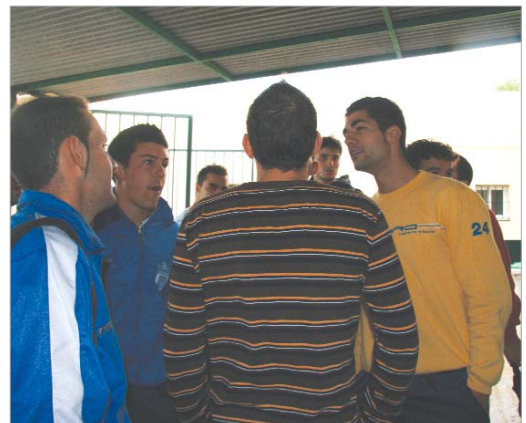
Los rinconeros charlan tras conocer la suspensión del Rinconada-Trajano.