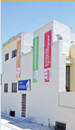
Fachada del Centro Juvenil