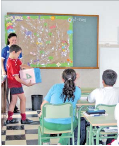
Alumnos del Colegio San José jugando al Oka Bike.