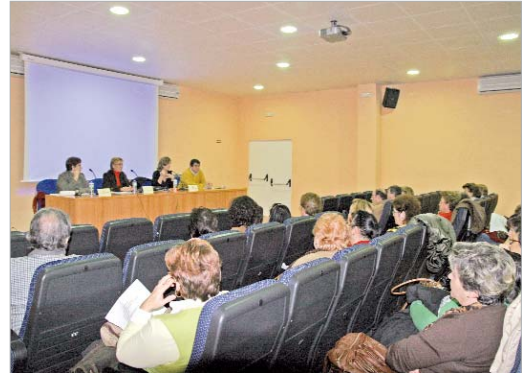
Una de las charlas informativas de 'Aula Abierta'.

el primer curso, que se inicia en el mes de noviembre, consta de 135 horas y se prolonga hasta el mes de mayo que es cuando se estima que finalicen las clases. El plazo de matriculación se abrirá el próximo tres de octubre hasta el 16 del mismo mes.