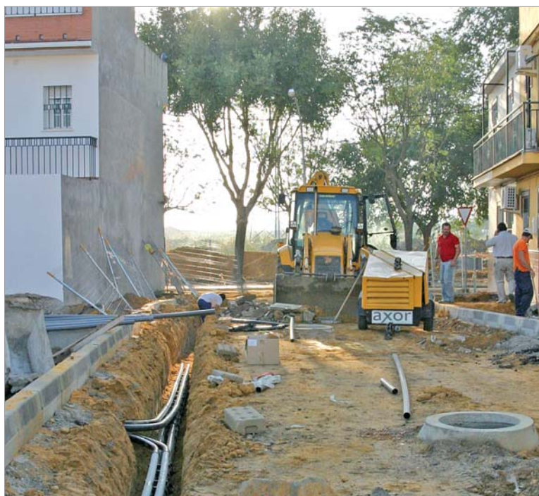
Las obras en las 21 unifamiliares para rentas medias del Huerto del Benito ya han comenzado.

Por otra parte, en el mismo sorteo entrarán los 39 pisos de protección oficial en venta que comenzarán a construirse en Huerta de Amores en octubre. Tendrán 70 metros cuadrados.