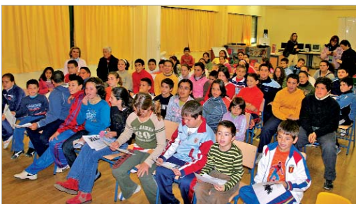
Los alumnos de Los Azahares participarán este mes en el taller de cuentos.

Asimismo, el taller se imparte con la finalidad de fomentar en los pequeños el deseo de leer por sí mismos otras aventuras como las que escucha.