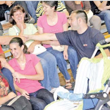
Los afortunados se felicitaban.

En lo que va de legislatura el Ayuntamiento ha entregado un total de 117 viviendas de diferente régimen y perfil