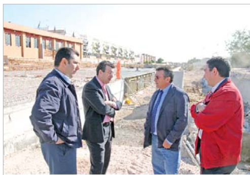
El alcalde, el edil de Urbanismo, el de Tráfico y Vía Pública en la obra.

drán a sustituir los cruces semafóricos actuales, "de forma que se agilice mucho más la fluidez en unos puntos clave de distribución de tráfico", como explica el primer edil.