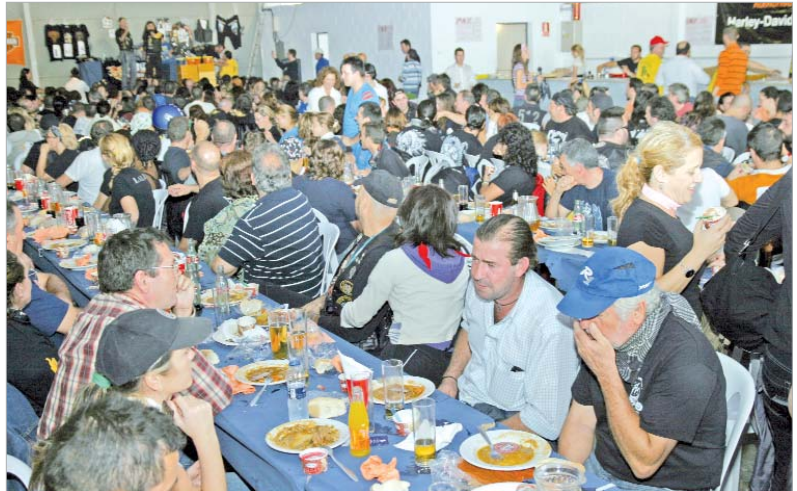
Los moteros almorzaron todos juntos en la caseta municipal de La Rinconada.

espectacular recorrido, en la Caseta Municipal de La Rinconada, donde gracias a la colaboración del Ayuntamiento con medios materiales, disfrutaron de un agradable almuerzo. Como colofón actuó un motero acróbata que durante