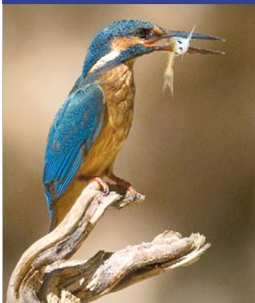
Título: Por el pico muere el pez.