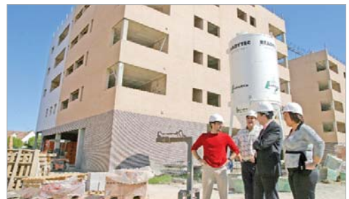
El alcalde y la delegada de Vivienda en los pisos de Lomas del Charco.

De igual forma, Fernández de los Ríos se mostró interesado en la aplicación del Plan de Medidas contra la Crisis al respecto de primar el empleo y los proveedores locales.