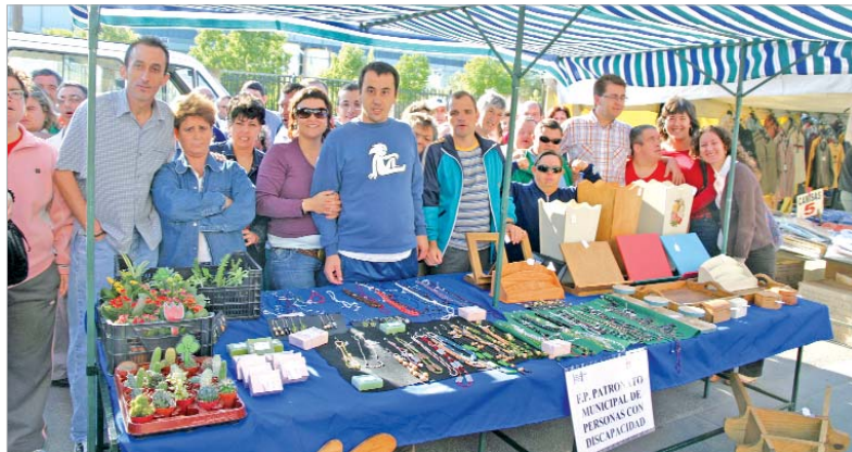
Usuarios del Centro Ocupacional de Torrepavas, vendiendo sus productos en el mercadillo.

Los 44 usuarios se irán turnando para acudir al mercadillo pero la pasada semana, por ser la inauguración, acudieron todos a visitar su puesto y el resto de expositores. Es la primera vez que se pone en marcha esta iniciativa, que será, en