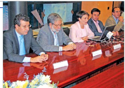
El alcalde de La Rinconada y la consejera durante la firma del convenio.

Con esto, el Consistorio se convierte en entidad emisora de la certificación de firma electrón-