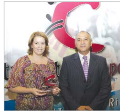
Cajasol, premio al patrocinio.