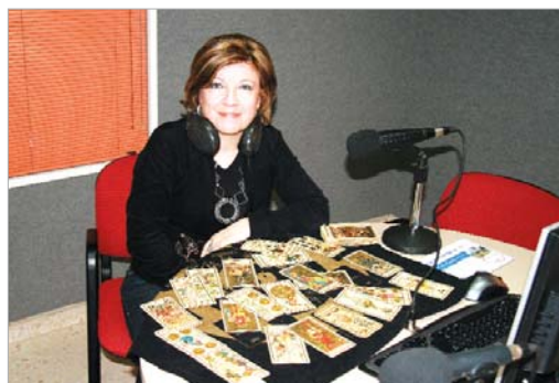
Mati mantiene el volumen de llamadas de la temporada pasada.