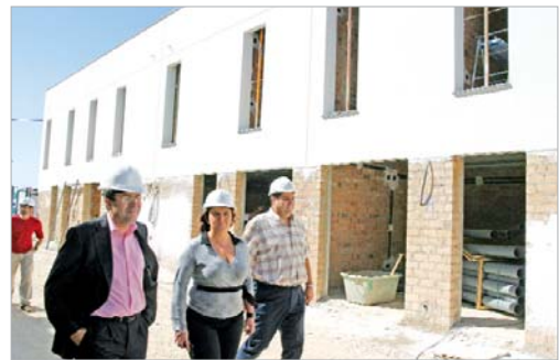
Los ediles visitaron también las 58 unifamiliares de Secadero.