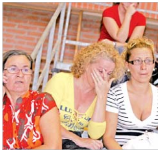
Algunas agraciadas lloraron de la emoción.

Por su parte, los 39 pisos tienen dos o tres habitaciones y casi 70 metros cuadrados y su precio medio ronda los 75.000 euros. Ésta es la principal tipología que construye el Ayuntamiento en correspondencia con el perfil mayoritario de solicitantes: jóvenes que acceden solteros o recién casados con o sin primer hijo a su primera vivienda.