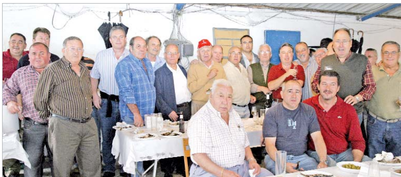
Un grupo de trabajadores de la Azucarera, durante el almuerzo.

Los trabajadores de la Azucarera celebraron el pasado fin de semana un almuerzo con motivo de la festividad del Pilar.