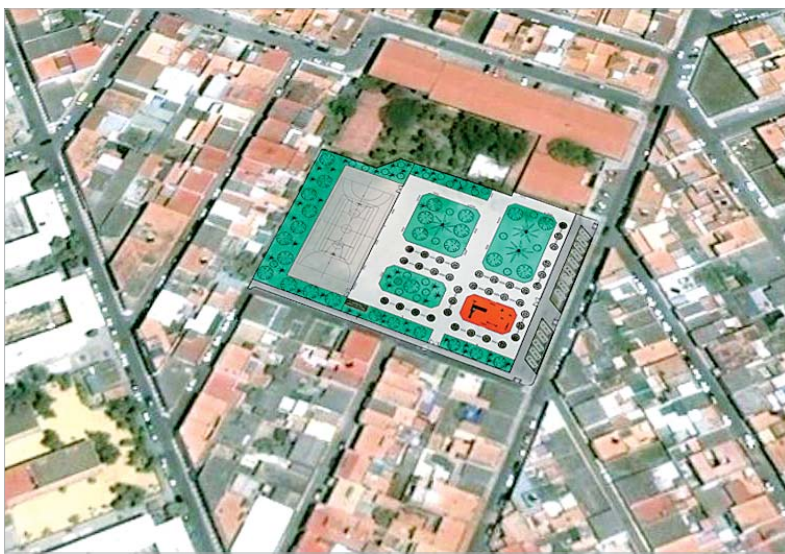
Plano de cómo quedará el patio del instituto Miguel de Mañara una vez que se haya reformado.

El proyecto que el Gobierno local tiene planeado acometer en el patio del IES Miguel de Mañara cobra cada vez más fuerza. De hecho, el Equipo de Gobierno se ha reunido