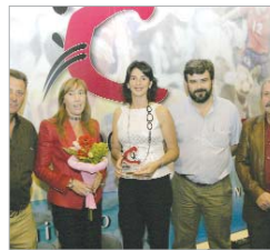
El Soderin de Bádminton en La Villa.