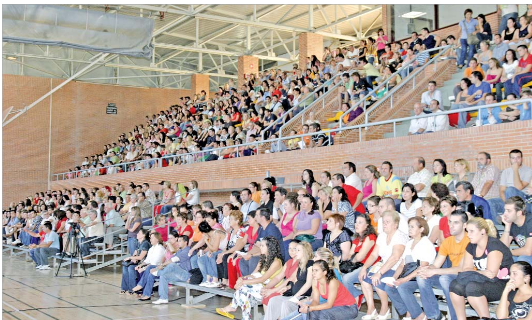
Las gradas estaban a rebosar de personas pendientes del sorteo.

La expectación habitual en cualquier sorteo se ha duplicado puesto que es la primera vez que se realiza una convocatoria doble de vivienda lo que ejemplifica, según el alcalde, "el apretón que hemos dado en esta legislatura"