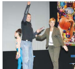
Peña se emocionó en el escenario.