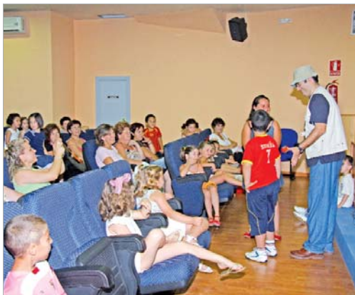
La última sesión de cuentacuentos del curso pasado.