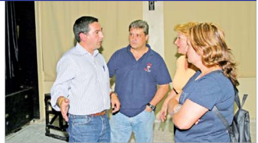
Reunión del Equipo de Gobierno con los vecinos.