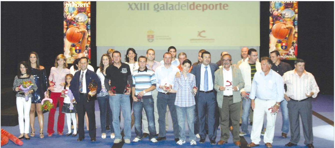
Todos los nominados de la XXIII Gala del Deporte posaron junto con los miembros de la corporación municipal en una entrañable foto de familia que inmortalizó el momento.

Rítmica Oso Panda, en el que ha permanecido desde su fundación, en el año 1991, siendo partícipe de los múltiples logros de la entidad.