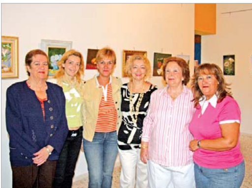
La delegada de Bienestar Social, con los alumnos en la exposición.

Los autores son los alumnos y las alumnas del taller de pintura organizado el pasado curso por la Asociación. Puede verse desde el pasado día 8 y hasta el 24 de octubre