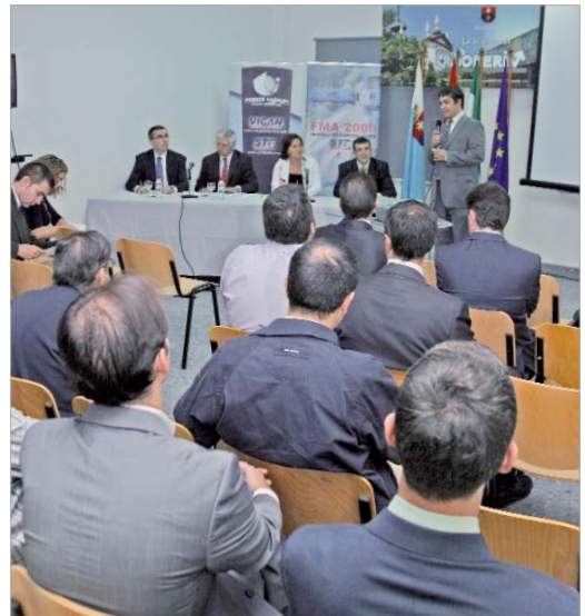
Empresarios del sector acudieron a la presentación de la nueva sede.

queremos es dar un salto cualitativo y cuantitativo en las ventas en Andalucía y Extremadura para poder mejorar la distribución y optimizar la cartera de productos".