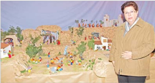
Belen del colegio Guadalquivir hecho con plastilina

Este año se ha editado por primera vez una Revista de Navidad en la que se da cuenta de todas las actividades de estos días