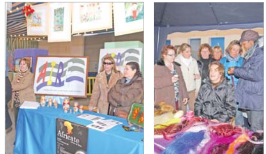
Diferentes stands completaron las jornadas.