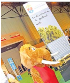
El Elefantiko animó el stand.