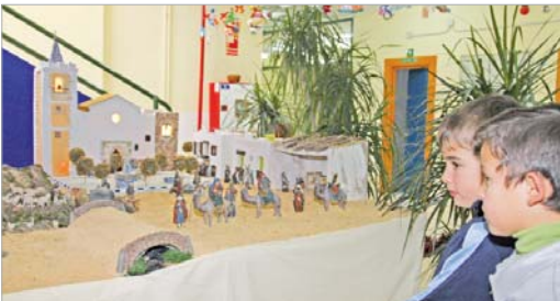
Nacimiento del Colegio Los Azahares.