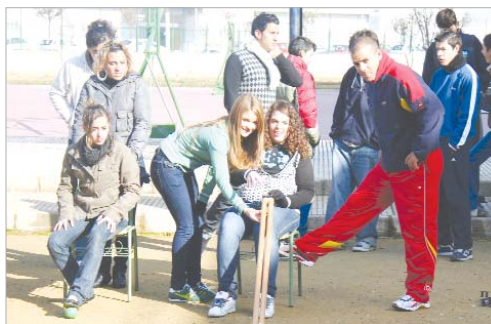
Los alumnos del Carmen Laffón conocieron deportes como la Boccia.

Deporte y Discapacidad son dos términos que van de la mano. Posiblemente porque el primero es una de las mejores herramientas para integrar a las personas con discapacidad en la sociedad. Por ello existen unos Juegos Paralímpicos y un importante respaldo institucional y social a actividades que persiguen este fin. La Rinconada, desde todos sus estamentos, se ha caracterizado siempre por el trabajo en beneficio de este colectivo, con gran número de actividades, instalaciones y terapias de trabajo que la sitúan a la vanguardia de la provincia. Y el deporte siempre ha sido un vehículo preferente para llevarlo a cabo. De hecho, en la localidad se han forjado grandes campeones Paralímpicos como Juani Lebrero, Jesús López Fariñas o Álvaro Valera y, fruto del trabajo que se viene realizando, no sería de extrañar que surgieran muchos más. Con esta finalidad, la de integrar a las personas con discapacidad a través del deporte, nacieron en el Instituto Carmen