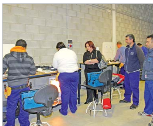
La delegada de Desarrollo Económico conociendo a los alumnos.

de trabajo. De hecho, con el curso de 'Instalador de Placas Solares' se pretende ahondar en un nuevo yacimiento de empleo, ya que es una profesión que en estos momentos está generando muchas expectativas laborales y absorberá buena parte de las demandas del mercado. En cuanto al de Electricista, ya se ha impartido en anteriores ediciones y siempre ha tenido muy buenos resultados.