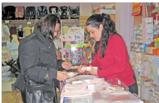
A la tienda acude gente de dentro y fuera de la localidad.

empredora rinconera le gustaría ampliar el negocio y, por supuesto, seguir ofreciendo a las mamás soluciones para sus bebés.