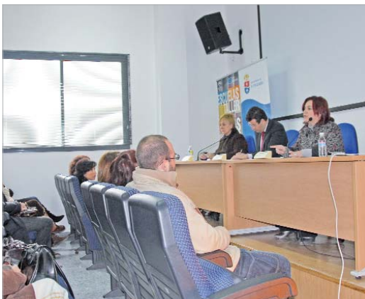
El alcalde, y las delegadas de Desarrollo Económico y Bienestar Social en la inauguración.

teóricas el 25 por ciento del tiempo y el resto del taller lo dedicarán a realizar prácticas profesionales en algunas de las dependencias municipales, donde podrán iniciar