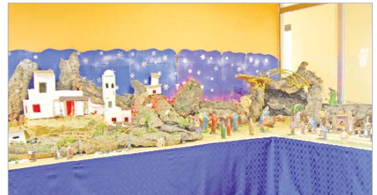
Nacimiento del Centro Sociosanitario de San José.