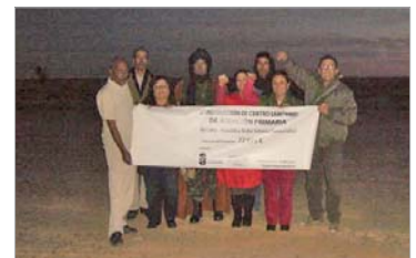
El grupo de 18 personas que acudieron a la vista de los campamentos.

Posteriormente, se desplazaron a los terrenos liberados de Bin-Lehlu, donde colocaron la primera piedra