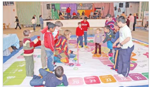
Los niños disfrutaron del juego Africate.