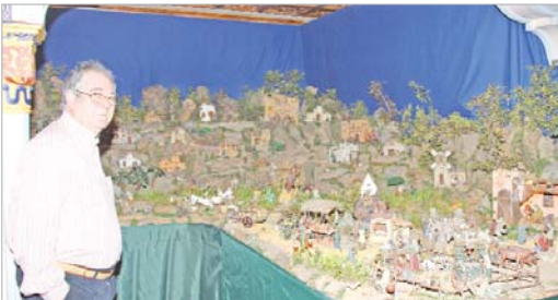
Francisco Zambrano ha recogido todas las escenas del pueblo de Belén.