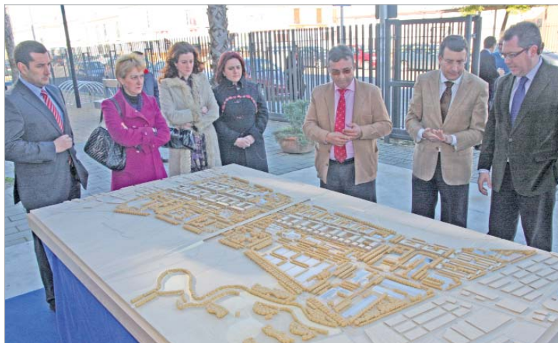
El alcalde y su Equipo de Gobierno mostrando la maqueta de cómo quedará La Unión al consejero de Vivienda.

Rinconada las que se desarrollen a partir de mediados del próximo año, toda vez que EPSA licite y adjudique la urbanización, unos trabajos presupuestados en unos 24 millones de euros que dejarán expeditos los suelos para la instalación de importantes equipamientos metropolitanos y 890 viviendas. De ellas, 650 tendrán protección pública y será la sociedad municipal, quien cuenta con