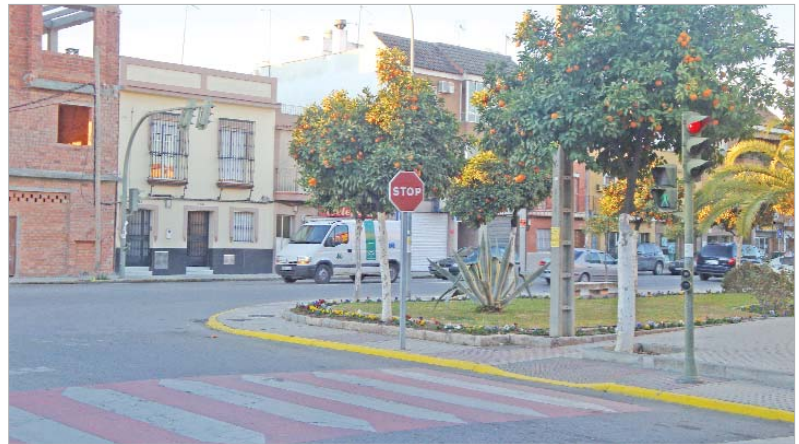
Uno de los semáforos que se integrarán en la red de bajo consumo.

Los cambios en el alumbrado público terminarán de hacerse durante el primer semestre de 2009, por lo que para el verano todo el municipio estará totalmen-