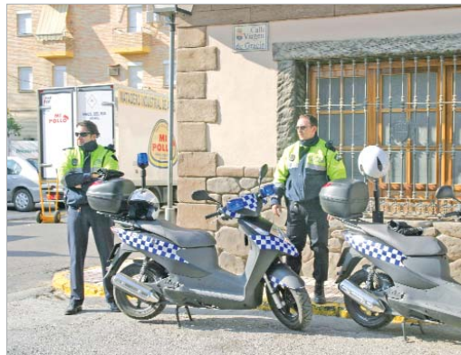
Una patrulla de la policía local trabajando en La Rinconada.

La Guardia Civil, por su parte, duplicará los controles de velocidad y de alcoholemia tanto en la entrada a La Rinconada como dentro de la localidad en los puntos más conflictivos. Para Ramón Gil, "es muy importante que se lleven a cabo estos controles debido a que ésta es una fecha en la que se coge el coche más de la cuenta y queremos evi-