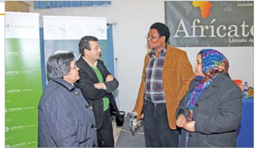
La delegada de Cooperación y el alcalde, antes de comenzar las jornadas.

El domingo se centró en la parte más lúdica y activista para llegar a la sensibilización de la población con stands de ONG y talleres diversos que acercaron la cultura del continente.