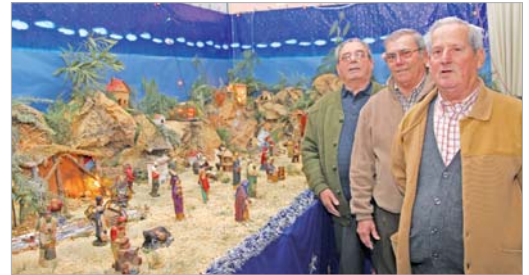
Belén del Hogar del Pensionista, Pablo Picasso.

La gran novedad de la Navidad rinconera será el Circuito de Belenes que por primera vez se ha puesto en marcha en el municipio. En total han participado 30 personas, entre las que se incluyen asociaciones como AMAE, colegios e incluso hermandades como la de La Resurrección. En la revista se especifican los domicilios en los que se pueden visitar los Nacimientos, que participan además en un concurso cuyo ganador se conocerá cuando terminen las fiestas. Algunos Belenes se caracterizan por su tamaño, otros por el material con el que están hechos y otros son auténticas estampas del pueblo de Belén.