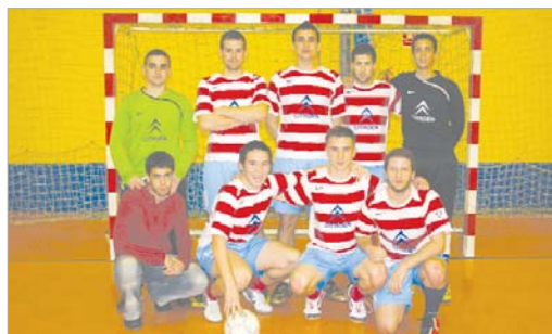
Los Paketes comenzaron goleando, pero se han ido desinflando.