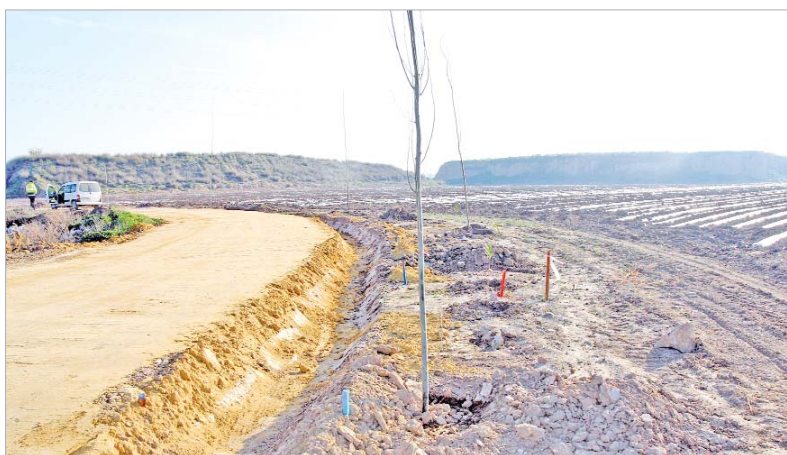
Zona en la que están comenzando las actuaciones del anillo verde.