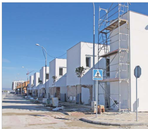
Las obras en las unifamiliares de Secadero ya están finalizando.

Tras esta promoción se entregará la de los 64 pisos de Lomas del Charco cuyas obras están también finalizando. Estas VPO están for-