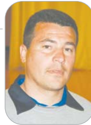
Puchero Tres Calles

El cancerbero rinconero, que se incorporó al equipo tras la baja de Ricardo y que el año pasado jugó en el San Juan, se estrenó en la competición doméstica frente al Albaída, en un choque en el que los blanquiazules acabaron perdiendo.