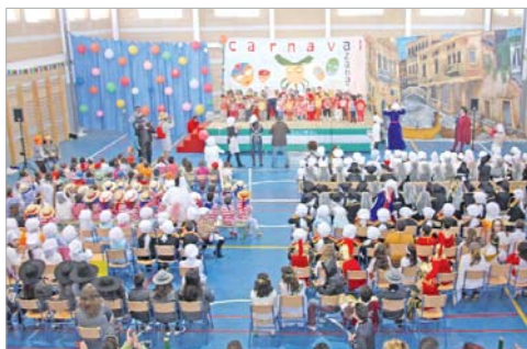
Los alumnos del colegio Los Azahares fueron actuando en el escenario.

En esta edición el colegio quiso hacer un homenaje al Carnaval de Venecia y toda la decoración giraba en torno a este motivo. El objetivo de esta fiesta es, según el director del centro, Carlos Donado, "reivindicar la tradición de las chirigotas y que no queden en el olvido entre los más pequeños". Así, bajo los gritos animados de "esto es Carnaval" todos fueron testigos de una jornada inolvidable que el año que viene, no lo dudan, volverá a repetirse.