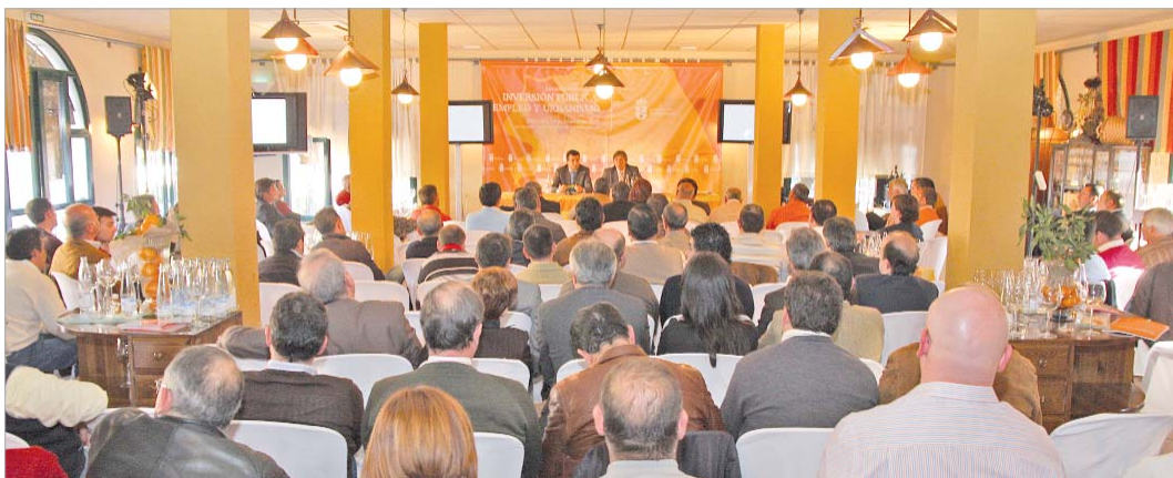
El salón principal del Restaurante Cortijo de Torrepevas, sirvió como copada sala de conferencias.