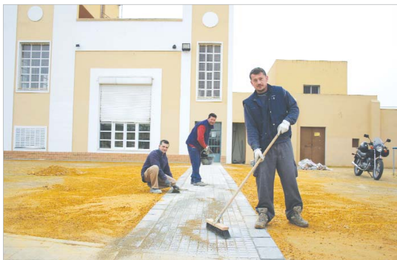
Imagen de la fachada del edificio que alberga Radio Rinconada en plenas obras de acondicionamiento y mejora.