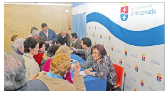
El alcalde se reunió con los vecinos del barrio de La Paz.

gro que hasta el momento supone la salida a la carretera desde la calle Alberto Lista. La barriada La Paz es una de las que más tradición tienen en el municipio y por ello, el Gobierno local no quiere eliminar ni un sólo servicio básico de la zona. De hecho, una vez que la sede de la Policía Local se traslade a la nueva Central Mixta de Seguridad, las instalaciones donde hasta el momento se ubicaba la jefatura pasarán a ser el Centro de la Mujer.