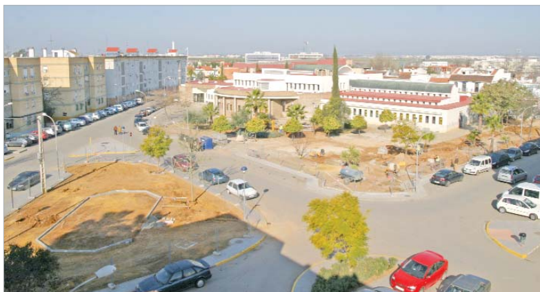
Este lugar quedará completamente acondicionado antes de la llegada del verano.

Los vecinos podrán disfrutar de esta zona totalmente adaptada y renovada antes del verano.