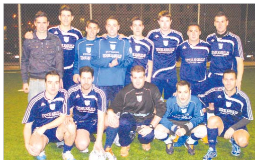
El Chiquitistán marcha en cabeza de la máxima categoría.

Balompédica Cañamera y Tres Calles C que han cedido un empate en sus tres compromisos. En la zona de descenso a Tercera se hallan Paco Team, Bar Corona y Santa Cruz, que no han sumado ni un solo punto. Por último, en Tercera, tres equipos cuentan sus compromisos por victorias tras las tres primeras jornadas, como son Vega Solar, Pinturas Lara e Hijos y Los Ozanapios, mientras Orvis B, La Herradura Veteranos, Kaos E.S. y Rayo Gambirinos, que aún no han puntuado, cierran la clasificación de la categoría.