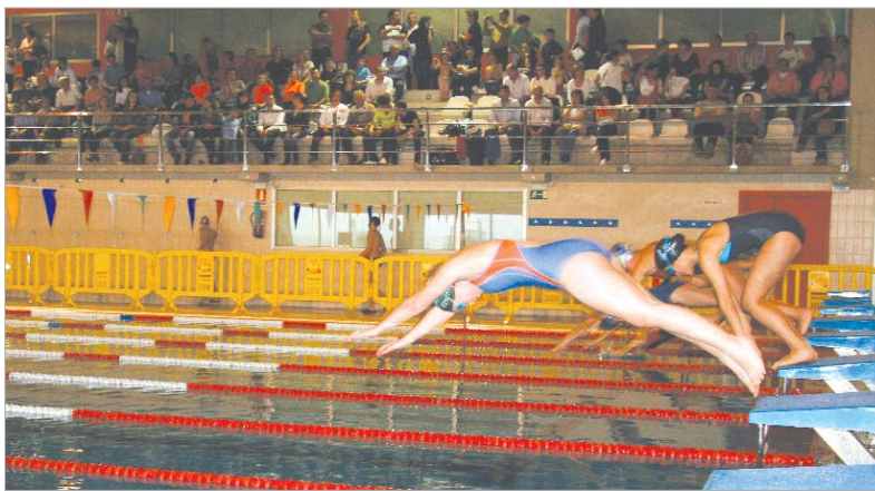
El Circuito Provincial de Invierno de Natación gozó de un amplio respaldo por parte del público rinconero.

Durante la jornada, el trasiego de autobuses que llegaba y salía de la actual sede del Patronato de Deportes dejaba perfectamente claro el poder de convocatoria y el respaldo que tenían las pruebas, que concentraban a equipos de más de 20 municipios sevillanos. La participación local, por su parte, se elevaba a más de 60 personas, que pudieron medir su