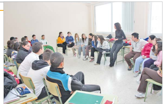
Los alumnos del IES San José asisten a una clase de habilidades sociales.

Las sesiones, que constan de una hora cada una, se imparten en los distintos niveles de los cursos de Secundaria hasta el mes de junio.