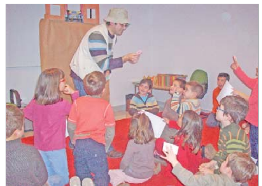
En la sala de San José los niños se van a casa con un minicuento.

participantes reciben un regalo en forma de minicuento, adivinanza o trabalenguas para que practiquen en casa.