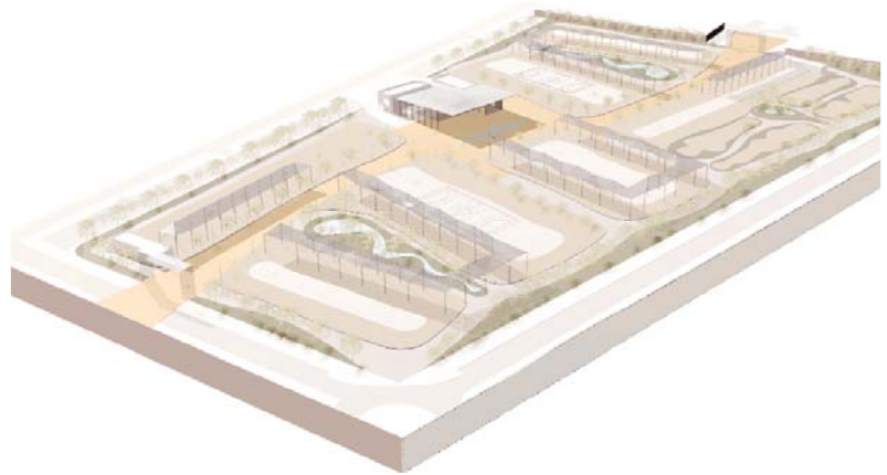
El recinto funcionará como un gran parque que podrá acoger eventos deportivos, culturales y de ocio durante el resto del año.

Una vez el proyecto se haya unificado, el arquitecto tendrá un plazo de redacción de seis meses para entregar el definitivo.