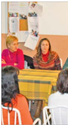
Mujeres en una charla el año pasado.

de marzo con 'Apuntes para una copla', un recital poético basado