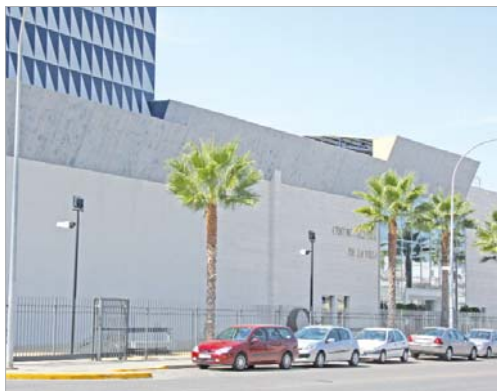
En junio acogerá el I Congreso Internacional, Arqueológica 2.0

EL Centro Cultural de la Villa congregó, hace unos días, a la comunidad de profesionales que trabaja en proyectos de investigación en el campo de la Arqueología Virtual.