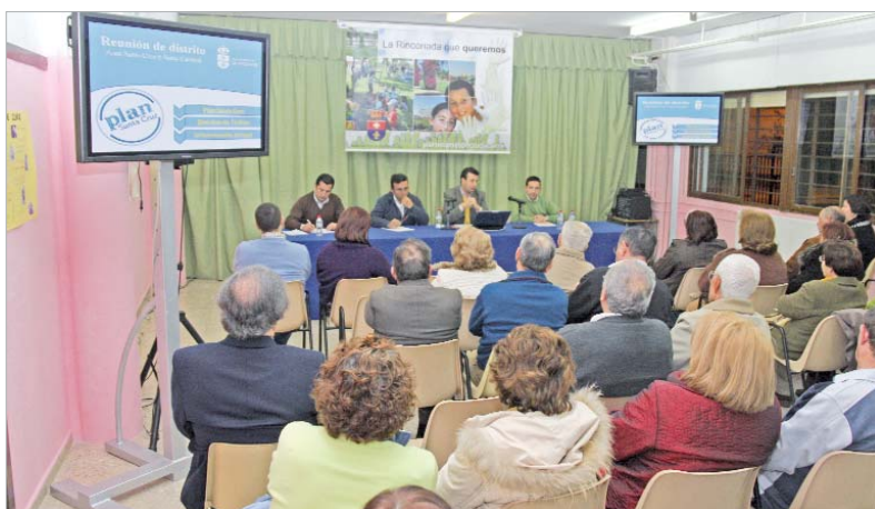
El alcalde y parte del Equipo de Gobierno, durante su reunión con los vecinos.

El Equipo de Gobierno se ha reunido con los vecinos de la zona para darles a conocer el proyecto, fruto del consenso y la aportación de los que viven en la zona