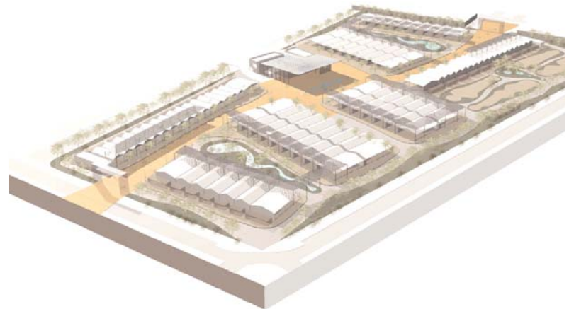
Imagen virtual del Real en la semana de la feria.