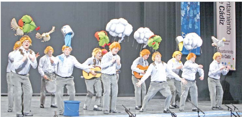
La agrupación durante su actuación en el Gran Teatro Falla.