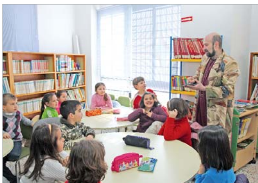
El colegio Los Azahares participa en el taller de animación lectora.

Más de 300 niños y niñas están inscritos en el programa municipal de fomento a la lectura que ofrecen las bibliotecas. Los lunes la actividad se imparte en La Rinconada y los martes y viernes en San José