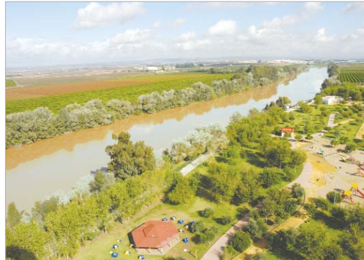
Imagen del actual Parque del Majuelo.

El primero de los talleres que se presentó en Pleno fue el de 'La Rinconada sostenible y verde', que tendrá capacidad para 36 alumnos. Las especialidades que se impartirán serán las de albañilería, electri-