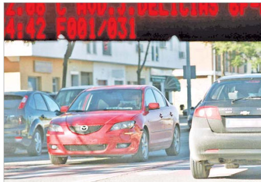
Este vehículo fue multado con 200 euros por conducción temeraria.

Esta iniciativa es, a juicio del edil de Seguridad Ciudadana, "la mejor solución para evitar el exceso de velocidad, ya que la instalación de badenes es incómoda para el resto de vecinos y más costosa".