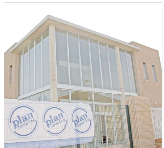
La guardería Santa Cruz entrará en funcionamiento el próximo curso.

Este centro se suma a los siete existentes (dos públicos y cinco concertados) que darán servicio a un total de 680 pequeños del municipio.