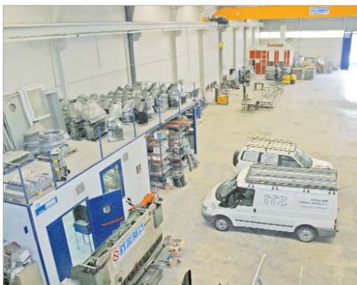
La nave en la que trabajan está ubicada en el Cañamo 2.

negocio es que realizan un trabajo integral, pues previamente a la instalación de estas construcciones metálicas diseñan un proyecto completo con un grupo cualificado de ingenieros y arquitectos en los que valoran las necesidades del cliente. Posteriormente le ofrecen