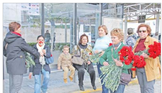
Las Asociaciones de Mujeres repartieron claveles por La Rinconada.