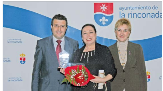
La bailaora Cristina Hoyos fue la invitada de honor.

En 1990 comenzó a recibir clases en el Centro de Adultos y fue allí donde descubrió su amor por la poesía. Ahora está haciendo una recopilación de todos sus poemas con la intención de editarlos.