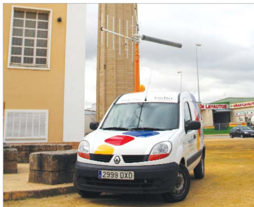
El mástil llega a alcanzar una altura total de 11 metros.