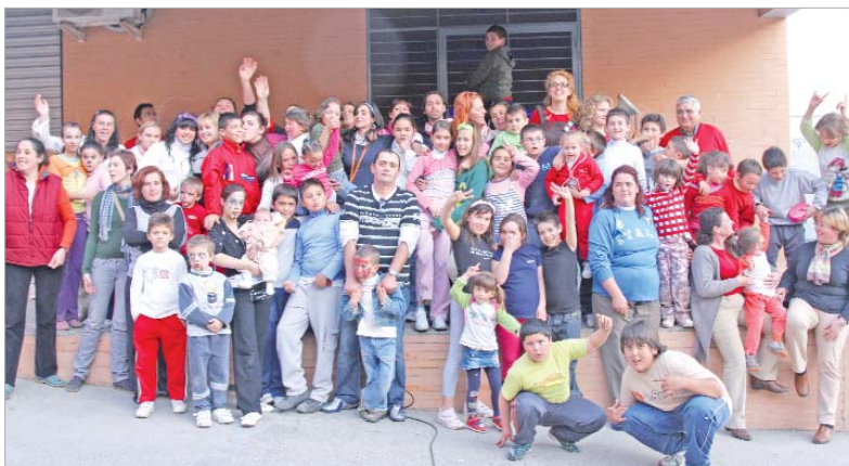
Los vecinos de Rinconada S.XXI junto con los miembros de la Asociación La Caracola y ACAT durante la tarde.

van a cabo talleres de apoyo escolar, de manualidades e incluso hay uno de percusión. Durante la tarde, los niños de la zona disfrutaron de música, una merienda y pudieron visionar un vídeo sobre su propio barrio y mostrárselo a los asistentes. Los vecinos pudieron, de esta forma, darse a conocer y ser escuchados por los asistentes.