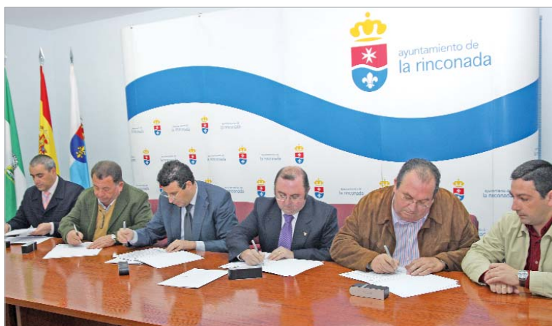
El alcalde, y el delegado de Festejos, con los hermanos mayores.

En total, el Ayuntamiento ha concedido a cada Hermandad 3.000 euros, una cifra que, a juicio del primer edil "servirá para res-