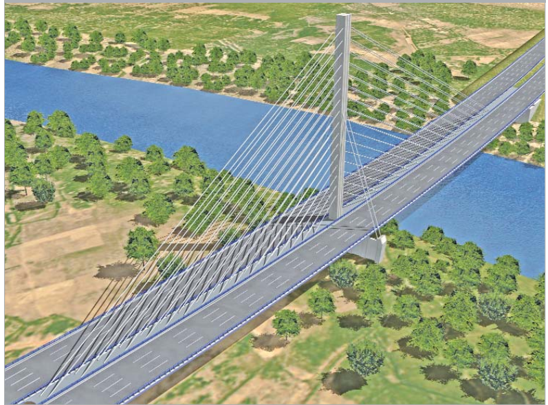
Recreación virtual del diseño del puente de la SE40 que unirá La Algaba con La Rinconada.