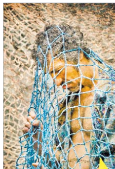
Está dirigida por Julio Fraga.

llega al Centro Cultural de La Villa el próximo 25 de marzo a las 21.00 horas.