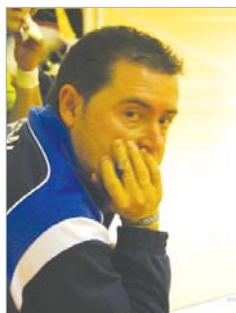
Colegui, durante un encuentro.

Por citar a algunos, el Alcalá Deportivo, nuestro último vencedor, el Futuro Carmonense, que lleva arriba toda la temporada, y el San Francisco de