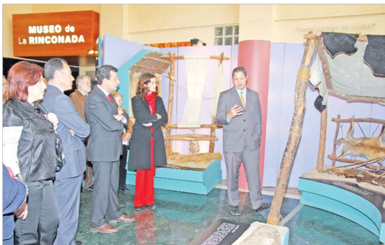
Tras la inauguración los asistentes realizaron una visita guiada por las distintas escenas de la muestra.

El Centro Cultural de La Villa acoge hasta el 15 de marzo la exposición 'Los Millares. Una civilización Milenaria'. Mediante grandes dioramas el visitante conocerá cómo se organizaban y celebraban sus rituales funerarios