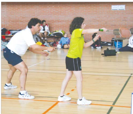
El segundo filial del Soderin no pudo superar en semifinales al Veleta.

Pero la cruz de la moneda la ofreció, sin duda, el segundo filial en la vuelta de las semifinales de la Liga Andaluza. El 5-2 adverso del choque de ida pesó en exceso a las