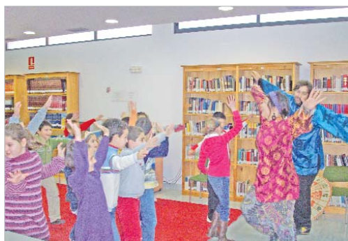
Los alumnos asisten a una sesión de Sushi Eco-fábulas.

'Un cuento de cine' forma parte de la programación que desarrolla la biblioteca de La Rinconada para fomentar la lectura entre los más pequeños.