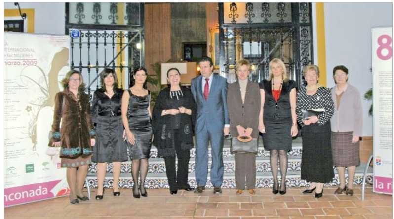
Las premiadas, el alcalde y la delegada de Igualdad, a la entrada de la cena en el Cortijo de Juan.