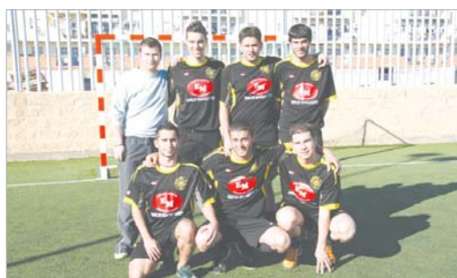
El Orvis Carnicería Magallanes es el único que aguanta el pulso al líder.