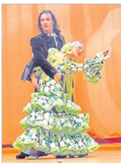
En el Concurso de Torremolinos

Según explica, todo comenzó con cuatro años, cuando su madre la apuntó a una academia para