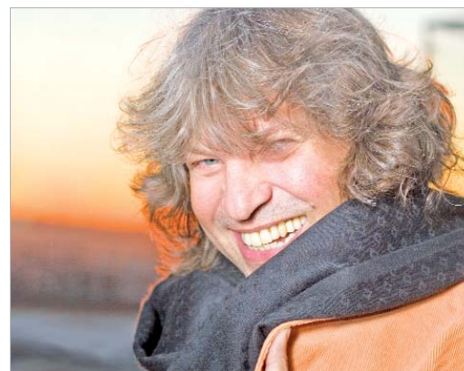
José Mercé visita por segunda vez la localidad.

una imagen renovada del arte flamenco que se complementó en 2000 con 'Aire' y con 'Lío' en 2002.