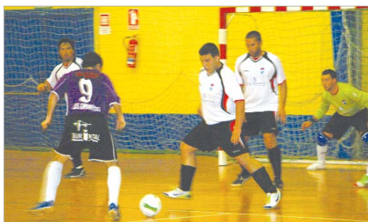
Chulo, una vez recuperado, quiere ser el gran fichaje para el final de temporada.