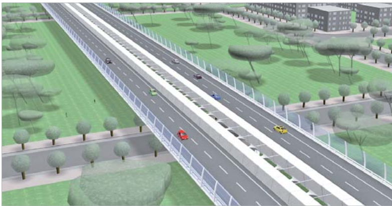
Imagen virtual del viaducto que atravesará La Unión.

El viaducto tendrá una dimensión de 820 metros bajo los que se extenderán 18 hectáreas de suelo verde