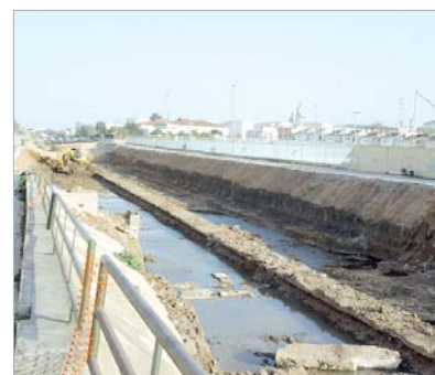
Las obras empezaron con el entubamiento de las aguas residuales.