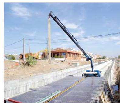
Fase en la que se construye el puente.