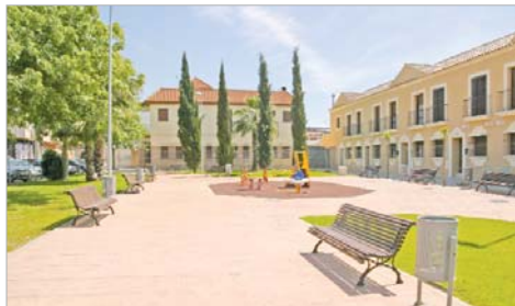
El Parque de Aragón ya ha estado abierto al público.