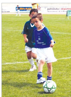
Los pequeños lo pasaron en grande.

El pasado fin de semana situó a La Rinconada en el epicentro de la actualidad sevillana respecto al tenis de mesa, ya que el pabellón Fernando Martín albergó el Campeonato Provincial, en el que se dieron cita algunos de los jugadores más destacados de este deporte, además de los conjuntos más importantes y reputados de esta disciplina. El club de Tenis de Mesa San José, a pesar de que no está realizando su mejor temporada, sigue siendo un referente provincial y su poder de convocatoria está fuera de toda duda, así como la capacidad organizativa del Patronato de Deportes, que también ha colaborado en el evento.