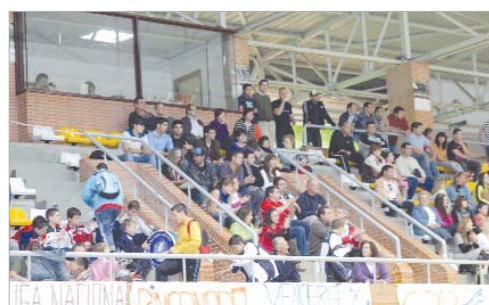
Las gradas del Fernando Martín registraron un aspecto maravilloso.

Ante la disputa de la Final del Campeonato de España de Bádminton en La Rinconada, la Radio se volcó promocionando el evento y animando a los oyentes a pasarse por el Fernando Martín para animar al Soderinsa. Además, el club había llevado a cabo multitud de actividades para promocionar el encuentro y, fruto de todo ese trabajo conjunto, en las gradas no cabía