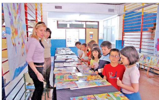
Los alumnos del Júpiter colocaron un mercadillo de libros.

del Júpiter y asistieron como público a las funciones que había preparado los estudiantes.