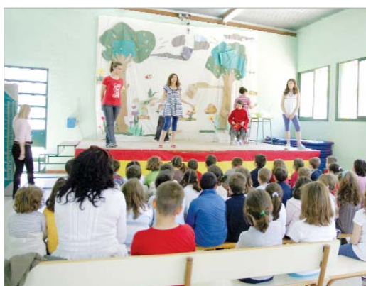
Representación teatral en el Júpiter con motivo del Día del Libro.

Con motivo de la celebración del Día del Libro, el Colegio Júpiter organizó una serie de actividades conmemorativas de la efeméride que no podían pasar por alto para toda la sociedad rinconera no vinculada de forma directa al centro. Por ello, para amplificar el trabajo