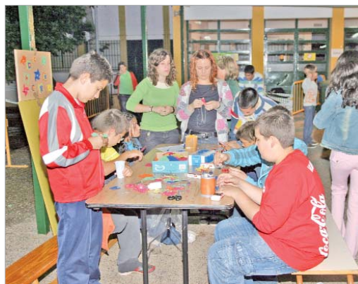
Taller de manualidades en el Club Diversia el año pasado.

Así pues, esta nueva etapa comenzará el fin de semana del 8 de mayo y finalizará el sábado 27 de junio. En este periodo de tiempo también se lleva a cabo el denominado Club Diversia. Esta iniciativa de ocio se dirige a los niños y niñas con edades comprendidas entre los 10 a los 13 años de edad. Como en ediciones