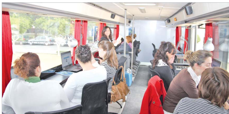
La monitora enseña cómo hacer el certificado digital.

dad de desplazarse, los procedimientos administrativos de las diferentes consejerías y organismos de la Junta de Andalucía. En este sentido, la monitora les proporcionó a las asistentes conocimientos suficientes para obtener y utilizar con soltura el certificado digital.