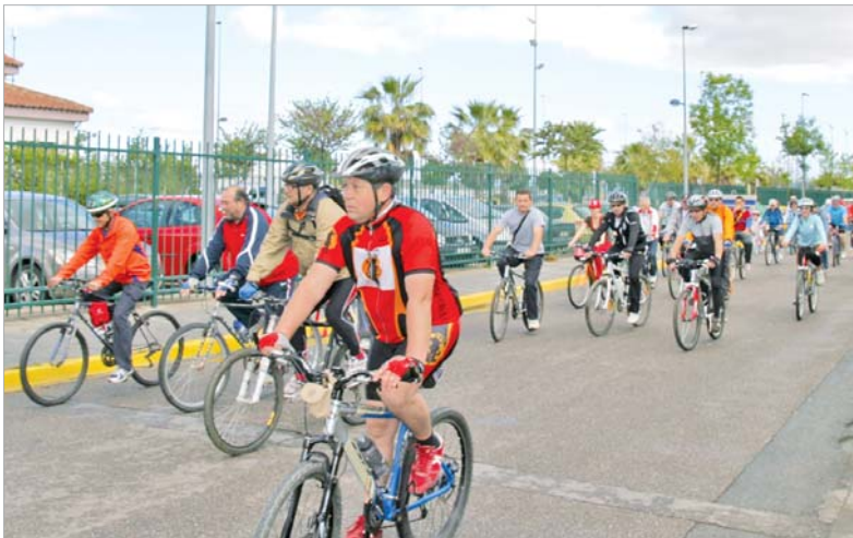
Ciclistas saliendo del parque '8 de marzo'.

En el parque se concentraron alrededor de 3.000 personas, que entre lemas y pancartas reivindicativas, pasaron una agradable tarde en la que también hubo juegos y música.