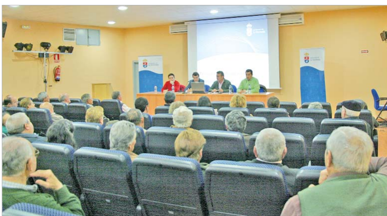
El alcalde y parte de la Corporación, reunidos con los vecinos.

ocasión, el Ayuntamiento se citó en la Peña Sevillista con los vecinos de la calle Teodora Ocaña, El Palmar, parte de la calle San José, los de la barriada Almonazar y las zonas aledañas.