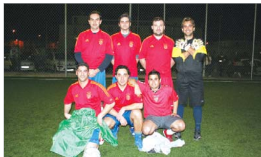
El Lu-Jo tendrá que luchar duro para quedarse otro año en Primera.