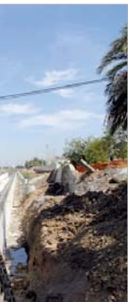
uyo el cajón hidráulico.