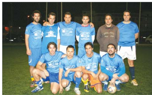
El Polunga está cuajando una gran campaña en su debut en Primera.

En Tercera, Los Ozanapios han tomado ventaja respecto a sus perseguidores y les bastará mantener las rentas obtenidas para lograr un ascenso que ya rozaron la pasada campaña.