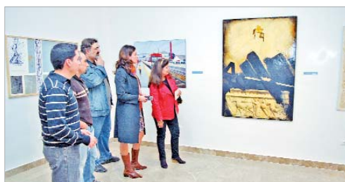
El jurado, momentos antes de efectuar su deliberación.