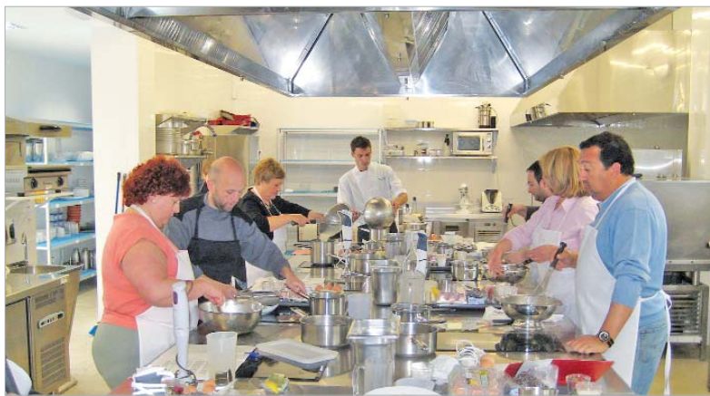
Los profesores atienden de manera individualizada las dudas y demandas de los alumnos.

En esta ocasión, ocho personas, la mayoría sin conocimientos previos en repostería, hicieron tres tartas, cada una para cuatro personas: Saint Honoré, brazo de gitano y San Marcos, que además se lleva-