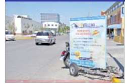
Remolque mal situado.