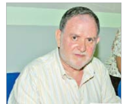
Iglesias fue el candidato.