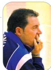
Colegui Tres Calles