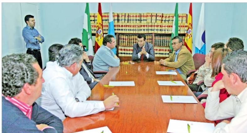
El alcalde y el delegado de Urbanismo durante el encuentro mantenido con las empresas que ejecutarán los fondos.

Concluido el proceso de adjudicación, el alcalde firmó los contratos que refuerzan la activación económica y la creación de empleo