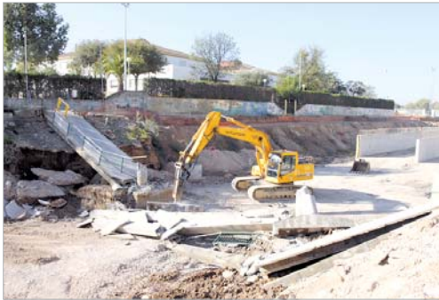
Demolición de la pasarela del colegio 'Maestro Antonio Rodríguez'

márgenes del arroyo, en forma de una vía con dos carriles -uno para cada sentido- con entre 70 y 100 aparcamientos. El proyecto contempla también la creación de una nueva calle que será la