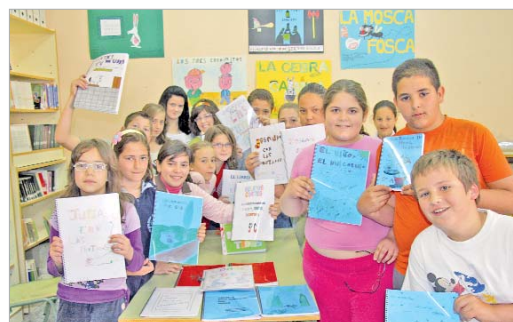
En el Guadalquivir escribieron relatos que mostraron en una exposición.

fomentar el hábito lector. Los mayores, además, contaron varios relatos a los más pequeños.