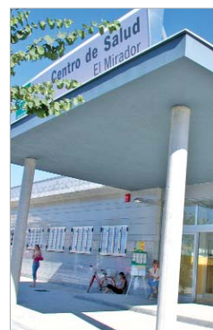
Ambulatorio El Mirador

Pruebas online. Las exploraciones viajan desde el ordenador del médico de familia hasta el del especialista a través de la Intranet corporativa del Servicio Andaluz de Salud (SAS). La aplicación más novedosa es el uso de la telemedicina en otorrinolaringología, para la cual la unidad ha adquirido 33