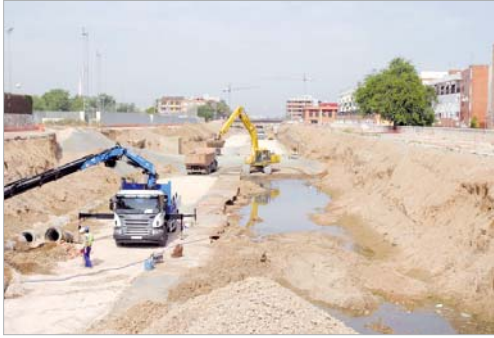
Más de 3.000 camiones han pasado durante este tiempo por el arroyo