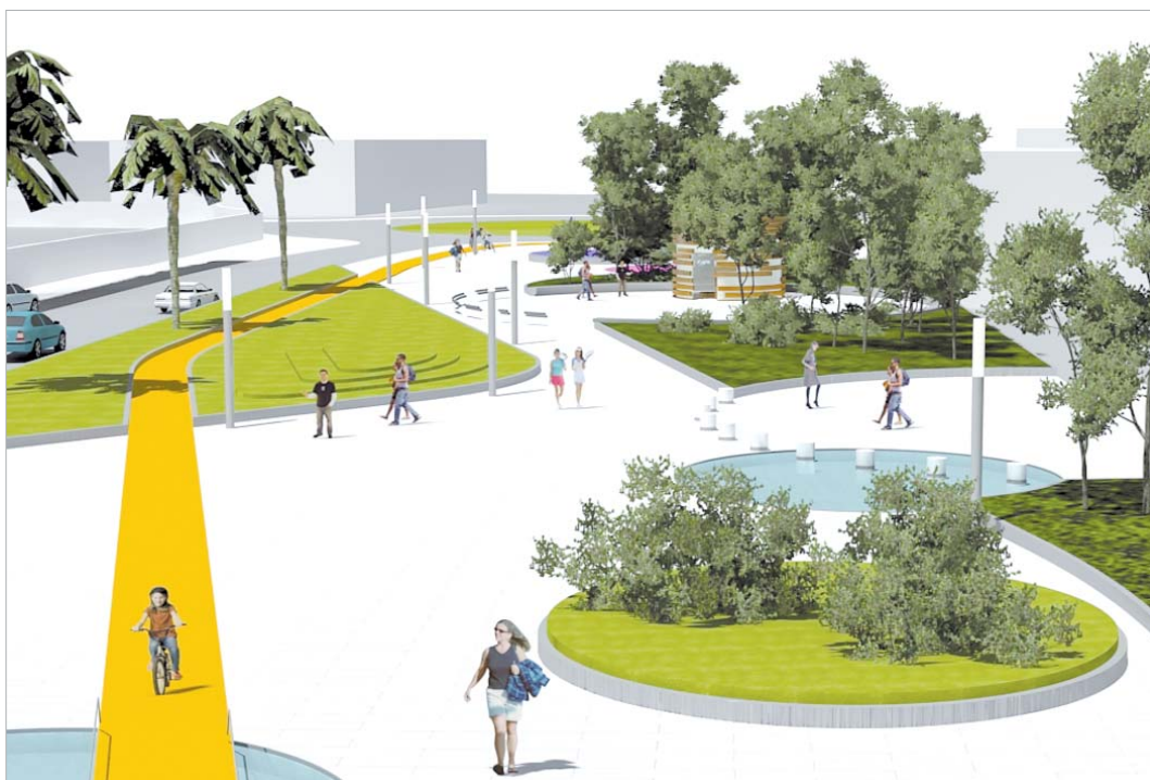
Infografía sobre el bulevar del arroyo urbanizado.

Ahora es el turno del segundo y último puente, el de la calle San José, todo un hito histórico que simboliza la liberación en el paso de un lado a otro del barrio y que estrangulaba envejeciendo la zona antigua