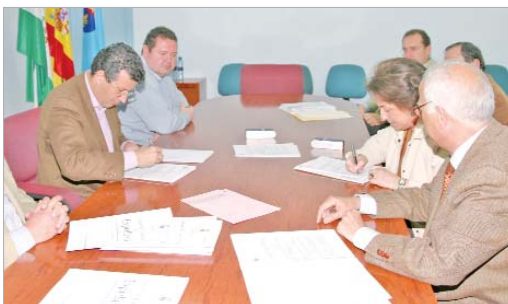
El alcalde durante la firma del convenio con Montana para adquirir el terreno.

tes al término municipal, necesarios para que se pueda llevar a cabo la ampliación en 12 hectáreas del parque metropolitano del Majuelo.