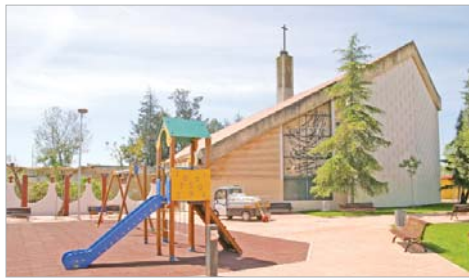
El entorno de la trasera de la Iglesia de Santa María ya tiene plaza.

El día 1 de mayo estarán abiertos al público el parque de Aragón, en la calle Andalucía, y el de la trasera de la Iglesia de Santa María, denominada plaza de 'Luchadores por la Libertad'. El objetivo de la remodelación ha sido recuperar ambos espacios con tanta tradición en el municipio como lugar de uso público, manteniendo la vegetación existente, en el caso del parque de Aragón.