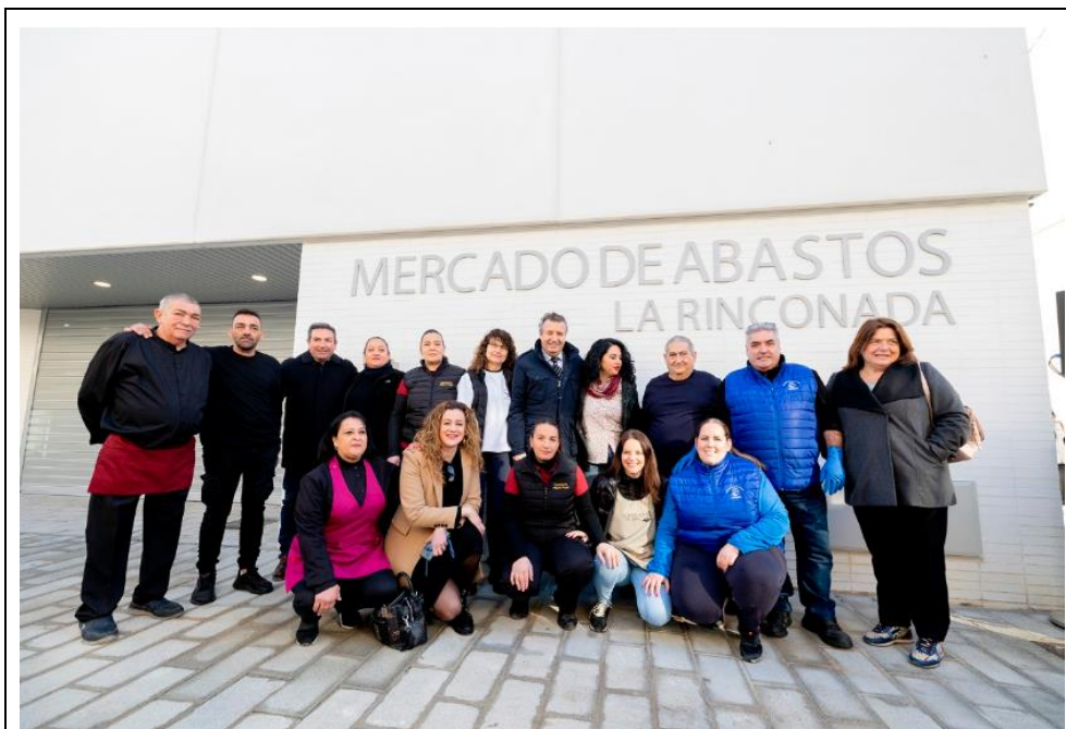
TRABAJADORAS Y TRABAJADORES DEL MERCADO Y AUTORIDADES LOCALES / DÍA INAUGURACIÓN

Gracias al mercado ha sido posible romper barreras de género, pues las mujeres de la zona se encontraban en situación de doble discriminación, ser mujer y además de zona en riesgo de exclusión social. Esta situación dificultaba muchísimo su acceso al mercado laboral, pero el mercado les ha dado una nueva oportunidad, una nueva ilusión, un trabajo.