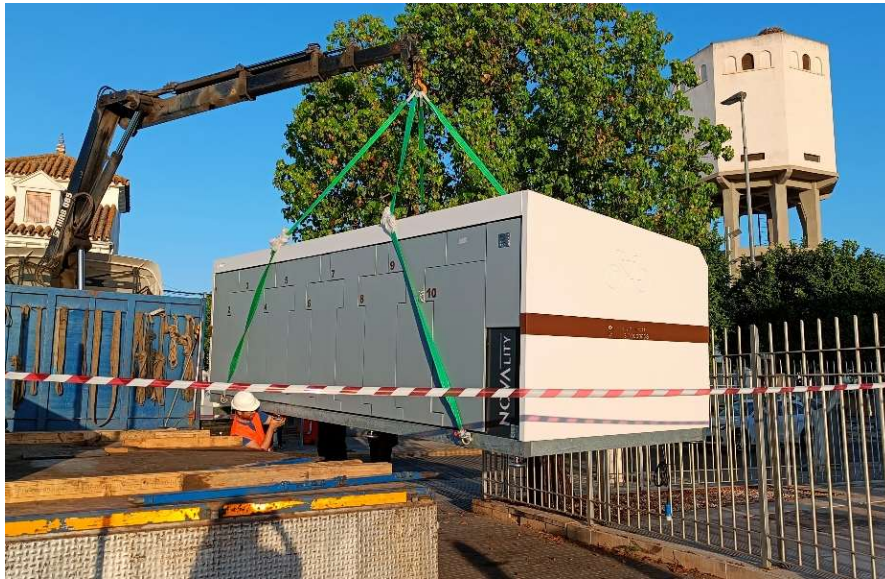
7. INSTALACIÓN DEL MÓDULO JUNTO AL AYUNTAMIENTO