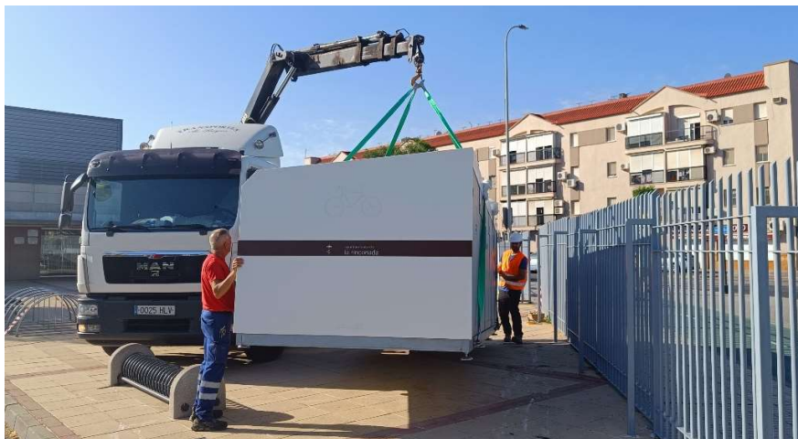
9. INSTALACIÓN DEL MÓDULO JUNTO A LA PISCINA CUBIETA