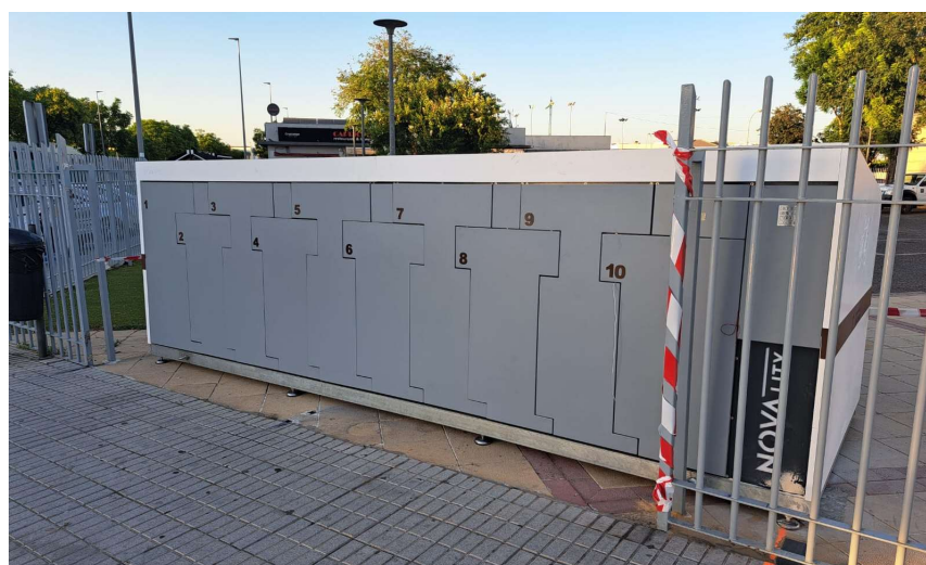
11. AJUSTE DEL MÓDULO A LA VALLA PREXISTENTE