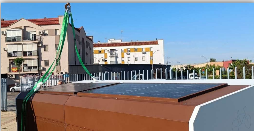
6. PLACAS FOTOVOLTÁICAS EN LA CUBIERTA DEL MÓDULO JUNTO A LA PISCINA CUBIERTA

El proyecto de instalación de estacionamientos inteligentes para bicicletas y vehículos de movilidad personal en La Rinconada tendrá un notable impacto ambiental positivo y contribuirá significativamente al ahorro energético. Cada módulo contará con paneles solares instalados en su cubierta, los cuales proporcionarán la energía necesaria para los puntos de carga, sistemas de apertura, iluminación y videovigilancia. Esta fuente de energía renovable no solo reduce la dependencia de la red eléctrica convencional, sino que también minimiza las emisiones de CO 2 , contribuyendo a la mitigación del cambio climático. Además, el diseño del sistema garantiza un consumo energético eficiente, inferior a 1W por dispositivo, optimizando el uso de los recursos y reduciendo el impacto ambiental. El cumplimiento con el principio DNSH asegura que el proyecto no causará daño significativo a los objetivos medioambientales, respaldando así una movilidad urbana más sostenible y ecológica.