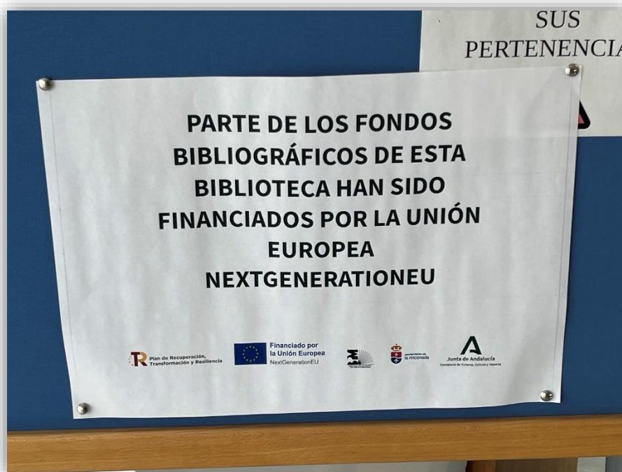
8. CARTEL COLOCADO EN LA BIBLIOTECA MUNICIPAL DE SAN JOSÉ DE LA RINCONADA